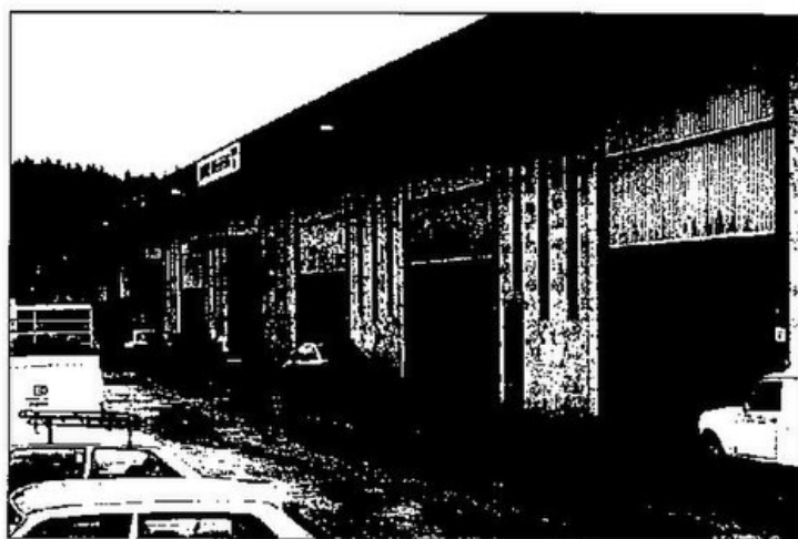
Enpresetarako eskualdeko gune berria Adunan

Lehenengo eta behin argi adierazten da eskualdean 27 udalerritako bakoitzak bere dinamika propioa duela, koordinatu gabea eta batzuetan elkarren aurkakoa. Hori dela eta, benetako batasun koordinatu gisa antolatzea da lehenengo helburua. Koordinazioa eta antolamendua ondoren go gaitan lortu behar litzateke: lurzorua, urbanizagarria ez den lurzorua, baliabide naturalak, nekazaritza eta baso lurzorua, hirigintza eta ingurugiro gestioa, eta oinarritzko azpiegiturak. Ildo honi jarraituz dago pentsatuta Aduna-Zizurkil aldean industri parke handi bat eraikitzea, behar bezala urbanizatua eta sarbide egokiak. Horretarako Nafarroako autobidearen loturarako sarbidea hobetzea, hala nola Adunaren lotura N-1rekin eta Nafarroako autobidearen sarbidea Sorabillatik funtsezkoak dira.