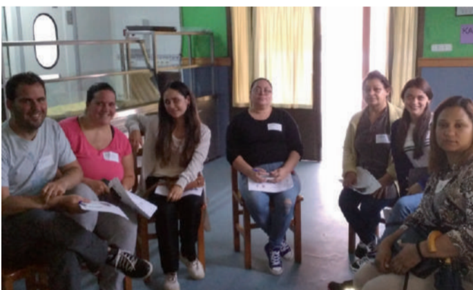
Andoaingen bizi dira ikastaroa jasotzen ari diren zortzi pertsonak.

Andoaingo Udala eta Banaiz Bagara elkarteak uztailearen 10etik 21era euskararen erabilera praktikoa lantzeko ikastaroa eskaintzen ari dira La Salle Berrozpe ikastetxean. Egutero bi orduz, zortzi pertsona bezeroarekiko hurreman euskaraz landu