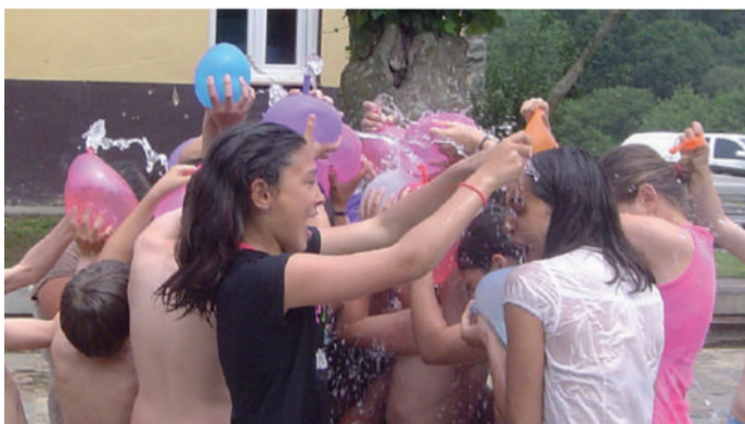
Ostegun honetan egitekoak dira ur jolasak.

Ekainaren 30erako iragarrita zeuden ur jolasak bertan behera geratu ziren, eguraldi kaskarra zela medio.