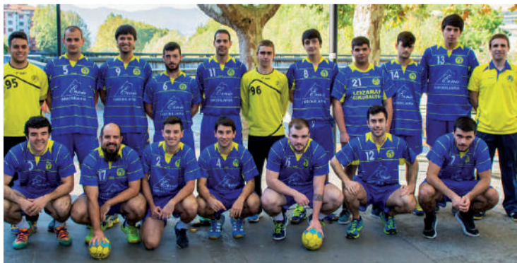
Leizaran Ernio Inmobiliaria taldea, aurreko denboraldiaren hasieran.

Hamahiru talde ditu Leizaranek gaur egun, nesken eta mutilen mailatan banatuta; guztira, 195 jokalarik. Gainera, hamalaugarrena osatzekotan dira hurrengo denboraldiari begira. Biziki zaintzen du eskubaloi Andoainen Leizaranek, eta Gipuzkoan bizpahiru talde baino