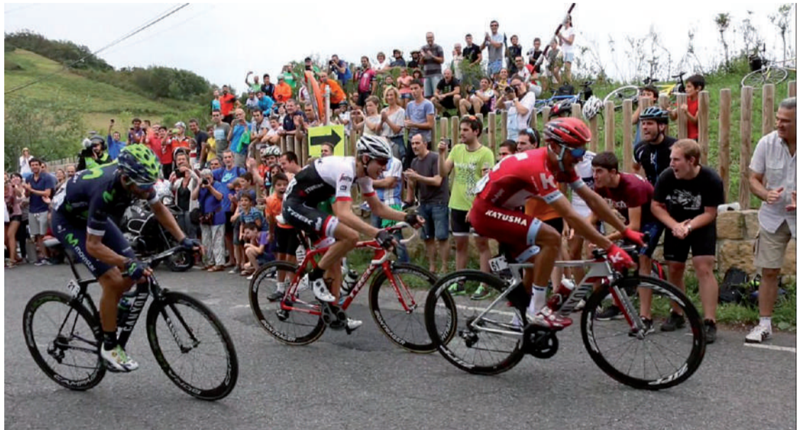
Iazko Klasikoaren irudia. Lehen postuan Purito Rodriguez eta hirugarren Valderde. Tartean irabazle izan zen Mollema.

Datorren uztailearen 29an, larunbatarekin, Donostiako Klasikoa txirrindularitza proba eskualdetik barrena igaroko da. Eta aurtengoan bereziki aipatu beharra dago, Andoaingo eta Urnietako herriguneak zeharkatuko dituelako.