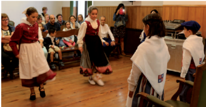
2015eko alkate txikien eguneko argazkia.

Sanmielei loturiko lehen albisteak sortzen ari dira, urruti samar diruditen arren. Urnietako Udalak jakinarazi duenez, izena eman