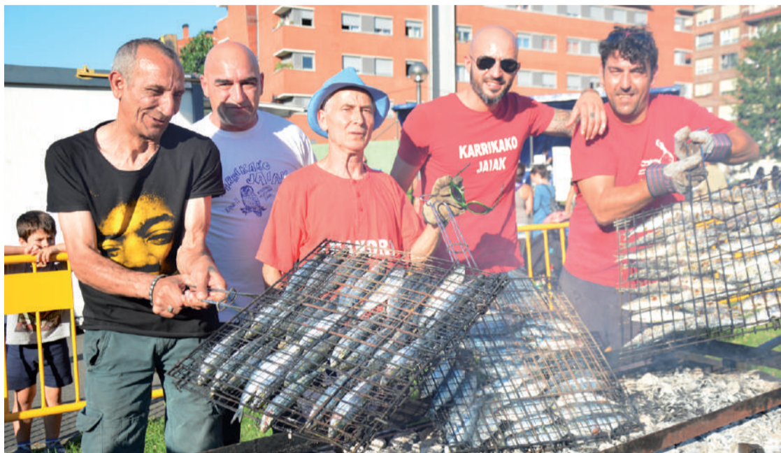
Karrikako jaien lehen egunean sardina jatea 20:30ean hasiko da, eta gauean rock kontzertua.