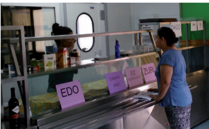
Egoera errealak lantzen dituzte ikastaroan, goizero bi orduz.

ahal izateko ikastaroa jasotzen ari dira. Zortzirak hegoamerikar jatorrikoak badira ere, Andoaingen bertan bizi dira. Uda ikastaroak egiteko sasoi aproposa izaten da. Herrikide hauek euskara sakontzeko aukera egin dute, hamabostaldi honetan.