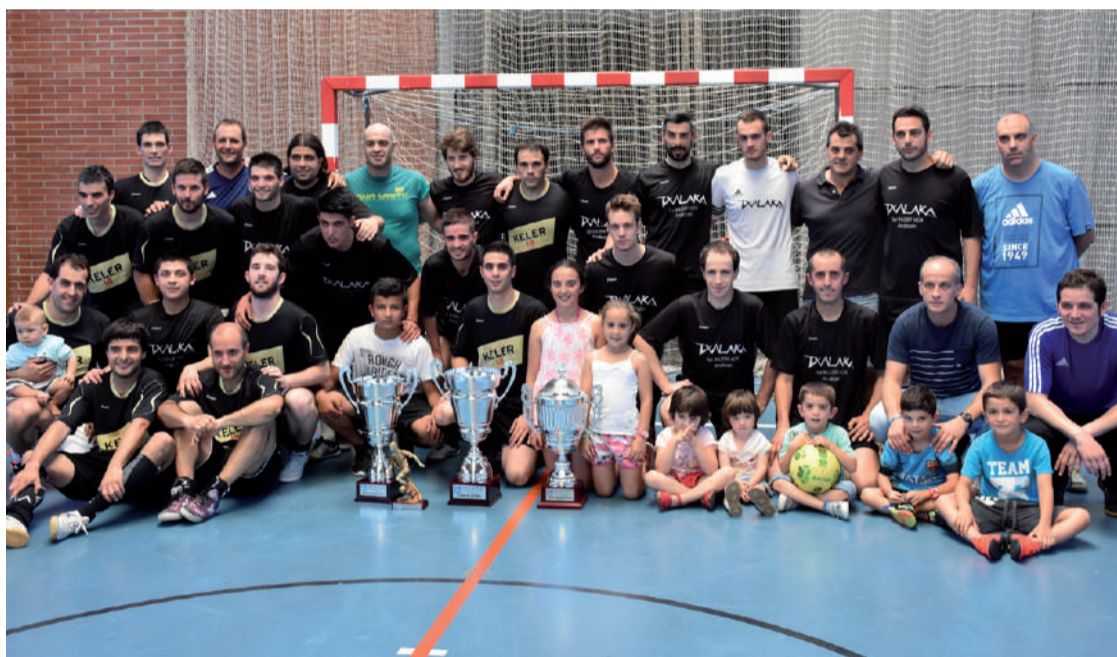
Keler eta Txalaka taldeko kideek ekarrekin atera zuten taldeko argazkia, sari banaketa ekitaldiaren ostean.

Ikasturtean zehar Andoaingo Areto futbol txapelketan hamalau talde aritu dira lehian, A eta B taldeetan banatuta. Final handia joan zen igande eguerdian jokatu zen, eta partida estuan Keler taldea 2-1 nagusitu zitzaion Txalaka jateixari. Maila bertsuan aritu ziren bi taldeak, eta Keler taldekoek Txalakak defentsan egindako akatsa ondo baino hobeto baliatu zuten bigarren gola sartzeko. Azken segunduetan tentsioa nabaritu zen, irabazleek partida ahalik eta azkarren amaitzea nahi zutelako. Keler taldeko kideak beterranoak dira txapelketa honetan, Txalakak ordea etorkizun oparoa dauka.