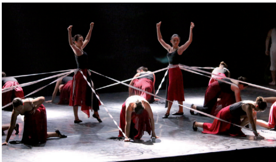
‘Xingola Mingola’ dantza saioa.