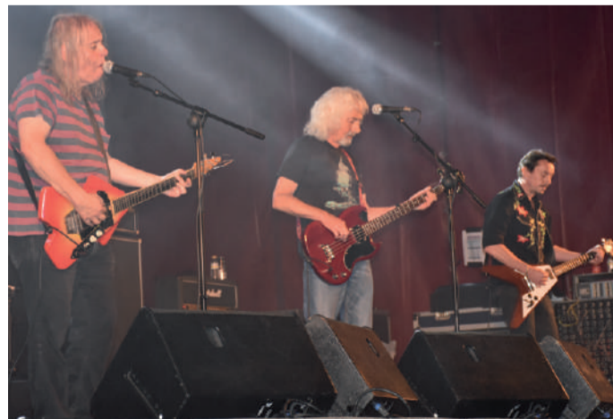
The Bevis Frond Londoneko laukotea Andoingo Rock jaialdian.