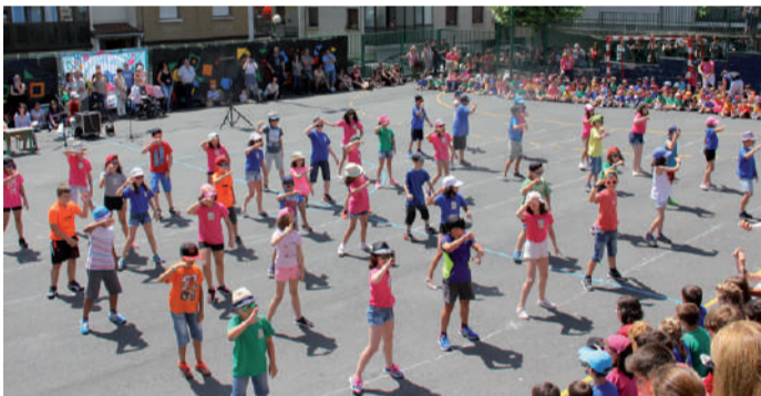
Ikasleek dantza saio ezberdinak eskaini zituzten.