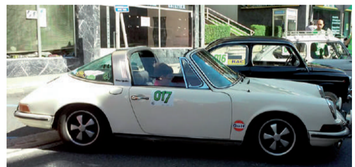
Martinezdarren Porsche 911 T Targa ibilgailua hirugarren sailkatu zen.

Bestalde, saskiaren zozketa antolatu zuten eta irabazlea 420. zenbakia izan da. Zortedunak antolatzaileekin jarri behar du harremanetan.