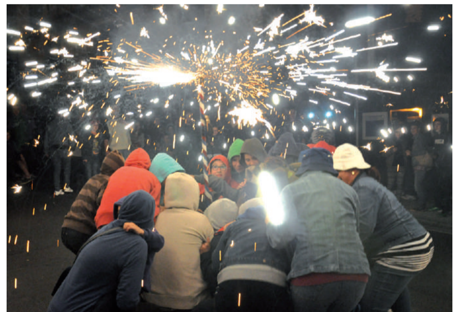
Argazkian ikusten denez, ezinbestekoa da burua eta gorputza estalita eramatea.

JAIEN AMAIERAKO CORREFOC IKUSKIZUNEAN MURGILDU NAHI DUENAK SEGURTASUN NEURRIAK HARTU BEHARKO DITU.