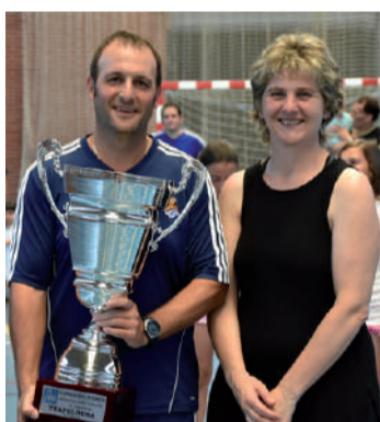
Keler taldea, txapeldunen koparekin.

Finalaren argazkiak eta jokaldi onenen bideoa ikusgai dago aiurri.eus webgunean.