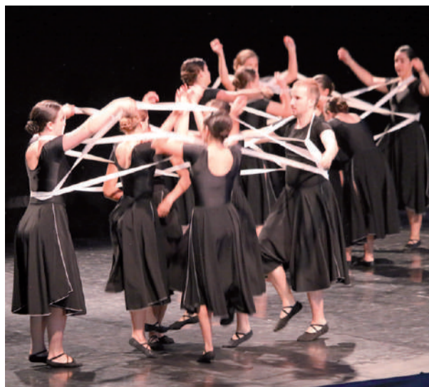
‘Fandangomak’ dantza saioa, joan zen larunbateko emanaldian.