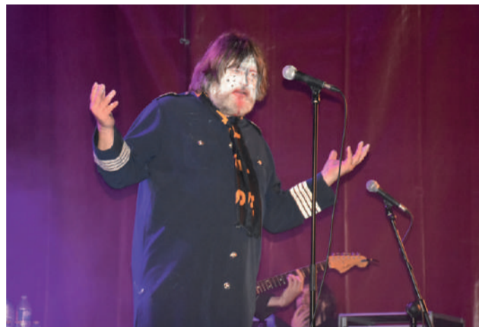
Ebbot Lundberg kantari suediarra.

berg. Jende ugari bildu zen Nafarroa Plazan, bertakoak ez ezik kanpotik ere hurbildutako musika zaleak denak. Egundoko giroa egin zuen kontzertuak iraun zuen arratsalde eta gau osoan zehar, aire zabalean musikarekin gozatzeko modukoa.