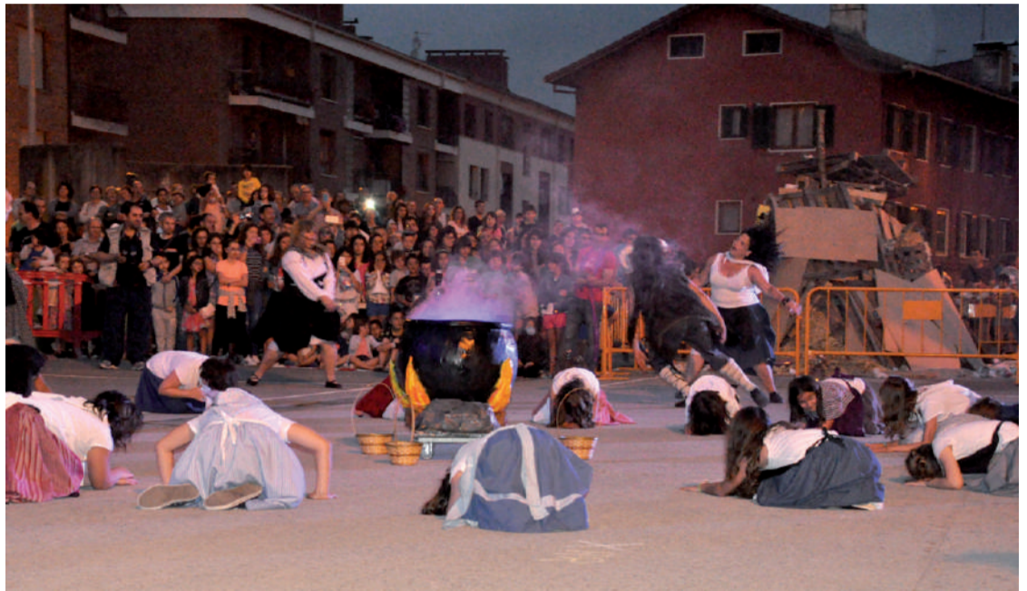
Akelarrea Plazido Muxikan, San Juan plazan abiatutako kalejirari jarraipena emanez. Gau ikusgarria izaten da Urnietakoa.

Azken urteetako tradizioari eutsi eta urnietarrek San Juan bezperako suarekin batera Akelarrea ospatuko dute Plazido Muxika plazan. Gaueko 21:00etan hasiko da ospakizu-