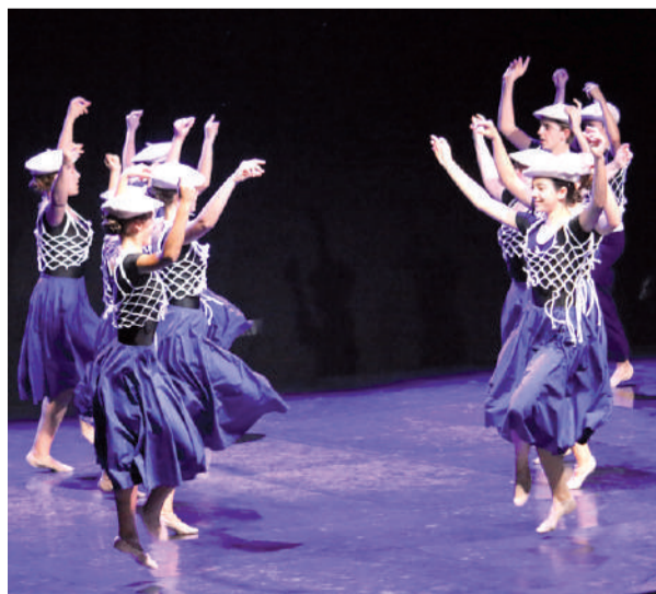
‘Fandangoarekin jolasean’ saioa.