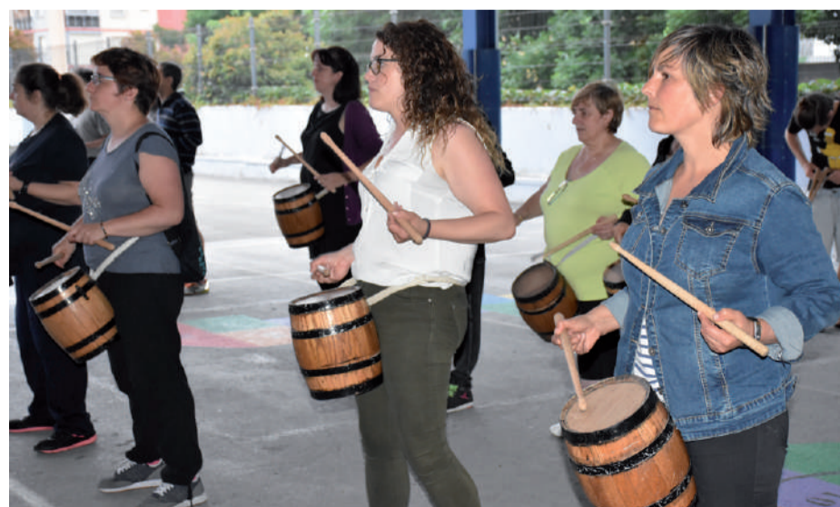
San Juan egunean, ekainaren 24an, Andoaindarraren elkarateko danborradaren txanda iritsiko da.