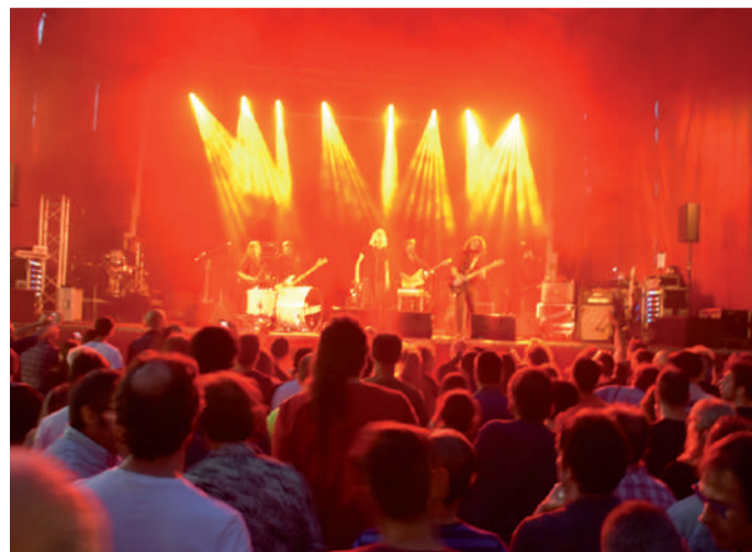
Ezinbesteko hitzordu bilakatu da Andoingo Rock Jaialdia musikazaleentzat.

Musika proposamen ezberdinak entzuteko eta ezagutzeko aukera paregabea eskaintzen du Andoingo Rock Jaialdiak. Aurtengoan sei talde igo ziren oholtzara: Belarmiñak, Peralta, Penny Ikinger, The Limiñanas, Belvis Frond eta Ebbot Lund-