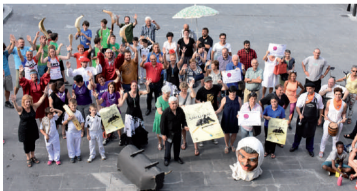
Udal arduradunek eta herri eragileek taldeko argazkia atera zuten astelehenean.