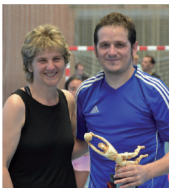
Irazusta, finaleko atezainik onena.