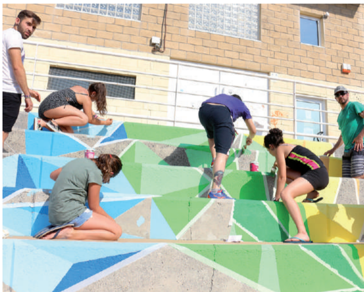
Murala margotu zuten astearte arratsaldean, Plazido Muxika plazan.

Ekainaren 28an lesbiana, gay, transexual eta bisexualen nazioarteko eguna ospatzen da eta aurtengoan sentsibilizazio jardunaldi ezberdinak antolatu dituzte Andoainen eta Urnietan. Urnietan aste honetan mural baten margoketa egin dute Plazido Muxika plazan, sexu orientazioarekiko errespetua eskatuz. Muxu Gozo elkarteak, bestalde, aniztasun