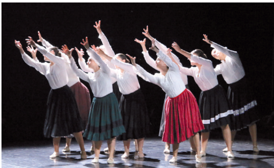
‘Oi Ama’ dantza saioa.

Profesionalen moduko azpiegitura teknikoarekin eta mila ikusleren aurrean Egape dantza taldeak talde bati ez baizik eta konpainia bati dagokion mailako ikuskizuna eskaini zuen. Zorrotz, zuzen eta sendo agertu ziren ikusleen aurrean, den-denak bereganatzeraino. Euren buruari ipinitako erronka ez zen batere makala, arriskua hor zegoen, eta halere bikain irten ziren ataka estu horretatik. Jaialdiaren hasieran egin zuten adierazpenean atzera begira jarri ziren, euren xedea agertzearekin batera: “Egape dantza elkartearen jarduna 2007an abiatu zen. Lehen hamarkada osatu dugula ospatzeko ikuskizun berezia prestatu dugu. Aire zabalera atera nahi izan dugu ahalik eta urnietar gehienengana iritsi ahal izateko”.