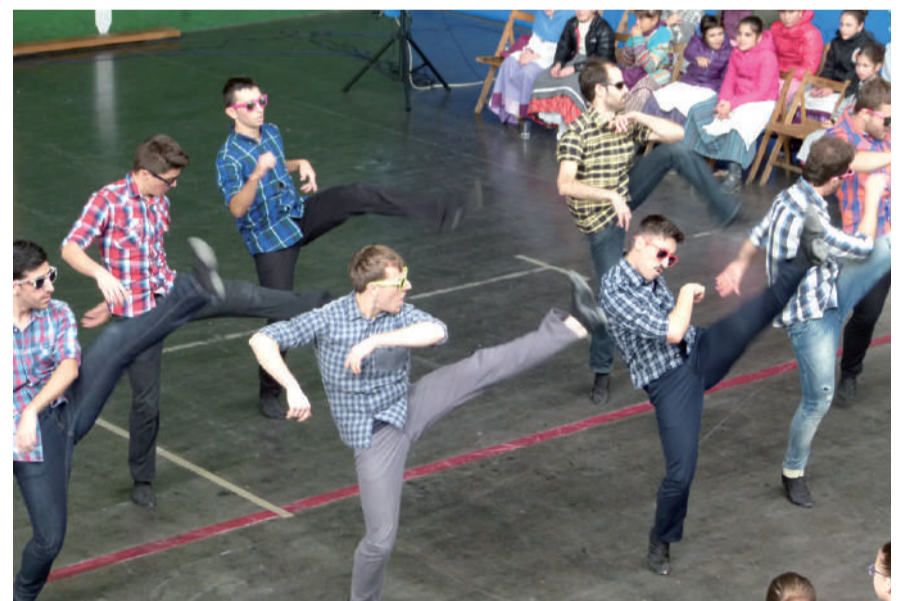
Tio Teronen Semeak ikuskizun betean Amasa-Villabonako Oinkari dantza taldearen urteurrenean.

TRADIZIOA ETA BERRIKUNTZA UZTARTZEN MAISU BILAKATU DIRA. ARRAKASTA HANDIAREKIN, GAINERA.