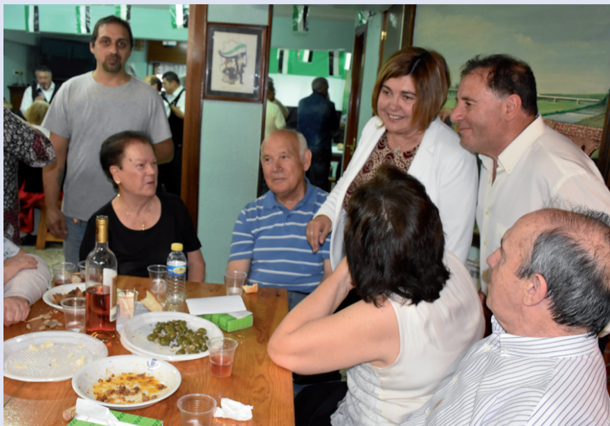
Presidentak mahaiz mahai agurtu zituen elkartera hurbildutako herritarrak.