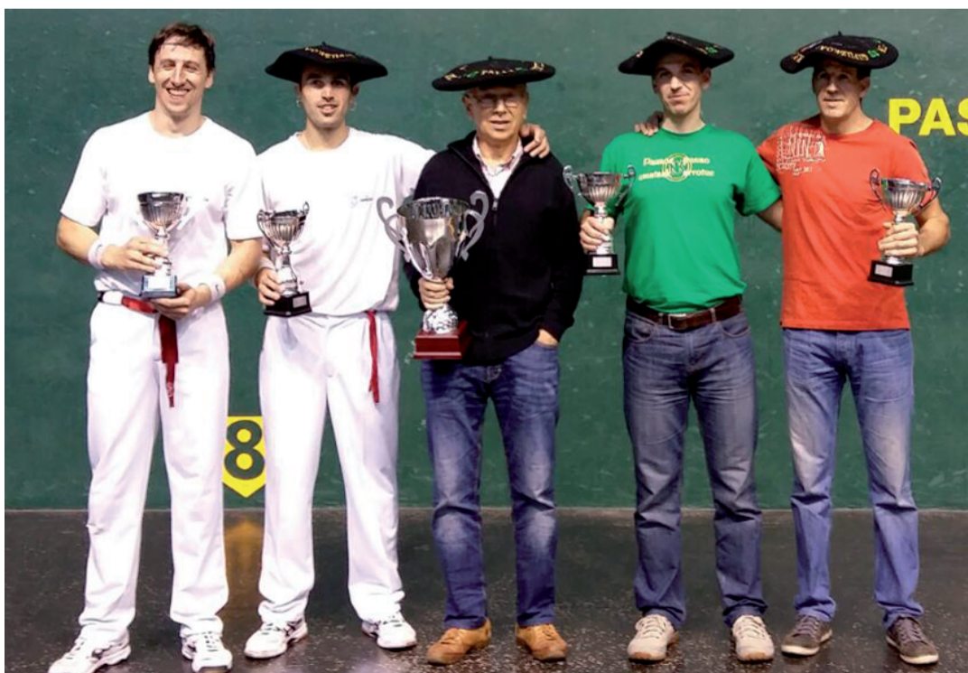
Andoain taldeak Deba garaitu zuen, Gipuzkoako Herriarteakoaren finalaren bi partidatan irabaziz (35-32 eta 40-30). Zorionak Gazteleku taldeari eta bereziki Iradi-Lete eta Altuna-Rekalde txapeldunei.