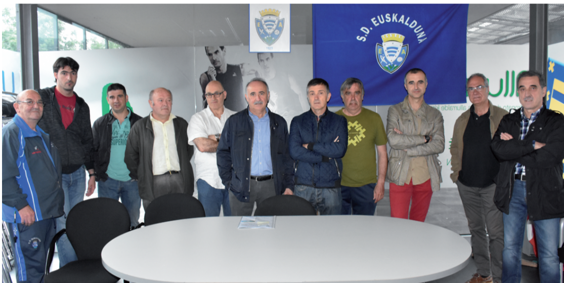
Zuzendaritza utziko duten kideak, taldekide berriekin batera, joan zen asteburuan Ubitarten deitu zuten batzarrean.