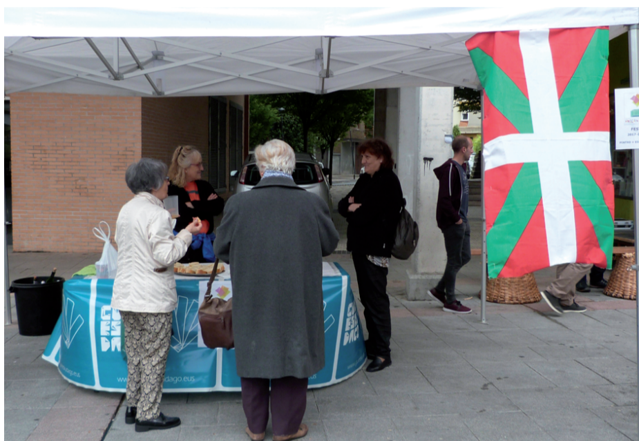
Euskal gazta, sagardoa edota ardoa dastatzeko aukera zegoen Zumea plazako postuan.

burura iritsi. Orain arte sinadura eman ez dutenek Kaleberrian ipinitako bulegoan eman dezakete, egun hauetan. Andoainen erabakitzeko eskubideari buruzko herri kontsulta azaroan egin nahi dute.