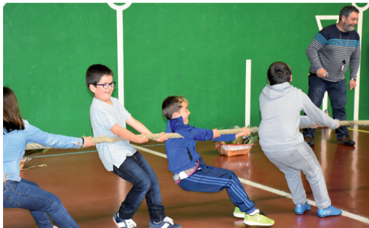
Haur eta gazteboentzat ekitaldirik ez da falta izan Kirol asteen: Pilota, herri kirolak...