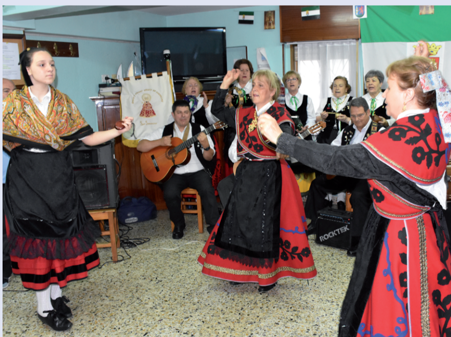
Extremadurako ereserkia abestearekin batera, bi dantza ezberdin eskaini zituzten.