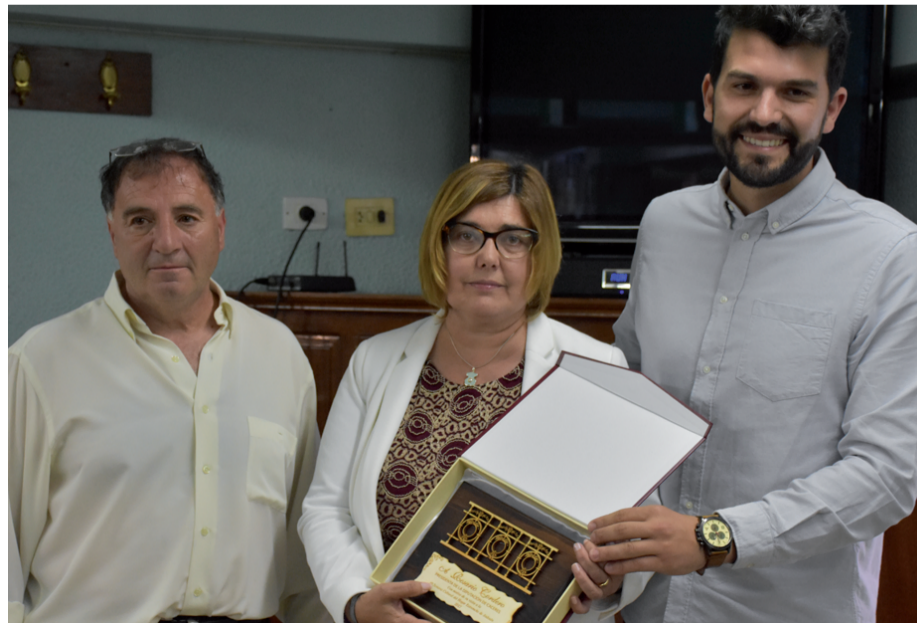
Hogar Extremeño elkarteant, Cacereseko diputazioko ordezkariak Kontxako barandillaren erreplika oparitu zieten, "La batalla de Andoain" liburuaren ale banarekin batera.