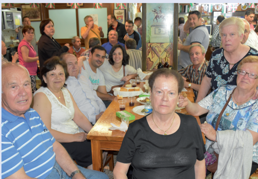
Jendez gainezka zegoen elkarte, larunbat eguerdiko harrera ekitaldian.