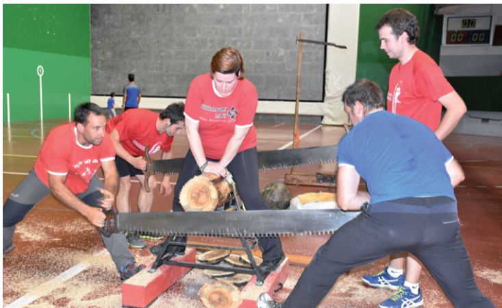
Arrate pilotalekuan herri kirolean trebatzeko aukera eskaini zuten.