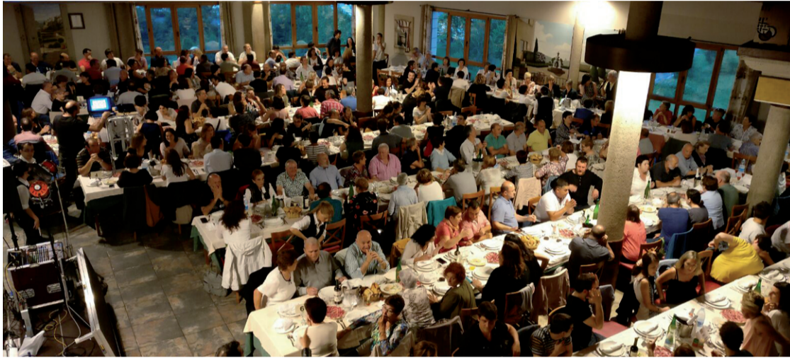
Ikuspegi ikusgarria, Egaperen afarikoa. 310 lagun elkartu ziren joan zen ostiralean, 50. urteurreneko afarian.

Egape ikastolak antolatuta, eta bere 50. urteurreneko ospakizunen egitarauaren baitan, Oianume jatetxean afaria egin zuten joan zen ostiralean. Ikastolaren deialdiari erantzunez, adin guztietako 310 urnietar elkartu ziren bertan, giro atseginan. Ikasturtean zehar 50. urteurrena dela eta antolatutako ekintza jendetsuena izan zen. Bertan elkartu ziren ikasle-ohiak, gurasoak, eta garai bate-