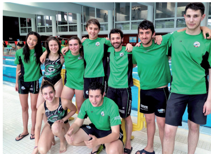
Buruntzaldea IKT taldeko kideak, aurreko asteburuan Allurraldeko igerilekuan.

Buruntzaldea IKT igeriketa taldeak, Master taldeko igerilariekin batera, itsaso zabalean entrenamenduetan parte hartzeko aukera eskainiko du datozen asteetan. Halaxe iragarri dute taldeko ardura-dunek: "Ekainaren 12tik uztailearen 21era bitartean itsasoan entrenamenduak egiteko goaz. Hasera batean, bi ordutegi ipiniko ditugu itsasorako aukeran: Astelehen, asteazken eta ostiraletan arratsaldeko 16:00-17:15 artean edota iluntzeko 19:00-20:15 artean. Prestaketa saio hauetan parte hartzeko, igeri egiten jakitea beharrezkoa da. Kontutan izan entrenamendu egitura batean gaudela eta ez ikastaro batean, beraz, helburua ez da igeri egiten irakastea, nahiz eta logikoki alor teknikoa ere jorratuko den. Federatua ez bazaude, itsasoan gerta daitekeen edozein ezbeharren aurrean babestu gabe zaude.