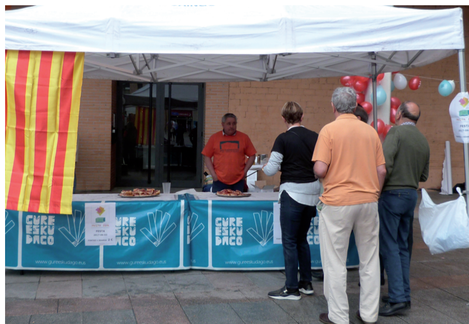
Kataluniako pa amb tomaca ezaguna jateko aukera eskaini zuten Zumea plazan.

Erabakitzeko eskubidearen inguruko herri galdeketa Euskal Herri osoan egiten ari dira, Gure Esku Dago ekimenaren babesean. Kontsulta egin ahal izateko, lehenik eta behin, herritarren sinaduren bermea lortzea ezinbestekoa da. Andoainen ere erabaki nahi dute, eta horretarako Andoain Esan ekimenak 1.500 sinadura lortu nahi ditu. Apirilean indartsu hasi eta helburu gisa jarritako sinadura kopurua lortzear badira ere, denbora aurrera doa eta egun hauetan kopuru horri lortu behar dute. Bai ala bai. Bestela, kolokan egon daiteke azaroan egin nahi duten herri galdeketa.