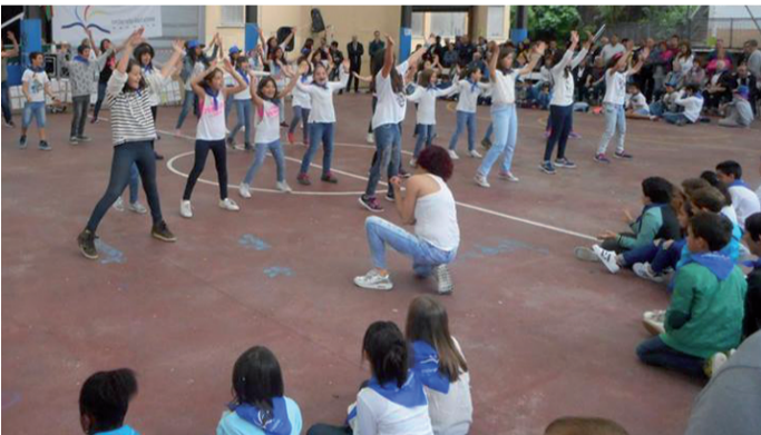
Dantza saioa Ondarreta ikastetxeko jolastoki estalian.

Ikasturte amaierara iristen ari da, eta joan zen larunbatean Ondarreta ikastetxeko ikasleek, gurasoek eta irakasleek ikasturte amaierako egu-