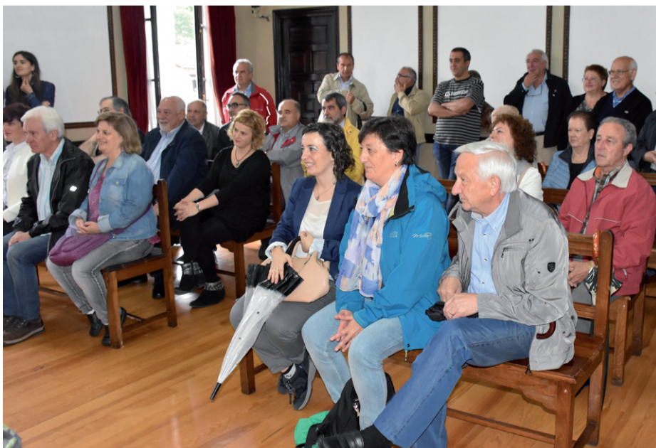
Udal ordezkari zabalak parte hartu zuen larunbat eguerdiko ekitaldian.