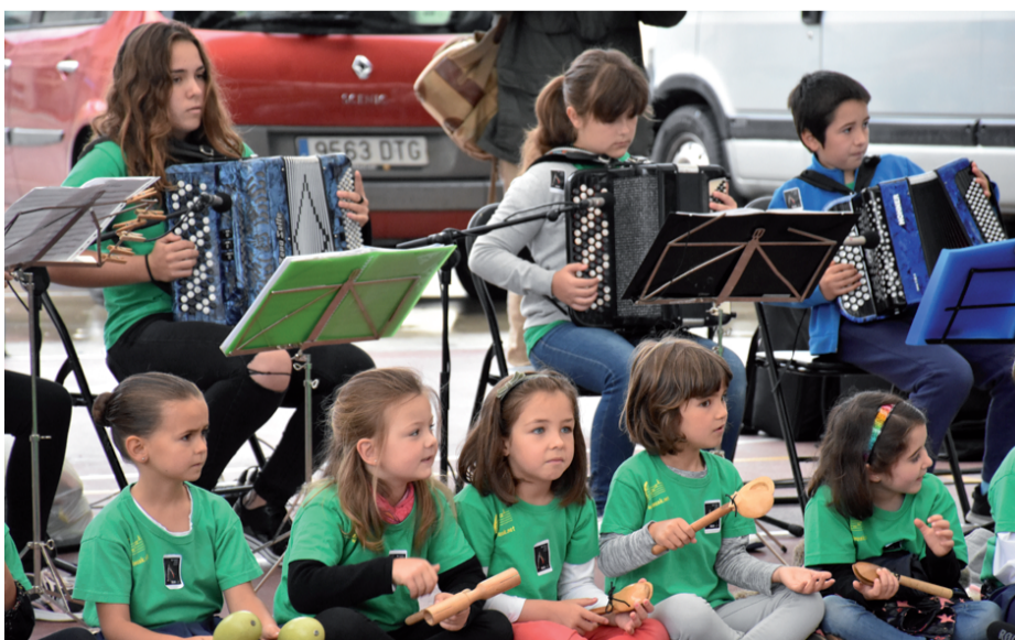
"Aldapan gora" kantu ezaguna eskaini zuten Soinuak musika eskolako kideak.