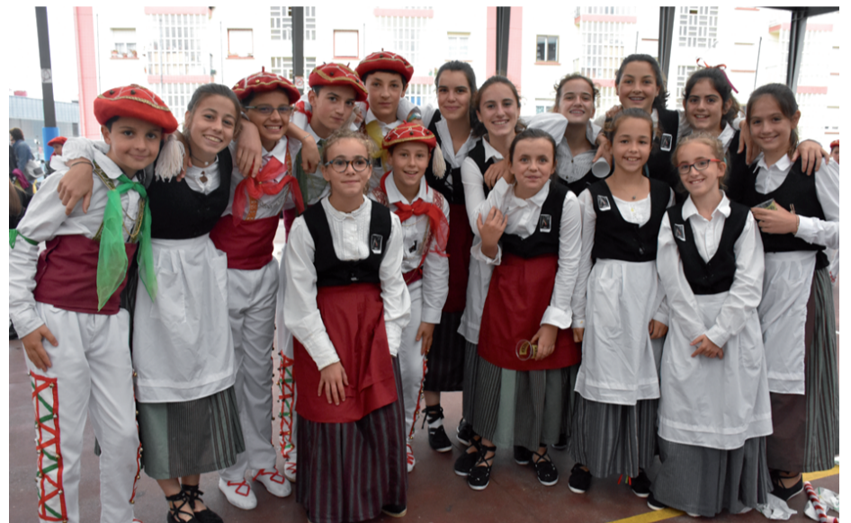
Lasarte-Oria, Berriz, Lizarra eta Uztaritzeko dantza taldeak hurbildu ziren Andoainera. Irudian, Uztaritzeko kideak.