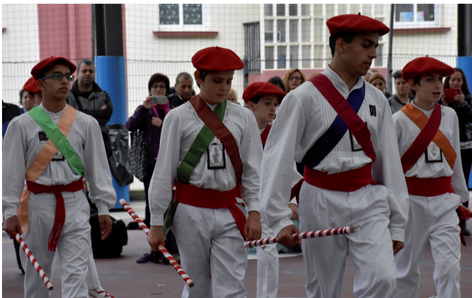
Urki dantza taldeko kideekin batera, Andoaingo trikitilariak eta Soinuak musika eskolako kideak jaialdian partaide izan ziren. Eta, nola ez, baita Andoaingo txistulariak ere.

Berriz, Lizarra eta Uztaritzeko dantza taldeak, Zarautz eta Loatzo trikitilari taldeak, Villabonako Eresargi Abesbatza, Loatzo Musika Eskolako txistulariak eta, nola ez, Andoaingo talde ezberdinak.