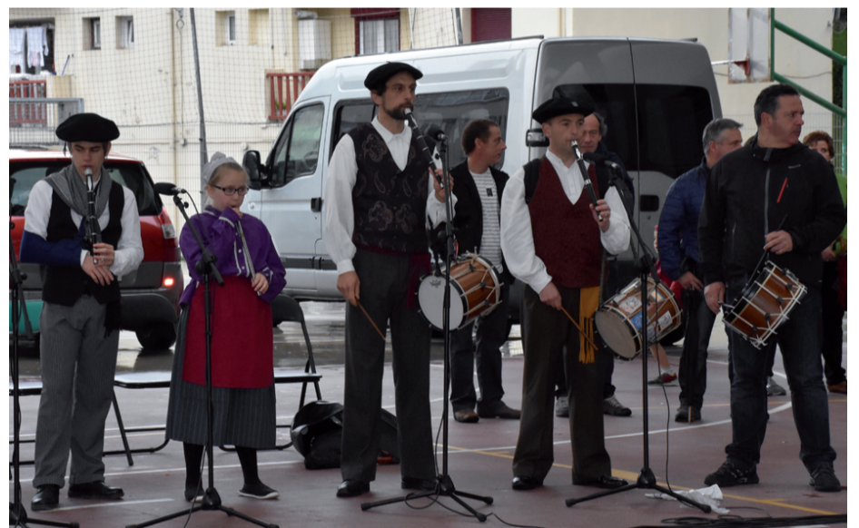
Txistulariak Ondarreta ikastetxeko jolastoki estalian.