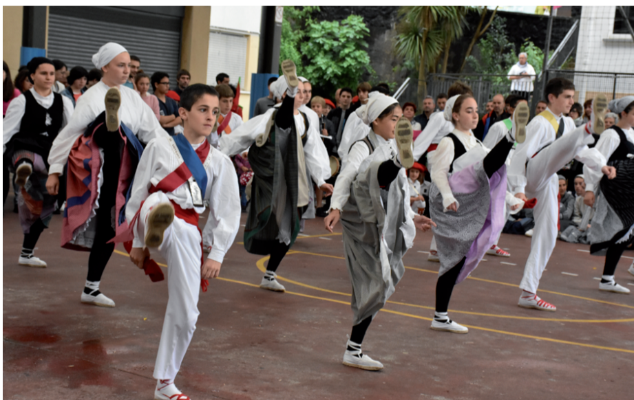
Urkiko dantzariak ekitaldiaren hasieran agurra dantzatu zuten, denek batera.