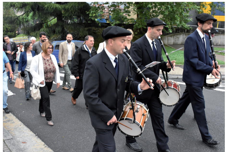
Txistulariei jarraiki, agintariak udaletxetik elkartera abiatu ziren.