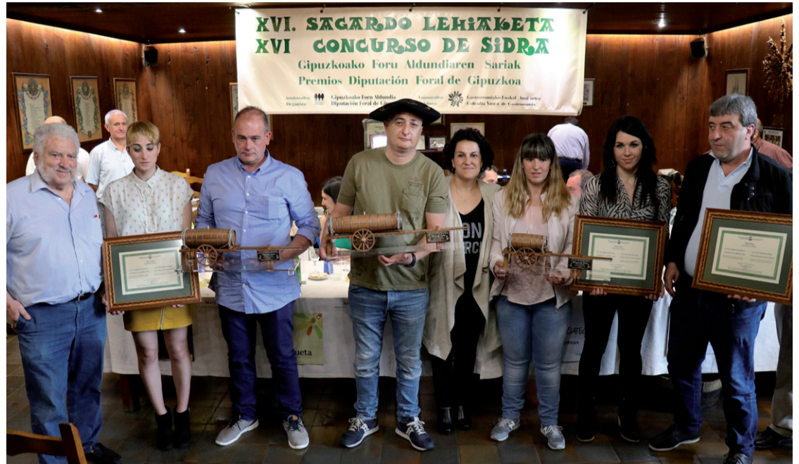
Gaztañagakoek lehiaketa irabaztea zer den jakin badakite. Aurten ere, Andoaingoak finalisten artean sailkatu dira.

Gipuzkoako Foru Aldundiaren Sagardo Lehiaketaren XVI. edizioaren finalean, Altueta izan zen irabazlea, Adunako Aburuza txapeldun-orde eta Asteasuko Sarasola hirugarren. Lehiaketara izena eman-