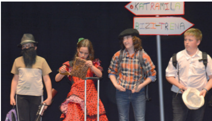
Katramila Andoaingo antzerki taldeko gaztetxoak, lazko edizioan.