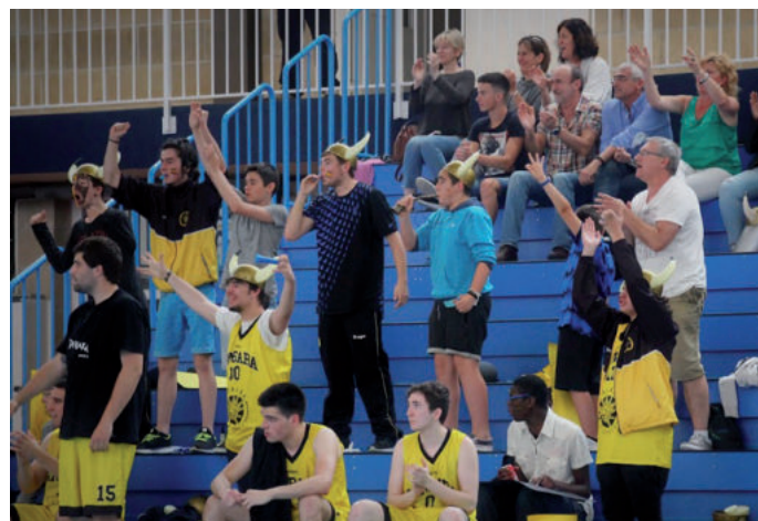
Zaletuen babesa izan zuten andoaindarrek Elgoibarren jokaturiko partidatan.

Andoaingo saski taldeak bigarren mailatik lehen mailara igotzeko play-offa jokatu zuen aurreko asteburuan Elgoibarren. Ez ziren bakarrik egon, Andoaindik autobusa irten baitzen taldea animatzera. Larunbateko partida