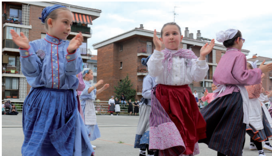
Iaz Plazido Muxika plazan eskaini zuten saio nagusiko argazkia.

Kultur eta ospakizunei dagokionez, sekula hutsik egiten ez duen eragileetako Egape dantza taldea da. Aurtengo jaien hasierako txupinazoan saio berezia eskainiko dute, iluntzeko 20:00etan. Eta jaietako azken egunean ere, igandean alegia, Txanbolinen emaldian parte hartuko dute. Jaien hasiera eta amaiera artean, eurentzat urteko egunik garrantzitsuenetakoa dena ospatuko dute: Urnieta Dantzan jaialdia.