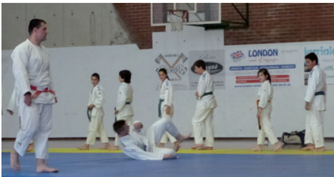
Larunbat arratsaldeko argazki gehiago Aiurri.eus gunean ikusgai daude.