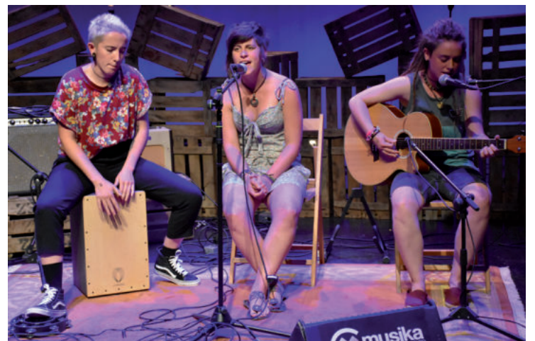
Lear taldeko hirukotea maila handiko kantariekin batera aritu ziren Saroben.

Musika izan zen igande arratsateko protagonista nagusia. Hamabi musika proposamen bildu genituen agertokian, gu-