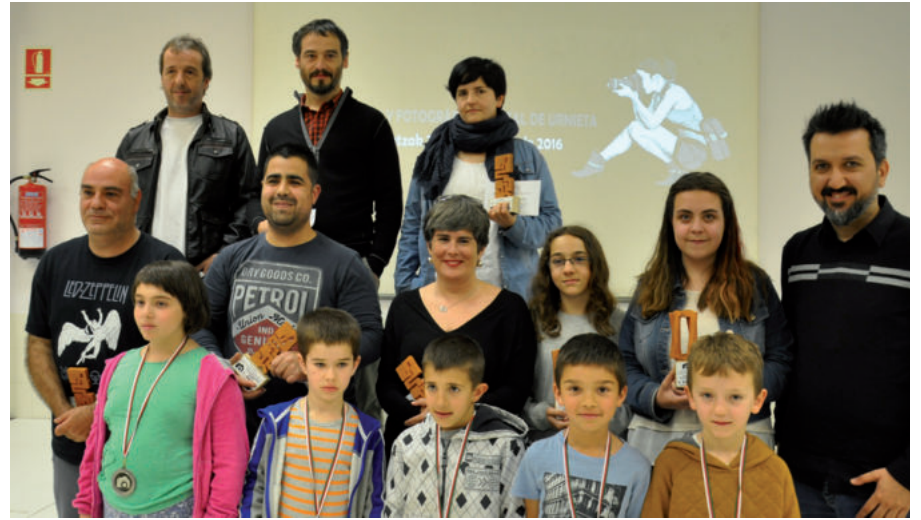
Hitzordu klasiko bilakatzen ari da argazki-rallya Urnietan, 25. ediziora iristear baita.

Argazkizaletasuna sustatzeko hitzordua larunbat honetan da. Parte hartzaileek zazpi gai landu beharko dituzte: kontrol argazkia, autoerreturatu, argazki librea eta antolaketa egunean bertan jakinaraziko dituen beste lau gai gehiago. Argazkiak JPG formatuan Bertan bulegoetan aurkeztu beharko dira ekainaren 1ean. Sari banaketa ekitaldia ekainaren 14an izango da, 19:00etan Lekaion.