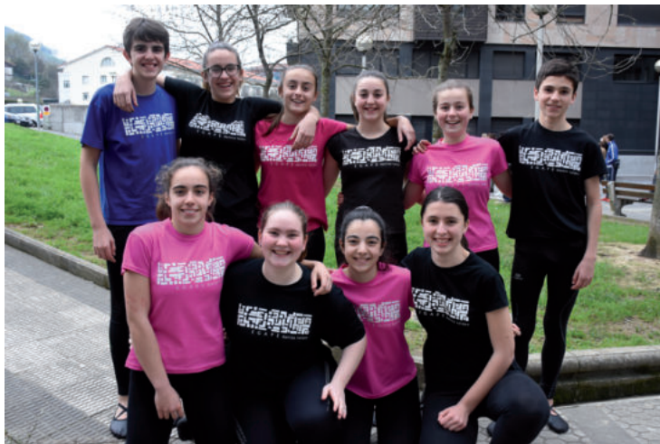
Egape dantza taldeko kideak jaien hasierako ospakizunean parte hartuko dute.

Pirritx, Porrotx eta Marimotots pailazoaren ikuskizun berrienarekin emango diote hasiera aurtengo Gazte Festei. Sarrerak salgai izango dira ohiko tokietan, eta baita egunean bertan ere arratsaldeko 16:30etik aurrera Egape ikastolako atarian. Euskara ardatz duen ikuskizuna da eta urnietarrak adi egon daitezela, ikuskizunaren amaiera aldera herriko eragile ezberdinak igoko baitituzte taula gainera. Egapetik asko eta asko San Juan plazara joango dira iluntze