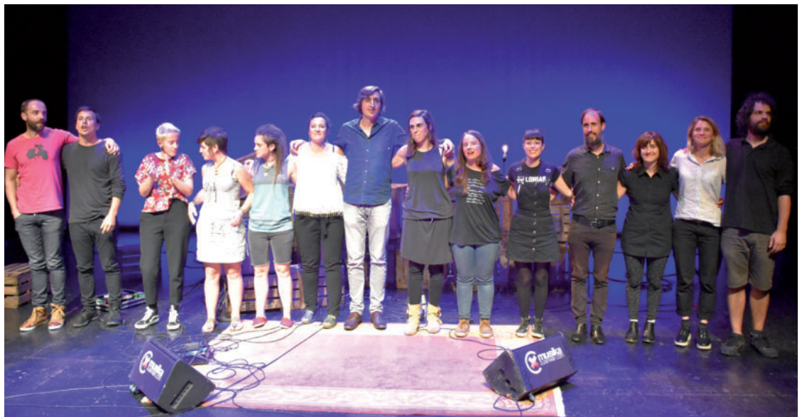
Emanaldiaren amaieran kantari guztiak batera agertu ziren oholtzan, ikusleen txalo zaparrada jasotzeko. Argazki-bilduma ikusgai dago Aiurri.eus webgunean eta bideo sorta Musikazuzenean.com webgunean.