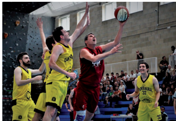
Ganbarako kideak lehiari, Barren aldizkariak ateratako argazkietan.