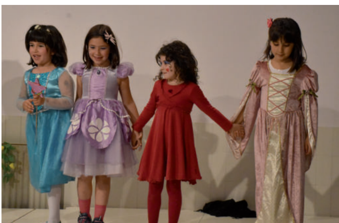
Emanaldi berria eskainiko dute Saroben, datorren ekainaren 16an.