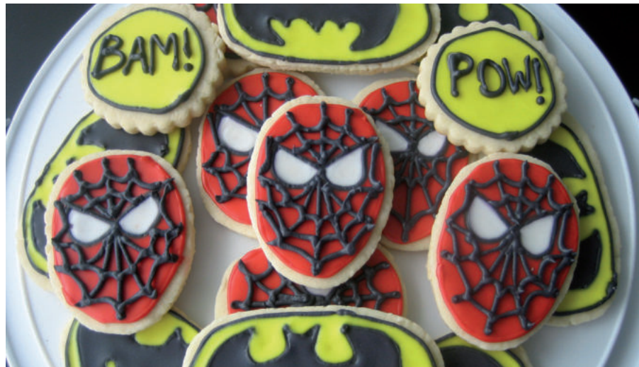
Poxta Zahar taldeak ekimen ezberdinak antolatu ditu Gazte Festetan.

Mozorro festa eta afaria antolatu ditu ostiral honetarako Poxta Zahar taldeak. Izena eman duten 18 taldeek dagoeneko jakin badakite fikziozko zein pertsonaia irudikatu behar duten. Eta, horrez gain, pertsonaia horren irudia afariko jakietan irudikatu behar dute. Antolatzailerik afarian giro dibertigarria sortze aldera bururatu zitzaizen ideia hori. Ono pasatzeaz gain, antolaketa sari ezberdinak banatuko ditu ostiral gauean