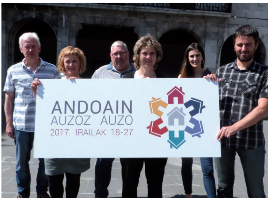
Parte hartze prozesu berria deitu dute irailerako. Irudian, Andoingo Udal gobernu taldeko kideak.