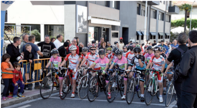
Alebin mailakoekin abiatu zen txirrindularitza jardunaldia Urnietan.

Andoingo Txirrindulari Eskolak alebin eta infantil mailako lasterketa antolatu zuen Urnietako Idiazabal kalean, Urnietako Udalarekin lankidetzan. Elkarlan horri esker, urteko egutegian haur eta gaztetxoek trebatzeko lasterketa berria dute.