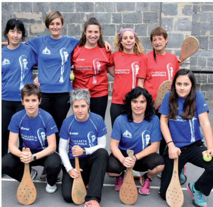
Ostiral honetan, 19:30ean hasita, emakumezko bikoteak lehiari arituko dira. Eta larunbatean, goizeko 10:00etan hasita, nagusiki mutilak arituko dira Sorabillako pilotalekuan.