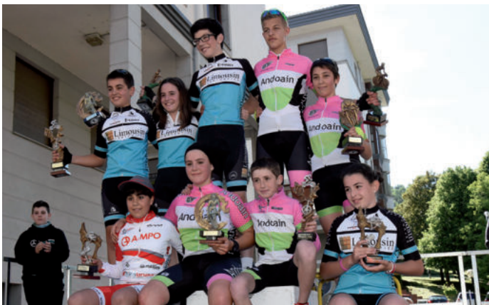
Alebin eta infantil mailakoen podiuma, lasterketa amaituta.