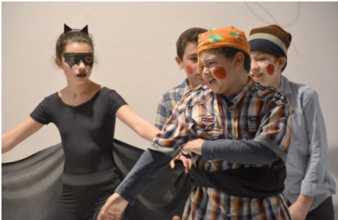
Aktoreak lanean aurreko larunbatean, Lekaio kultur etxean.