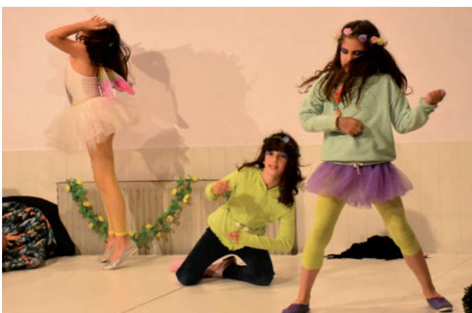
Egapeko Lehen Hezkuntzako 25 ikaslek parte hartu zuten.