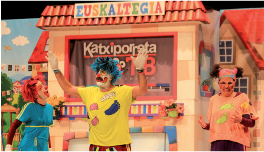
Pirritx, Porrotx eta Marimotots ikuskizun berrienaren une batean.

Pirritx, Porrotx eta Marimotots pailazoek 'Tipi-Tapa Korrika' ikuskizuna eskainiko dute ostiral honetan Egape ikastolako jolastoki estalian, arratsaldeko 17:30ean hasita. Aurtengo Gazte Festen hasierako ekitaldia izango da, eta beste behin ere Euskal Herriko pailazo ezagunenak ikuskizun berriena eskaintzera etorriko dira. Euskara ardatz duen ikuskizuna da, Korrika bi urtez behin egiten den ekimenarekin lotuta.