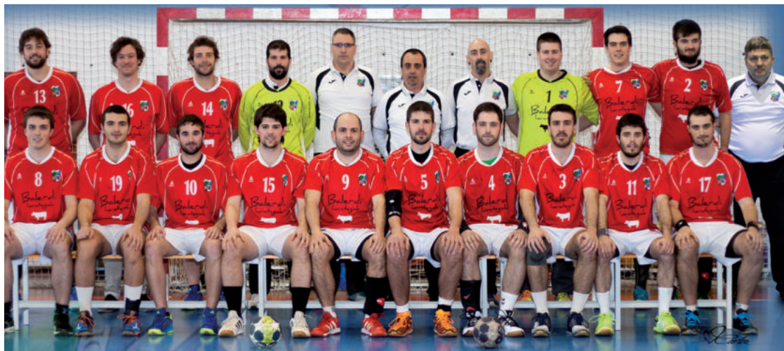
Denboraldi borobila egin dute urnietarrek.

Amaitu da amets gozoa, nahi baino lehenago. Baina ezin ahaztu egindako bidea oparoa izan dela. Eta garrantzitsuagoa dena, luzaroan oroimenean geratuko direla eskubaloiko mutilek askorengan piztutako ilusioa eta gorritxoekiko atxikimendua.