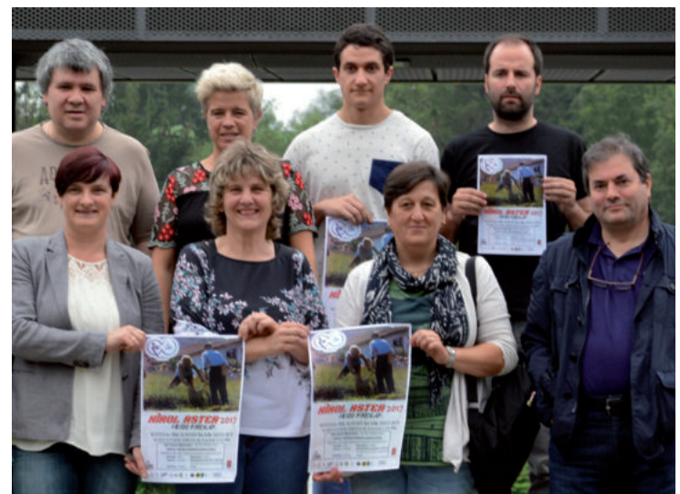
Kirol Astearen aurkezpen ekitaldia egin zuten, joan zen astelehenean.

"Zer dakizu kirolaz?" sari banaketa ekitaldia. LH3, LH4, LH5 eta LH6ko ikasleei zuzendutako lehiaketa. Goikoplazan, 17:30etatik aurrera.