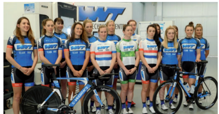
WNT enpresak profesional mailako emakumezko taldea babesten du.

WNT atzerriko enpresak bilkura egingo du datozen egunotan estatu mailan dituen langileekin, Urnietako K10 hotelean. Enpresa horrek emakumezko profesional mailako txirrindulari taldea babesten du, maiatzaren 17tik 21era Euskal Biran parte hartuko duena.