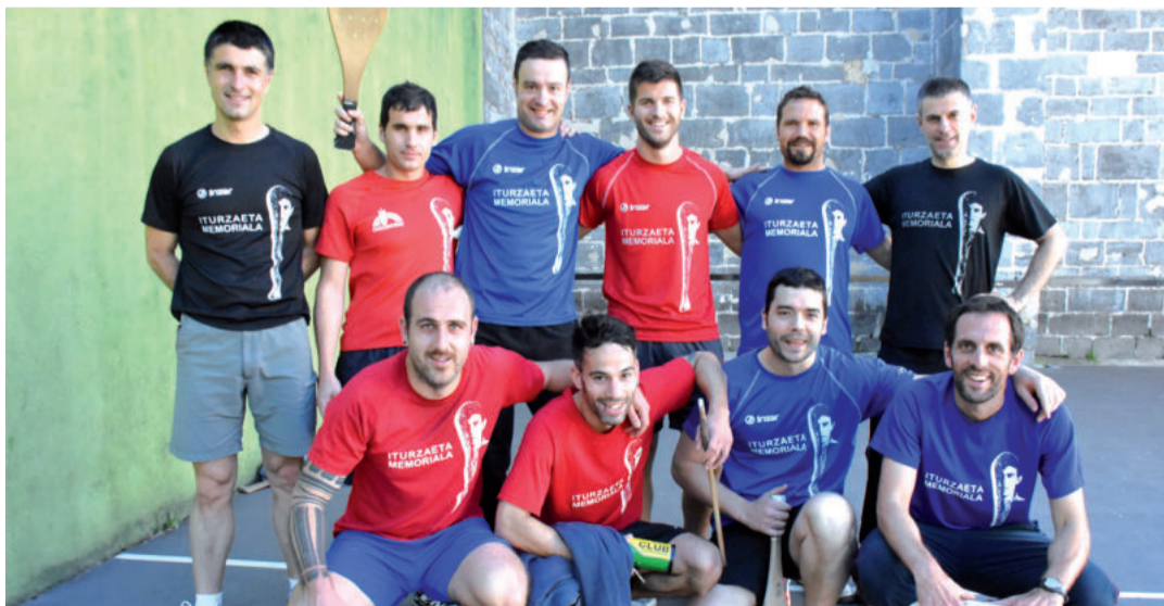
Aurreko asteburuan abiatu zen Iturzaeta herri txapelketaren edizio berria Sorabillako pilotalekuan. Bigarren jardunaldia larunbat honetan hasiko da, goizeko 10:00etan. Neskak ere asteburuan jarriko dira martxan, 18:30ean hasita.