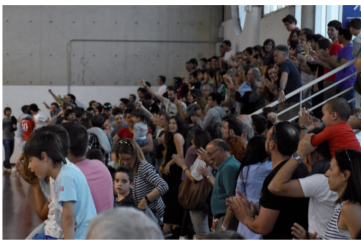
Sestaon eta Erreterian jokatu ostean Ordizia aurkari zaila hartuko dute etxean.

Arratsaldeko 19:00etan hasiko da Urnietako kiroldegian, eta zer esanik ez garrantzia handikoa izango dela. Play-offean oso gutxitan huts egin daiteke, eta horregatik etxeko partidei eustea beharrezkoa da. Oraingoan, gainera, lehen postuan doan Ordizia dator etxera.