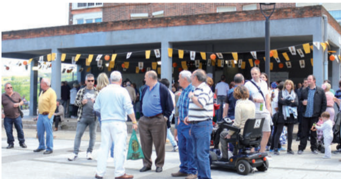
Egun osoko ospakizuna egin zuten elkartearen inguruan.