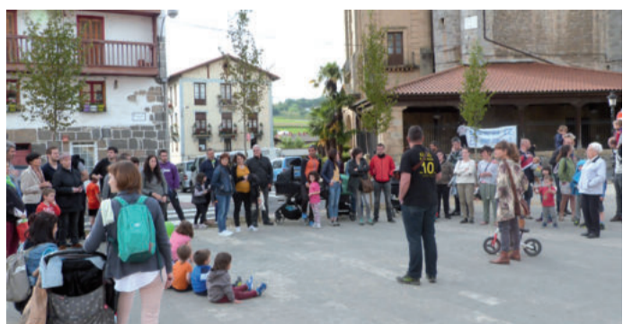
Astelehen arratsaldean hitzordu zaratsua antolatu zuten San Juan plazan.

Gipuzkoako herri askotan bezala, Urnietan ere hainbat herrikide erraustegia eraikitzeke lanen hasieraren aurka bildu ziren. Bilkura zaratsua izan ziren. Mobiliza-