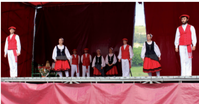
Folklore ezberdinei tartea eskaintzen diete urteroko jaialdian.

tuak. Goizez eta arratsaldez saioak eskaini zituzten Nafarroa plazan. DJ baten saioarekin eman zioten amaiera egun osoko ospakizunari.