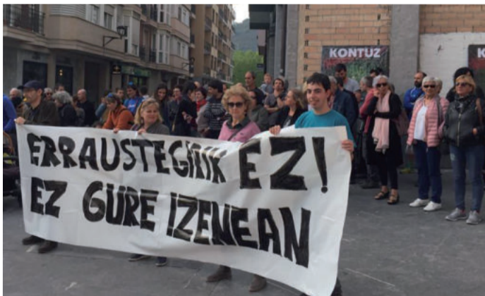
Elkarretaratzea egin zuten Juanita Alkain plazan.

Maiatzaren 8an hainbat herritar elkartu ziren Juanita Alkain plazan, Zubietako