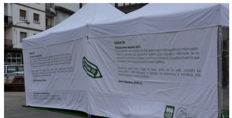
Urnietan San Juan plazan karpa ipini zuten hilaren 2an. Datorren astelehenean Goikoplazan ipiniko dute, egun osoan zehar.

Maiatzak 15, astelehena. 10:00–19:00. Goikoplaza. Info: gipuzkoa.eus/partaidetza