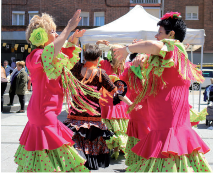
Trianako kideak Nafarroa plazan, larunbat eguerdian.

Lasarte-Oria, Errenteria edota Irun herrietatik etorritako folklore taldeak izan ziren Andoaingo Triana elkartearen ospakizuneko gonbida-