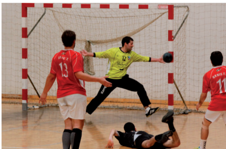
27-29 menderatu zuen Ereintza, eta Ordizia hartuko du etxean larunbat honetan arratsaldeko 19:00etan hasita.

Urnietarrek oso gertu dute finalerdietako txartela, baina gaur-gaurkoz igoera faseko lider bukatzea dute xede. Ordizia eta Ugeraga menderatzen badituzte, lider izango dira, eta finalerdietan laugarren sailkatuaren aurka jokatu. Ordizia da hurrengo aurkaria, Urnietan. Gipuzkoako txapelkun izan ziren Goierrikoak, eta Urnietaren aurka jokaturako bi partidatan garaile izan ziren, baina gol pare bateko abantaila txikiarekin. Klubeko arduradunek herritarrei kiroldegira azaltzeko deia egin diete, partida erabakigarria delako 2. Nazional mailara igotzeko borrokan.