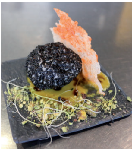
Aurtengo pintxo irabazlea.

horrela ehunka herritar asmatu zen pintxoak dastatzera. Aurreikuspenak gainditu ziren, taberna batean baino gehiagotan pintxoak azkar batean amaitu zirelako.