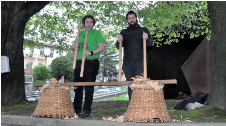
Andoingo txalpartariek ongi etorria eman zioten Korrikari, Gokoplazara iristean.