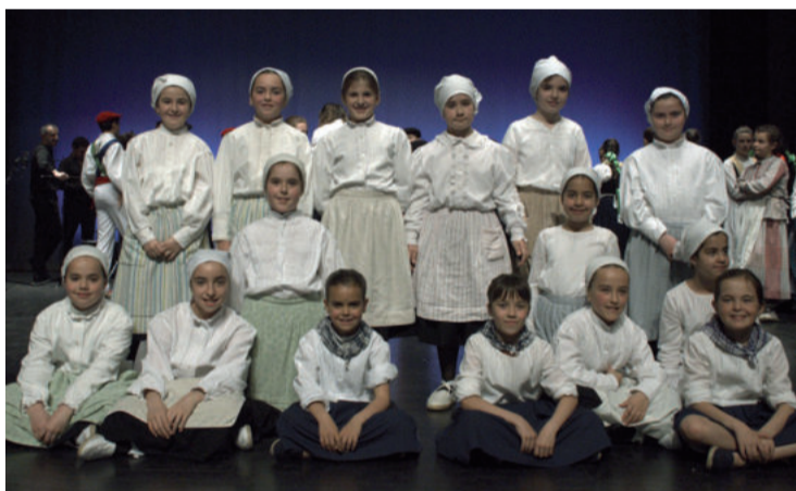
Dantzari txikiak dantzarako grina bizia erakutsi zuten Basteron.

Euskal folkloreak erakustaldi ederra eskaini zuten joan zen igandean, erreperitorio zabala eskainiz: Agurra eta desafioa, Belauntzingoa, makil txikia, Inauteriak, sardinerak, Irradaka, Bizar dantza, Fandangoa eta arin-arin, Lesaka, Leitzako ingurutxoak, dantzaluzea eta Muxikoak eta Polka. Dantza egiteaz gain, abes- tea eta antzeztea egokitu zitzaizkien, eta denerako abilezia badutela erakutsi zuten. Ate joka diren Santa Krutz jaietan eskainiko dute hurrengo saioa.