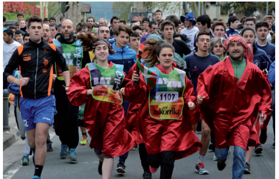
Axeri dantzako kideak Karrika aldean, herrigunerako norabidean.