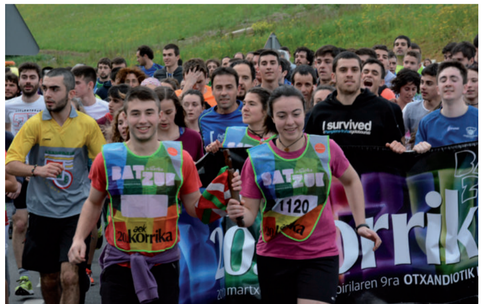
Poxta Zahar taldekoek Hernaniraino eraman zuten lekukoa.