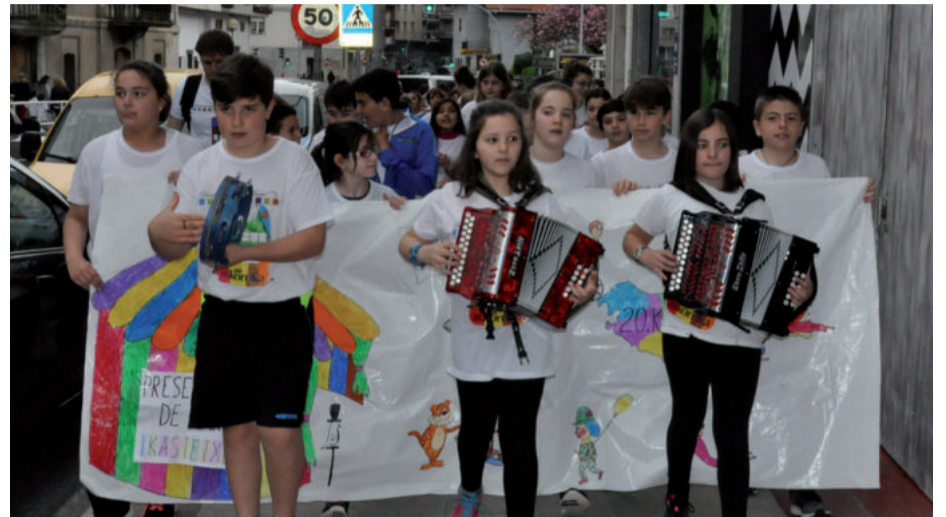
Urnietan Presentacion de Maria ikastetxeko ikasleak kalejiran jaitsi ziren Idiazabal kalera.