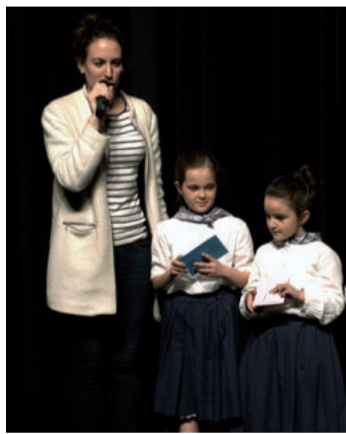
Emanaldian zehar zozketarako tartea ere hartu zen.