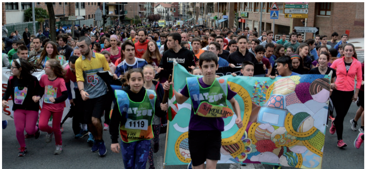
Egape ikastola 50. urteurreneko pankarta eta guzti irten zen Korrika.