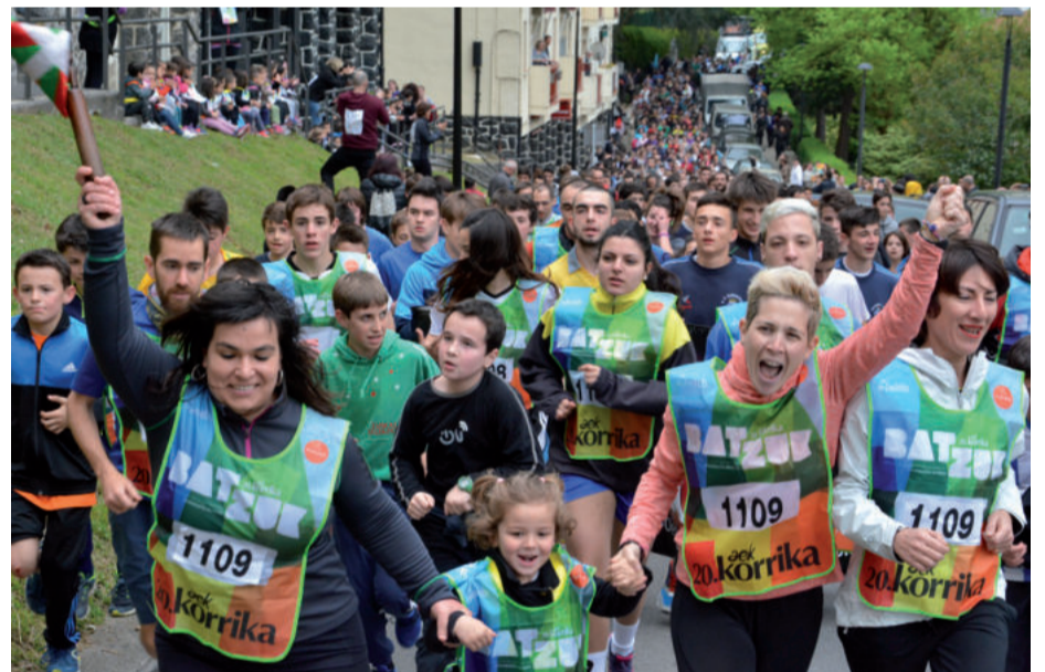
Ondarreta ikastetxeko haurrak, irakasleak eta gurasoak lekukoa eramaten.