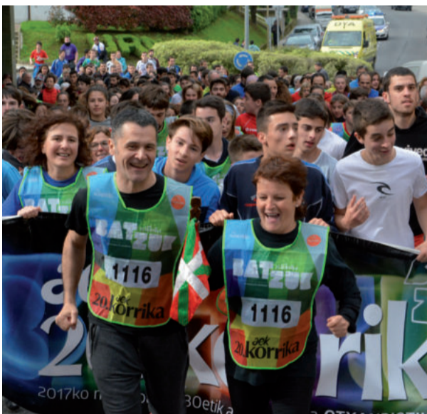
Egape dantza taldeko kideak.