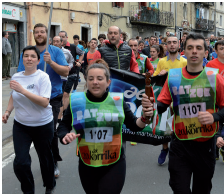
Andoaingo San Esteban-Goiburu auzuneko kideak lekukoarekin. Santa Eskean Korrikaren aldeko diru bilketa egin zuten.

Ezinezkoa da lagundu diguten guztiak banan bana izendatzea, norbait atzean uzteko arriskua hartuko baikenuke. Andoain, Korrika dela eta, laguntza, parte hartze eske joan garenean, ia ate guztiak zabalik aurkitu ditugu. Beraz, uste dugu Andoaingo herria, Andoain zorionduta, denak kontuan hartzen ditugula.