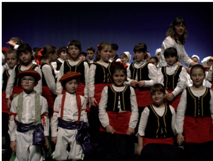
Dantzari txikiak argazkirako jarrita, bikain dantzatu osten.