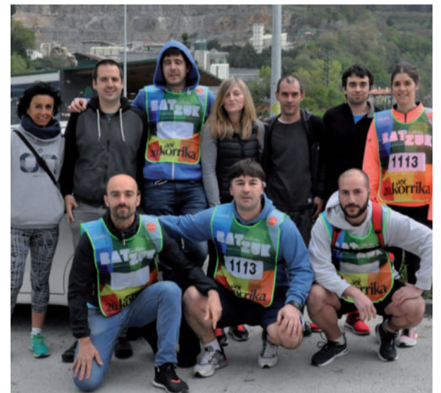
Esnelat enpresako langileak, lekukoaren zain.