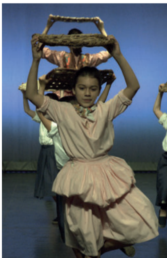
Dantzari txikiak Sardinerak dantza eramanean zuten oholtzara.