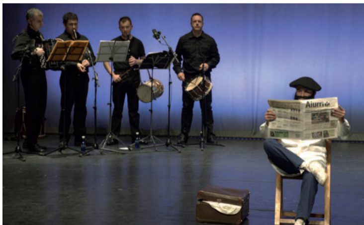
Txantxatik asko duen Bizar dantzarekin barreak egiteko aukera eduki zuten ikusleek.