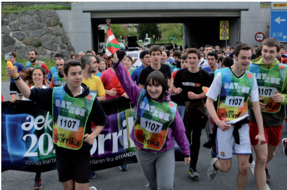
Aita Larramendi ikastolako ikasleek hartu zuten Andoaingo lehen lekukoa, Sorabillan.

bide erdira atera ziren euskararen alde oihu egin eta korrika egitera. Orriotan agertzen diren argazkiez gain, askoz gehiago ikus daitezke aiurri.eus webgunean. Baita bideoak ere.