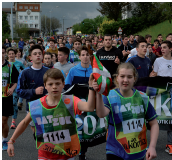
Salesiar ikastetxeak ikastetxearen parean hartu zuen lekukoa.