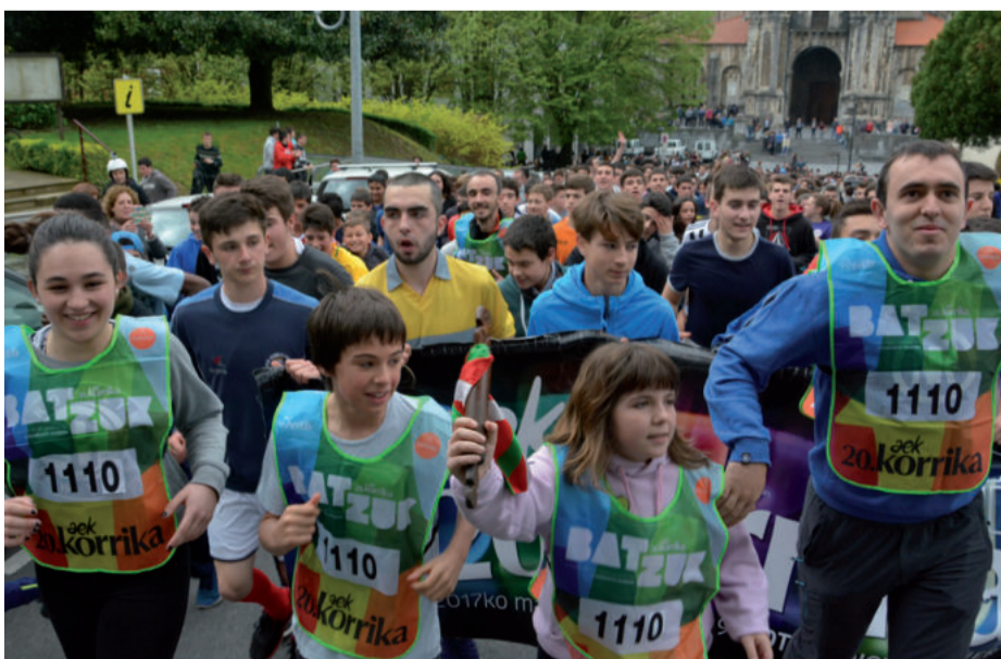
La Salle Berrozpe ikastetxeko adin tarte ezberdinetako ikasleek eraman zuten lekukoa.