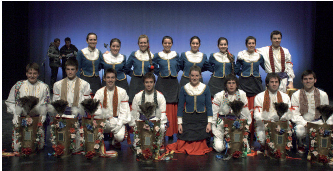
Dantzari helduek Muxikoak eta polkak dantzatu zituzten.

Euskal folkloreak erakustaldi ederra eskaini zuten joan zen igandean, erreperitorio zabala eskainiz: Agurra eta desafioa, Belauntzingoa, makil txikia, Inauteriak, sardinerak, Irradaka, Bizar dantza, Fandangoa eta arin-arin, Lesaka, Leitzako ingurutxoak, dantzaluzea eta Muxikoak eta Polka. Dantza egiteaz gain, abes- tea eta antzeztea egokitu zitzaizkien, eta denerako abilezia badutela erakutsi zuten. Ate joka diren Santa Krutz jaietan eskainiko dute hurrengo saioa.