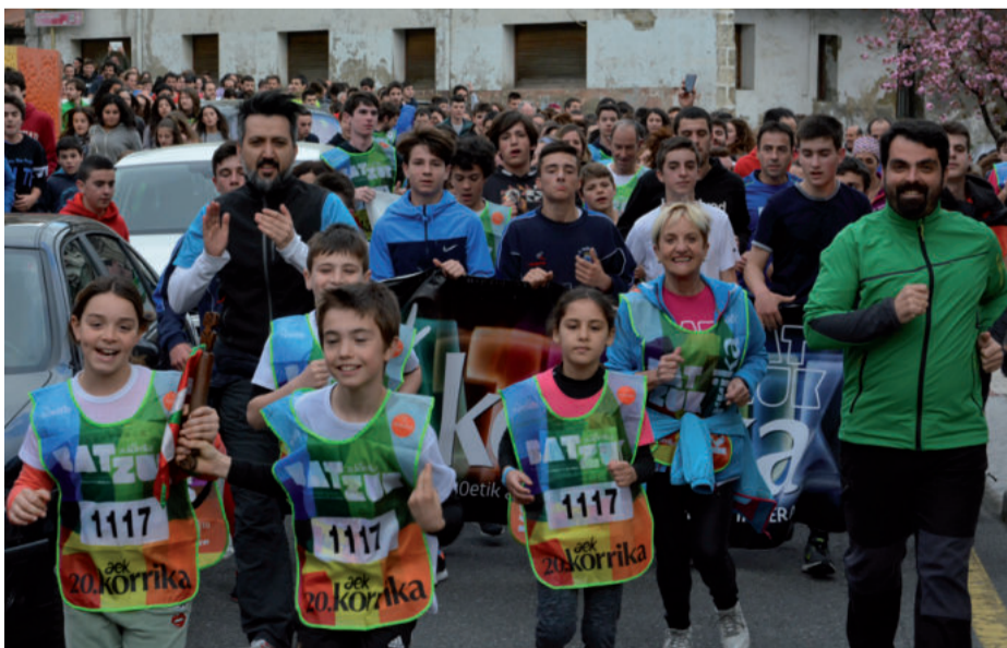
Udalak hartu zuen kilometroan alkate txikiel lekukoa eramateko aukera eskaini zieten.