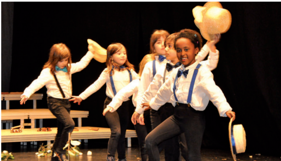
Castro eta Ulanga musika irakasleen ikasleek kontzertu didaktikoa eskaini zuten ostegunean.