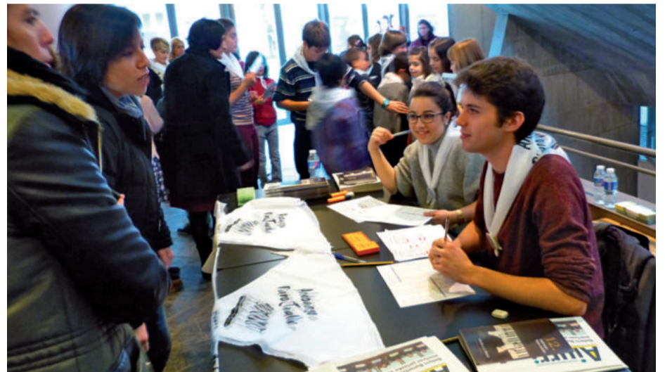
Ezinbestekoa izan da laguntzaile boluntarioen lana, Piano Jaialdia ondo irten zedin.