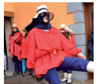
Puska biltzea, iaz Buruntzan.