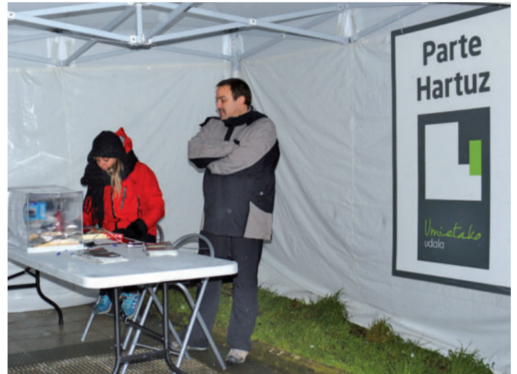
Urtarrileko batzaraldian 2017ko aurrekontu proposamenari baiezkua eman zioten.

Urnietan erroldaturiko 16 urtetik gorako edozeinek proposamenak aurkezteko aukera izango du. Proposamenak egiteko, urnietarren etxetara bidalitako eskuorria bete beharko dute eta herriko puntu ezberdinetan dauden kutxatan utzi beharko