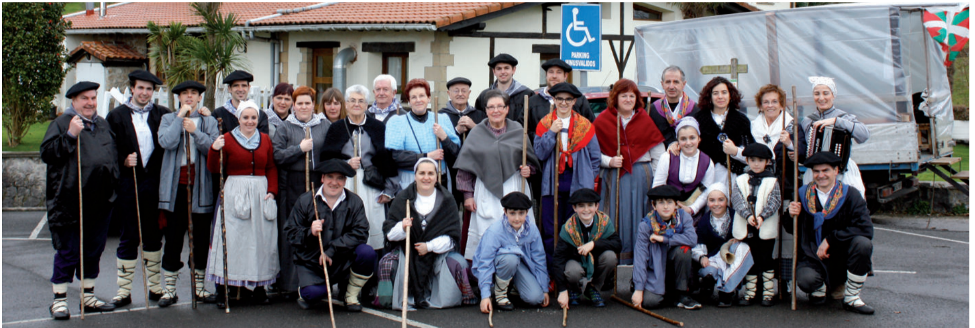
Goiburu auzoko taldea, Sega elkarteak antolatuta. Korrikan kilometroa erostera bideratuko dute aurten bildu duten dirua. Elkarteak kilometro horretan parte hartzera animatu ditu auzotar guztiak.

ibili ziren Goiburuko auzotarrak. Larramendi Bazkunak iluntzean ekin zion kantu errondari, eguraldia are zatarragoa zenean. 2018an hogeita bost urte beteko dira kantu erronda abian jarri zutenetik.