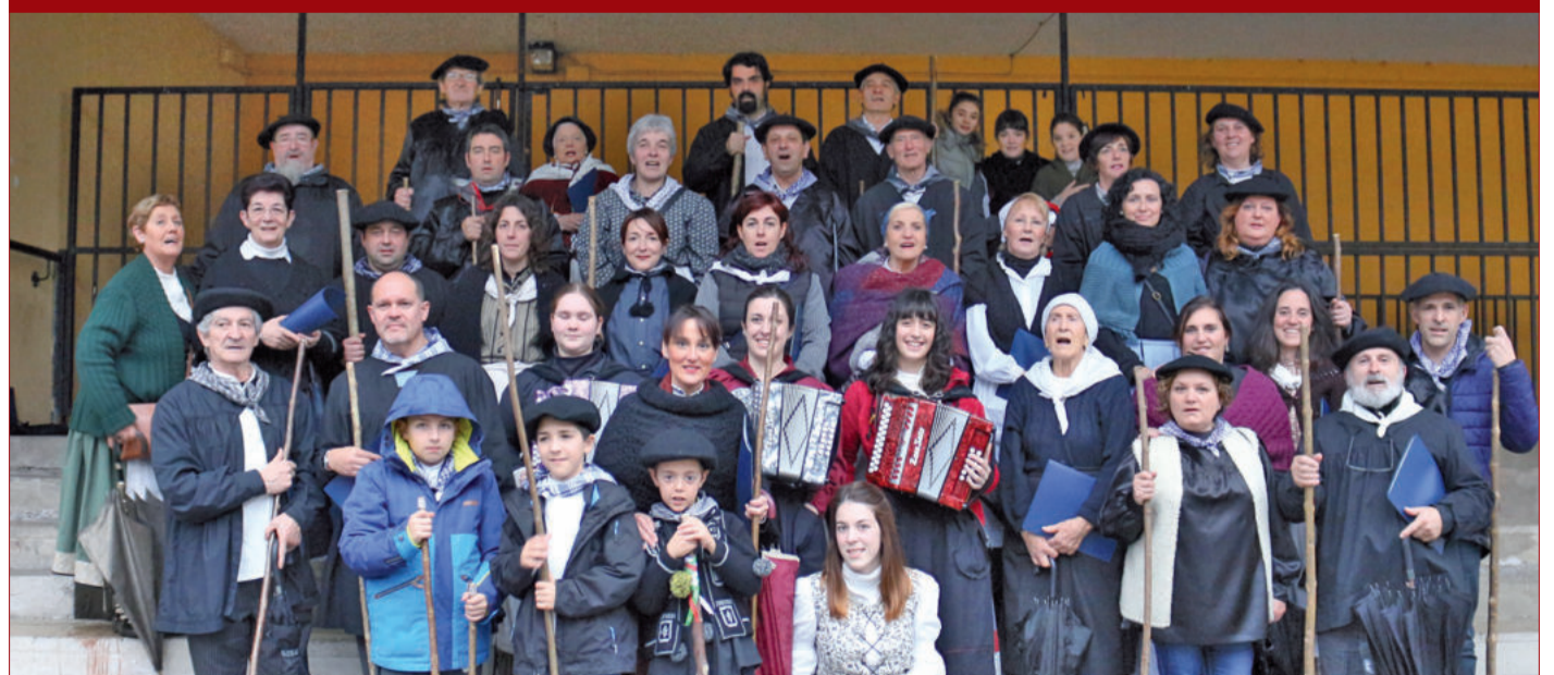
Eguraldi kaskarrari aurre egin eta kalez kale egin zuen errondarekin, ohitura zaharra berritu zuten. Aiurri.eus webgunean argazkiak eta bideoa.