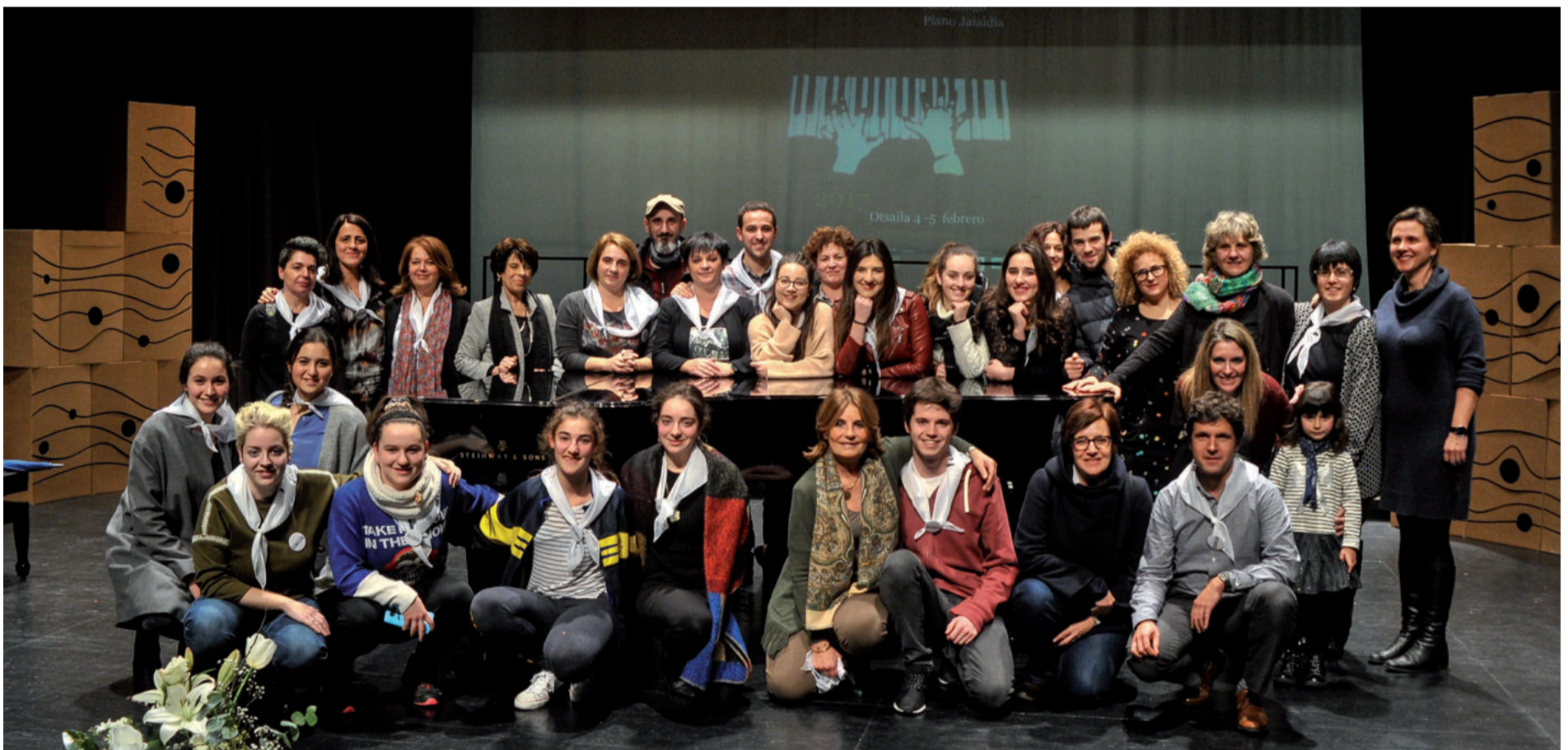
Deiadar elkarteko kideak eta laguntzaileak igande iluntzean, Piano Jaialdia amaitu eta gero.

bestekoa izan da. Pozarren zeuden, normala denez, Deiadar elkarte-ko kideak. Datorren urteari begira jarrita daude, ea 2018an eguraldiak laguntzen duen. Huraxe izan baitzen eragozpen bakarra.