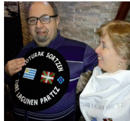
Agurreko afarian, jasotako opariekin.

Agurreko bertsoa eta guzti jaso zuten Galizia aldera joan aurretik.