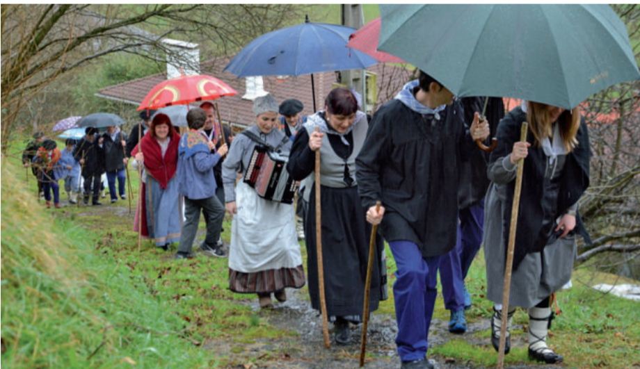
Baserritik baserrira zenbaitetan lokatzetan ibili behar izan zuen Goiburuko taldeak.