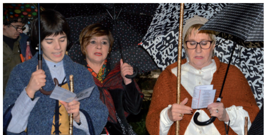
Eztarri fina erakutsi zuten Andoaingo kaleetan zehar jardun zuten kantariak.