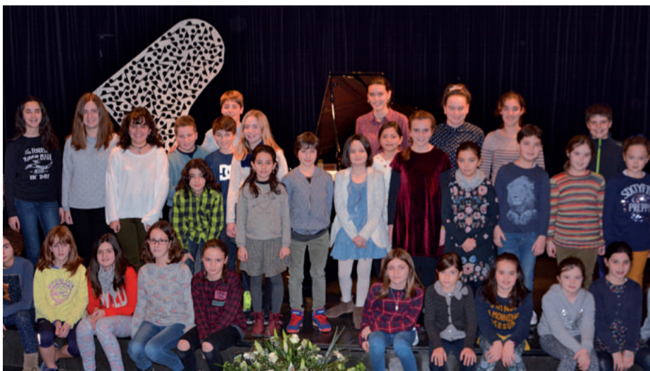
Andoaingo Udal musika eskolakoek ere parte hartu dute jaialdian; ostiralean kontzertua eskaini zuten.