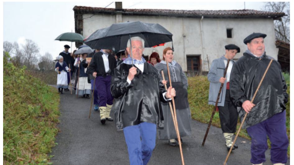
Bordatxiki baserritik behera jarraitu zuten kantu errondan.