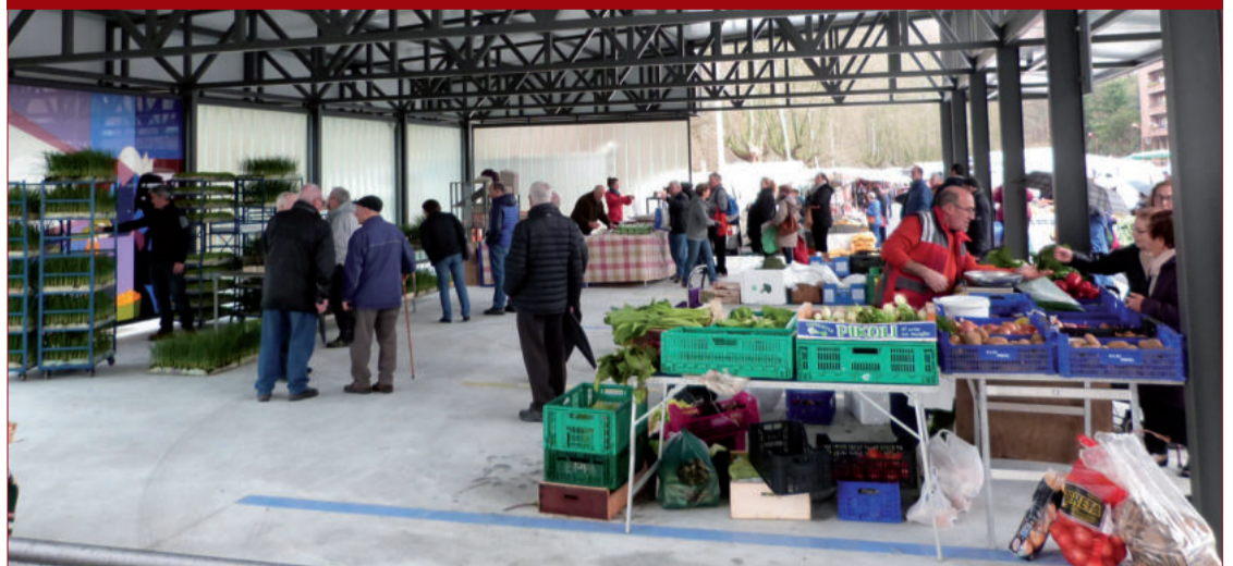
Joan zen asteartez geroztik merkatu plaza Makaldegian egiten da berriro. Estalpe berria ireki zuten otsailaren 7an.