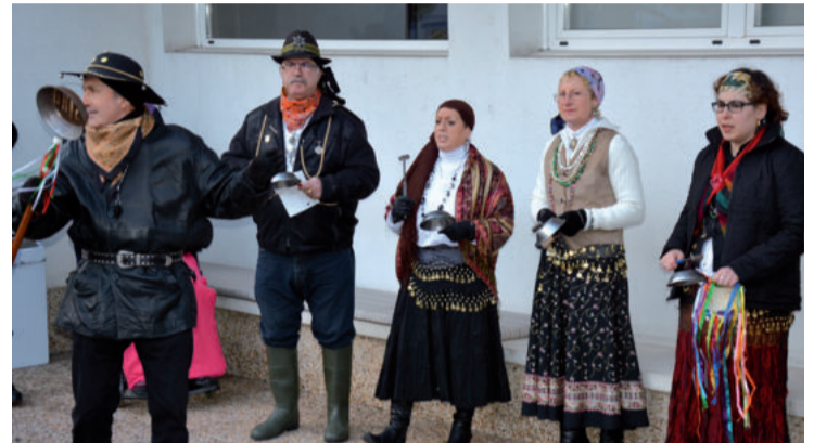
Konpartsak entsegu iragarri du otsailaren 15erako, 19:00etan Berrozpen.

Kaldereroen konpartsak Ontza elkarte izango du abiapuntu otsailaren 18an, arratsaldeko 17:00etan hasita. Zahar egotzian tradizio bihurtu den bisitaxoa egin ostean, Goikoplazara abiatuko dira bertan kanpaldia