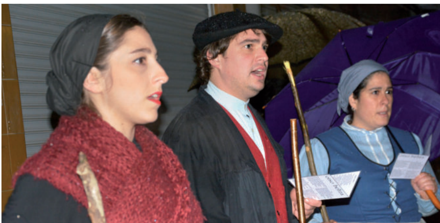
Euripean kantatu behar izan zuten Larramendi Bazkuneko kantariak.