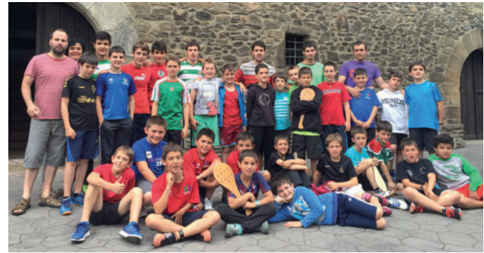
Gaztelekuko begiraleak eta gaztetxoak.

Aurreko astean zehar, ekainaren 28tik uztailaren 1era, Andoaingo pilota eskolako hogeita hamar kide Goizuetan izan ziren pala, zesta eta