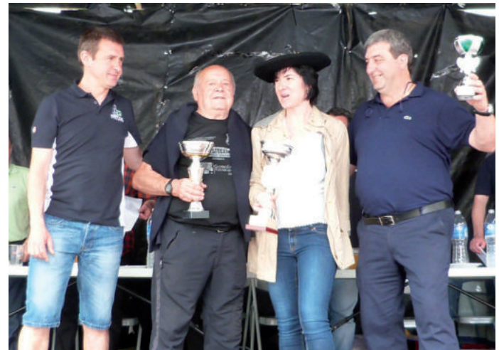
Petritegi, Sarasola eta Gaztañaga izan ziren, hurrenez hurren, onenak.

Sagardo lehiaketaren XXIII. edizioko lehen hiru sailkatuak hauek izan dira: