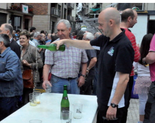
Sagardo dastaketara ere jendetza hurbildu zen.