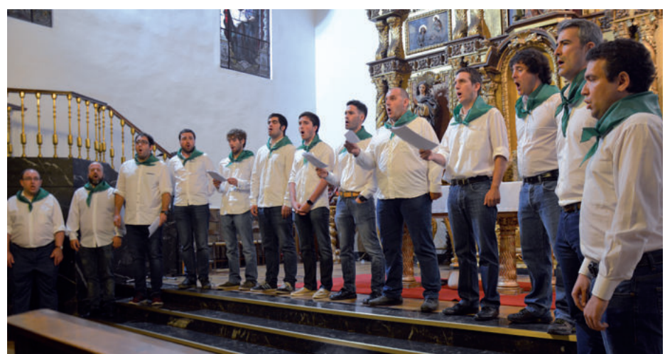
Kaletxikiko lagunak kantuan aritzeko elkartu ziren, ostiral iluntzean.