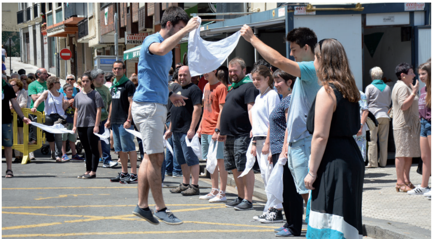
Dantza soka igande eguerdian, auzoko bazkariaren aurretik.