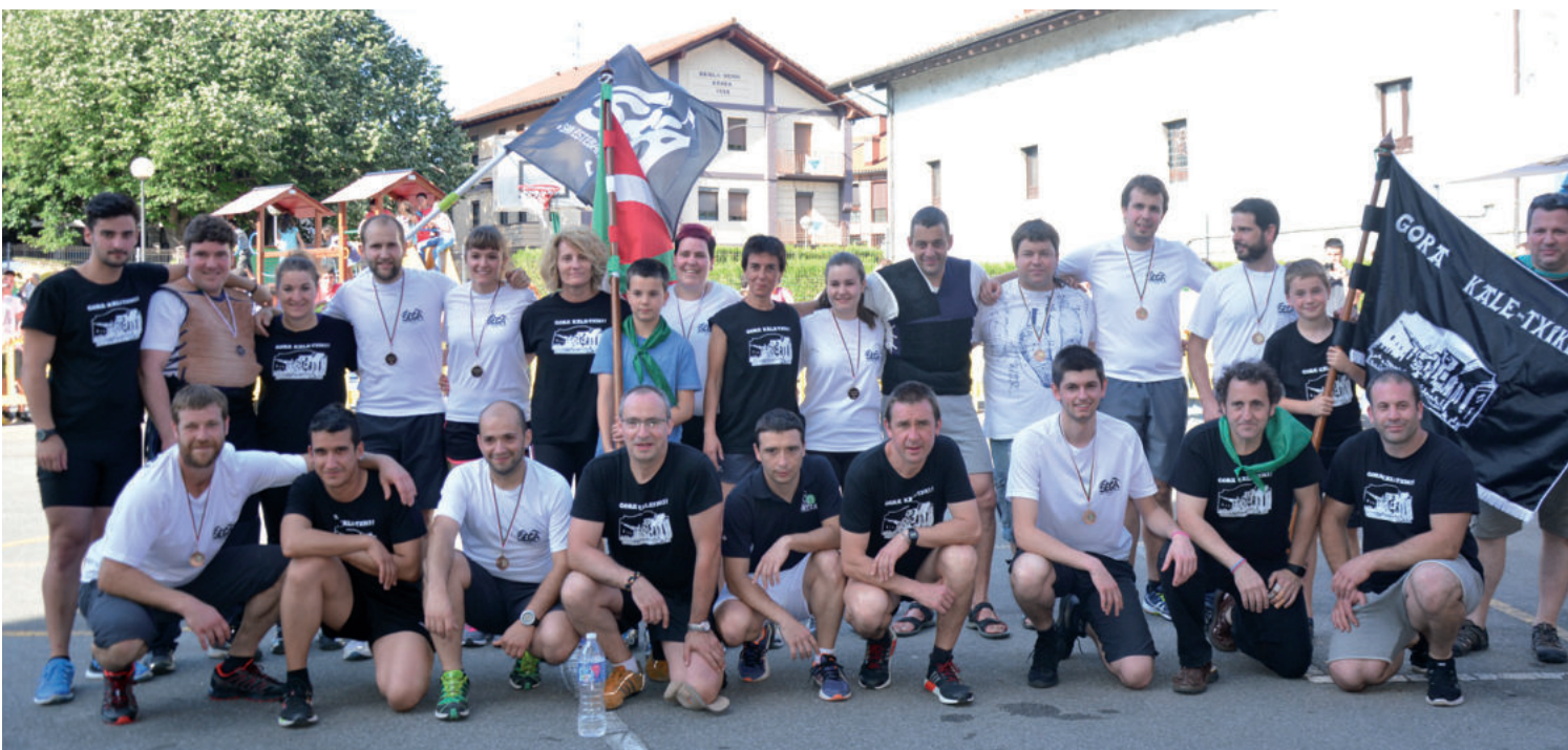
San Esteban auzoko eta Kaletxikiko kideak igande arratsaldeko herri kirol lehiaren ondorengo taldeko argazkian.

San Estebango gazteak irten ziren garaile Kaletxikikoen aurka egin zuten desafioan.