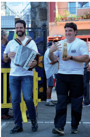
Goiburuarrek trikiti doinuen atzetik kalejiran egin zuten desafiorako sarbidea.

Ospakizun betean ibili eta gero, hondeamakinek auzunea laister hankaz gora jarriko dute. Ur hoditeri berria sartzeko eta eraikin zaharrak eraisteko beste "musika" bat nagusituko da orain, obrek ateratako hostek eskainiko dutena.