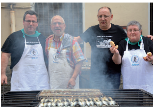
Sardinak erretzen eta zerbitzitzen ibili ziren auzokideak.