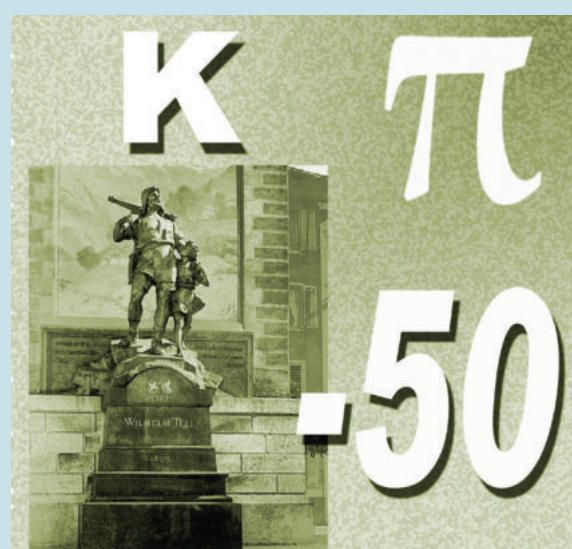
Zutariaren goiko atala