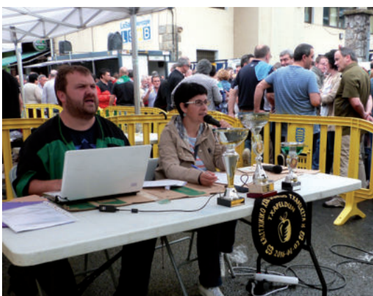
Etxeberria eta Aiertza lan eta lan sagardo dastaketan.