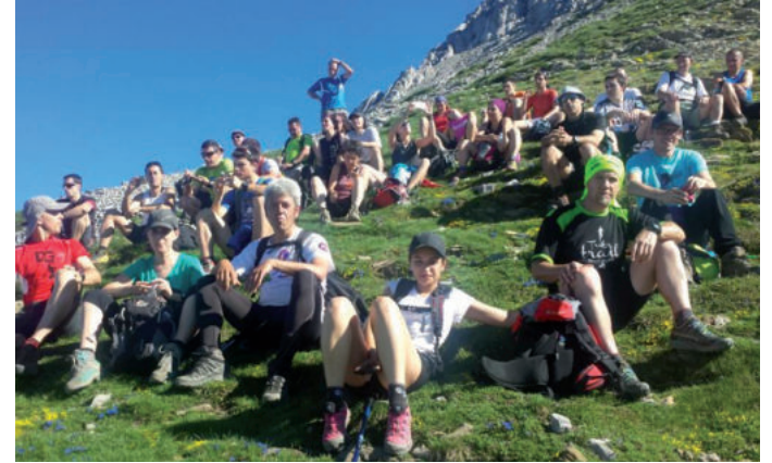
Eguraldi ederrarekin igoera egin zuten Bisaurinera.

Ikasturteari amaiera gogoan-garria eman diote Zanpatuz mendi elkarteko kideek, aste-buru osoko egonaldiarekin. Gozatu handia hartu zuten Bisaurin gainean, aurreko igandean. Denera, 40 lagun egon ziren Lizarako aterpean eta horietatik 35 igo ziren Bisaurinera. Argazkiak ikusgai ipini dituzte Zanpatuz.eus webgunean.