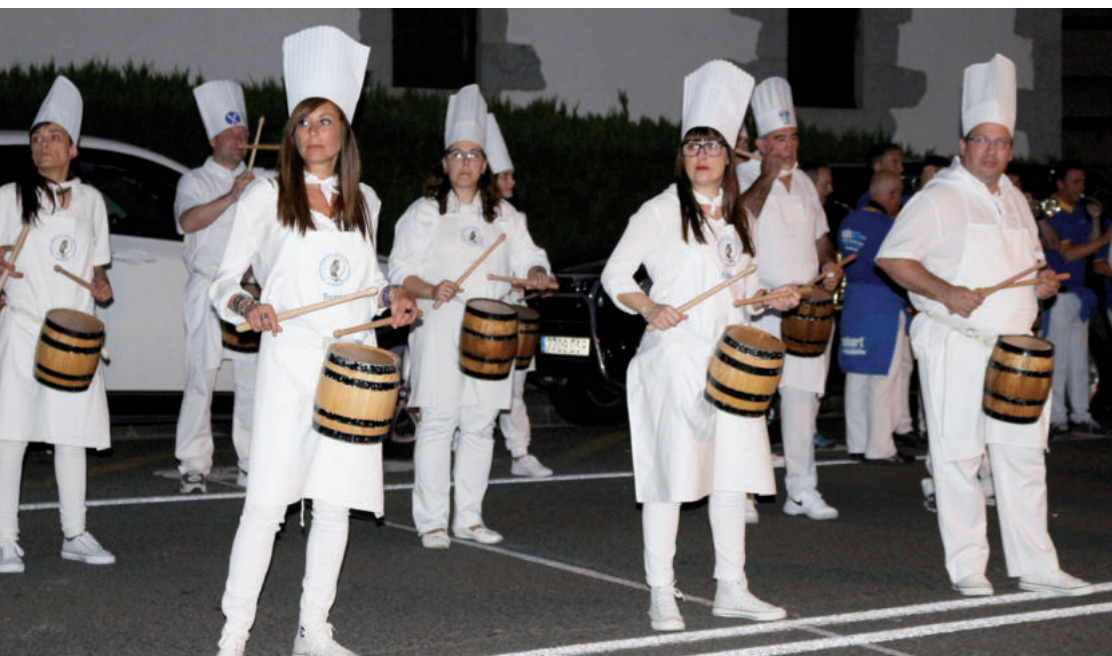
Danborrada larunbat gauean, Berrozpeko ermitara sartu aurretik.