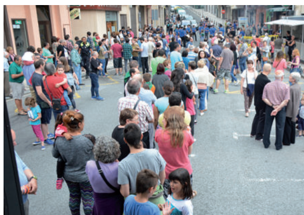
Ilara luzeak sortu ziren sardin jatean.