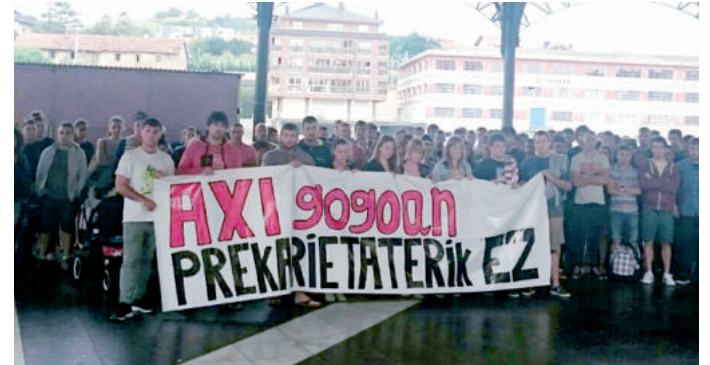
Orioko eta Aiako lagunek astelehen arratsaldean bilkura egin zuten Orion.