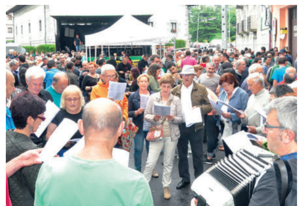
Kantujira taldea larunbat eguerdian jai girotzen aritu zen.