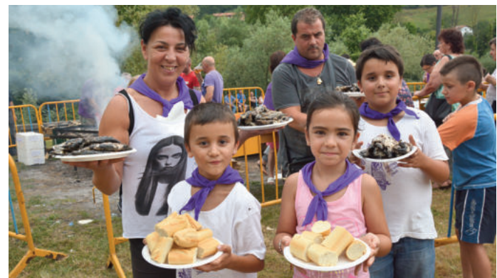
Sardin jatea Karrikako jaietako hitzordu klasikoetakoa da.