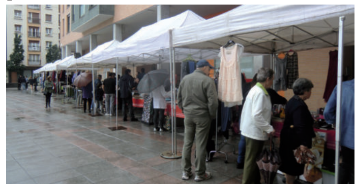
Postu ugari ipini zituzten Zumea plaza osoan.

Diskoak, liburuak, jostailuak, arropa,... prezio onean produktu ugari erosteko au-