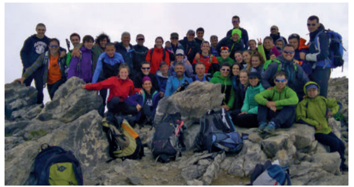
Zanpatuz mendi elkarteak irteera jendetsuak antolatzen darrai.

Zanpatuz Mendi Elkarteak Hiru Erregeen Mahaira irteera antolatu zuen aurreko asteburuan. 41 lagunek eman zuten izena, Linzako aterpetik gailurrera igotzeko, eta denak igo ziren Euskal Herriko gailur garaienera. Erritmo lasaian, taldea batzeko geldialdiak eginez, 3 ordu eta 45 minututan gailurrean ziren kide guztiak. Ordu erditxoko geldialdia eta gero, behearazko bidetara heldu aterpera. Han errekan hankak freskatu eta egarria asetu ostean, bueltako bidetara ekin zioten, Urnietara iluntzeko 20:30ak aldera iristeko.