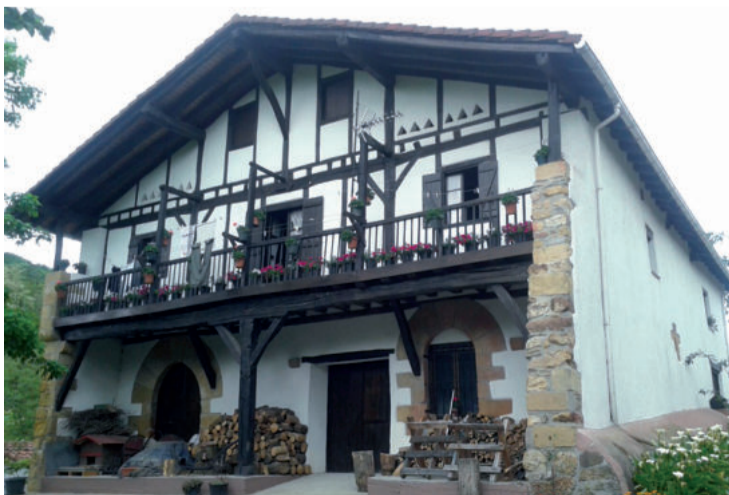
Errenterian dago Txirrita baserria.

Nolatan ez zen ezkondu, eta inoiz andregairik izan al zuen galderari, honela erantzun zion Txirritak: "behin izan nuen andregai bat, ordubete iraun zidan. Donostiako Loialako Txomin-eneako erromerian izan zen. Berarekin paseatzen nindoan, eta erroskila batzuk erosi nizkion. Gogoan ez dudana bertsolari batek erromerian bat bota zidan, eta neska utzi eta bertsotara joan nintzen. Ez dakit zenbat luzatu zen bertso saioa, baina, berak soldadu batekin alde egin zuen, nire begiekin ikusi nituen nola zihoa zen paseoan nik erositako erroskilak janez".