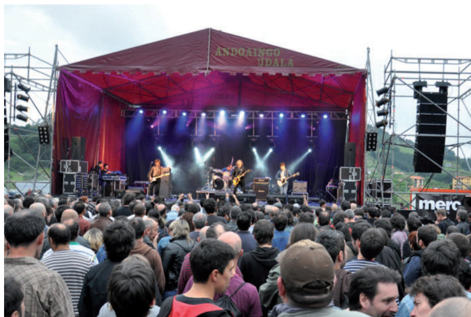
Nafarroa plazan rockzaleez beteko da larunbat honetan ere.

Euskal musikagintzan aski ezagunak eta maitatuak, euskaraz abestuz kantu sorta ederra sortu dute.