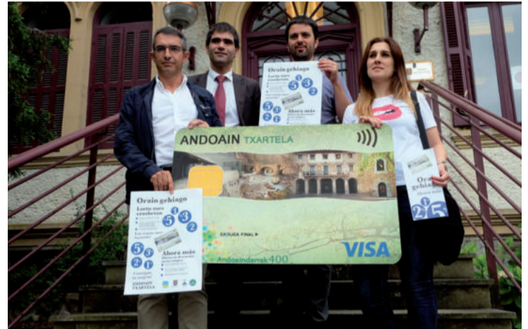
Salkineko eta Udaleko ordezkariak azken kanpainaren aurkezpen ekitaldian.

Kanpainaren hasieran txartela eskuratu ez zuenak oraindik ere aukera hori badu. Doakoa da eta ez da banketxez aldatu behar. Abantailez gozatzeko aukera erraza da.