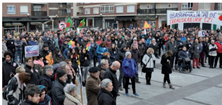
Martxoan Andoainen egin zen manifestazioaren irudia.