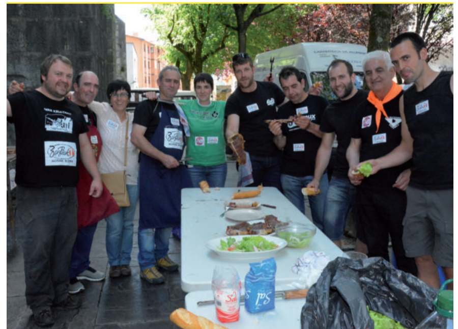
Auzo ezberdinetako kideak iazko txuleta jatean.

AUZOETAKO JAI BATZORDEEN EKARPENA HERRIKO JAIEN EGITARAUAN. GOIKOPLAZAN EGINGO DUTE, IAZ BEZALA.