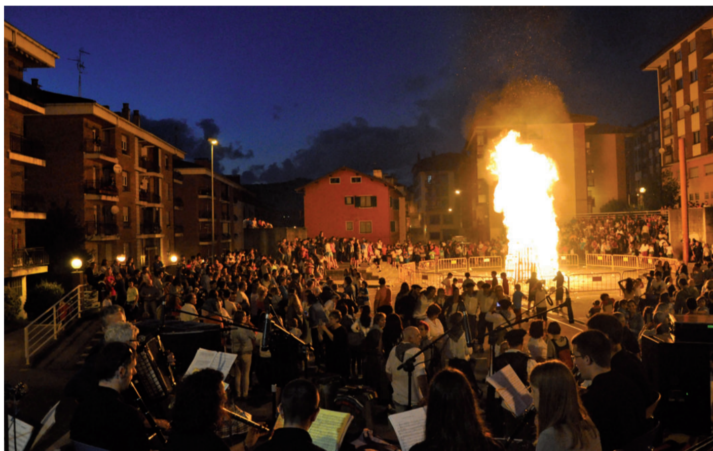
Txanbolin taldeko musikariak San Juan sua piztu zenean.