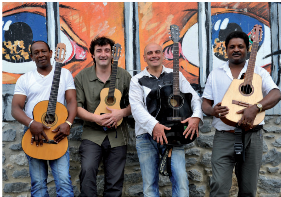
La Jodedera zuzenean arituko da uztailaren 3an, Sorginaren igoeraren aurretik.