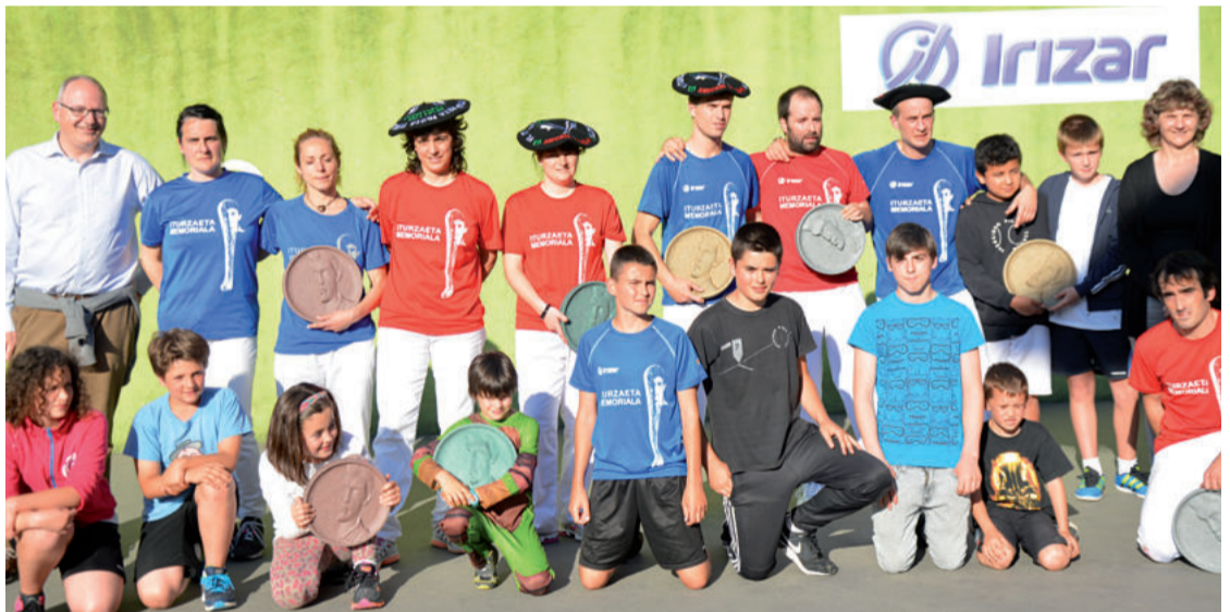
Keler taldekoak garaipenaren sari guztiekin. Behean, hirugarren postuan sailkatutako Academia GF taldeko kideak.

Sorabillako frontoia txiki geratu zen bi partida ikusgarri ikustera hurbildu zirentzat.