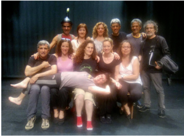
Antzerki tailerreko kideak entsegu ugari egiten aritu dira azken egunotan.