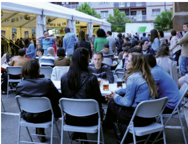
Ostegunetik igandera Garagardo Azokaren edizio berria Arrateren kanpoaldean. Arratsaldeko 18:00etan irekiko dituzte ateak, azokako lau egunetan.