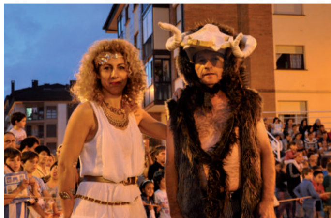
Iazko antzezlaneko protagonista nagusietakoak.