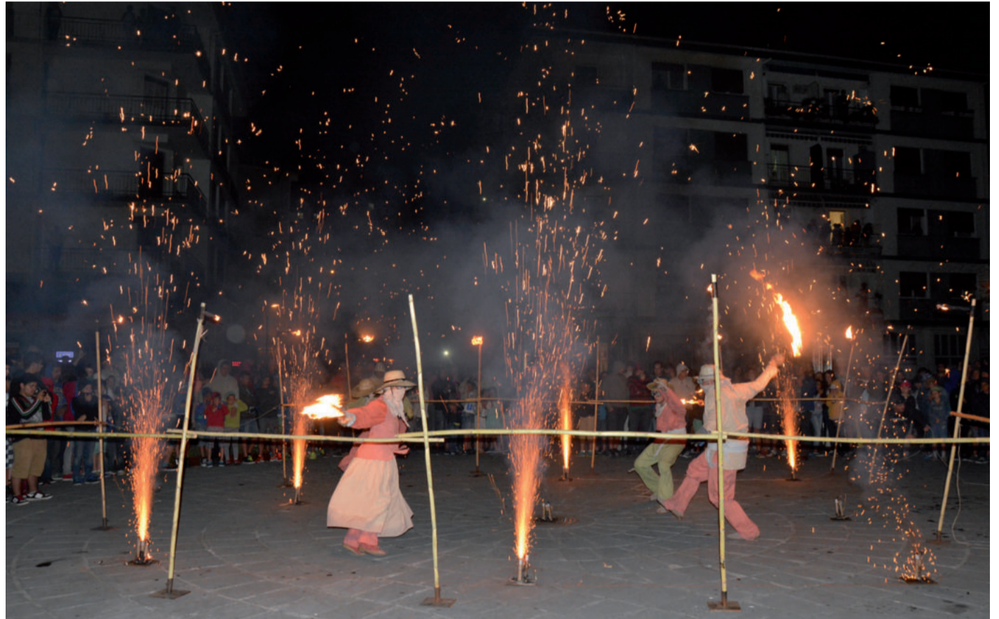
San Juan suarekin hasi eta Cavalfoc su ikuskizunarekin amaituko dira aurtengo jaiak.