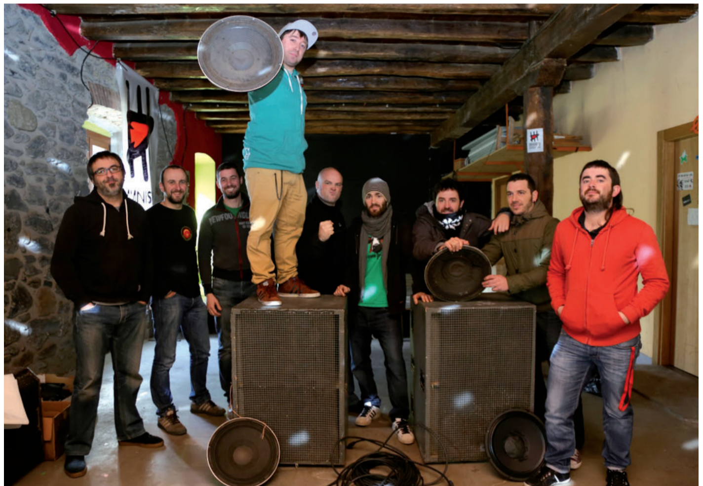
Esne Beltzako kideak zuzenean arituko dira ekainaren 25ean, larunbatarekin, Nafarroa plazan.

Taldeak hain bereak dituen reagea eta hip hop doinuei eutsi die disko honetan ere. Hitzei dagokienez, berriz,