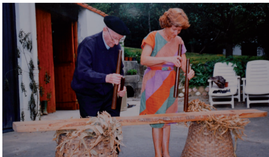
Aita eta alaba txalaparta jotzen familia giroan, Sausta baserrian.