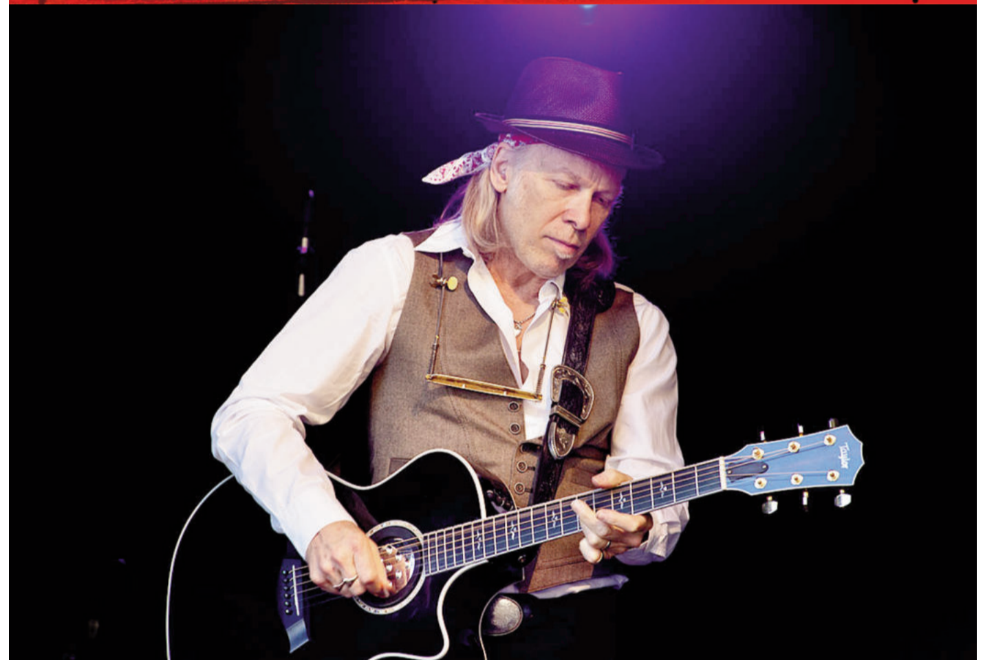
Elliot Murphy kantari ezaguna taldearekin batera zuzenean arituko da Nafarroa plazan.