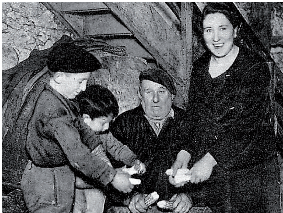
Txirrita artoa aletzen bere iloba eta honen semearekin, Altzako Gazteluene baserrian.

Pello Errota eta biek elkarri barkatu nahi ez, eta Andoai-