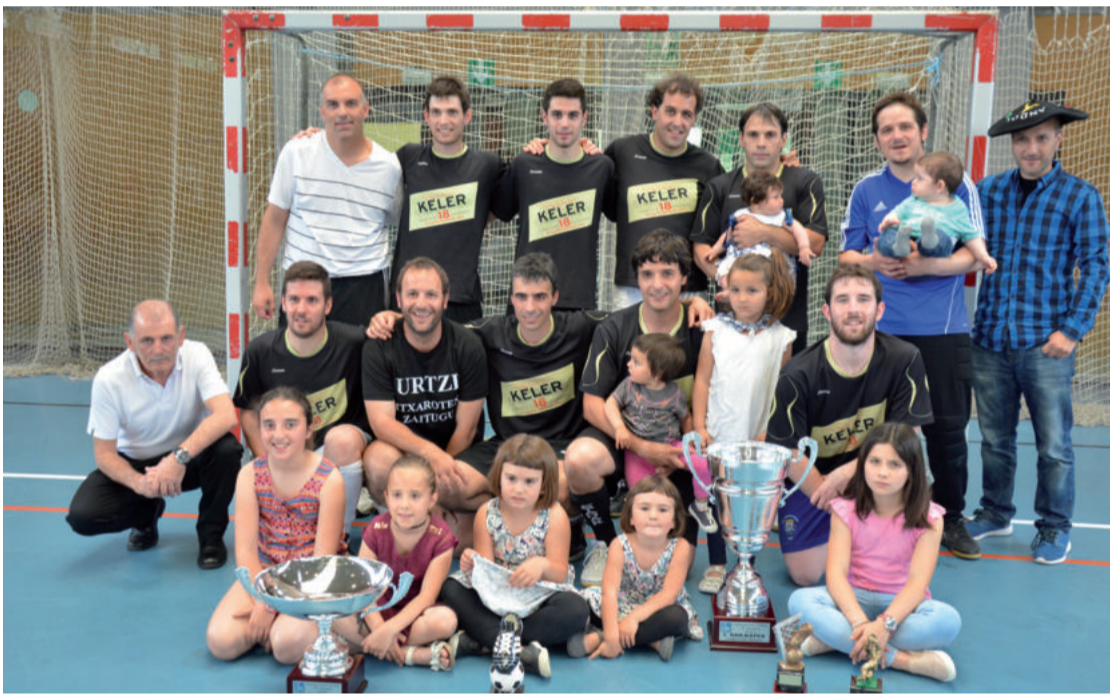
Keler taldekoak garaipenaren sari guztiekin. Behean, txapeldun-ordeak.