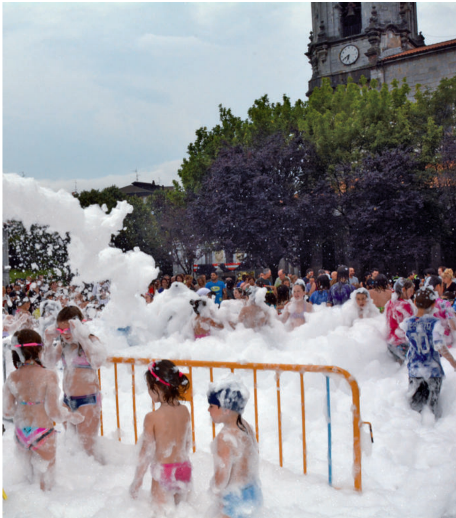
Apar festa eta bizikleta festa ekainaren 25ean, larunbatarekin, Goikoplazan.