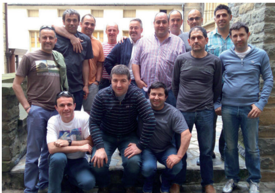
Zenbat zeate? koadrilako hainbat lagun, argazkian.

DUELA HOGEITA BOST URTE 'ZENBAT ZEATE?' TALDEKO KIDEEK PLAZARATU ZUTEN SANPEDROETAKO LEHEN BLUSA.