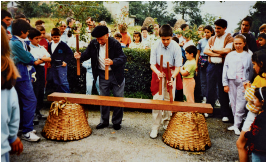
Aitona eta biloba bikote gisa Goiburua auzoan, Andoaingo ikastolak 1988an ospatu zuten jaietan.

zior lekukoa. “Txalaparta guztizkoa zen berarentzat, eta bere tokia hartzeko eskatu zidan. Era horretan, aita eman-dako agindua betetzen ari naiz urtez urte; ohore bat da nire semearentzat eta biontzat hark eutsi zion tradizioari jarraipena ematea. Andoaingo herriak deitzen digun bitartean, prest egongo gara Sanjuan festari gure ekarpena egiteko, dakiguna eginez”.