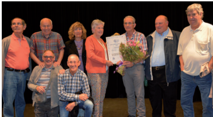
Omenduak Euskalduna Mendigoizale elkarteko kideekin batera.

berri jasotzen bada ere, beste lan bat aitortu nahi dugu, zuek biok isilean egiten duzuen, borondatez osoz eta musutruk. Jarduera fisiko osasuntsua aldarrikatu behar da, eta hor lan handia egiten duzue".