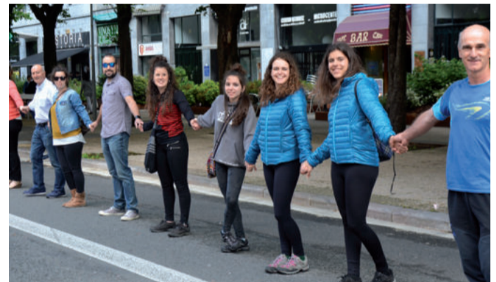
Gazte festak izan arren, festazale batzuk giza-katean parte hartu zuten.

Aurreko igande eguerdian milaka lagun bildu den Donostian, erraustegiaren egi-