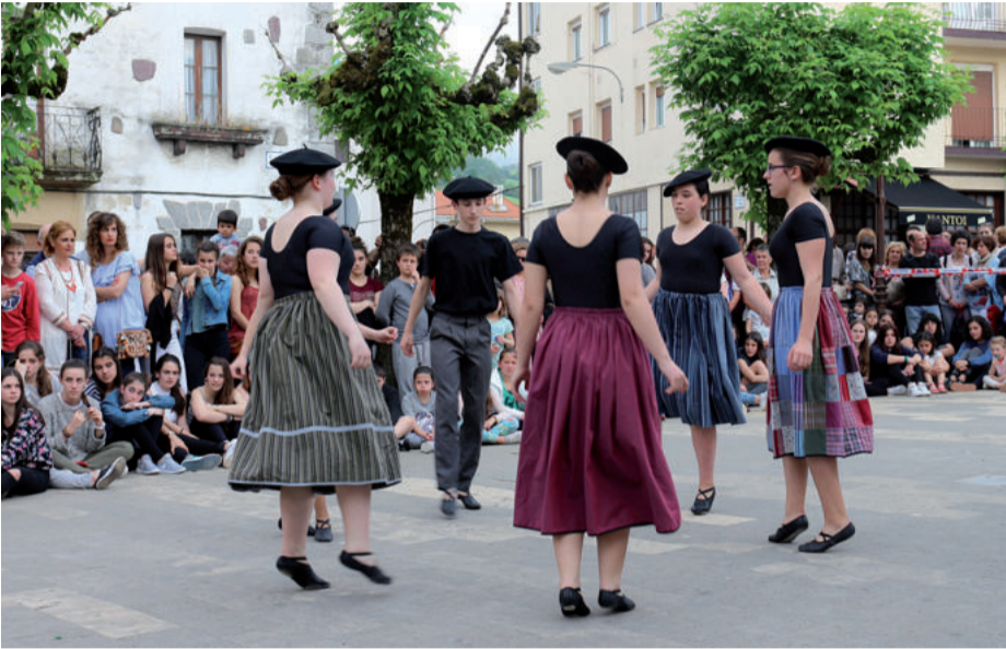
Txupinazoa bota eta gero, Egape dantza taldekoek hainbat dantza eskaini zituzten plazan.

Urnieta Dantzan ekimena hamargarren ediziora iritsi dela eta, dantzariak izan zuten 2016ko Gazte festen txupina botatze-