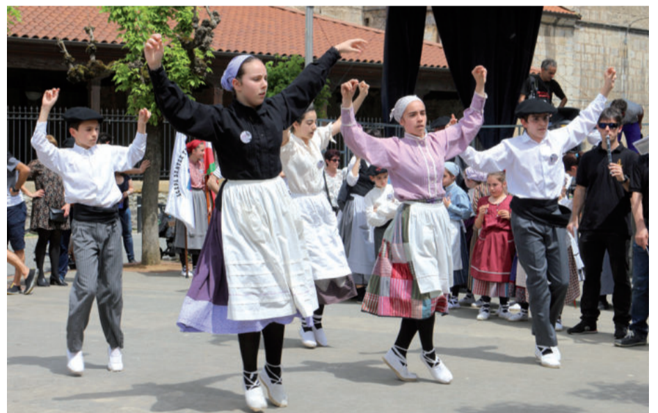
Dantzari txikien saioa plazan izan zen. Hain txiki ez direnak ere Txanbolinen doinupean aritu ziren.