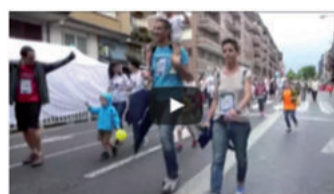
Pausokaren martxa egokitua