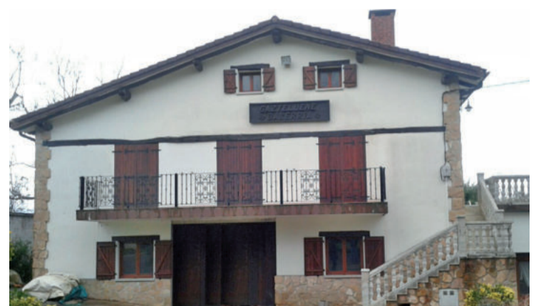
Donostiako Altza auzoko Gazteluene baserria. Bertan hil zen Txirrita 1936. urteko ekainaren 3an. Ostiral honetan Txirrita hil zela larogei urte betetzen dira.

Eskola zaharreko bertsolari mutil zahar, parrandazale eta pikaroren prototipoa bihurtu da Txirrita euskal iruditerian. Hargin ona izan arren, ez omen zitzaion lan egitea askorik gustatzen eta ahal zuen guztietan jai hartzen omen zuen tabernan edo sagardote-