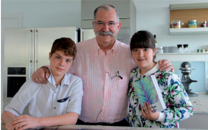
Pedro Subijana sukaldari ezagunak jaso du liburuaren ale bat.

Salesiar ikastetxeko ziklo ezberdinetako ikasleek sukaldaritzari buruzko liburu pedagogikoa idatzi, diseinatu eta ekoiztu dute. Harrera ezin hobea izan du liburuak, ospe handiko sukaldari oniritzia eman baitiote. Liburu argigarria da sukaldaritzarekin eta urteko zikloen martxarekin interesa izan dezakeenarentzat. Azalpen argigarria eman zuten aurkezpen ekitaldian: “Jatea eta elikatzea ez direla gauza bera aztertuta, eta gizartean jatearen eta ez elikatzearen aldeko joera hartzen ari garela kontziente, garaian garaiko produktuen gida bat ekoizti dugu: Jan eta Izan. Hilabete bakoitzean zer erein, zer lan-