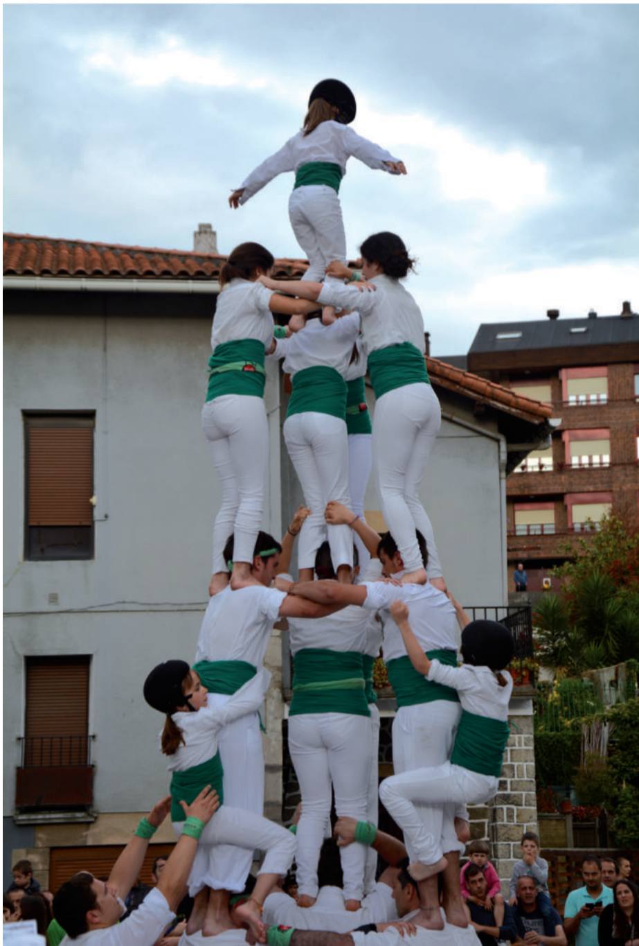
Giza dorre ikusgarriak sortu zituzten Urnietako kaleetan.