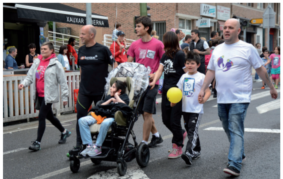
Pausokako kideak helmugara iristen.

“Ikusi Pausokakoak baso eta zelaiak, mendi tontor gainera igo behar dugu. Ez nekeak, ezta bide txarrak gora, gora...”, kantu ezagunaren birmoldaketa egokia