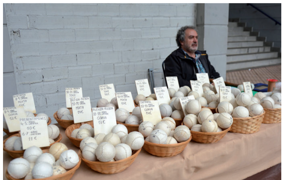
Eskuz eginiko molde ezberdinetako pilotak erosteko aukera izan zen artisau azokan.