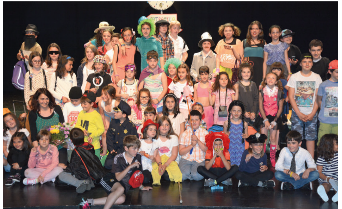
Antzerkilari gaztetxo ugari dabilta Katramila taldean.

Katramila antzerki taldearen lehen eguna ospatu zen larunbatean. Antzeppen herrikoia-aren aldeko aldarrikapena bilakatu zuten eguna Katramilako familia osatzen duten eragileek, antzezlariek, horien gurasoek eta herritarrek.