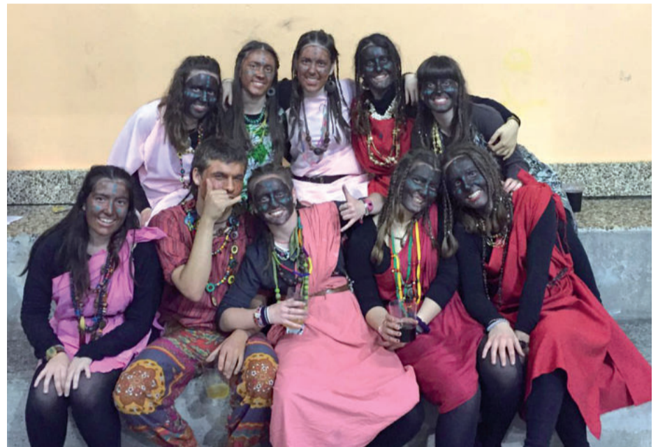
Afrika aldeko tribuen janariaz gozatzeko aukera izan zen afari kulturalen.

Poxta Zahar taldeak larunbat honetara aurreratu du paella jatea. Eguraldi onarekin San Juan plazan egingo dute, eta euriarekin bazkaria Azkorterera edota Egapera pasako dute.