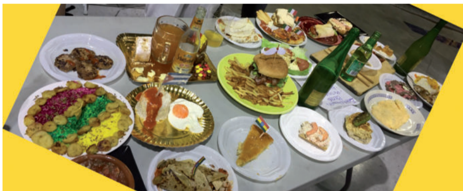
Herrialde ezberdinetako janariak mahai gainean, epaimahaiak azken erabakia hartu ahal izateko.

haiak hogeit hamar plater ezberdinen artean erabaki behar izan zuen. Lanak izan zituzten, baina azkenean lehen saria Italia aldera joan zen. Datorren urtean ekimen berdina ez bada ere, antzeko zerbait egitekotan dira.