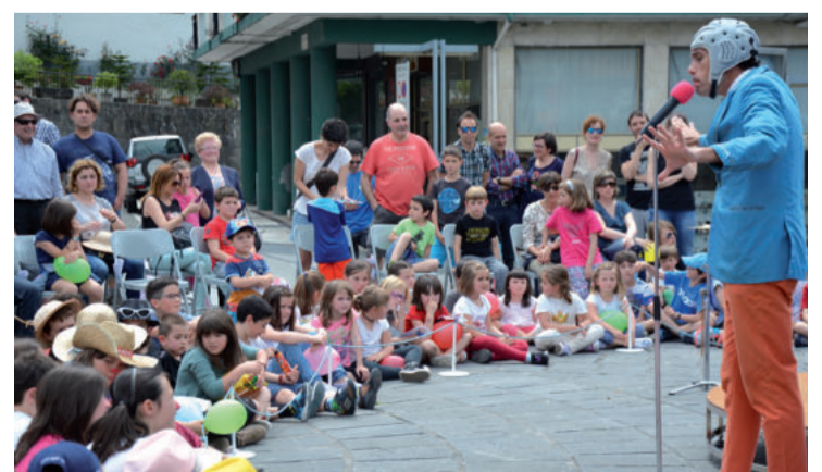
Walk man antzerkilaria, Bastero plazan.