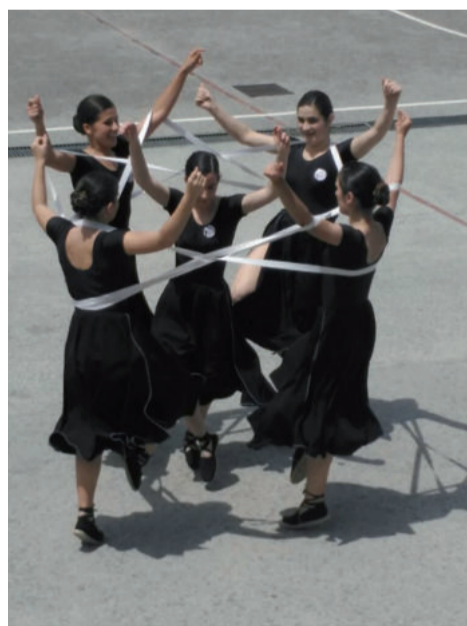
Gomarekin saio ikusgarria osatu zuten.