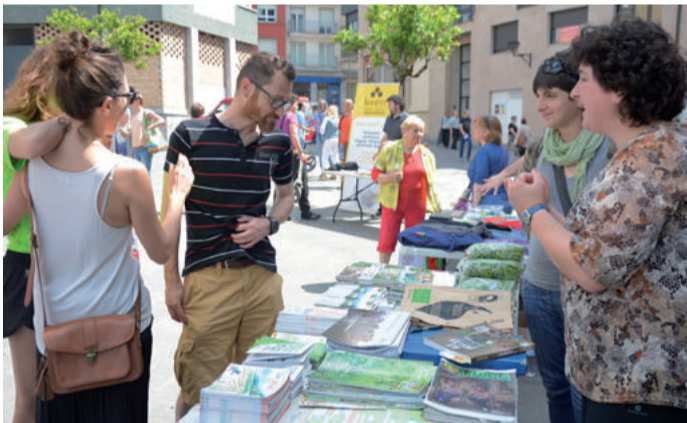
Aspila baserriko kideak elikadura ekologikoaren aldeko apostua egiten ari dira.

Informazioa zabaltzen izan ziren ere gizarte izaerako Andoango hainbat elkarte. Besteak beste, Caritas, Eguzki, Kaleratzeak Stop edota La Salle Berrozpe ikastetxeko "Promozioa eta garapena" Gobernu Kanpoko Erakundea.