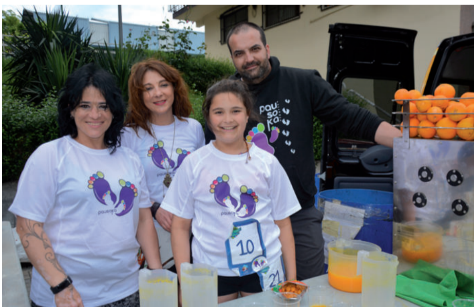
Ospakizuna aurrera atera bazen, dozenaka laguntzaile eta bolondresen lanari esker izan zen.