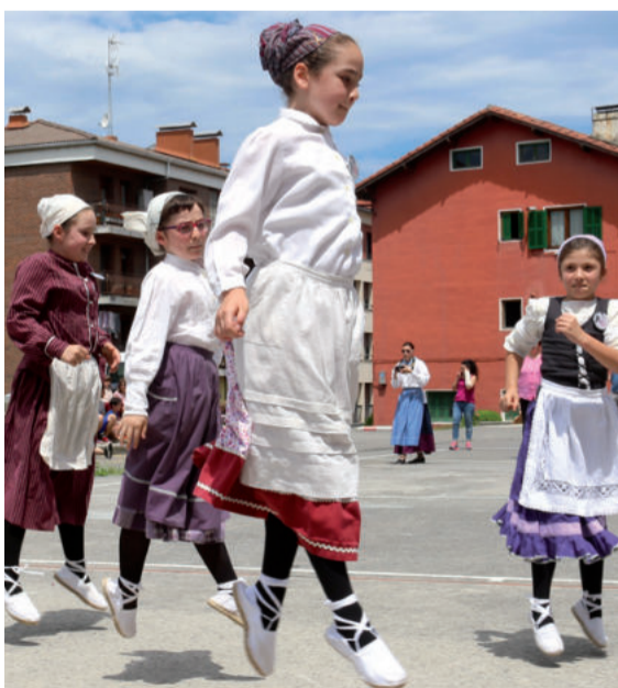
Haur, gazte eta heldu denak dantzan aritu ziren.