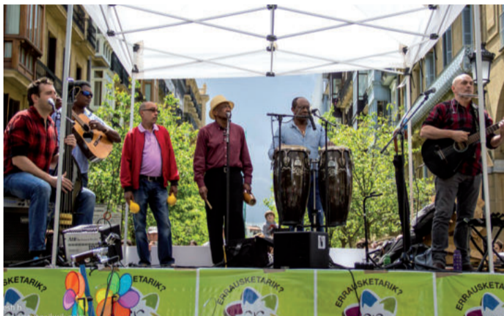
La Jodedera taldeak azken ekitaldian parte hartu zuen.