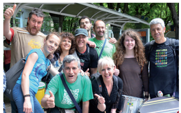
Buruntzantzan taldekoek euren musika Donostiako kaleetara eraman zuten.

tasmoa geratzeko eskatuz. Tartean hainbat urnietar bildu ziren Madrid etorbidean.