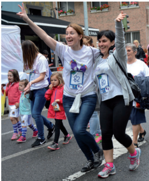
Helmugara iristearren poza ondoko hiru argazkietan.