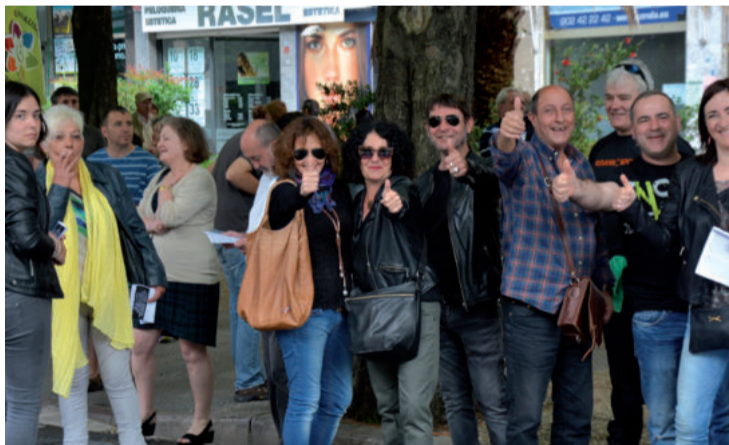
Andoaindik hirurehun kideak gora hurbildu ziren Donostiara.