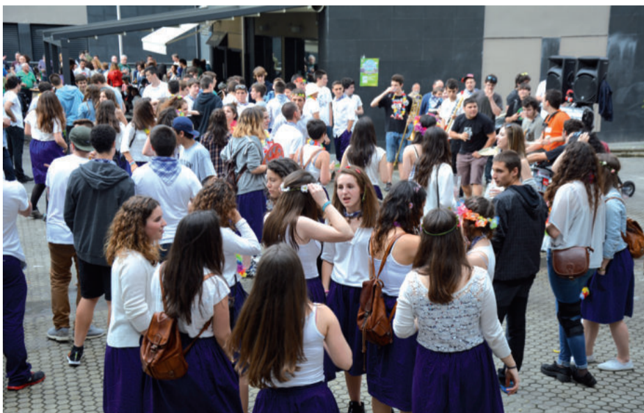
Kalejira ibilariak jarraitzaileen artean hainbat gazte koadrila izan zituen.