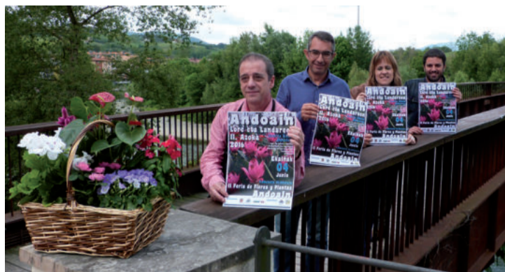
Andoaingo Beteiloreekin batera Salkin, Behemendi eta Udaleko ordezkariak.

Goizeko 09:00etan zabalduko dituzte postuak, eguerdiko 14:00ak bitarte. Landareen kulturaren sakontzea eta herriko merkataritza sustatzea azokaren helburu nagusiak dira.