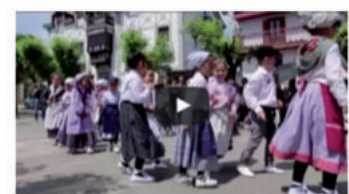
Dantzari txikien emanaldia