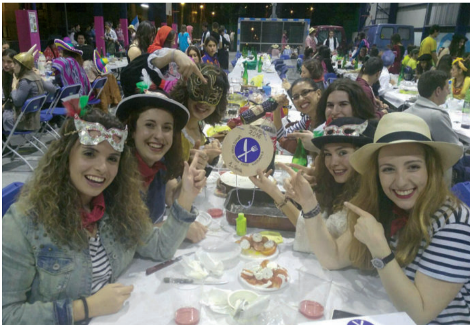
Afari kulturalen lehen saria eskuratu zuen taldea.

Poxta Zahar taldekoak pozarren daude iazko parte hartzea handitu delako, bereziki gazteagoak direnen aldetik. Herri bazkariaren edota afari kulturalaren parte hartzea dira poz hori agertzeko neurgailuak, bi jardueretan ere herrikide ugari hurbildu zirelako.