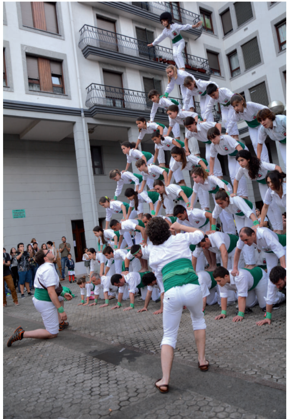
Sinkronizazio handia eskatzen duten giza figurak sortu zituzten. Urnietarrek txalo egin zuten, gogoz.

L aster arte! Fins aviat! Horrela-koak adieraziz elkar agurtu zuten euskaldunek eta kartalanez gazte festen amaieran. Larunbat arratsaldeko ospakizuna gogoangarria izan baitzen, Urnietan gutxitan ikusten den horietakoa. Bereziki Idiazabal kale inguruko giroa nabarmendu beharko litzateke, Gazte festen ekimen ezberdinek bat egin zutenean: Urnieta dantzan, Vilafranca del Penedes herriko falcons era-