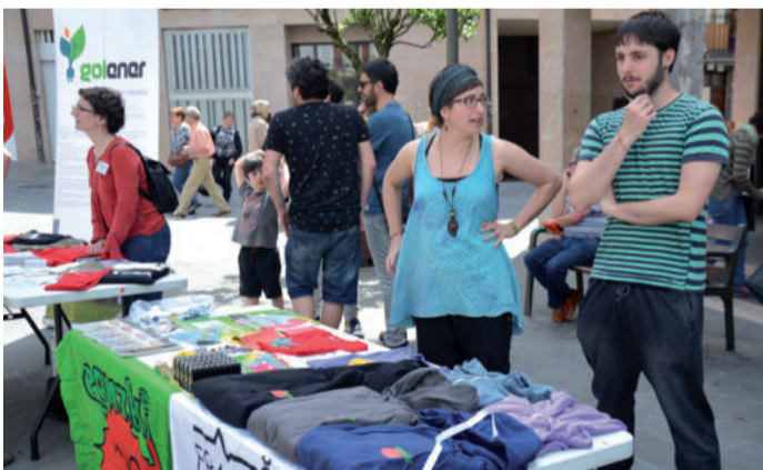
Eguzki talde ekologistako kideak, Goienereko kideen alboan.