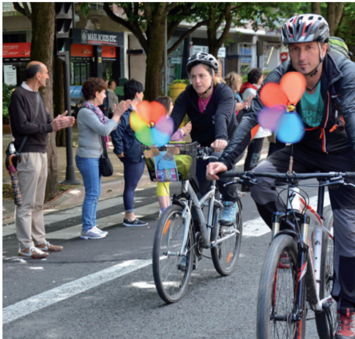
Igandeko giza-katean Buruntzaldeko herrikideak Madrid etorbidean izan ziren.