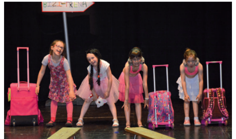
Bizi trena antzezanaren une bat.

Antzeppena maite duten zenbait herritarrek eratu zuten Katramila orain bost urte, eta hazten joan da urtez urte, antzerkirako zaletasuna herrian sustatzen. Hamaika talde eta ehunetik gora antzezleri dituzten taldeak egun.