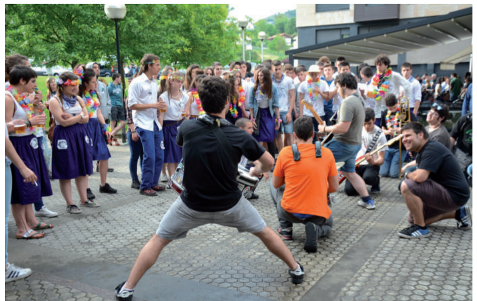
Giro polita sortu zuten Elektrotxufia taldekoek, kalez kale musika joz.