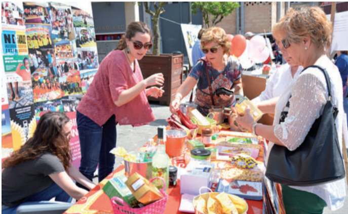
Argazkiko La Salleko ikasleak "Promozioa eta Garapena" GKEko kide dira.

Aurreko astean banka etikoa eta ekonomia soziala hizpide izan ziren Andoainen. Larunbatean, esaterako, Juanita Alkain plazan azoka antolatu zuten erakunde ezberdinen parte hartzearekin. Bertan izan ziren, besteak beste, Aspila kontsumo taldeko kideak. Elikadura ekologikoa lantzeaz gain, ekoizlearen eta eroslearen arteko harreman zuzenari eusten ahalegintzen dira.