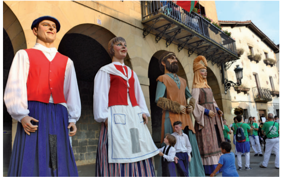
Buruhandi eta erraldoiak eta Bosko Anitz txaranga ezinbestekoak dira herriko jaietan.

ko ohorea. Lehendik ere protagonista izaten ziren jaien hasieran eskaintzen zuten saioagatik, baina aurtengoan haiei aitortu