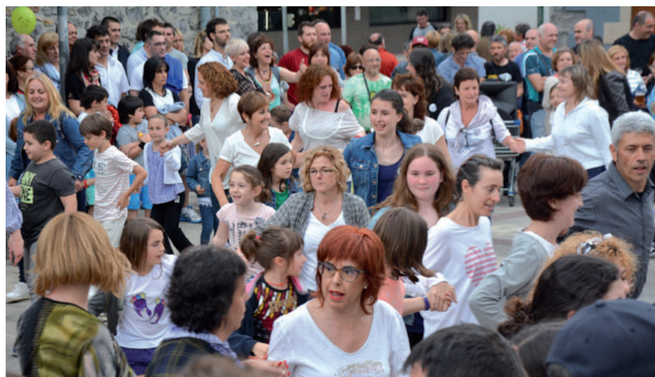
Adin guztietakoek parte hartu zuten kalejiran.