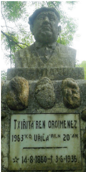
Hernaniko Ereñotzu auzoko Latze baserria zegoen lekuan Txirritari eraikitako oroigarria.

Txirritaren ospeak Gipuzkoako mugak gainditu zituen eta XX. mendearen lehenbiziko herenean Euskal Herri osoan famatua egin zen. Mingain zorrotz eta bizkorreko bertsolari-tzat nabarmendu zen, eta haren ateraldi umoretsuak askoren gogoan gorde dira. Gai sozialak lantzen diren bertsoetan garai hartako herri-klaseen pentsamolde eta sentimenez berri ematen da.