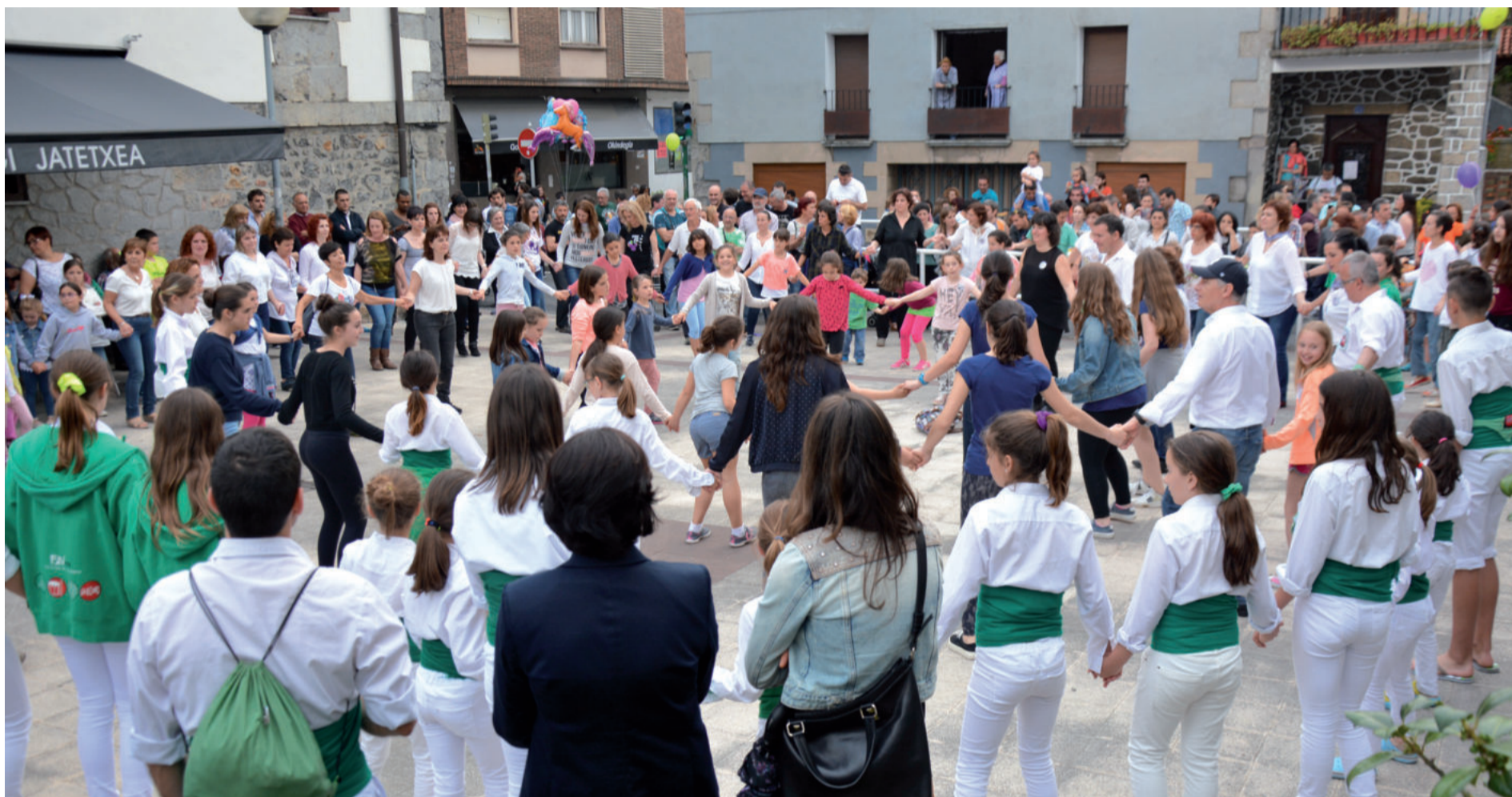
Egapeko dantzariak eta gurasoak, Kataluniatik etorritakoak... larunbat arratsaldean batzuen eta besteen saioak uztartuz saio ederra eskaini zieten herrikideei.