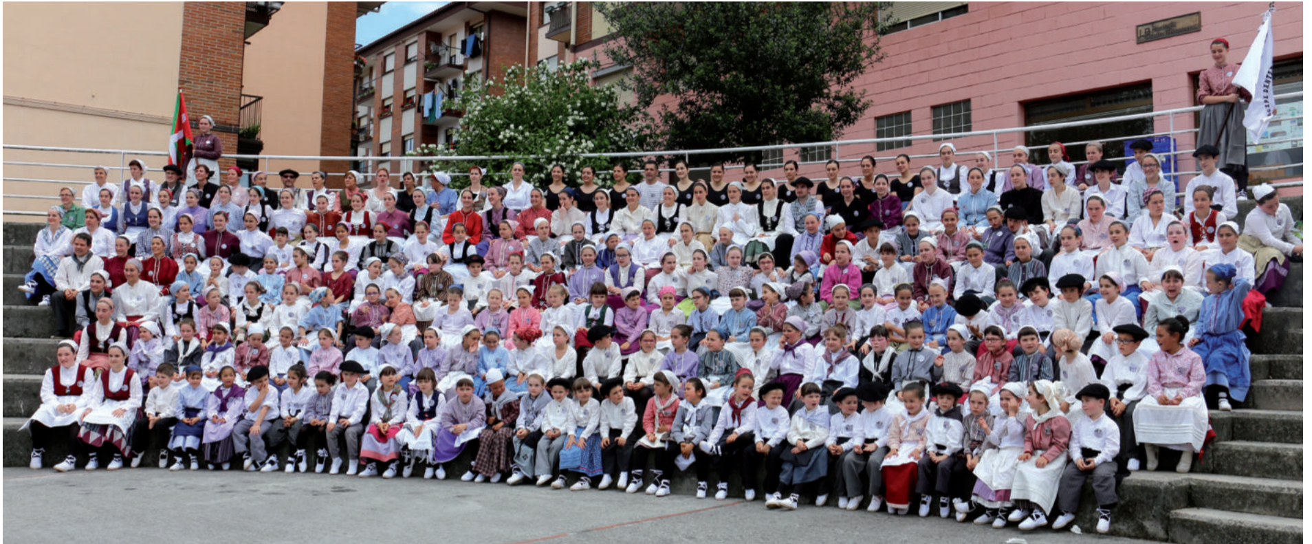
Urnietako dantzariak Urnieta Dantzan ekimenaren hamargarren edizioan taldeko argazkia ateratzeko elkartu ziren. 220 lagun izan ziren denera.