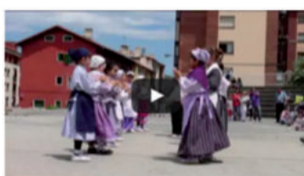
X. Urnieta Dantzan