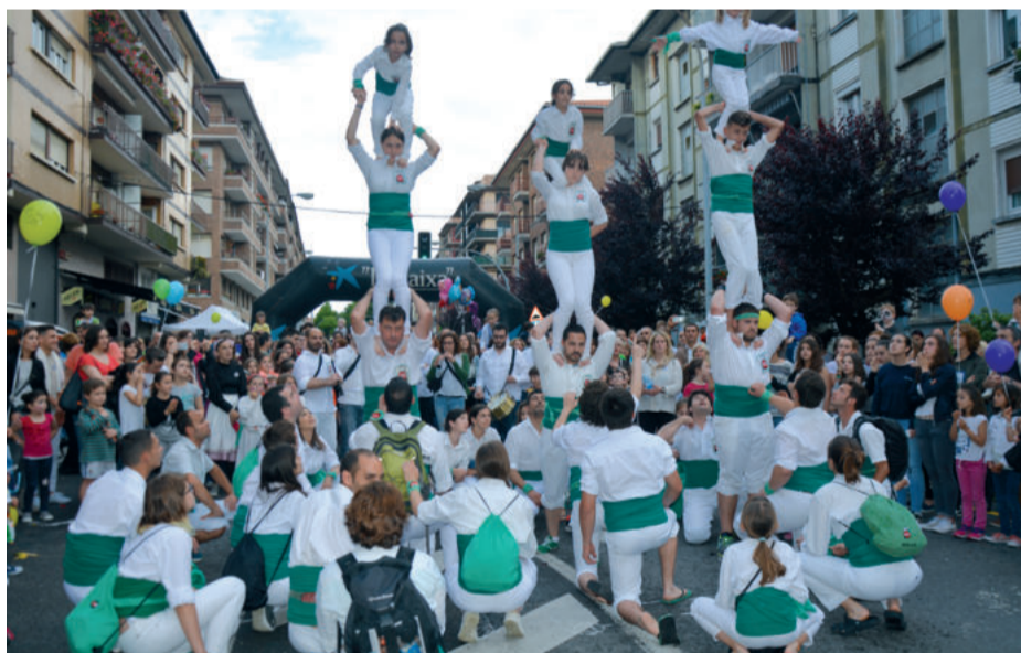
Giza dorre ezberdinak osatu zituzten Vilafrancako kideek, horietako bat Markelen etxearen parean.