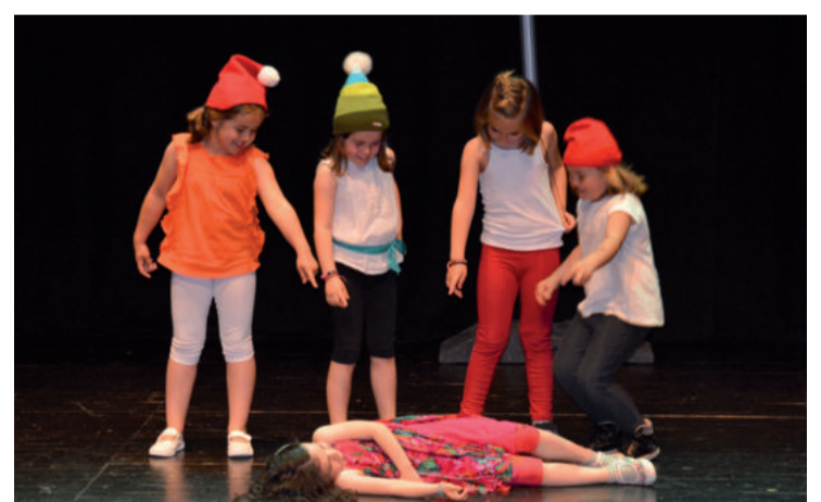
Une dibertigarri ugari izan ziren antzezan ezberdinetan.