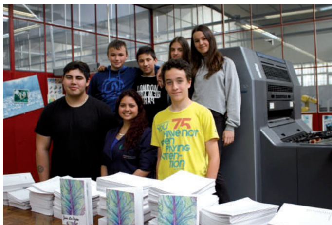
Egitasmoan parte hartu duten hainbat ikasle.

Salesiar ikastetxean proiektu eta erronken arabera irakaskuntza txertatzen ari dira, eta ostegun honetan arratsaldeko 17:00etan ikastetxean bertan aurkeztuko duten “Jan eta izan” liburuxka horren adibide garbia da. Elikadurari buruzko 30 orrialdeko lana da eta ikasleek eurek idatzi, maketatu eta inprimatu dute: DBH 1eko ikasleek Natur Zientziak, euskara, gaztelera, ingelera eta plastika arloetan edukia sortu dute, Lanbide Heziketako Diseinu Grafiko-