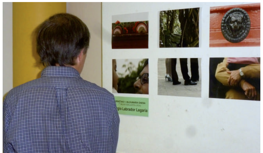
Argazki rallyko irabazleekin erakusketa ekainaren 13tik 24ra. Sari banaketa ekainaren 15ean da.

20:15-21:00 Bosko Anitz txarangaren kalejira San Juan plazatik abiatuta.