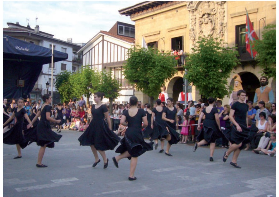
Erraldoi eta buruhandiak. Bosko anitz txaranga, dantza emanaldia,... Gazte jaien hasieran.

19:00-20:00 Herriko buruhandi eta erraldoien kalejira Plazido Muxika plazatik San Juan plazara Bosko Anitz txarangarekin.