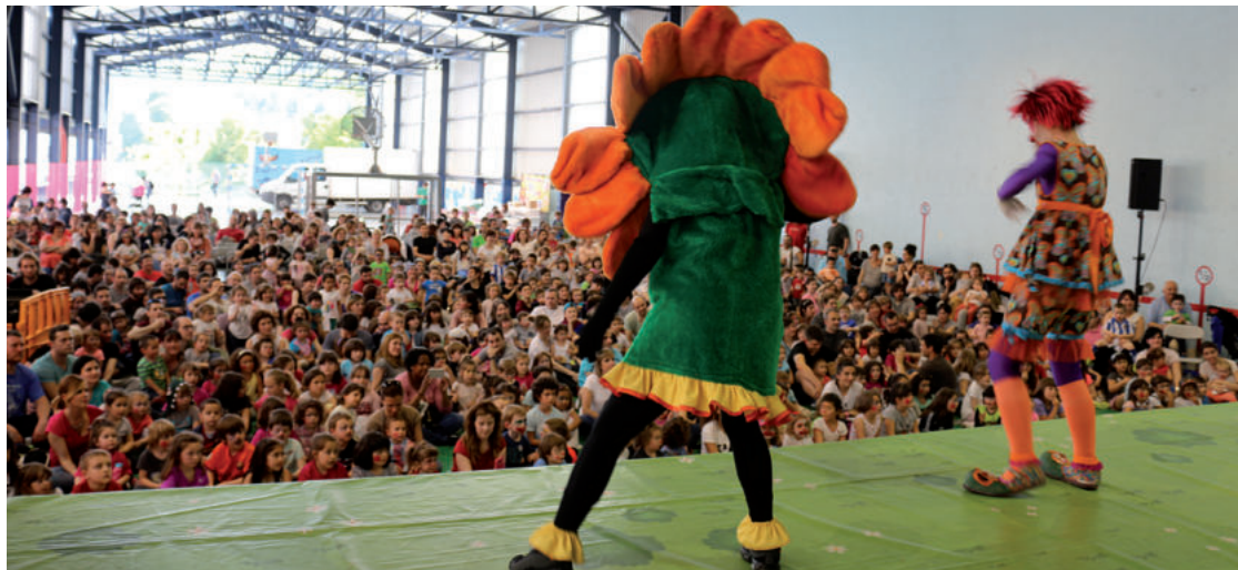
Jendetza bildu zen Urnietan, bostehun lagun, Egape ikastolako jolastoki estalian.

Azken urteetan egin bezala, muntai berri bakoitza aurteztara Urnietara hurbildu dira. Aurten, ordea, ezustekoarekin. Izan ere, Porrotx pailazoa gaxorik zen eta azken egunetako saioak bertan behera utzi behar izan ditu. Bere lekua ondo baino hobeto bete zuten Pirritx, Marimotots, Ilargi eta gainerako artistek. “Amalur” ikuskizunak beste behin ere herriko eta eskualdeko haur eta guraso askoren arreta piztu zuen, 500 lagunetik gora hurbildu baitziren.