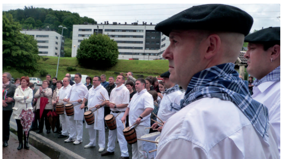
Elkarteko danbor jotzaileak eta barrilak elkartearen kanpoaldean, urteurreneko ekitaldian.