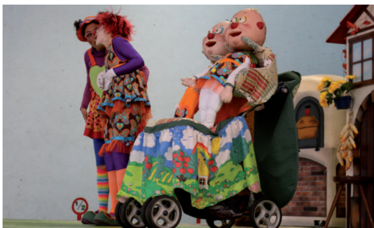
Pirritx eta Marimotots, Pupu eta Lorerekin batera.

İnistorak esker ona adierazi nahi die Urnietako Udaleri eskainitako babesagatik, Egape ikastolari laguntzagatik eta