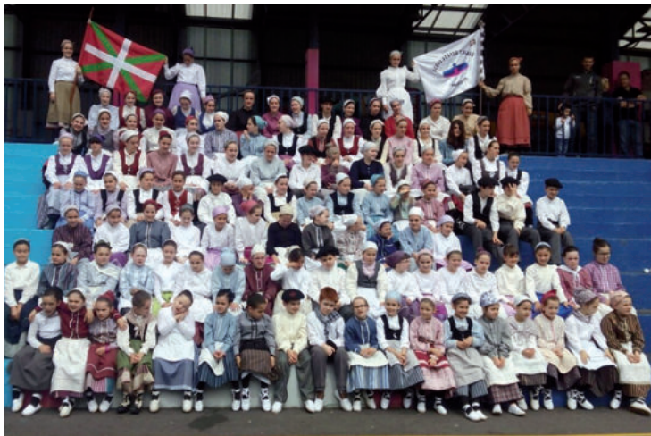
Urnietan dantzan egitasmoaren hamargarren edizioa ospatuko da aurten.

Urnietan dantzan ipiniko dute asteburu honetan. Inoiz baino gehiago, Egapek antolatzen duen “Urnietan Dantzan” eguna hamargarren edizioa iritsi baita. Euren eskutik iritsiko da jaien hasiera, txupinazioa botako baitute ostiral arratsaldean. Euskal dantzak garrantzia berezia izango du aurtengo Gazte jaietan. Ez da, ordea, jaietako pizgarri bakarra izango. Muxugoxo elkarteak ostiralean aurkezpena egingo du Saroben, arratsaldeko 18:00etan hasita. Aurkezpen ekitaldiaren ondoren, “Emaidazu muxugoxo bat” bertso saioa antola-