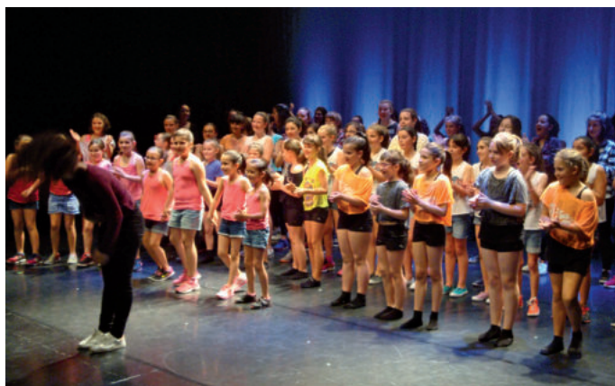
Dantzariak txalo zaparrada jaso zuten, ekitaldiaren amaieran.

Igandean funky dantzaz gozatzeko aukera izango da San Juan plazan, 18:30ean hasita.