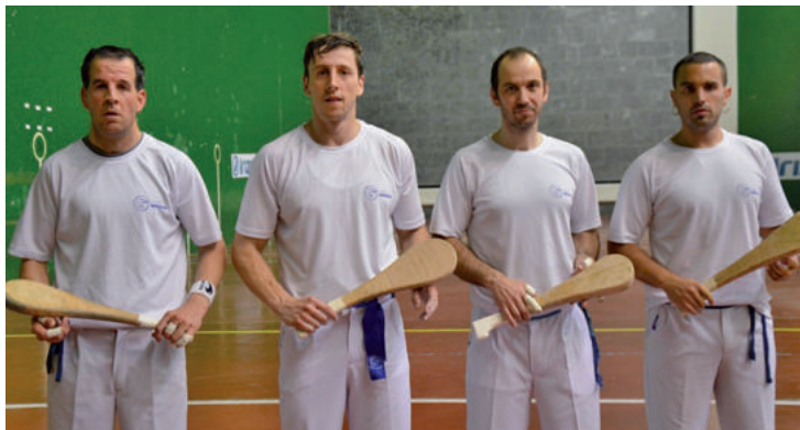
Lete, Altuna, Iradi eta Rekalde Andoain finaletik pauso batera, Gipuzkoakoan.

Andoingo taldeak lehendik ere badaki zer den Gipuzkoako herriarteko txapelketako finalera iristea, baita irabaztea ere, eta faboritotzat jotzen dira kanporaketan. Nolanahi ere, Arrateko frontoiaren aldean, neurri txikiagoak ditu Olaberriakoak, eta hartara egokitze-ko lanak izango dituzte. Zailtasun hori gaindituz gero, gauzak erraztuko zaizkie andoaindarrei.