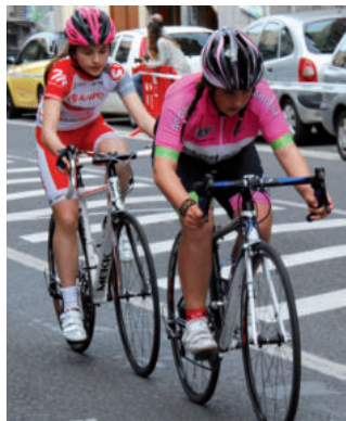
Idiazabal kalean egin zuten proba.