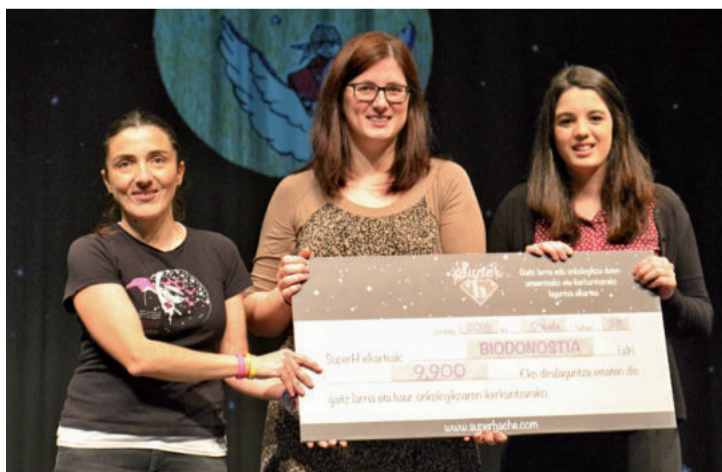
Biodonostiako kideek ia hamar mila euroko txekia jaso zuten Super Hren eskutik.