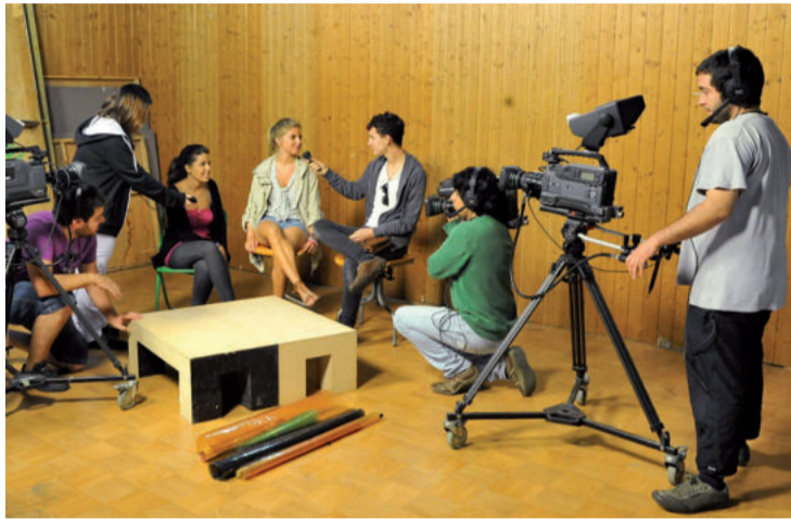
Zine eta bideo eskolako ikasleak.