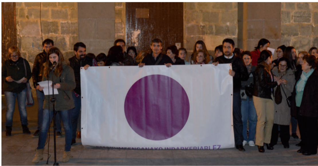
Martxoaren 8an, asteartea, elkarretaratzea egingo dute San Juan plazan iluntzeko 19:00etan hasita.

Bezperan, Udalak antolatutako duen kirolarien mahai-inguruan pala jokalaria ohia hizke-