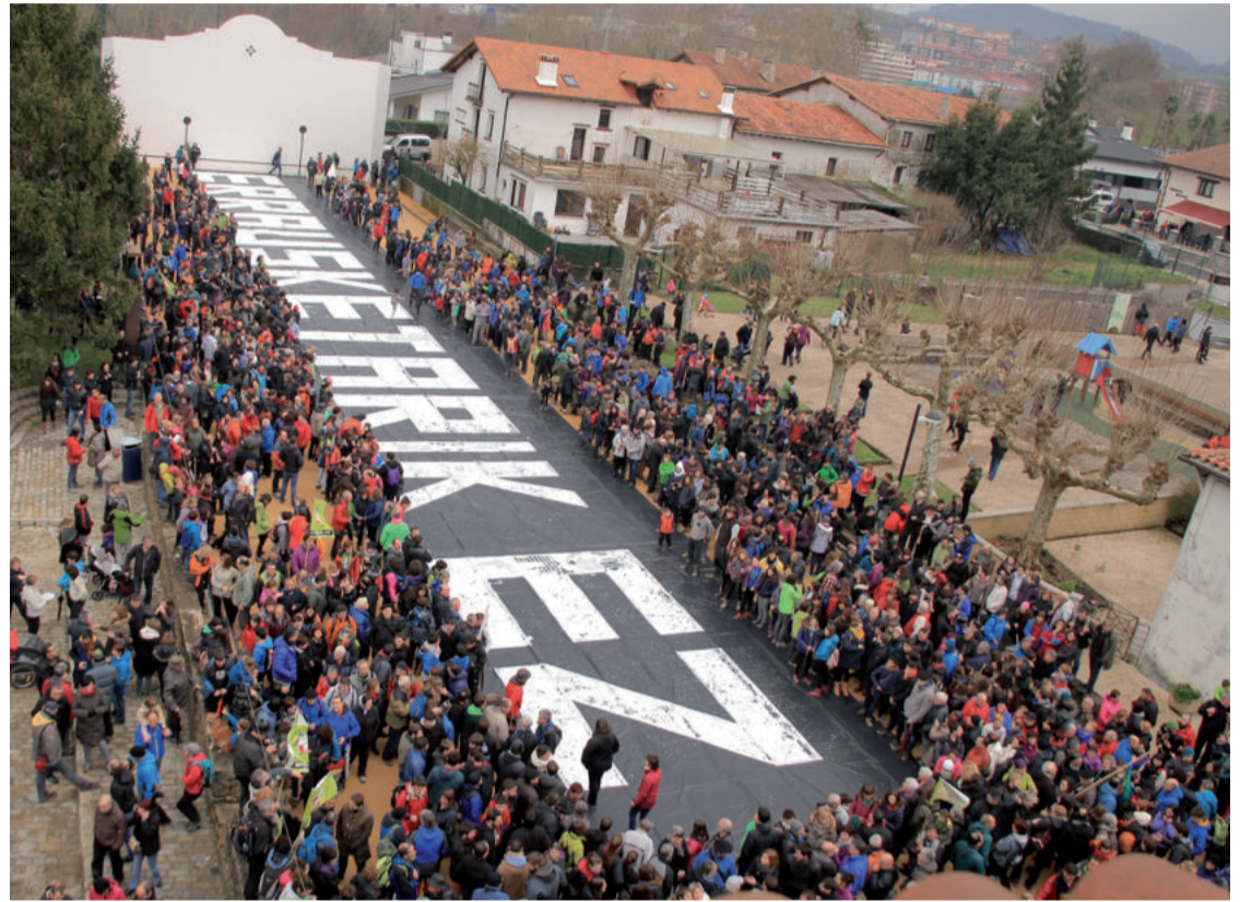
Antolatzaileen arabera bi mila lagun hurbildu ziren Zubietako azken ekitaldira. Tartean andoaindarrak eta urnietarrak zeuden.

Larunbatean haize bortitza, euria barra-barra eta negu giroa izan arren, erraustegiaren aurkako taldeek igandeko martxari eutsi zioten. Goizeko zortziretan Ipar Haizea plataformak deitutako hitzordura hogeita lagun bildu zituen Andoaingo merkatu plazan. Allurralde gain baseritik gora Belkoain aldera abiatu ziren Zubietako lurretara. Bidean, Aiztondo plataformako kideak zain zituzten. Azken zatia denek elkarrekin egin zuten. Beranduego, 09:30ak aldera, Urnietako San Juan plazatik herritar talde bat abiatu zen Lasarte-Oriako Okendo plazara. Handik dozenaka lagun erraustegia ipini nahi duten gunera abiatu