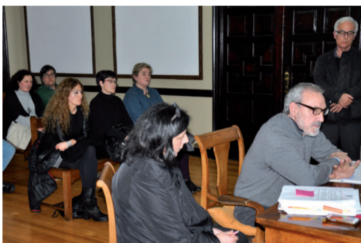
Eskolako zuzendariak hitza hartu zuen. Ikusleen artean hainbat irakasle zegoen.

Jende askok ez dakien arren, gure ikastetxean unibertsitate mailako ikasketak eskaintzen dira. Goi mailako graduak aitortzen ofiziala dauka; hain zuzen, unibertsitateko 120 kredituren parekoa, espezialitate bakoitzean. Hortaz, egin nahi diren planteamendu berriek, koherente jokatu beharko lukete errealitate horrekin, mundu mailako ikastetxe guztiarekin egiten den bezalaxe. Estatu mailan, Bartzelona eta Madrilgo ikastetxeen kasua li-