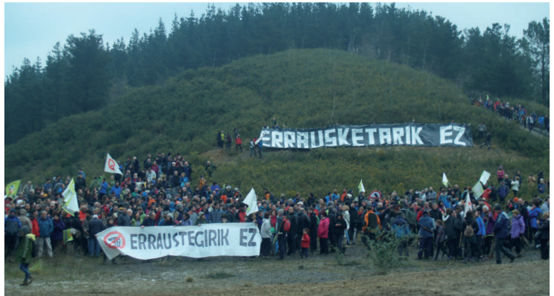
Andoaindik eta Urnietatik irtendako martxak Zubietako errauste plantaraino iritsi ziren. Ekitaldi nagusia ondoren egin zuten, Zubietako plazan. Andoaingo eta Urnietako martxen bideak ikusgai daude aiurri.eus webgunean.

Ekitaldia, pankarta erraldoi baten inguruan ateratako argazkiarekin bukatu zen, baina bukatu aurretik martxoaren 12an Andoainen erraustegiaren kontrako manifestazioa egingo dela gogoratu zuten. Halaber, maiatzaren 29ko data egutegian ondo gordetzeko gomendatu zuten. Izan ere, egun horri begira ekitaldi eder bat prestatzeko asmoa du Erraustegiaren kontrako Mugimendua.