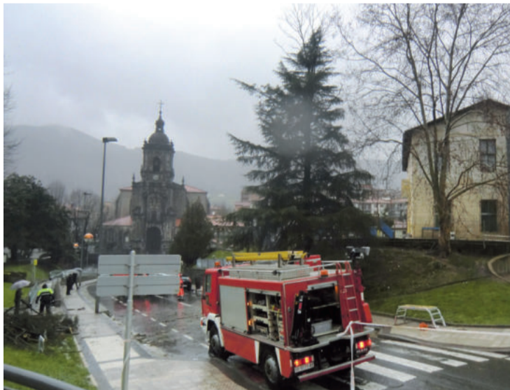
Urigain ondoan utzi zituzten ekaizak botatako zuhaitzaren enbor zatiak.

Euriteekin ordu gutxira, Espigoira eta Zumea kaleko garajeetara igo zen ur maila. Zorionez, iluntzean euriak etena egin eta uholde arriskuak saihestu ziren. Udalak gau horretan Goikoplazan eta Etxe-