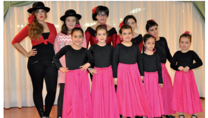
Las Flamenquitas Triana elkarte dantza taldea da.

Ekitaldiz beterikoa izan zen aurreko asteburua Triana elkartearen, otsailaren 28a Andaluziaren eguna baita. Bi egunez jarduera ezberdinak antolatutuzten. Arrakastatsuen