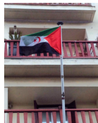
Manuel Larramendi Kultur Bazkuna.

Urnietako eta Andoaingo udaletzeko balkoitan edota Manuel Larramendi Kultur Bazkunaren egoitzan, Saharako ikurriña eskegita izan da. Egun hauetan Euskal Herri osoan elkartasun keinu ugari egin dituzte.