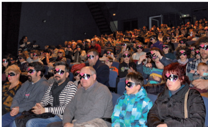
Ikusleak Super Hren maskara jantzita, ikuskizunaren hasieran.