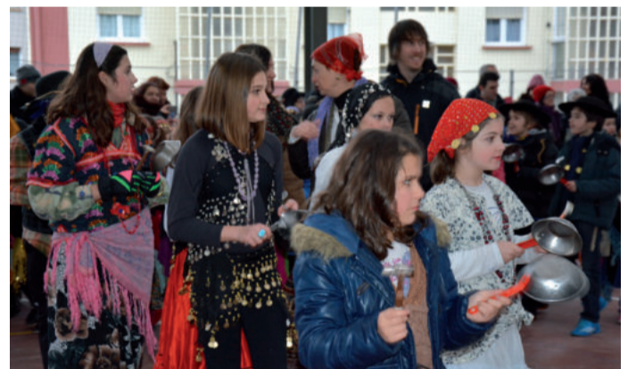
Ostiralean eta larunbatean herrian barrena kalejira bana egingo dute.

Kaldereroen bi konpartsa iragarri dituzte aurten Andoaingen, azken urteetan egin bezalaxe. Mozorrez lagunduta, zartagin hotsak Andoaingo kaleetara zabalduko dituzte. Jai giroa somatzen hasiko da orduan, inauterien etorrera iragarritzen baitute.