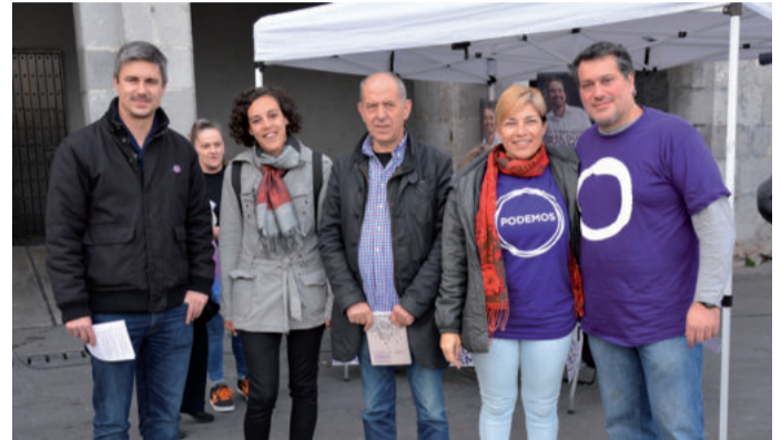
Abenduan kanpainan izan ziren alderdiko kargu politiko ezagunenak.

Abenduaren hogeiko Haurtekin Orokorretan Podemos alderdiak lehen indarra izatea lortu eta gero, Andoaingen lan taldea eratzeko bilera deitu dute Urigainen. Larunbat honetan izango da, urtarrilak 30, goizeko 11:00etan hasita.