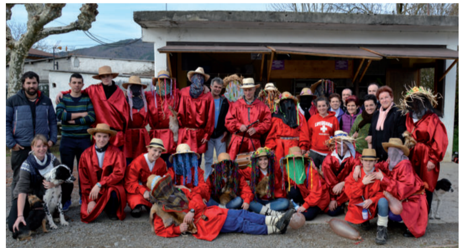
Axeri dantzako kideak Goiburuko auzotarrek. Bideoa eta argazkiak ikusgai daude aiurri.eus webgunean.