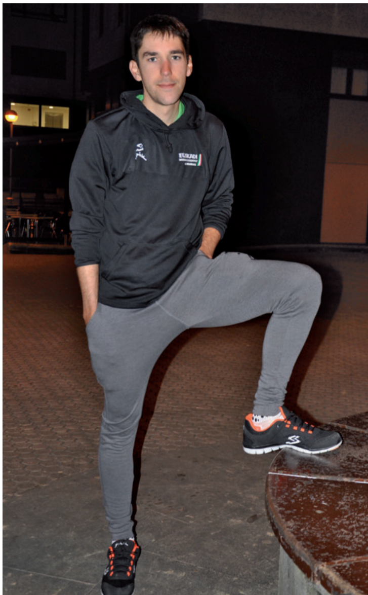
Aiurriri elkarrizketa eskaintzeko astelehen iluntzean tarte bat hartu zuen. Hurrengo egunean Mediterraneo aldera jo zuen azken prestaketak egin eta lehiatzen hasi asmoz.