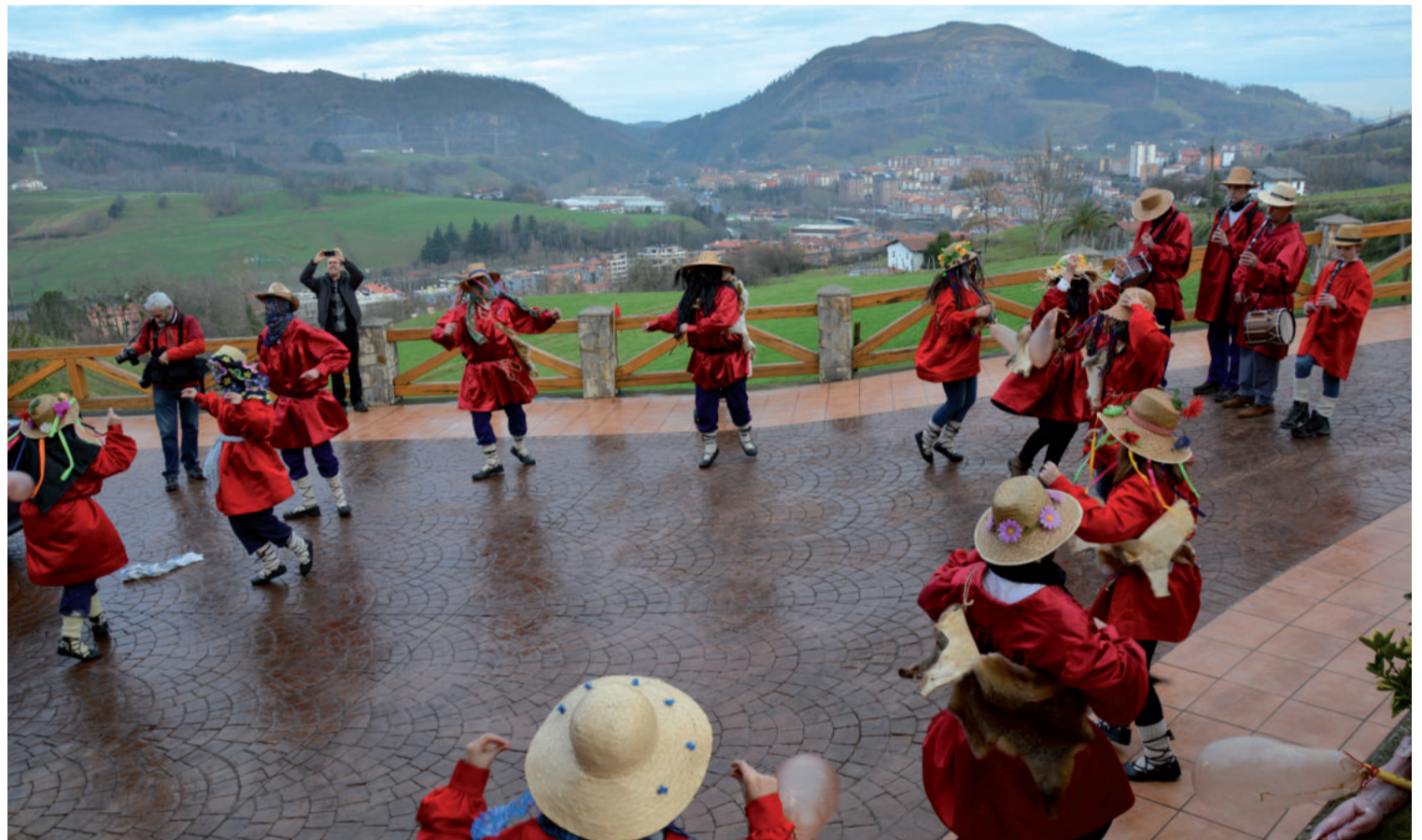
Pagota etxearen aurrekaldean arin-arina eta fandangoa dantzatu zuten.