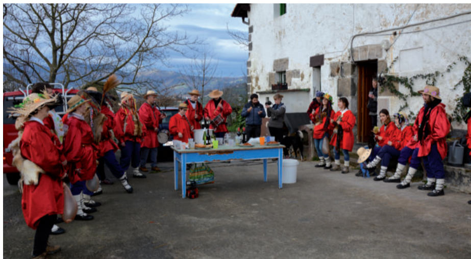
Merdilegi baserrian, gainerako baserrietan bezala, hamaiketako ederra eskaini zieten axeriei.