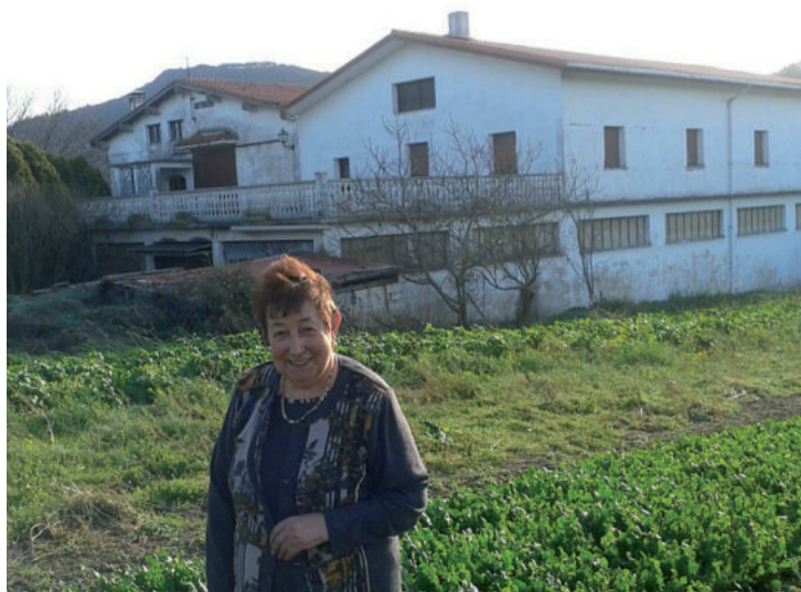
Pili bizitoki duen Pagua baserriaren aurrealdean.

P.U.: Bai, orain ez baita baserri-tarren ohiko plaza bat, baizik eta baserriarren postuak ere badauden komertzial gune bat. Hala ere, Bretxakoek baino hobeto