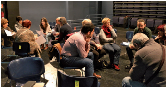
Ikus-entzunezkoa eta gero bertaratu zirenen artean solasaldia egin zuten.

Bakea eta Bizikidetz a jardunaldien baitan, "Glencree, elkarrekin egindako bidea" dokumentala proiektatu zuten larunbat goizean Saroben. Bertan izan zirenei "gogorra, hunkigarria eta baliagarria" iruditu zitzaizkien Glencree esperientzia urnietarrei.