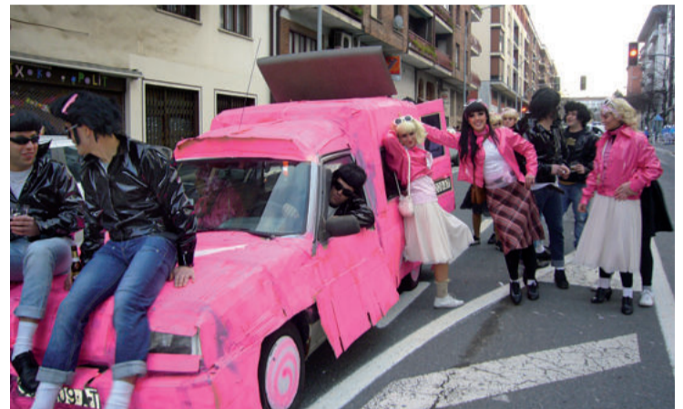
Idiazabal kalea arratsaldean hasi eta gauerdira arte trafikoarentzat itxiko dute.

M itologia hizpide hartuta, inauteri festa nagusia otsailko lehen larunbatean ospatuko dute Urnietan. Aurreko asteazkenean jai batzordean gai hori hizpide izan zuten, eta bertan adierazitakoaren arabera, Udalak Idiazabal kalea oinezkoentzat bideratuko du arratsaldeko 17:00etatik gauerdiko 24:00ak arte. Beraz, ordu horietan errepidea trafikoarentzat itxi egingo dute. Udalak ohar bidez jaiaren antolatzaileekin lankidetzara iragari du, segurtasuna bermatzeko beharrezko neurriak hartuko dituela iragartzearekin batera: "Urnietako Udalak, urtero egiten duen moduan, herriko elkarrekin lankidetzan jardungo du inauteriak modu egokian gauza daitezkeen. Horretarako beharrez-