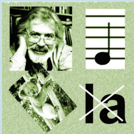
Zer gaitz mota da hori?