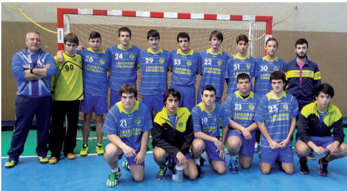
Zumaia Pulpo, Bilboko Eskolapios eta Gateizko Corazonistas taldeak aurkari izango dituzte asteburu honetan, Zumaian.

Leizaran eskubaloitako taldeko jubenil mailakoek ligaskan lehen postuan amaitu eta gero, Euskadiko txapelketan jokatzeko igoera fasea jokatuko dute asteburu honetan. Egin duten ahaleginagatik, klubak txalotu egin du jubenil mailako kementa. Bide batez, igoera faseko partidatara mutilak animatzera joateko gonbitea luzatu dute.