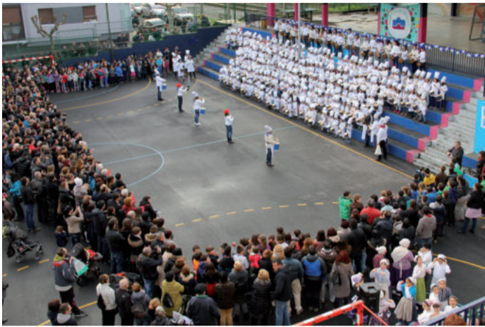
Argazkian ikusten denez, ekitaldia ikustera guraso ugari bertaratu zen.

Urtero bezala Egape ikastolako Haur Hezkuntzako eta lehen, bigarren eta seigarren mailako ikasleek San Sebastian egunean santuaren izen bereko martxa jo zuten. Eta jarraian, Urnietako ereserkia. Bi doinuetan dantzari