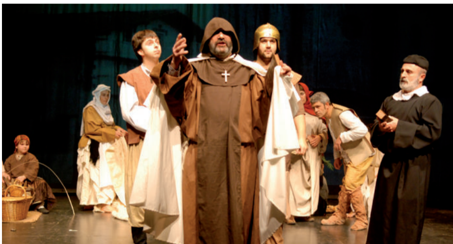
Larunbat honetan iluntzeko 20:00etan hasita, 400 istorio ikuskizuna kiroldegian.

Mendeurrenari lotuta, eta azken urteetan egindako hiru antzezlanen pasarteak uztartuta, ikuskizuna eskainiko dute