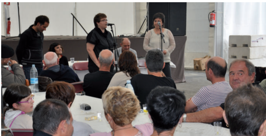
Ohi denez, bertso saioak ere ez du hutsik egingo.