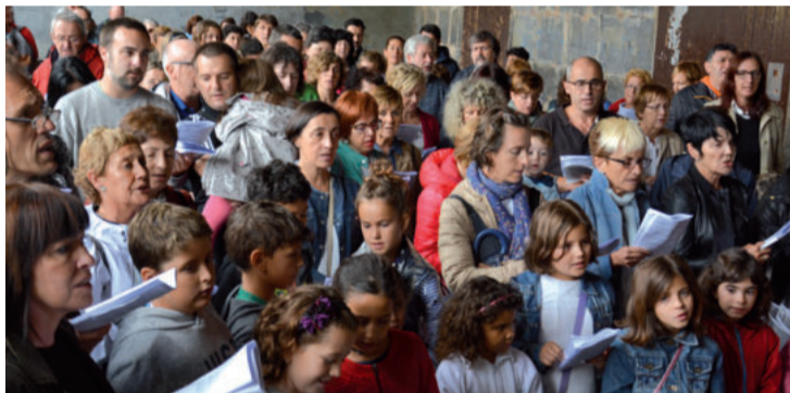
"Xalbadarren heriotzean" kantua bidez ikusgai dago aiurri.eus webgunean.