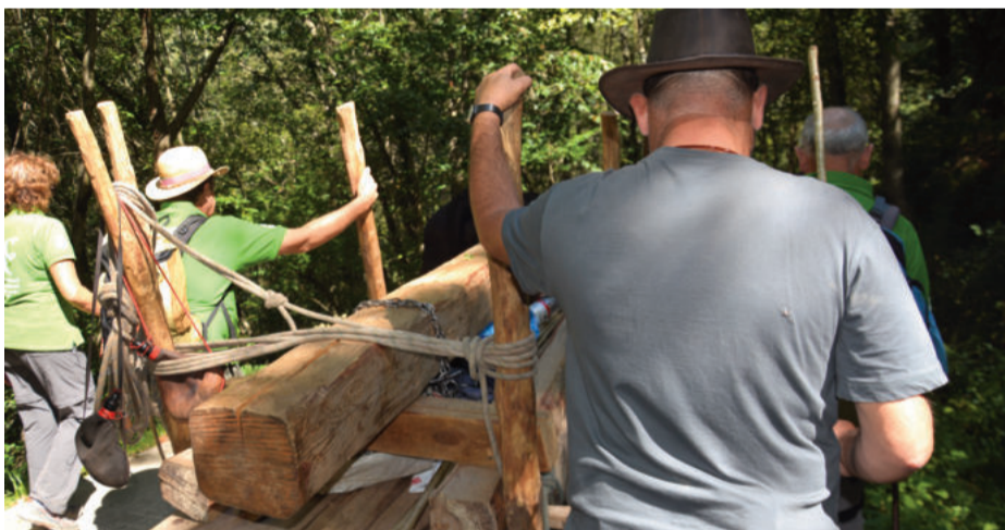
Egurra garraiatu dute gurdiak hamazortzi eguneko espedizioan. Behean, Urigainera iristen.

azpialdean eta Santiagoko Bidearen aterpean lo egin zuten. Hurrengo goizean, 08:00etarako jada abian jarri ziren Urnietarako bidean, Leizotz industrigunetik aurrera. Errepidea hartu beharrean, Xoxoka aldera jo zuten, eta handik, herrigunerrantz kanposantuko bidetik behera. Tren geltokira hurbildu ziren, Hernani aldera abiatzeko. Urnietan, aurreko egunotan apenas zabaldu zen Gurdi Bidea bazetorrela zioen berririk. Espedizioa ere ez zen herri baretik igaro, eta azkenean, horrek denak Urnietako zeharkaldian ia inor hurbildu ez bildu izana eragin zuen.