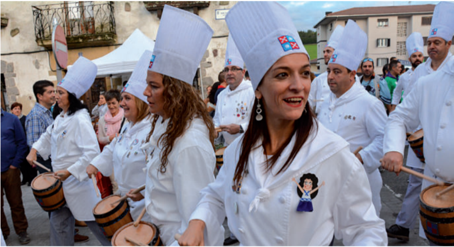
Urriaren 1ean, larunbata, Urdanbor danborradak herriko kaleak alaituko ditu.

Entseguetan duela hamar egun hasi ziren eta ostegun honetan egingo dute azken aurrekoa. Jaietako larunbatean arratsaldeko 19:00etan abiatuko dira Plazido Muxika plazatik. Afalostean, 00:00ak aldera bigarren txandari ekingo diote.