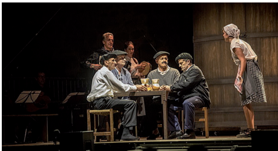
Ostiral honetan gaueko 22:00etan hasita, Gabon Txirrita antzezlanaren kiroldegian.

Donostiako estreinaldian ikusle gozatuak eta kritikaren txaloak jaso ondoren, urnietarren aurrean arituko dira. Lantaldearen gehiengoarentzat saio berezia izango da, emanaldia herrian bertan delako.