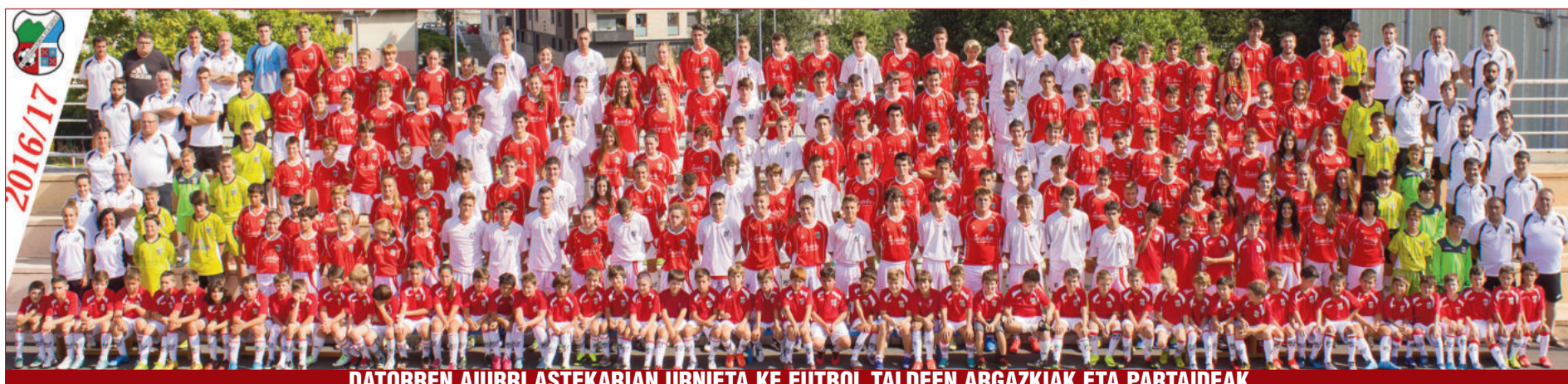
DATORREN AIURRI ASTEKARIAN URNIETA KE FUTBOL TALDEEN ARGAZKIAK ETA PARTAIDEAK

rreraren 75. urteurreneko ospakizunekin jarraitzen du Ontza elkarteak, eta Euskal Herriko sagardo txapelketa izango da hurrengo hitzordua. Irailaren 24an, Zumea plazan ospatuko da txapelketa. Txartelak salgai daude elkartean bertan, eta baita Ondarreta eta Txuribeltz tabernetan ere.