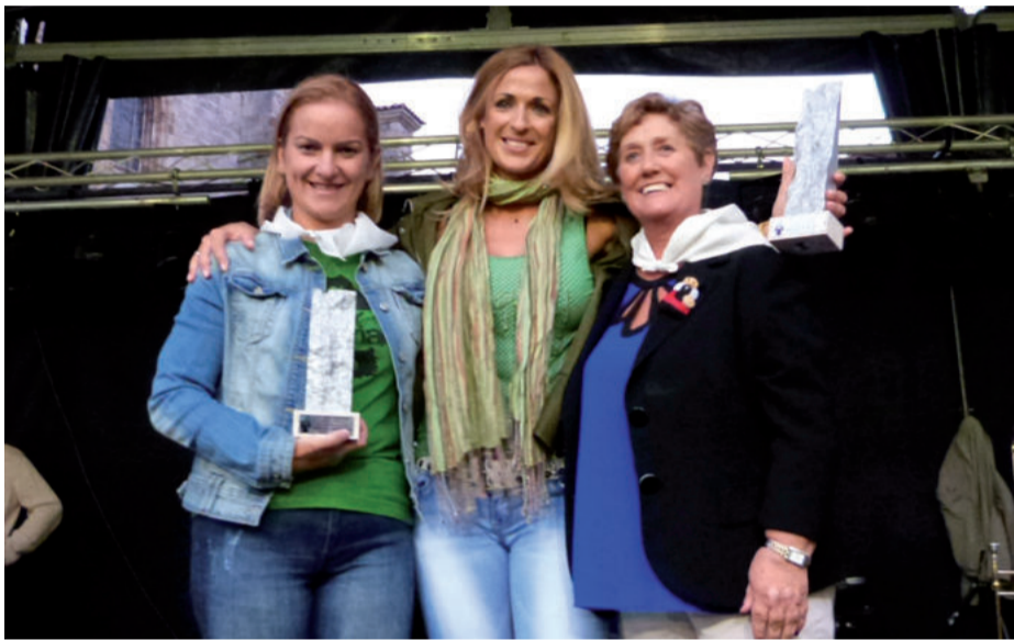
İnistorrek zortzigarrenaz antolatuko du Irrintzi lehiaketa.

HAIN GUREA DEN ADIERAZPENA JENDAURREAN ERAKUSTEKO PLAZA GUTXI DAGO GAUR EGUN EUSKAL HERRIAN.