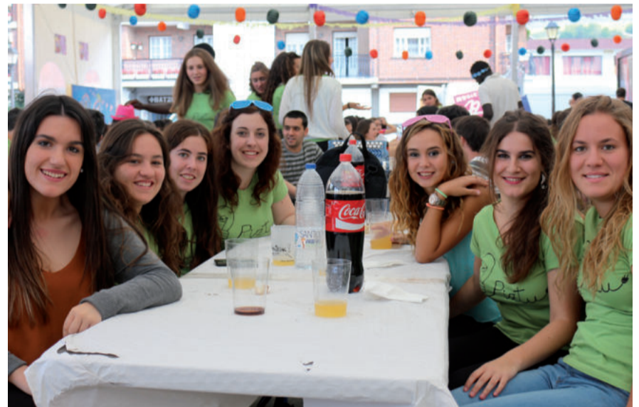
Iazko herri bazkaria Txosnagunean.

ARGAZKI-BILDUMAK, BIDEOAK EDOTA EGUNEZ EGUNEKO EGITARAUA WEBGUNEAN ESKAINIKO DIRA.