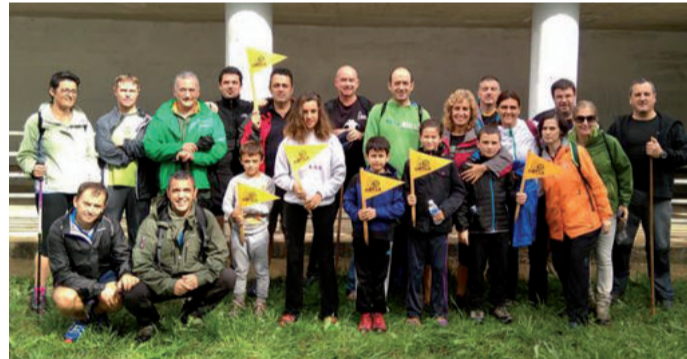
Ontzako mendizaleak hamaiketakoaren garaian ageri dira.

10 kilometroko mendi txangoa egin zuten Buruntza mendian larunbatean, Ontza elkarteak antolatuta. Eguraldia kaskarra izan zuten partaideek, maiz aterkia zabaldu behar izan zutelarik. Nolanahi ere, umorerik ez zuten galdu, eta San Rokeko aterpean hamaiketako ederraz gozatzeko aukera eduki zuten. Bere so-