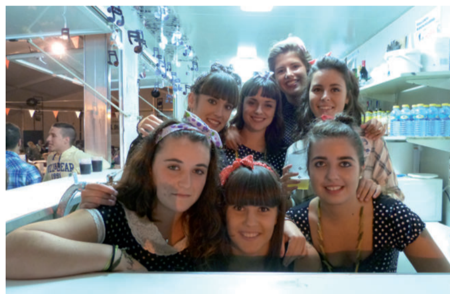
Pintxo-potearekin jendetsua izan daiteke aurtengo txosnen irekiera.

ASTEAZKEN ILUNTZEAN PINTXO-POTEA ESKAINIKO DUTE TXOSNAGUNEKO HIRU TABERNATAN.