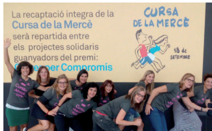
Andoingo korrikalariak Bartzelonako lasterketaren afitzaren ondoan.

Emeki-emeki taldeko hamar kidek Bartzelonako Cursa de la Mercè lasterketa famatuan hartu zuten parte, aurreko asteburuan. Esan beharrik ez dago ederki gozatu zutela emakumeek Bartzelonako egonal-