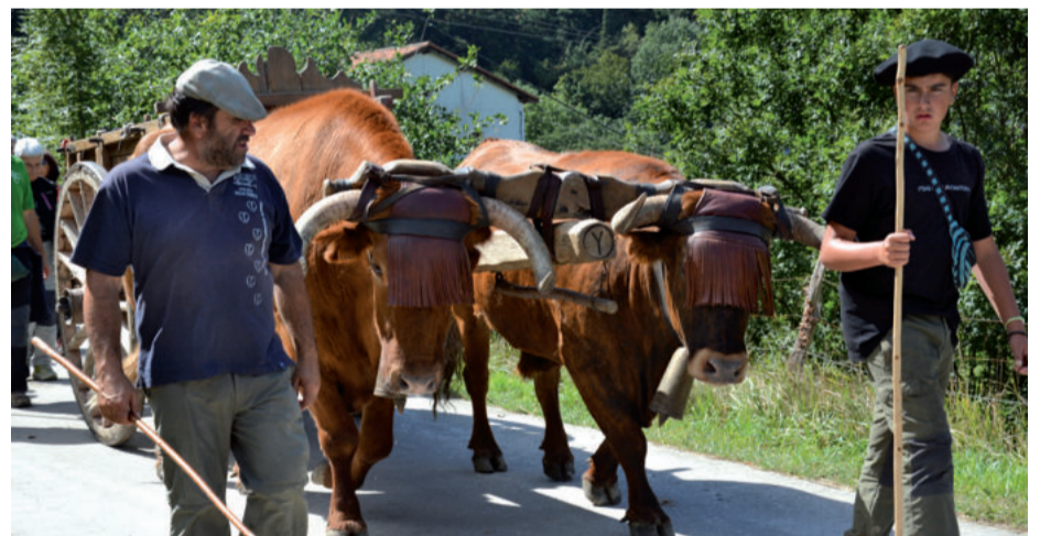
Espediziokideak Otietara bidean. Behean, biharamunean Urnieta utzi eta Hernaniko bidean.