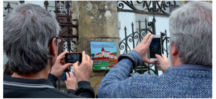
"Txori kantuzale ederrak nun ote zaudete kantari?" Leteren esaldi kuttuna ageri da plakan.