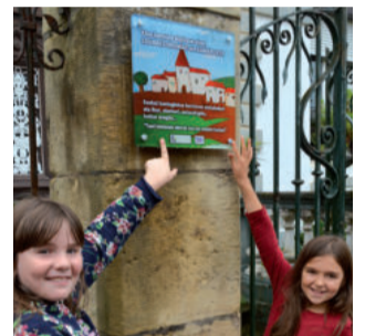
Plaka ipini dute etxeren atarian.

Aurrerantzean Lurdes Iriondo eta Xabier Leteren arrastoaren atzetik dabilzan bisitariak San Juan plazan plaka aurkituko dute, bizi-toki izan zutenaren atarian.