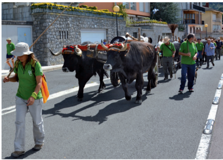
Leitzaran aldetik Urigain aldera iritsi zen espedizioa, eguerdi aldera.

Quintanar de la Sierran oraindik modu artesanalean egiten duten bikea eta alkitrana garraiatzen ari gara, San Juan baleontzia eraikitzeko beharrezkoa duguna. Aurten Donostia 2016 Europako Kultur hiriburutzat dela eta ekimena egitea erabaki da, Quintanar de la Sierrako Cabaña Real de Cabañeros elkartearekin eta Albaolarekin elkarlanean".