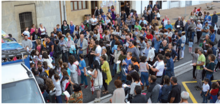
Idiazabal kalean kantari aritu ziren Kantujirakoak, eguraldiak ahalbidetu zuen bitartean.