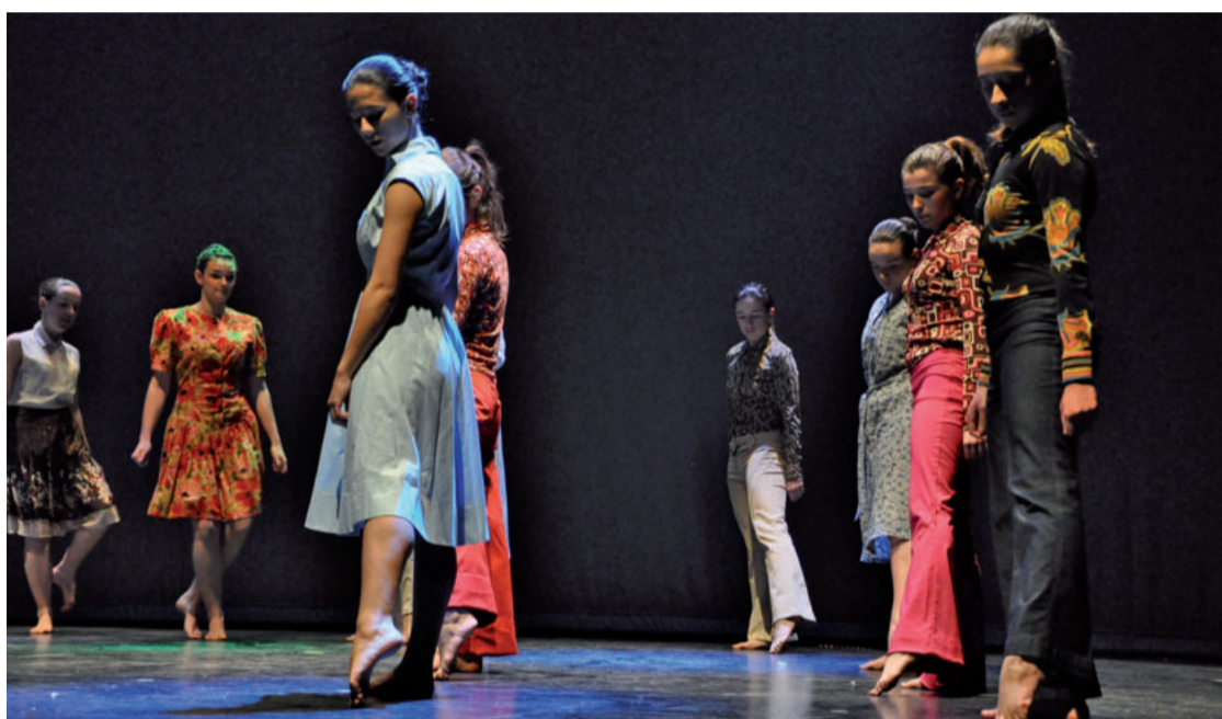
Urnietan antzerkia, musika eta dantza ikuskizunak izango dira asteburu honetan: Gabon Txirrita eta 400 istorio.

Urnietan Sanmielak ate joka daude. Dagoeneko herritar ugari dabil ekitaldi ezberdinen prestaketa lanetan. Irailaren 28ko txupinazoa iritsi aurretik, kultur jarduera interesgarrirez gozatzeko aukera izango da, asteburu osoan zehar.