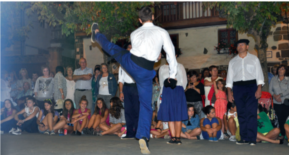
Urriaren 2an, iluntzeko 20:30ean, Dantza-soka izango da San Juan plazan.