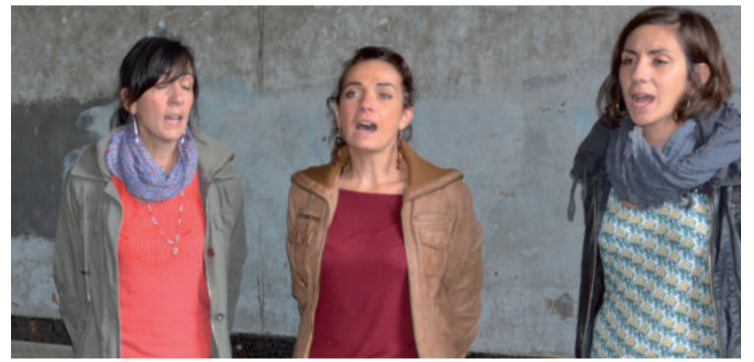
Aire ahizpak eguerdian kantari aritu ziren Kontzejupean, akordeoilariak lagunduta.