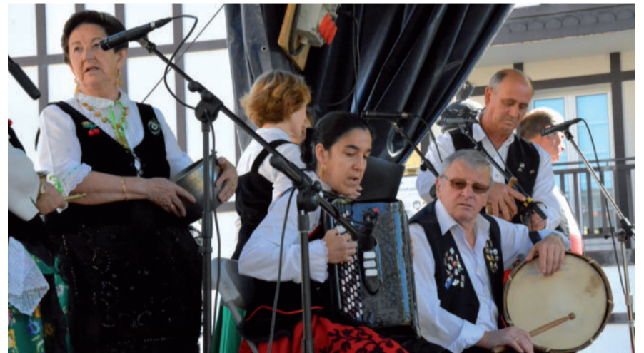
Iazko koru eta dantza ikuskizuna, Urrietako jaien atarian.

Extremadura aldeko produktuez gozatzeko aukera berria izango da, igande honetan Urnietan. Eta pro-