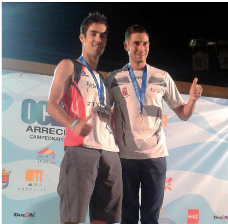
Kerman haurarekin egin zituen probaren azken metroak.

A.S.: Hurrengo egunetan, atsedena hartu! Azken asteetako entrenamenduek eta probak eragindako buruko nekea gainditu, eta hurrengo denboraldiari begira jarriko naiz laster.