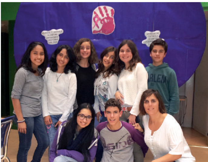
Ligodromoa tailerrean parte hartu zuen gazte talde bat.

Mintzalaguna egitasmoaren baitan antolatutako lehiaketa