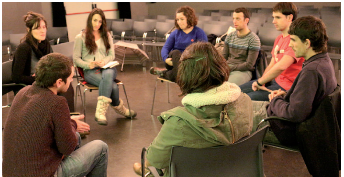
Datorren astean, azaroak 19, parte hartze prozesuaren azken bilera egingo dute.

A zaroaren 5ean gazte- en parte hartze prozesuko bigarren fasea abiatu zen Basteron. Lehenengo fasean Andoainen beharrak zeintzuk ziren ikusita, behar horiei erantzuna emango dieten dinamikak pentsatu zituzten. Basteron bildutako proposamen guztiak mahai gainean jarrita, erabaki zehatzago bat hartzen hasi ziren.