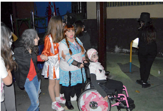
Izartxok Beldurraren gaua antolatu zuen aurreko asteburuan. 150 lagun bildu zirela adierazi dute antolatzaileek.