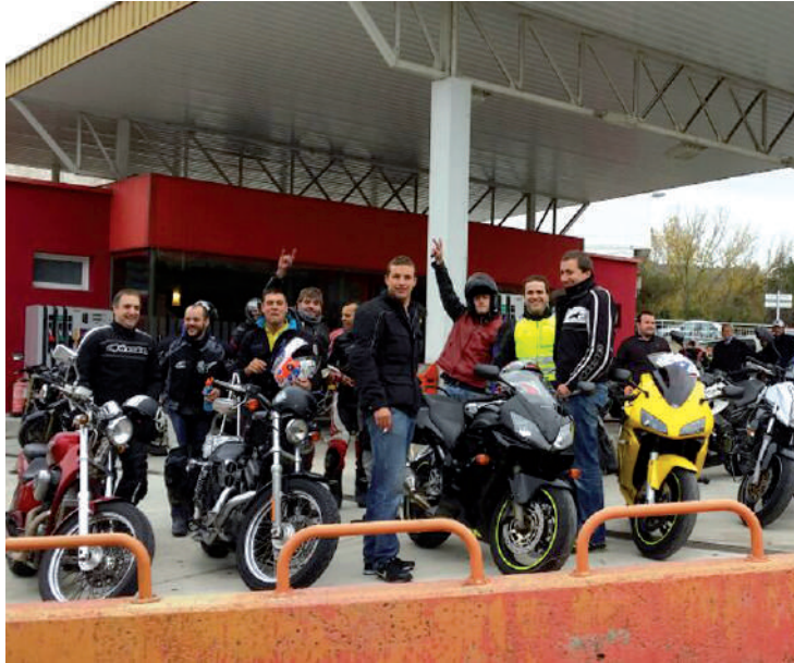
Aurtengoa horren ondo joan dela ikusita, gehiagotan egitea adostu dute eta urtean behin, gutxienez, horrelako egun bat antolatzea gustatuko litzaieke.

Aurtengoa horren ondo joan dela ikusita, gehiagotan egitea