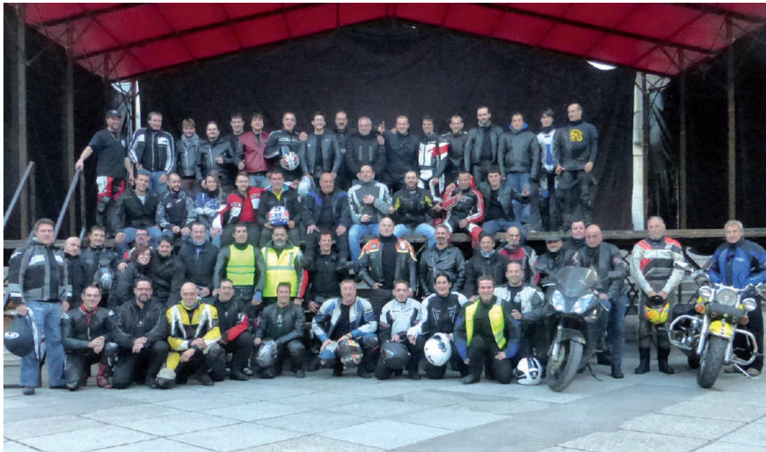
48 moto ezberdinetan 60 lagunek parte hartu zuten lehen moto bilkuran. Antolatzailerik adierazi dutenez, datorren urtean zerbait handiagoa egin nahi dute.