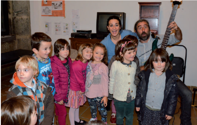
Sorabillan gaztain jatea eta ipuin musikatua antolatu zuten.

Aurreko asteburuan haur eta gaztetxoei bideratutako jarduera ugari burutu ziren herriko toki ezberdinetan. Sorabillan gaztain jatearekin batera musika saioa antolatu zuten. Gaztetxean larunbat arratsaldea haurrei eskaini zieten.