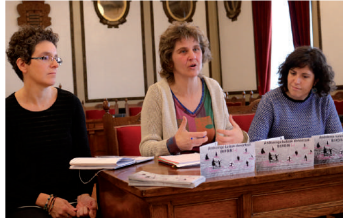
Andoaingo alkatea parte hartze prozesuaren dinamizatzaileekin batera.

A ndoaingo Udalak herriko kaleetan hobetu beharreko puntuak herritarren ahotsik jaso nahi ditu. Hau da, herritarren beharrik ezagutu eta herritarren ikuspegia nolako nahi den jakin nahi du. Horretarako, “Andoaingo kaleak denontzat BERDIN” ekimena jarri du martxan. Urbes For All eta Elhuyar Aholkularitzarekin elkarlanean, prozesu parte hartzaile bat jarriko dute martxan azaroan eta espazio publikoak lau ardatzen arabera aztertuko dituzte; segurtasuna, mugikortasuna eta irisgarritasuna, emakumeen presentzia espazio publikoan eta eguneroko bizitzarako ekipamenduak.