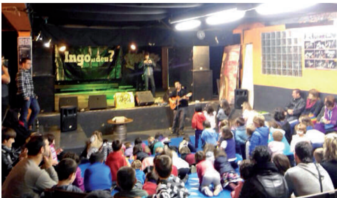
Gaztetxean aurreko larunbatean haurren eguna ospatu zuten. Haur eta guraso ugari bildu ziren kantaldira.

La Sallen, berriz, Izartxok beldurraren gaua antolatu zuen ikasle askoren parte hartzearekin. Gazte Lokalak bere aldetik Ligodromoa tailerrarekin hilabete osoan zehar luzatuko den egitarauari hasiera eman zion.