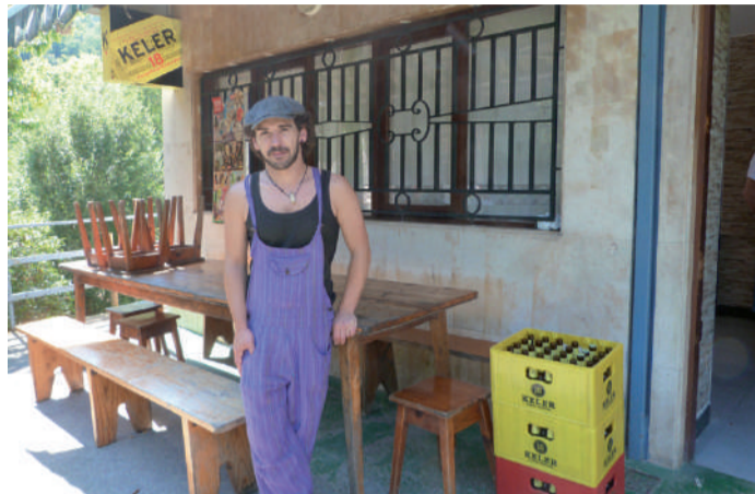
Taberna berrituta, irailaren 5ean ateak ireki zituzten berriro.

Olagain auzoko Santa Krutz erretirodunen zentroak irailearen 20rako Orreaga eta Auritz ezagutzeko txangoa antolatu du. Irteera Olagain auzoko sarreratik izango da, goizeko 08:30etan. Antolatzailerik eguneko planaren berri eman dute: "Orreagara iristean, bisitaldi gidatua izango da monasterioa ikusi nahi dutenentzat. Ondoren