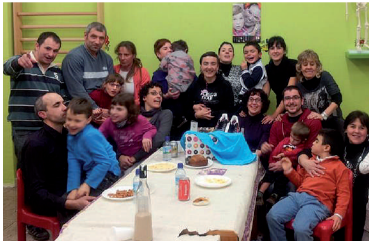
Elkarteko gurasoak eta haurrak, Pausoka elkartean bertan.