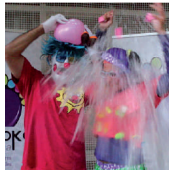
Porrotx eta Marimotots pailazoak ere Pausokaren alde busti ziren.