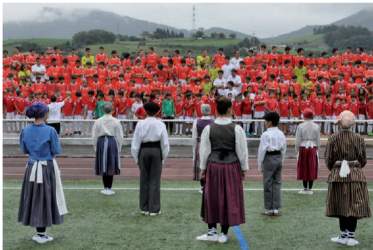
Ekitaldi polita antolatuko dute aurten ere.

Gaztetxoenetik hasi eta Erregional mailakoak bitarte, eguneko protagonistak jokalariek izango dira.