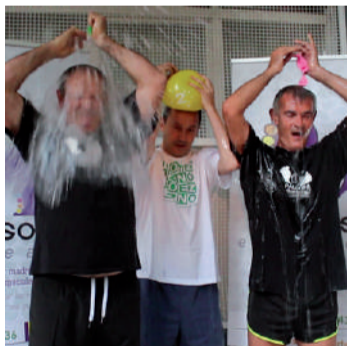
Urnietako UDAko kideek ekarpen ekonomiko handia egin dute.