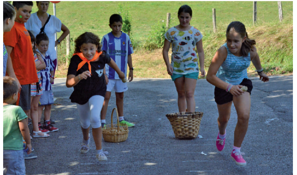
Lokotxak biltzen aritu ziren larunbat arratsaldean, haur eta gaztetxoei eskainitako egunean.