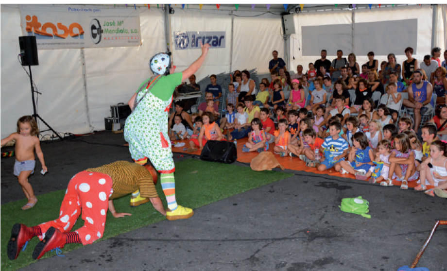
Tomax eta Muxugorri pailazoek auzoko eta herriko haur askoren arreta bereganatu zuten.