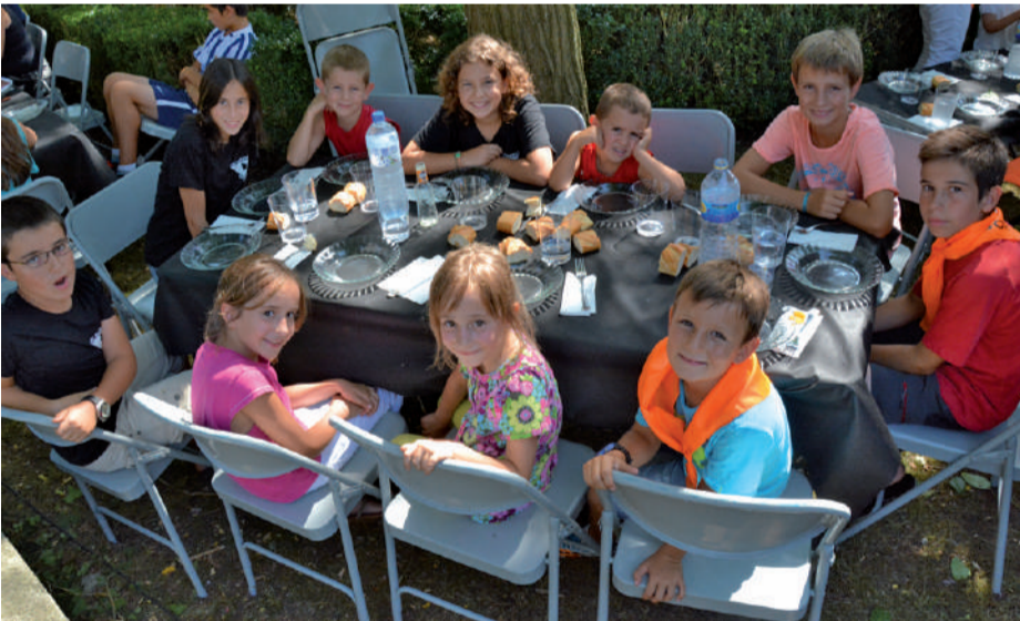
Gaztetxoak auzo bazkarian.