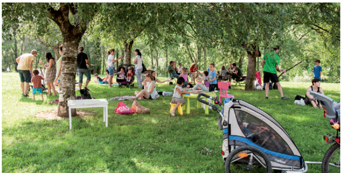
Eguraldiaren aurreikuspen txarrak ez ziren bete eta ospakizuna bere horretan igaro zen.