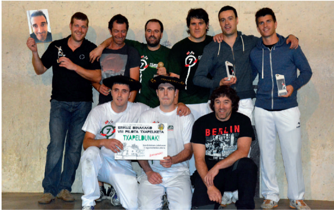
Aizpurua-Gaztañaga irabazleek bi finalak jokatu zituzten beste hiru bikoteekin batera.

Txapelketa amaituta, Andoingo Gaztetxeak 3x3 basket txapelketa antolatzeari ekin dio. Uztailaren 14an hasiko da, 24ra arte.