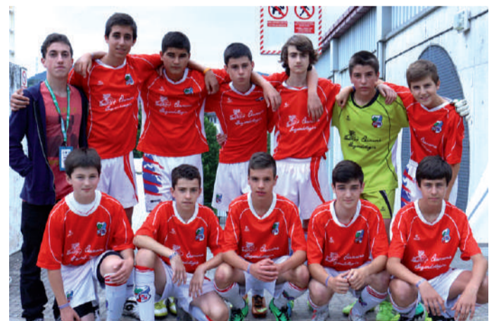
Urnietako mutilak partida hasi aurretik.

Donosti Cup nazioarteko futbol txapelketaren 23. edizioan lau egunetako partidak jokatu dira Urnietan. Aurten, lehiaketan 22 herrialde ezberdinetako 423 taldek hartuko dute parte. Uztailaren 6an hasi eta 12an amaituko da, bitarte horretan mila partidatik gora jokatu. Antolatzaileek azaldu dutenez, lehen fasea astean zehar izango da. Ostegun eta ostiralean, berriz, azken txanpa eta kontsolazio partidak jokatu dira; eta azkenik, larunbatean Anoeta estadioan finalak jokatu dira.