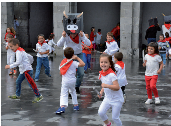
Korrikalari txikiak zezenaren atzetik eta aurretik korrika bizian aritu ziren.