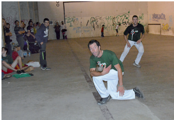
Izagirre "Kabra" bi paretakoari erantzuna eman nahian.