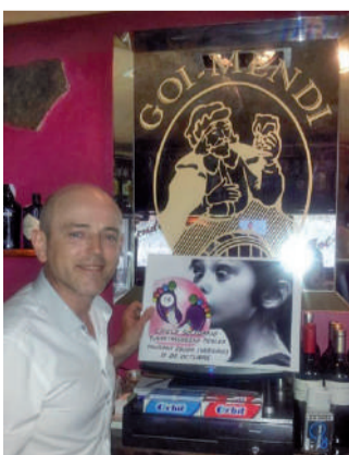
Txikleak erosteko aukera ugari dago Urnietan.

Gaixotasun arraroak dituzten haurren elkarteak bata bestearen atzetik uztartzen ditu ekimenak. Elkartasunezko txikleak euro batean atera dituzte eta dagoeneko Urnietako hainbat saltokitan eskuragarri daude. Kanpaina iragartzeko txarteletan, gainera, "Pausoka eguna" izango dena iragartzen hasi dira. Alegia, elkarteak egun osoko ospakizuna antolatuko duela urriaren 11n.