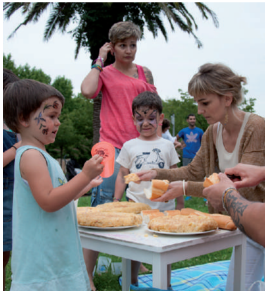
Afari meriendarekin amaiera eman zioten jaiari.