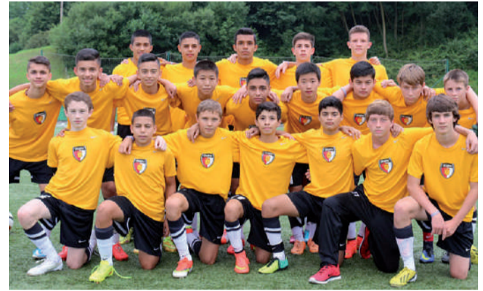
Dallas Texans estatubatuar taldeak 2-1 garaitu zuen Urnieta.

Astearte goizean urnietarrek Dallas Texans estatubatuar taldea hartu zuten etxeko zelaietan, urtero data hauetan jokatzeko den Donosti Cup txapelketaren baitan. Munduaren beste aldetik etorritako Dallas Texans taldeko entrenatzailea esperientziarekin gustura agertu zen. Partida hasi aurretik zera zioen: "Hiru egun daramatzagu hemen, mutilak gustura daude eta esperientzia honetan ondo pasatzen ari gara. AEBtakoak izanik, noski, ez dugu Urnietako taldea ezagutzen, baina atzo ondo jolastu zuten eta, beraz, partidarako gogoz nago. Espero dut partida hau ere atzokoa bezain ona izatea".