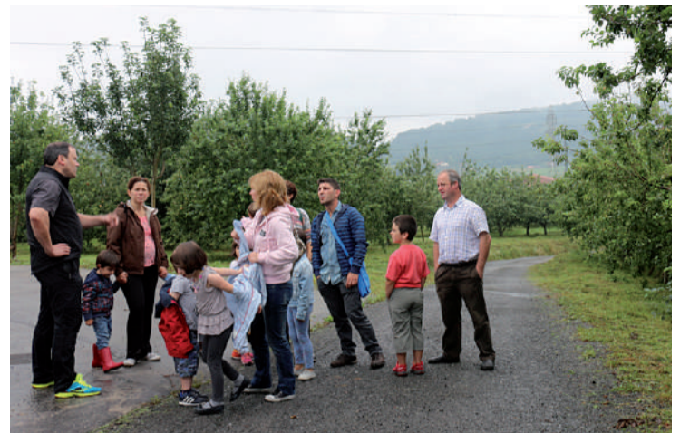
Hainbat familik haurrekin goiz pasa egiteko aprobetxatu zuten.

Eulak hamaika hektarea ditu sagastitan, lau mila sagarrondotik gora. Horiek ikusi bitartean, sagarrak nola biltzen zituzten erakutsi zieten bisitariari. Punta zorrotzeko makilekin, eskuz biltzen dituzte sagar guztiak bost lagunaren artean. 2013an, esate baterako, berrehun mila kilo bildu zituzten guztira. Zur eta lur geratu ziren bisitariak hori entzutean eta bisitaldian bertan konturatu ziren horixe zela sagardoa egitearen pausorik zailena: sagarrak biltzea.