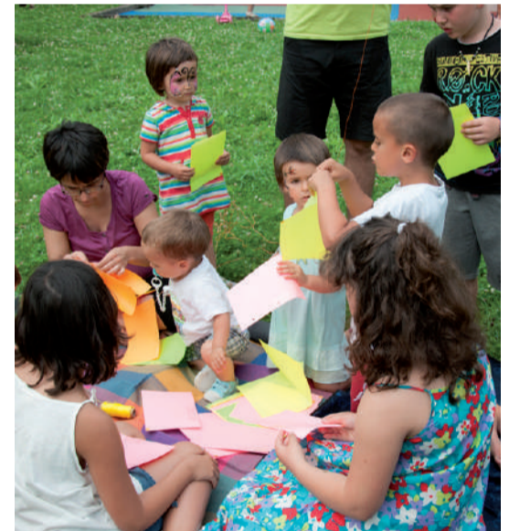
Haur jolasak belardian.