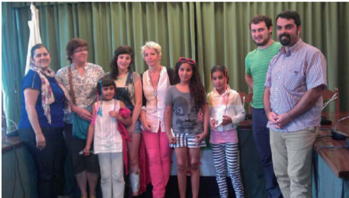
Udaletxean harrera egin zieten haurrei eta hartuko dituzten familiei.

Astelehen arratsaldean Udalak ongietorria eman zien Sahara aldetik etorri diren bi haurrei eta hauek hartuko di-