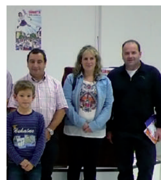
Iazko jaien aurkezpena.

Udalak jaietako batzordearen funtzionamendua gidatuko duen arautegia onartu zuen ekainean. Asteazken honetan bilera irekia egiteko zen, gai honen beraren inguruan. Udalak jakinarazi duenez jaietako buruzko ekarpenak eta proposamenak egiteko epea uztailaren 11 bitarte zabalik dago. Proposamen e-postaz bidal daitezke: jaiak@urnieta.org.