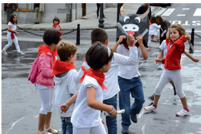
Tamaina txikiko zezenak ere irten ziren Goikoplazara.