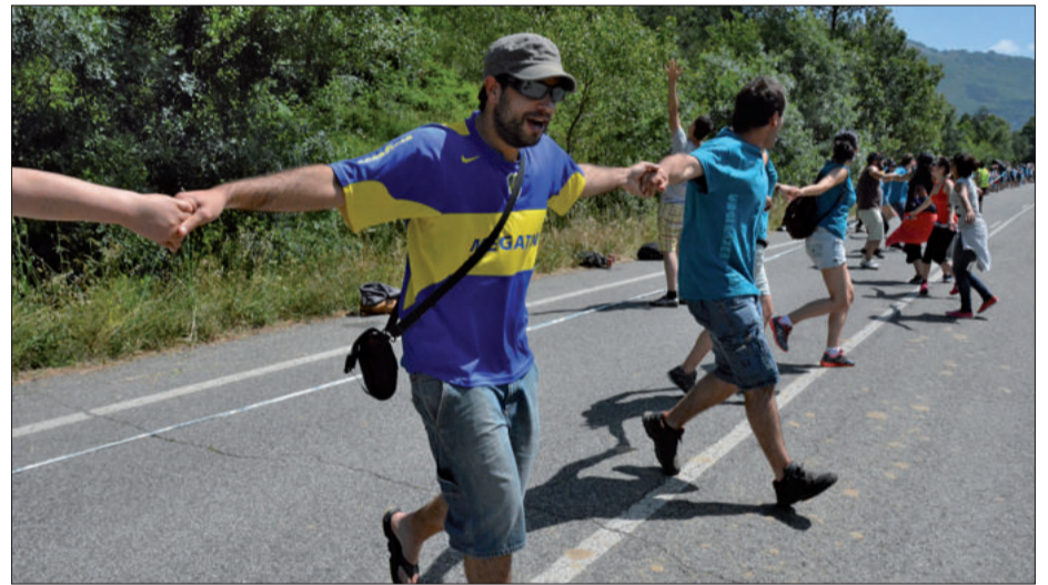
Ospakizuna izan zen igandekoa, bertan izan zirenek nekez ahaztuko dutena.