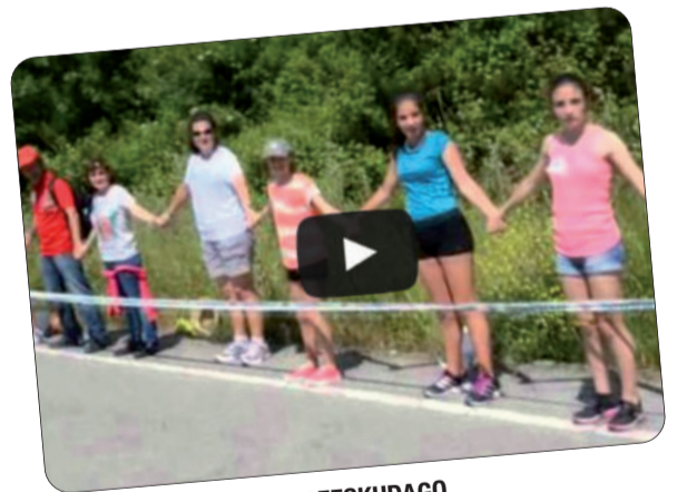
#102KM #URNIETA #GUREESKUDAGO