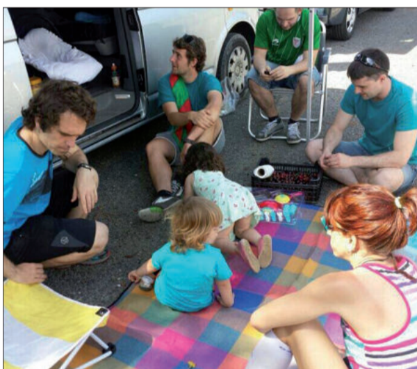
Haurrak eroso eta itzalean egoteko azpiegitura ona egokitu zuten.