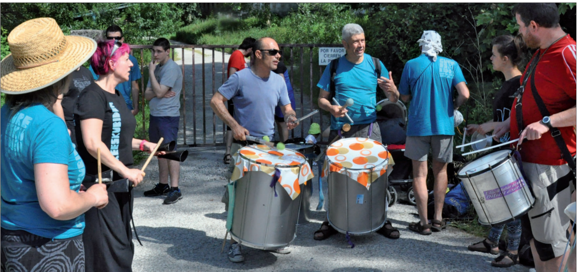
Buruntzantzian batukada taldeak eguerdiko hamabiak bitarteko tartea baliatu zuen erritmo dantzagarriak eskaintzeko. Aiurrik jasotako bideoa internet bidez zabaldu eta berehala bisitaldi ugari jaso zuen.