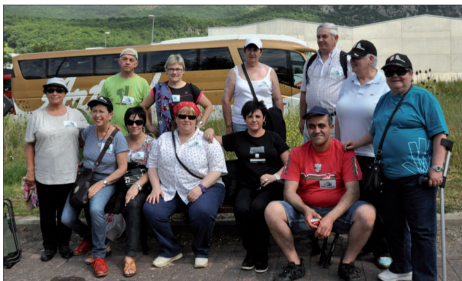
Irurtzun herriaren atarian giza katea noiz hasiko zain zegoen argazkiko koadrila.