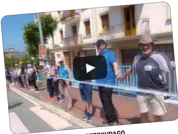
#103KM #ANDOAIN #GUREESKUDAGO