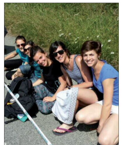
Argazki guztietan jendea alai agertzen da.

Aiurriko erredakzio batzordeko ki-deen lanaren osagarri, aiurrizale talde bat argazkiak eta bideoak igortzen aritu zen igande osoan zehar. Teknologia berriak erabiliz, aiurrizaleek bidalitako argazkiak berehala ikus eta partekatu zitezkeen sare sozial ezagunetan. Aiurriekin bat egin zuten urnietar eta andoaindar horien argazkiekin lehen argazki-bilduma sareratu genuen Flickr gunean, eguerdiko 13:00ak baino lehen. Herritarrak eta tokiko hedabideak elkarrekin lanean, informazioa denbora errealean zabaldu zen. Eskerrik asko Aiurriekin bat egin zuten guztiei.