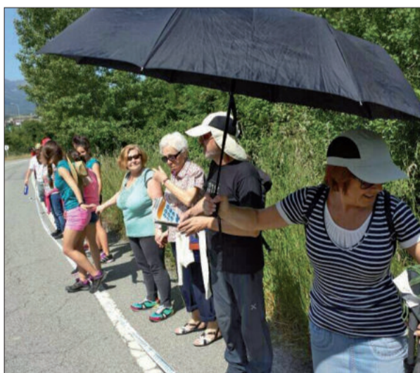
Argazkia bidaltzen zuen segapotoa bero-bero zegoen.