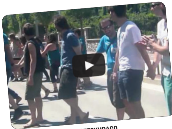
#58KM #AIZTONDO #GUREESKUDAGO