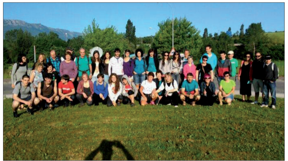
Urnietatik iritsi zen lehen autobusa, horixe jakinarazi zuen argazkiaren igorleak.