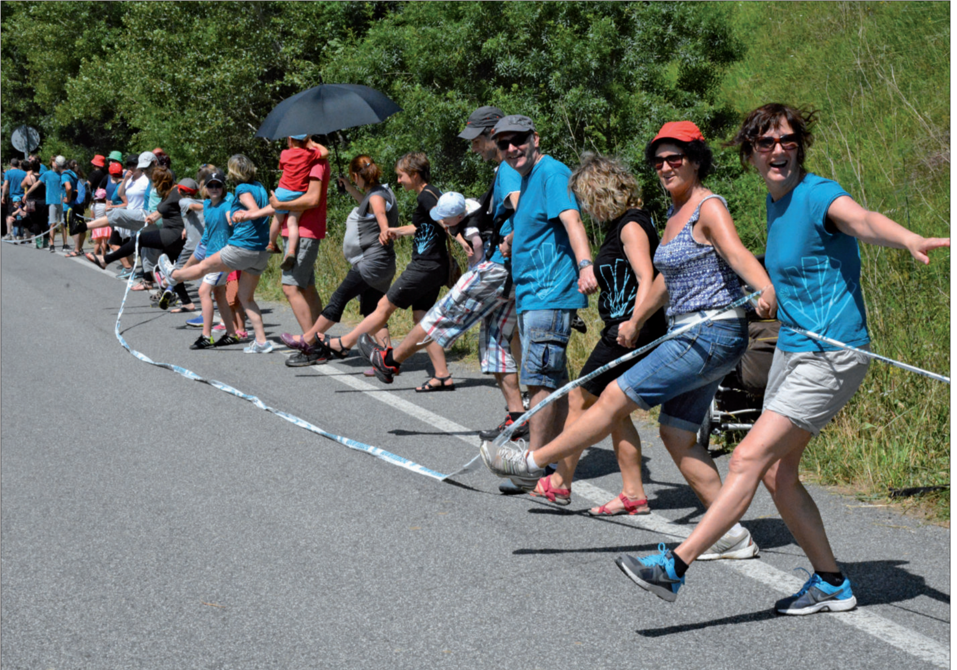
Festa giroan igaro zen giza kateak iraun zuen ordu erdia. Olatua eginez eta bestelako dibertimenduekin eman zuten eguerdiko hamabiak bitarteko itxaronaldia. "Jende zorionsua", kantuan aipatzen den bezala.