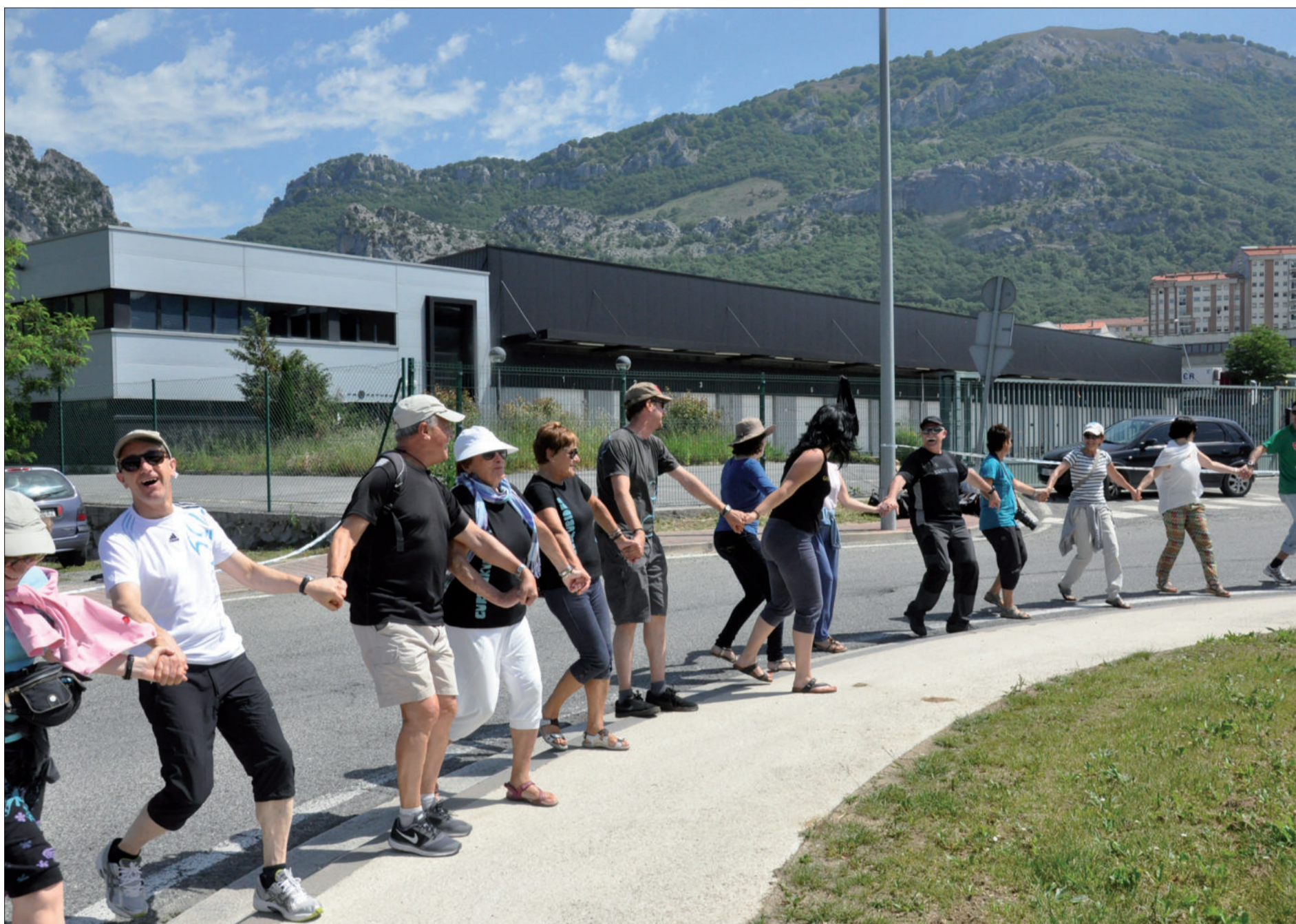
Aurrera eta atzera, eskuak gora eta behera, olatua eginez..., giro ederrean aritu ziren Andoaindik joandakoak.