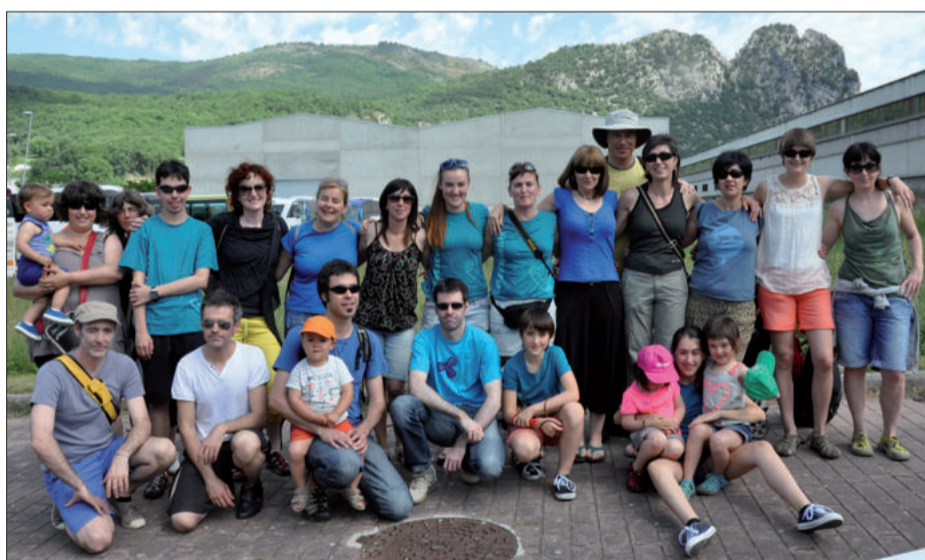
Etxeberrietan eta Zumea plaza inguruko herritarrek, giza-katearen atarian.