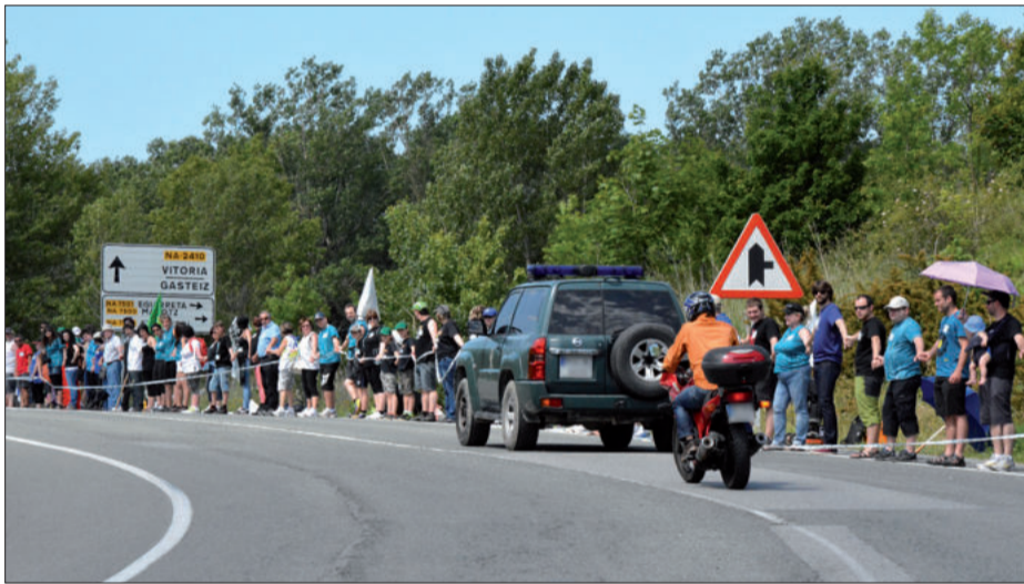
Giza-kateko kideek harriduraz hartu zuten Guardia Zibila. Gutxira, bizkarra ematea erabaki zuten ia denek.