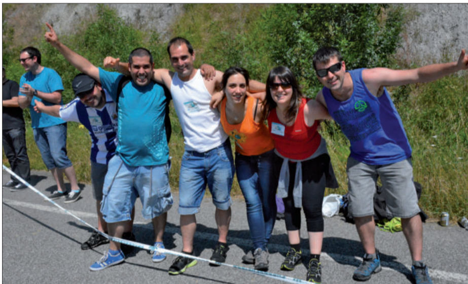
Gorospa, Vaquero, ... Urnietako Gure Esku Dago ekimenean lanean aritu diren urnietarrak. Pozarren zeuden.

Giza kate erraldoiaren aurreko astean Galarretan jaialdia antolatu zuten eta Batzokiko kideek bazkari ederra eskaini zieten Tarragonatik etorritako casteller taldeko partaideei. Haiei ere, mila esker. Eta baita Urnietako Udalarik, bilerak egiteko tokia utzi izanagatik. Zorionak eta mila esker, Urnieta.