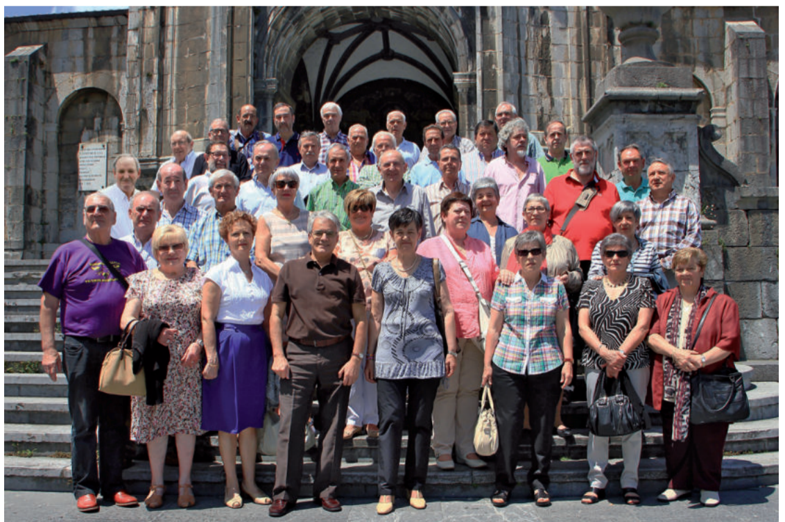
Urtean zehar 65 urte beteko dituzte argazkian agertzen direnek. Urte berean jaio izanak bazkaria egiteko bidea eman zion andoaindar talde honi. Taldeko argazkia atera ondoren Oianumen bazkaria egin zuten.