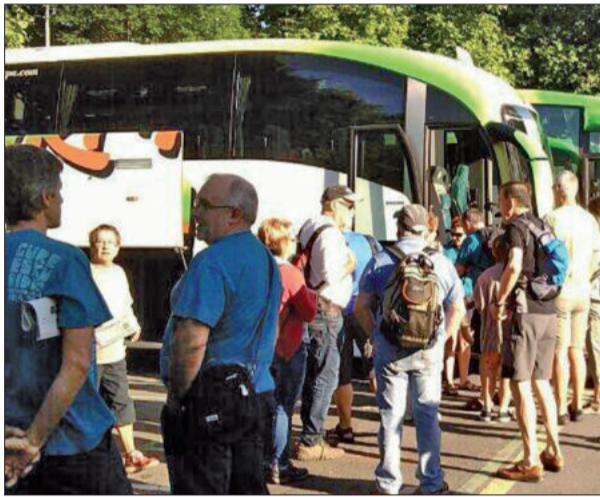
Ehunka herritar bildu zen goizeko lehen orduan Makaldegian.

HERRITARRAK IZAN ZIREN LEKUKOTZA EMATEN LEHENAK. TEKNOLOGIA BERRIAK ERABILIZ, DOZENATIK GORA AIURRIZALEK ARGAZKIAK ETA BIDEOAK IGORRI ZITUZTEN AIURRIKO ERREDAKZIORA. HAIENA IZAN ZEN SARERATUTAKO LEHEN ARGAZKI-BILDUMA.