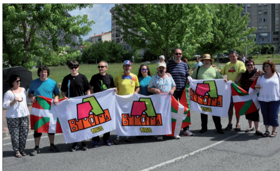
Burdina taldeko kideek giza kateari atxikimendua adierazi zioten.