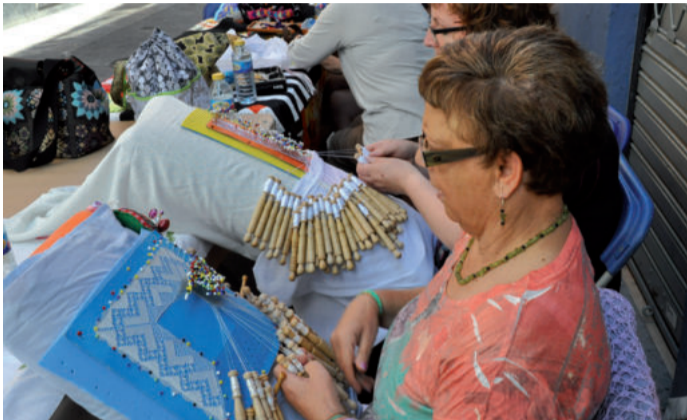
Salkinek erakustaldia eta artisau azoka antolatu zuen.

Salkin merkatarien elkarteak ehoziri erakustaldiaren edizio berria antolatu zuen, eta horrekin batera herriko artisauei postua ipintzeko aukera eskaini zien.