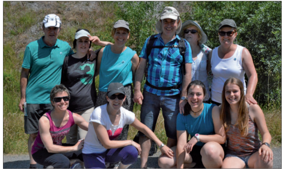
Bertsotan aritu zen taldetxoa, irudian.