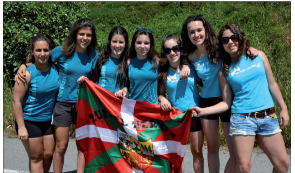
Gazteen parte hartze eskasa aurreikusten zutenei ez zuten asmatu. Gazte koadrila asko hurbildu zen.