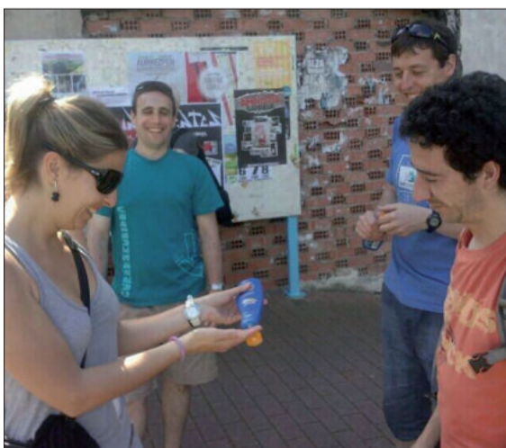
Krema igurtzi ezean, bat baino gehiago erre zen igandean.