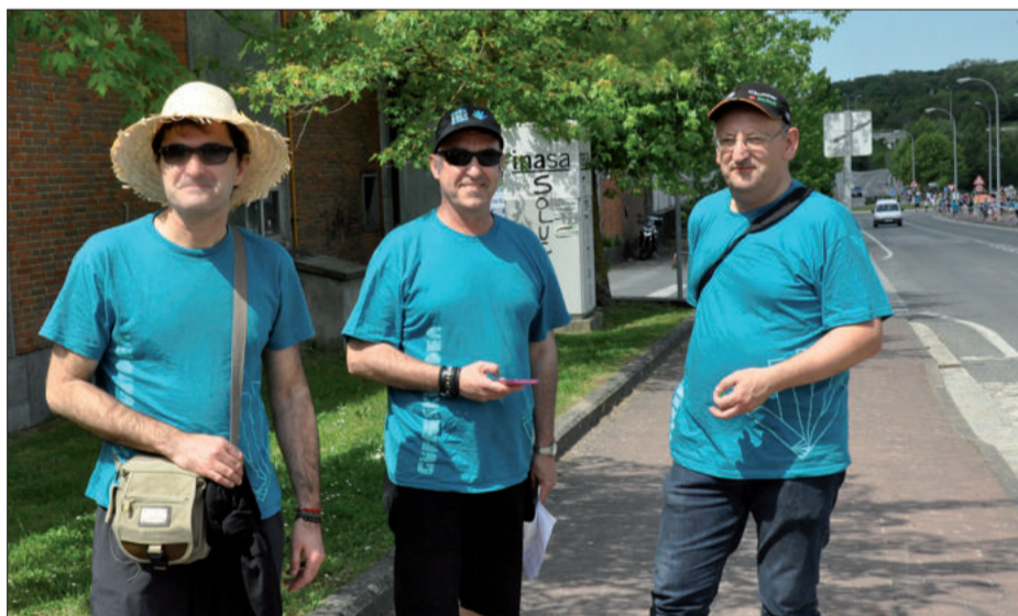
Gure Esku Dago Andoain ekimeneko antolatzaile taldeko hiru kide, Irurtzungo kanpoaldean.