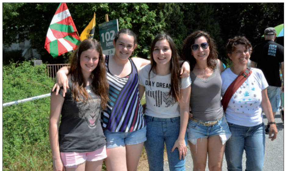
102. kilometroa urnietarra izan zen. Eta haiekin batera Arano, Goizueta eta Astigarragako kideak.