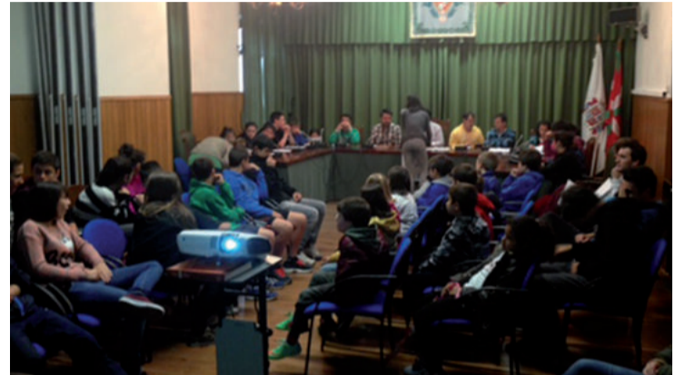
Ikasleek ikastetxean, herrian eta inguruan mugikortasuna aztertu dute.

Ikasleek ikastetxean, herrian eta inguruan mugikortasuna aztertu dute, "guk ere jarrera desegokiak ditugula ondorioztatu dugu". Eta hainbat konpromiso hartu dituzte mugikortasuna hobetzeko. Besteak beste, herrian zehar oinez gehiago