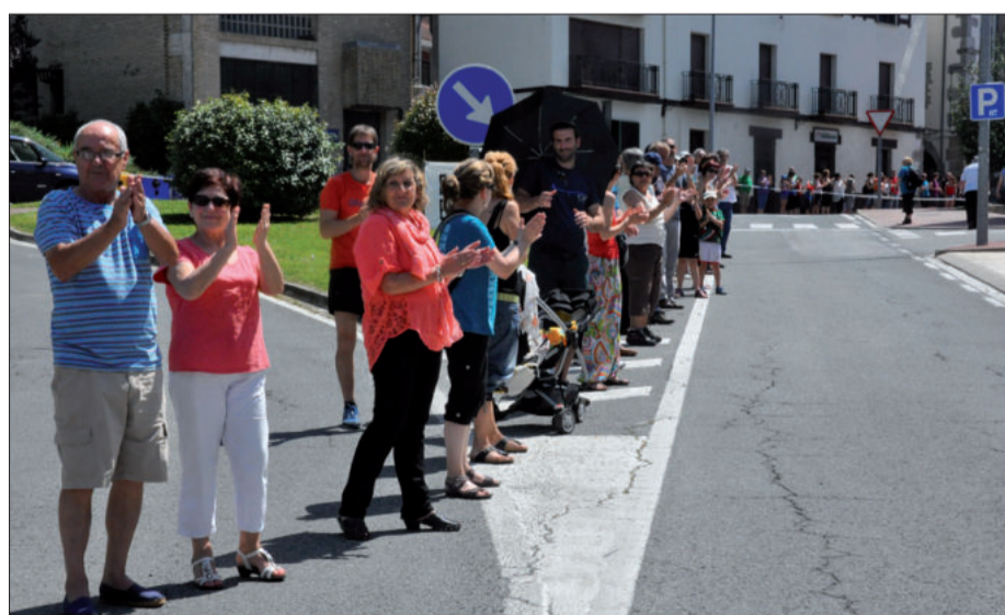
Zanpantzarrei lehenik eta giza-katearen amaieran, parte hartzaileek txalo egin zuten gogotik.