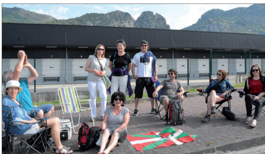
Antolatzaileen aginduei men eginez, aulkiak eramane zituzten itxaronaldia eroso egiteko. Zatoa eramatea ez zeterren antolatzaileen gidan, baina ez zen batere ideia txarra izan.