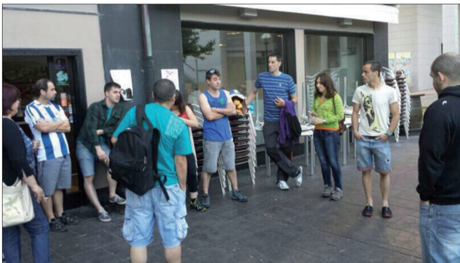
Goizeko zortzirak inguru horretan urnietar koadrilak giza katerako prest ikus zitezkeen.