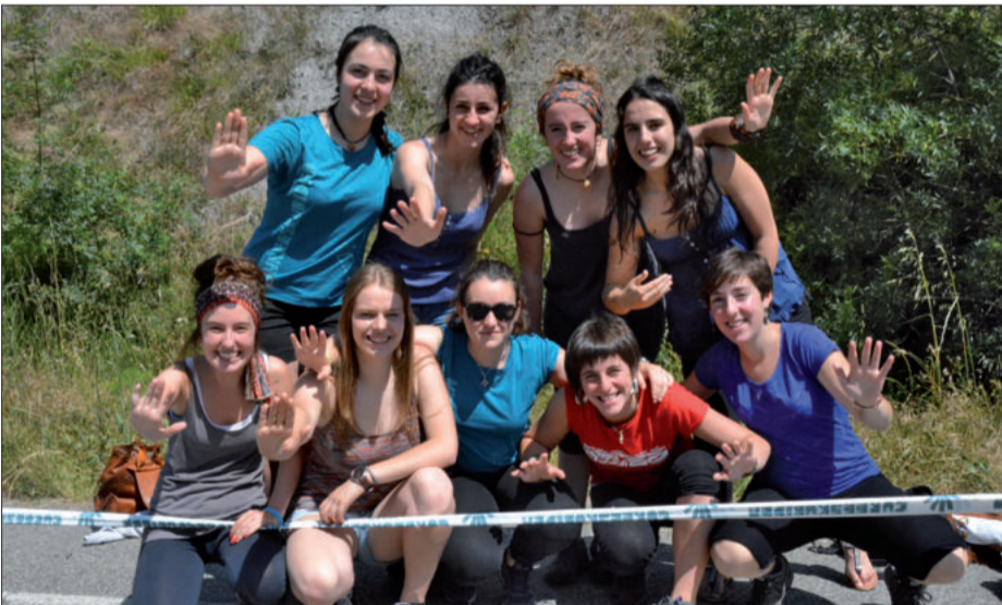
Eskua zabalik harro erakusten zuen koadrila gaztea, itzalik gabeko eremuan.