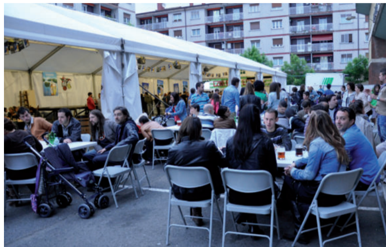
Garagardo azokatan ohikoa den menuaz gozatzeko aukera izango da Andoaingoan ere.