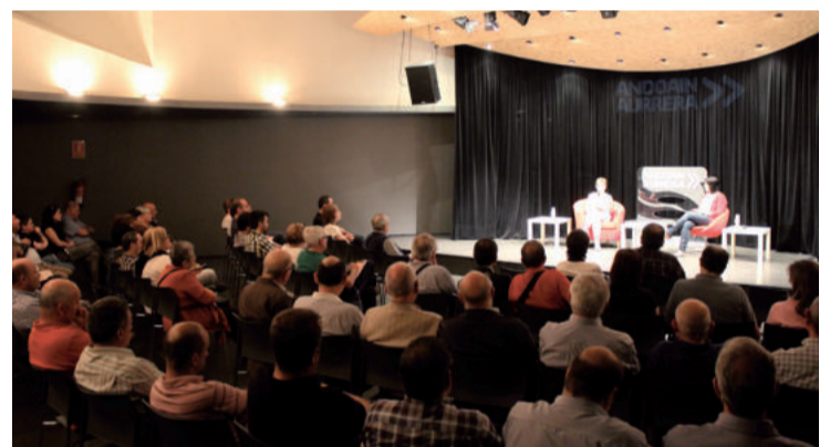
Ikusle ugari izan zituen aurrean Arantza Tapia Sailburuak.

zen ere, Euskadiren hazkundearen bidea”. Bestalde, poza agertu zuen “hamarkada askoren ondoren, lehen aldiz, errekupeazio ekonomikoa eta bakea eta bizikidetzat batera doazelako”.