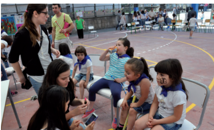
Ikasturte amaierako jaiarekin egun pasa ederra igaro zuten Ondarreta ikastetxe haur eta gurasoek. Argazki gehiago, Aiurrik Flickr atarian duen gunean.

“Andoain aurrera” foroan parte hartu zuen, ekainaren 6an