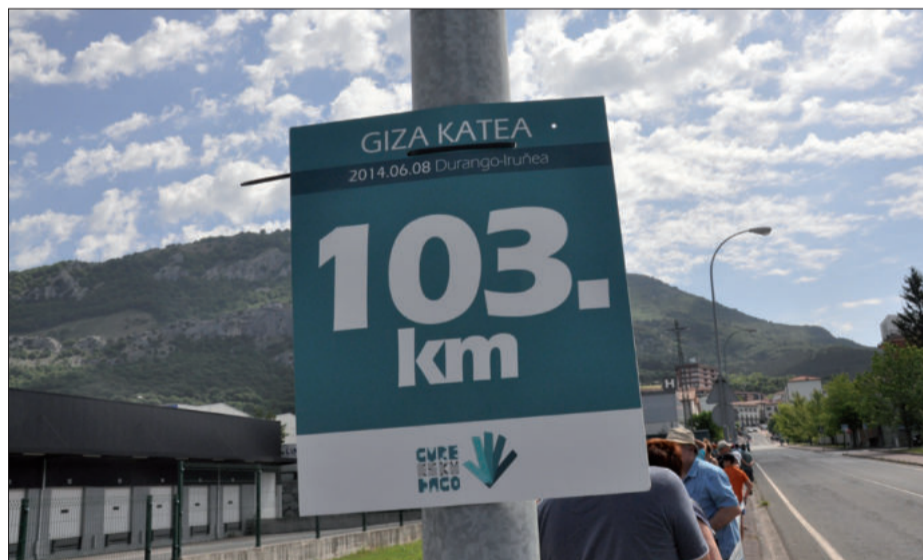
Ehun eta hirugarrena, ehunka andoaindarrek berehalakoan ahaztuko ez duten kilometroa.