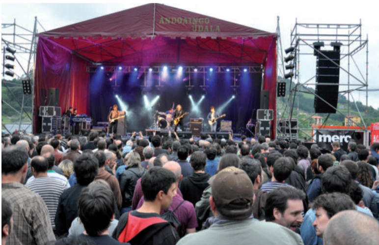
Euskal Herriko eta nazioarteko taldeak ikusteko aukera izango da larunbatean.

Larunbat gauean, gainera, garagardoak osagarri bikaina izango du: rock musika. Andoaingo rock jaialdiaren edizio berria ospatuko da, andoaindarren artean geroz eta interes handiagoa pizten duena.