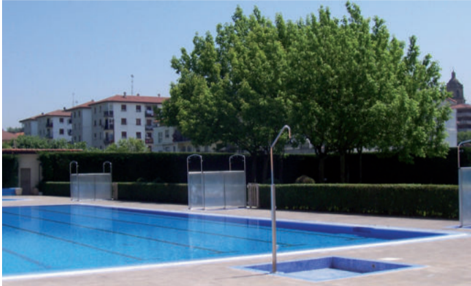
Ekainaren 14tik irailaren 14ra arte zabalik izango da igerilekua.

Udaren etorrera ondoen adierazten duen albiste