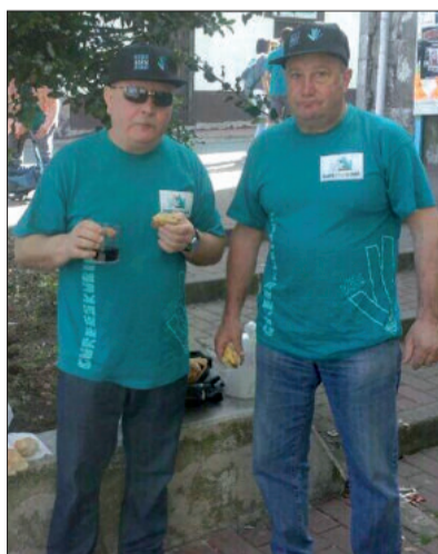
Hamabiak iritsi bitarte, hamaiketakoa.

Aiurriko erredakzio batzordeko ki-deen lanaren osagarri, aiurrizale talde bat argazkiak eta bideoak igortzen aritu zen igande osoan zehar. Teknologia berriak erabiliz, aiurrizaleek bidalitako argazkiak berehala ikus eta partekatu zitezkeen sare sozial ezagunetan. Aiurriekin bat egin zuten urnietar eta andoaindar horien argazkiekin lehen argazki-bilduma sareratu genuen Flickr gunean, eguerdiko 13:00ak baino lehen. Herritarrak eta tokiko hedabideak elkarrekin lanean, informazioa denbora errealean zabaldu zen. Eskerrik asko Aiurriekin bat egin zuten guztiei.