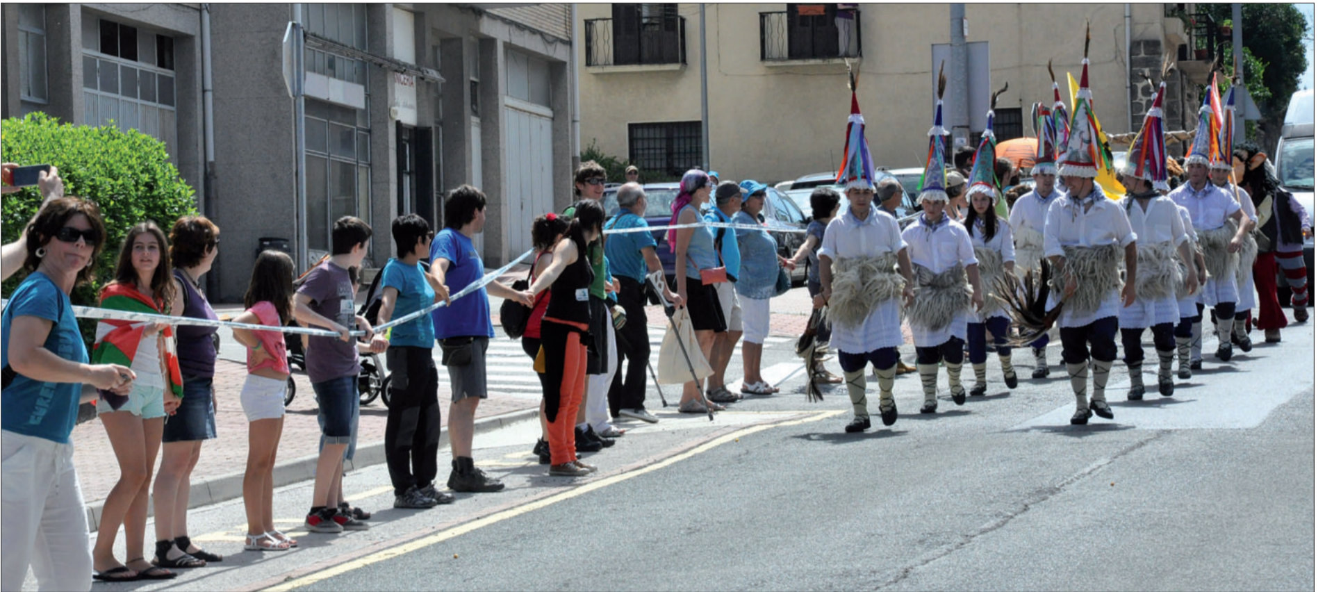
Herriko zanpantzar eta pertsonaia mitologikoen kalejira ezusteko atsegina izan zen Andoaindik eta Urnietatik joandakoentzat. Bi kilometroetan zehar, ateratzen zuten soinuarekin, herritarrek txalo zaparradarekin erantzun zieten.