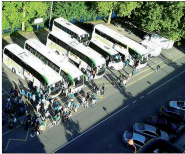
Autobusen azpiegitura ikusgarria, airetik hartutako irudian.