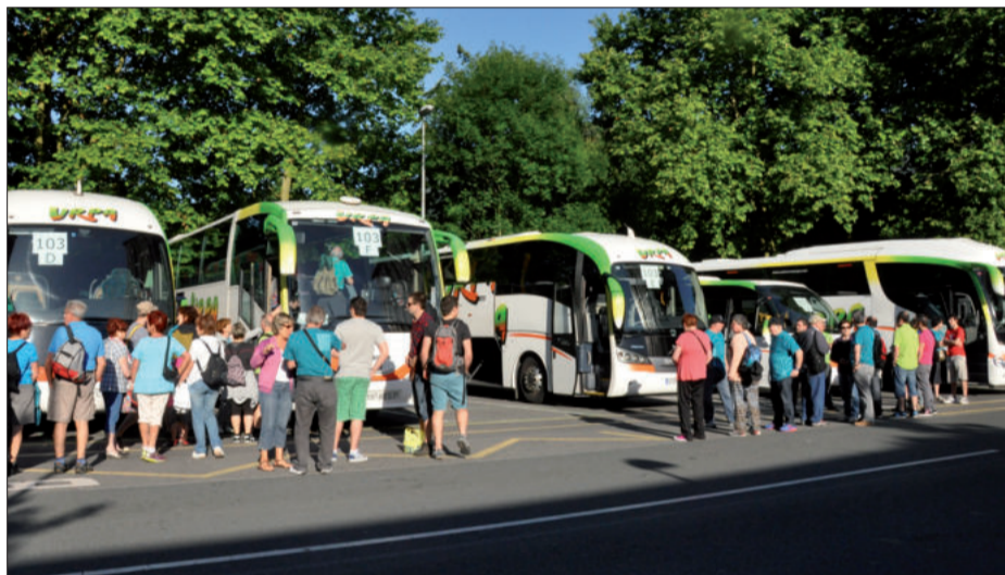
Urpa eta Izaskun konpainiatako autobusetan mila pertsona abiatu ziren igandean Irurtzun aldera.

Beraz bihoakie gure eskerrik beroena Keinu arropa dendari, Ernaitza liburudendari, Xaxi eta Lanbroa tabernei, Li arropa dendari, Ikelatz mertzeriari, Urrats inprimategiari eta Aralai dendari.