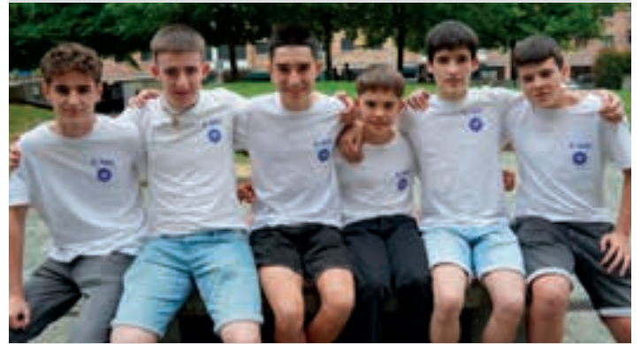
Taldekieak, Etxeberri plazan, emanaldiaren aurreko uneetan.