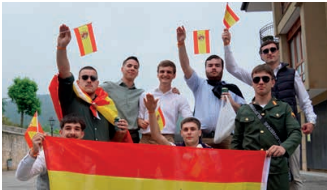
Umorez blai, urnietar askoren harridura eta irriak eragin zituen Cayetanoen moda Urnietara ekarri zuen kuadrillak.

Poxta Zahar gazte kuadrillen elkarteak eta, oro har, Urnietako Gazteak dira jaiekin gehien gozaten dutenak. Izan ere, adin-tarte hori aintzat hartuta antolatzen dira jaiak. Ostegunean pinto-potearekin ekin zioten asteburu luzeari