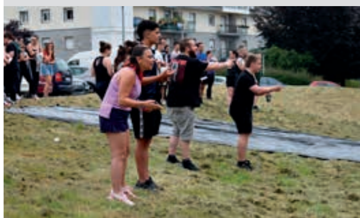
Finala serio-demonio hartu zuten partaideek. AIURRI