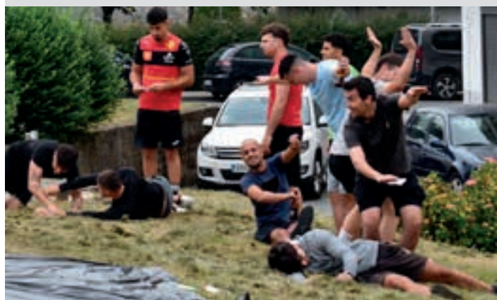
Hitzak asmatzea zen jolasetakoa. AIURRI

Interes bizia piztu dute olinpiadek 2026an eta hori nabaritu zen finalaren egunean. Ostiral arratsaldean kuadrilla ugari elkartu zen azken jolasetan hartzeko edo, besterik gabe, finalaren ikusle izateko.