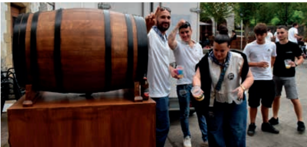
Paella ederra eta Altuna sagardotegiko sagardoa: osagai bikainak herri-bazkarirako.