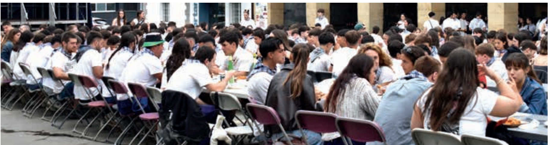
Kuadrillen eguneko bazkaria Gazte Festen hitzordu jendetsuena da. AIURRI