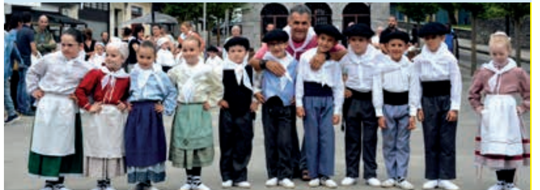
Dantzariak ikasturtean ikasitakoa erakusteko aukera baliatu zuten. AIURRI