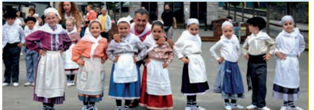
Edu Muruamendiarazen esanetara aritu ziren dantzari txikiak. AIURRI