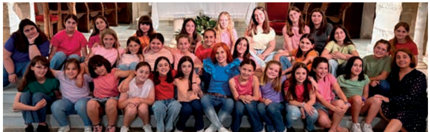
UDAL MUSIKA ESKOLA