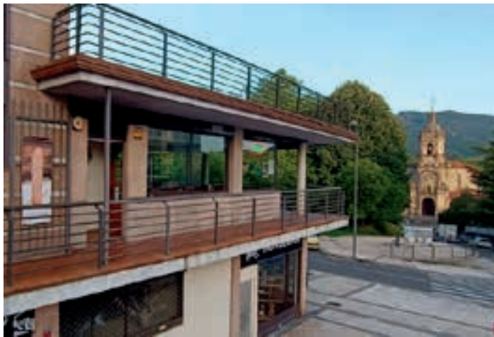
La Salle hiribidean, behatoki ederreko terraza dauka Intza kafetegiak. AIURRI