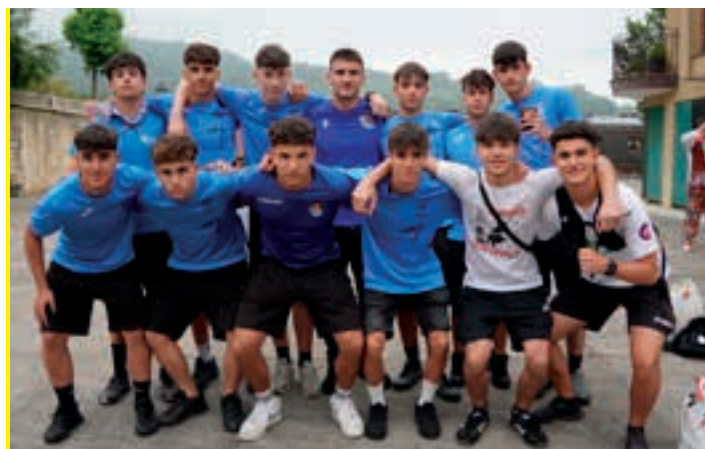
Jakutegi plazara esandako orduan hurbildu zen kuadrilla.

Ostiralean olinpiadei amaiera eman zieten, jolas dibertigarrien bitartez. Eta, denborarik galdu gabe, mozorroen afarira hurbildu ziren gehienak. Gaua musika doinuen pean luzatu zen eta, biharamunean, jaiak ekitaldiz beteriko egunarekin izan zuen jarraipena: poteoa, bazkaria, musika doinuak... gozatu ederra hartu dute jai bere osotasunean bizitzeko aukera izan dutenek. Igandekoa atsedean eguna izan zen gautxorientzat.