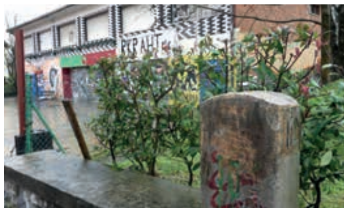
Gaztetxearen pareko zedarriak, N-1 errepide zaharrean Donostia 16 kilometrora zegoela zehazten du. AIURRI

bat azpiegitura eraiki dira (ingurabideak, saihebidak...) errepidean edo honen bazterretan. Aldaketa horien eraginez, Horrela, lau bat kilometrotan laburtu da Madril eta Irun arteko errepidea azken urtetan.