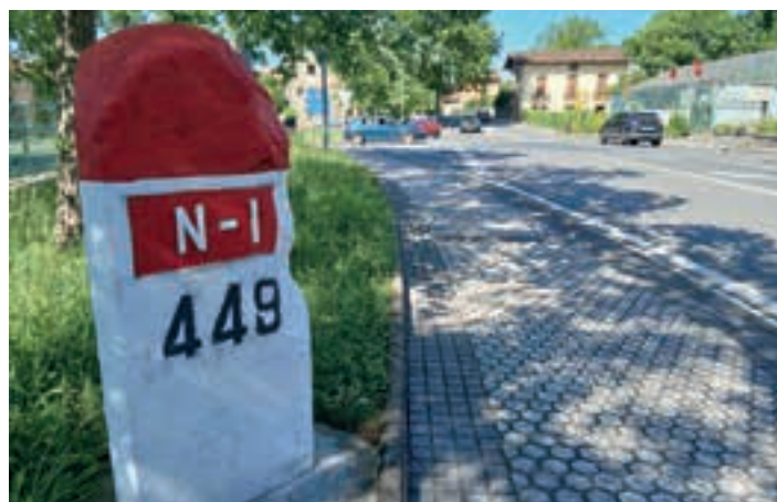
N-1eko zedarria, txukuntzaren ostean. AIURRI