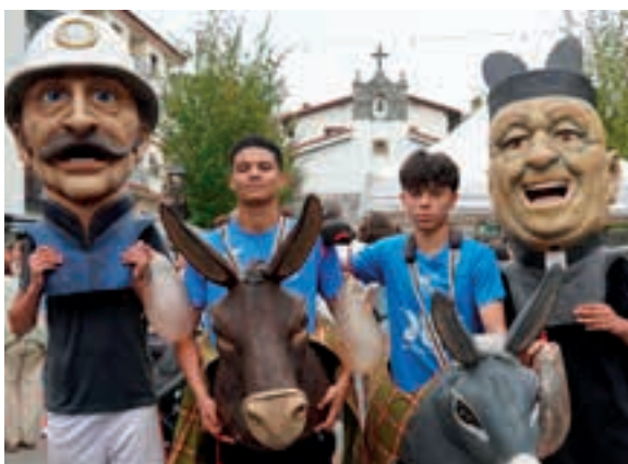
Buruhandiak jo eta su aritu ziren kalez kale. AIURRI