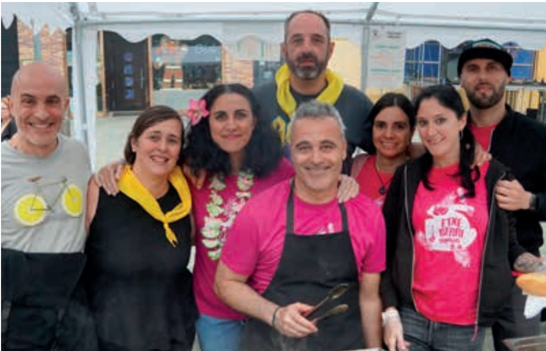
Auzoko Jai Batzordeko kideak eta laguntzaileak, ostiral iluntzean. AIURRI

Auzunean jarri zuen bertako Jai Batzordeak ospakizunetarako eremua: bost eurotan eros zitezkeen bokatak eta zuzeneko musikaz gozatzeko oholtza. Ai ama! erromeri taldea izan zen Etxeberri plaza girotu zuen taldea, ostiral gauean