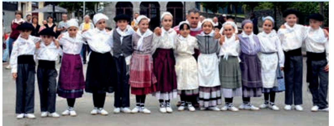
Larunbat goizean ere euskal dantzak nagusitu ziren San Juan plazan. AIURRI