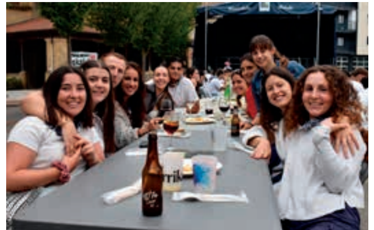
Lagunartean bazkaltzeko mahai ugari jarri zituen antolaketa-taldeak.