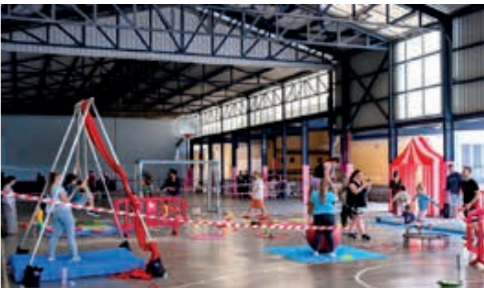
Jarduera ugaritan trebatzeko aukera ematen zuen igande goizeko planak. AIURRI