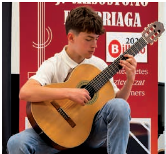
UDAL MUSIKA ESKOLA