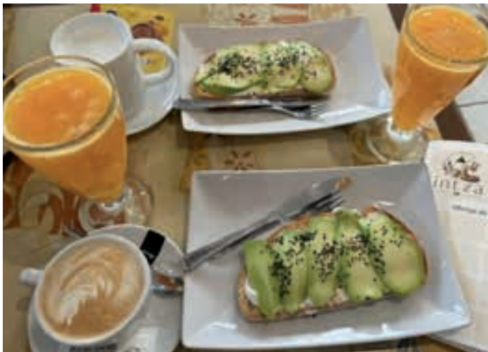
Bezeroek aukera zabala daukate Intza kafetegian. AIURRI