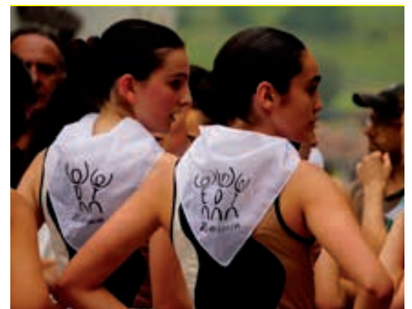
EDTren XX. urteurreneko zapia oso presente dago oraindik. AIURRI