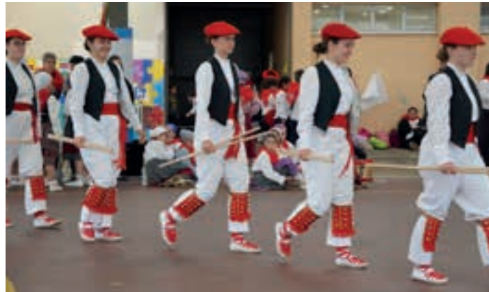
Artxiboko irudia. AIURRI

19:00-20:00, Ondarreta . Ekainak 8, 10, 16, 18 eta 22.