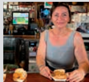
Kantoi. POXTA ZAHAR