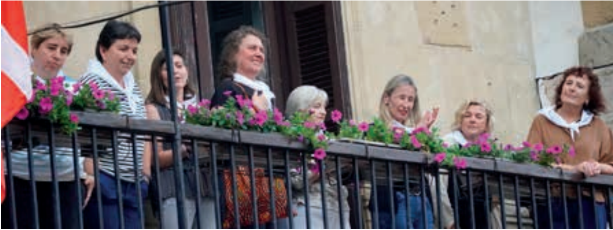
Egape Dantza Taldeko sustatzaileak, balkoian.