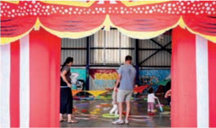
Sarbide erakargarria, Egape ikastolako jolastoki estalian. AIURRI