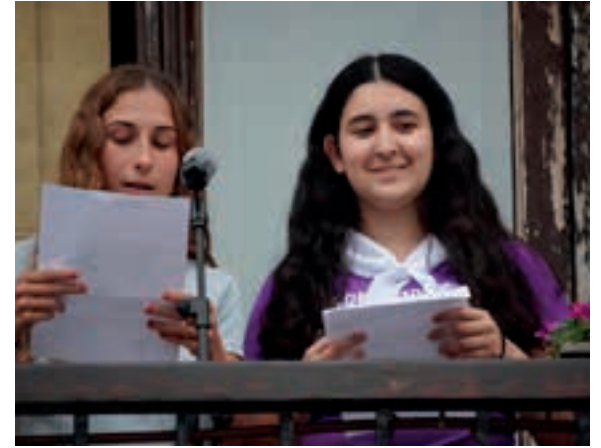
Pregoiaren bidea ikusgai dago Aiurri.eus webgunean. AIURRI