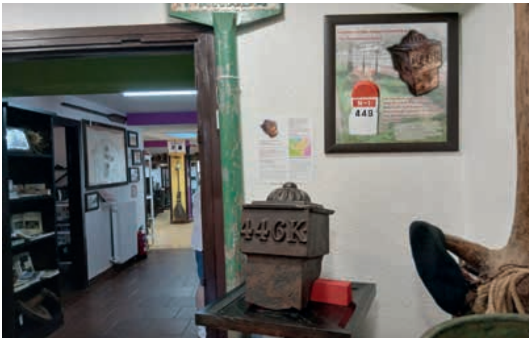
1856ko zedarria Burdinak zaintzen duen Gordelekuren sarreran, ikusgai jarri dute. AIURRI