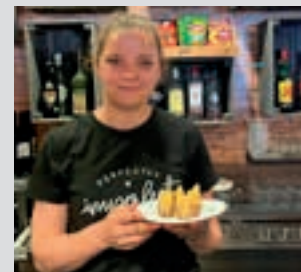
Frontoi. POXTA ZAHAR