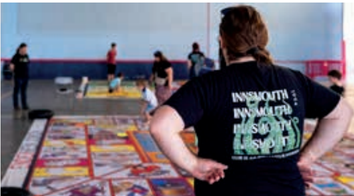
Familia-giroko jolasak, antolatzaileen begiradapean. AIURRI