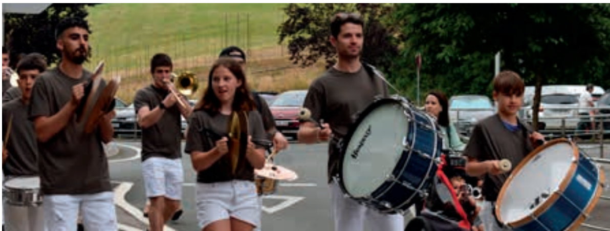
Adarra jo txaranga, Urnietako kaleetan, Gazte Festen hasieran.