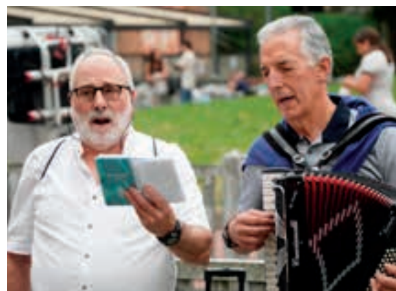
Kalejirari "Kantazaun" izen bereko kantuarekin ekin zioten. AIURRI