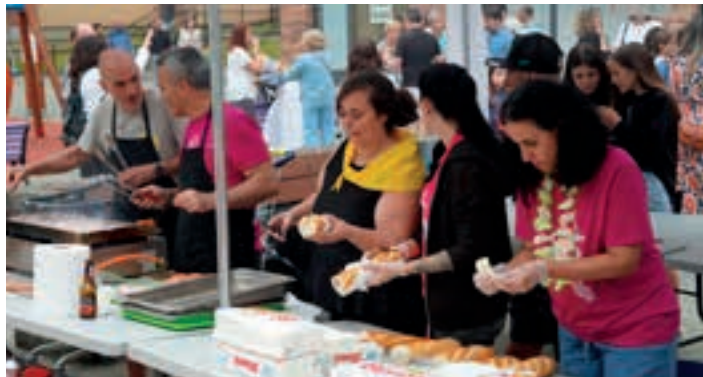
Jai Batzordeak, auzoari eta herriari begira, eskertu beharreko lana egiten dihardu.

Gizarte eragileek aberastu egiten dute herri-giroa. Azken urteotan, urteko sasoi ezberdinetan, Etxeberri plazako Jai Batzordeak, auzoari eta herriari begira, eskertu beharreko lana egiten dihardu. Aurreko ostiralean, esaterako, oholtza egokitu, musikarekin plaza girotu eta bertan afaltzeko aukera eman zieten herrikideei. Hala, Etxeberri plaza herriguneko festagune bat gehiago izan zen.