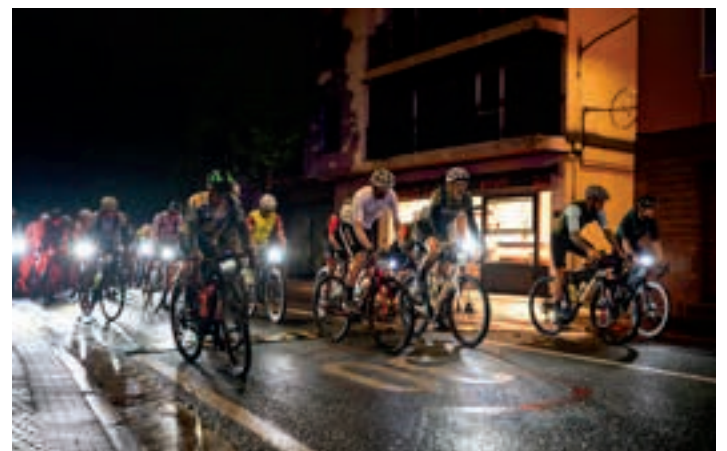
270 kilometroko ibilbidea egin zutenen irteera, goizeko 05:00etan. AIURRI