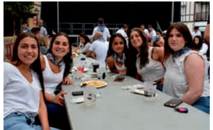
200dik gora lagun elkartu zen San Juan plazan, larunbatean.