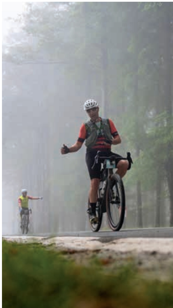
Goizaldean behelainoa nagusitu zen Laba Gravel proban.

Aitor: “Eskerrak antolakuntzari. Primerako proba daukazu, hornidura-gune ederra, giro ederra! Datorren urtean ere itzultzeko gogoz!!”.