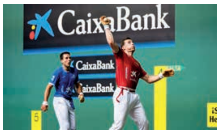
Finala jokatu osteko sari banaketa ekitaldia. AIURRI