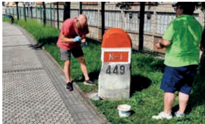
Madril-Irun N-1 errepide zaharrean, 449. kilometroa markatzen duen zedarria txukuntzen aritu dira azken aldian. BURDINA

N-1a Karrikan sartu eta Etxeberrieta, Zumea, Kale Berria, Bastero eta Bazkardo gurutzatzen zituen errepide horrek, Oria auzoranzko bidea hartu aurretik. 1972az geroztik zeharbideak egiten hasi ziren eta mugarri horiek beren funtzioa galdu egin zuten. Gainera, azken urtetan makina