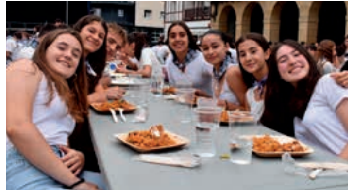
Bazkaria eserik egoteko tarte bakanetakoa izan zen larunbatean. AIURRI