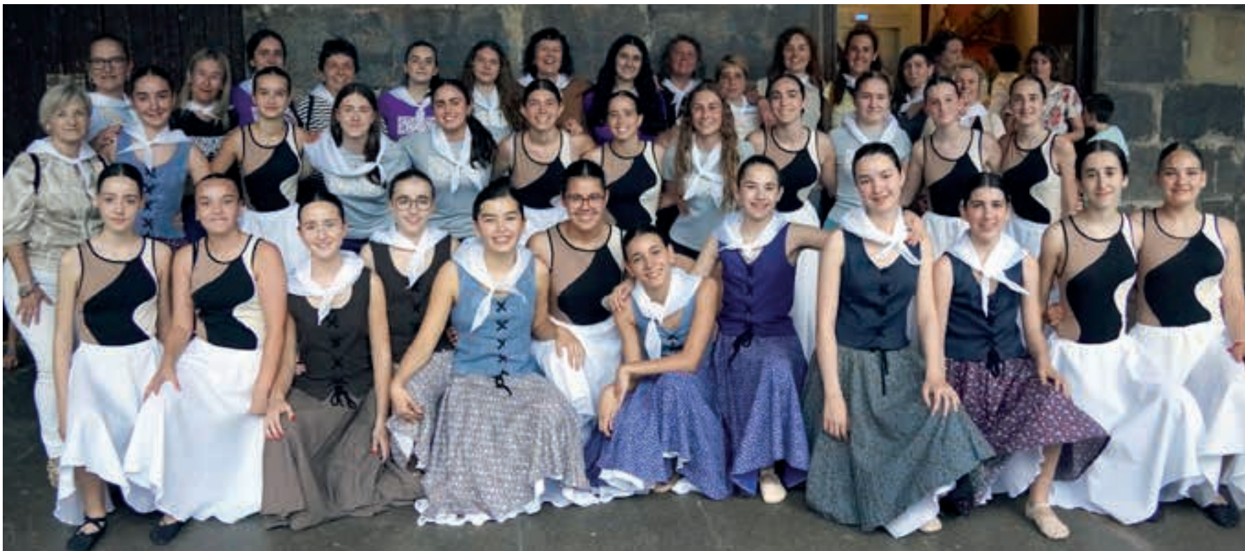
Plazan dantzan aritu zirenak, pregoia irakurtzen eta suziriak jautzen aritutakoak eta balkoiaren alde banatan ziren kide guztiak, elkarrekin, Kontsejupean ateratako argazkian. AIURRI