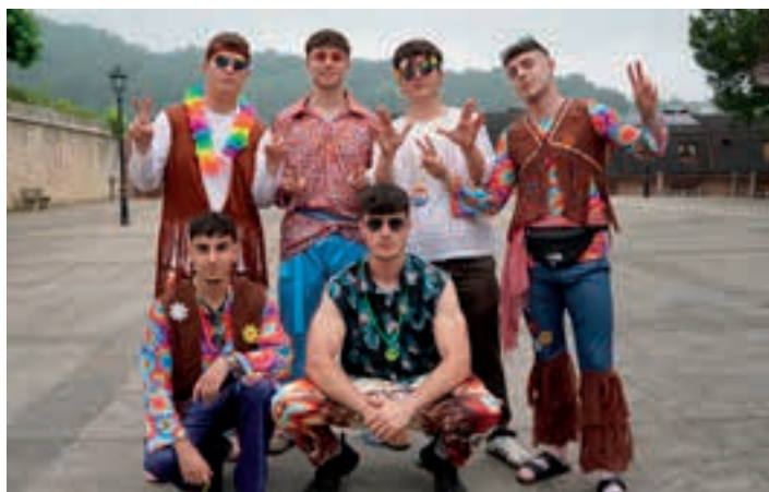
Modako janzkera izan zela zalantzarik ez da. Zein garaikoa, hori beste kontu bat da.