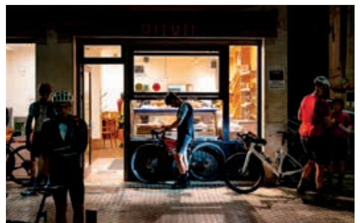
Ohi bezala, Arruti gozotegia goizaldean ireki zuten. AIURRI