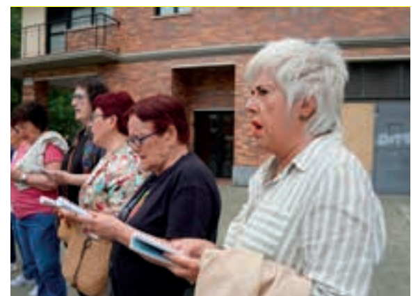
Euskal kantagintza biziberritzen lanean ari da Kantazaun. AIURRI