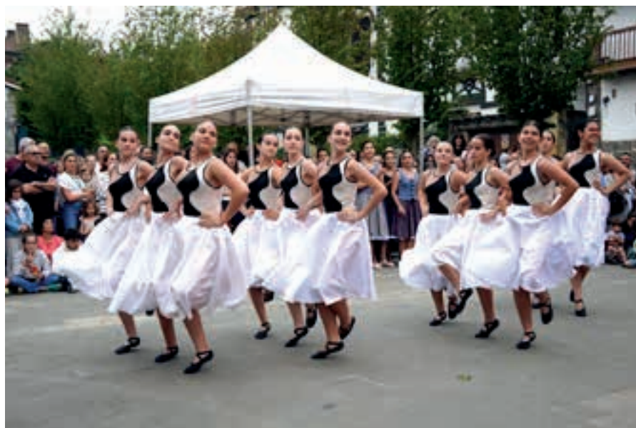
Dantza erakustaldi berria egin zuten Egapeko kideek, San Juan plazan, Gazte Festen hasierako txupinazoari ekin aurretik. AIURRI