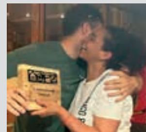
Pozarren, Riojanosen. POXTA ZAHAR