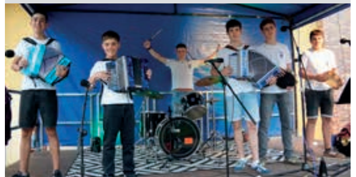
Taldekieak emanaldiari hasiera emateko gogoz zeuden.

Udari begira, berriz, zortzi dantzaldi lotuta dauzkate jada, Ai Ama!-ren oihartzuna dexente ari baita zabaltzen Tolosaldean eta Beterri-Buruntzan. Euskal kutsuko abestiak jotzen dituzte, erromeria giroko klasikoak eta modernoagoak (La Txama, Esne Beltzak, Dupla...) uztartzen saiatzen dira, nahiz eta rantxerak eta antzeko doinu dantzagarriak ere sartu errepertorioan. "Unean-unean egokitzen den plazaren eta jaiaren arabera, adin guztietako publikoarentzat jotzen saiatzen gara. Prest gaude edozein adineko jendea dantzan jartzeko! Gertatu izan zaigu gure aiton-amonak izan zitezkeenak edukitzea aurrean, eta oso gustura aritu gara".