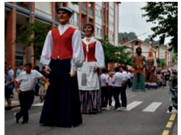
Erraldoiak eta buruhandiak, atsedentartean. AIURRI