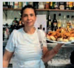
Riojanos. POXTA ZAHAR