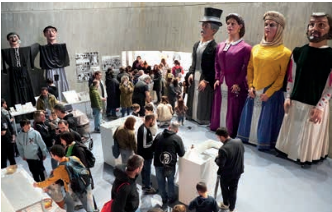
Aurreko ostegunean egin zuten erakusketaren irekiera-ekitaldia. AIURRI