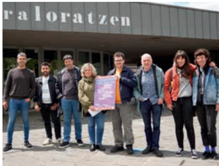
Plaza Morean egin zuten agerraldia.

Andoaingo Rock Jaialdiaren 18. edizioa ekainaren 13an izango da. Ohi bezala, oholtza nagusia Nafarroa plazan jarriko dute eta, aurretik, eguerdian hasita, udalerriko beste tokietan kontzertu txikiak izango dira. Nazioarteko hainbat talde ezagutzeko aukera izango da Nafarroa plazan: Erresuma Batuko Maruja, Frantziako Lézard eta estatu mailako nahiz Euskal Herriko Las Petunias, Pacto te quiero, Exnovios eta Silitia. Eguerdian hasita, Aperitif izeneko emanaldietan, Barrrk, Iiingles eta Katiuskak taldeak zuzenean ariko dira.