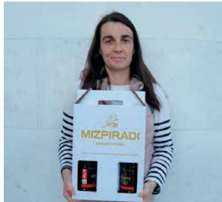
"Nago", saria eskuetan duela. AIURRI

Joko ezagunaren 21. denboraldian, Tokikom Liga jokatzeko ari da Aiurri (Beterri-Buruntza) taldea