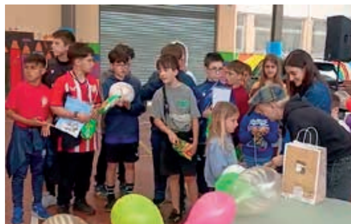
Gynkana mitologikoaren sari-banaketa ekitaldia. AIURRI

0-12 URTE BITARTEKO GURASOEN PARTE-HARTZEA SUSTATZEA IZAN DA HELBURUETAKOA