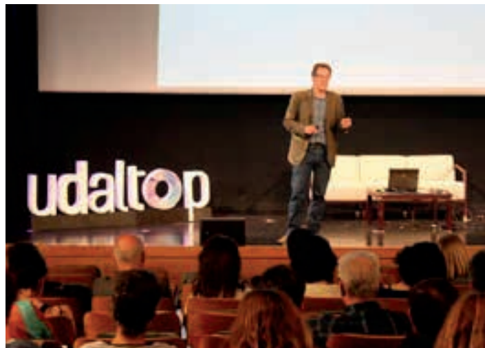
Topaketa, artxiboko irudian.