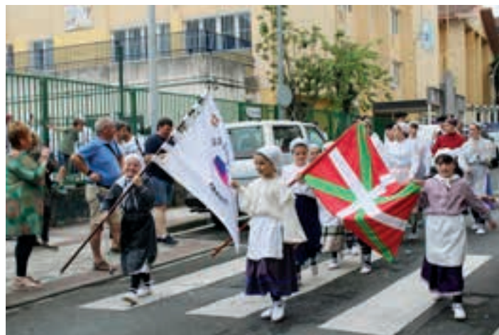
Egun osoko ospakizuna antolatuta du Egape Dantza Taldeak. AIURRI

12:00, Bastero Kulturunea. Maiatzak 24, igandea.