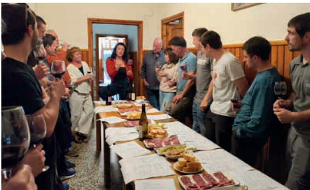
Lehen ardo dastaketan hogeita lagun elkartu ziren. MATXO

M.I. Bai, hain zuzen ere, hori bilatzen dugu; gazteak eta adineko jendea batzea. Giro hori sortu nahi dugu.