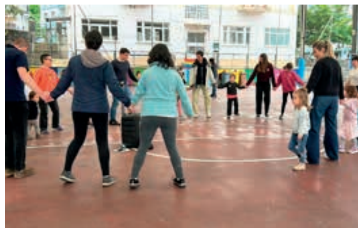
Plaza-dantzekin amaitu zen Eusfesta.