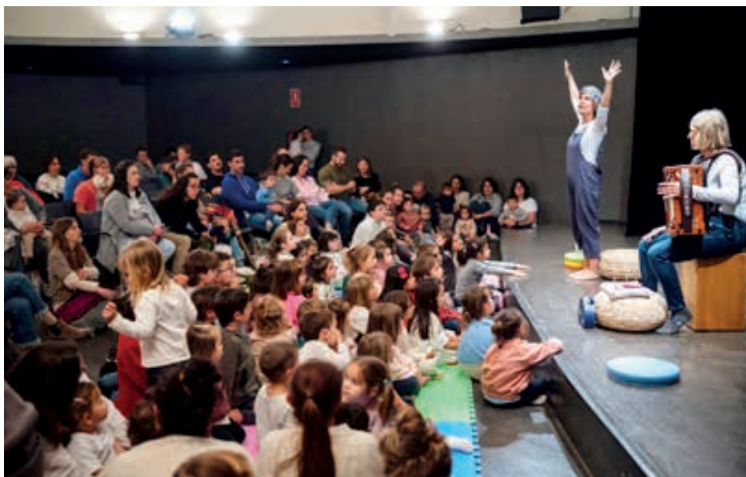
Xoo! ipuin-musikatua emanaldira haur eta familia ugari hurbildu zen. AIURRI