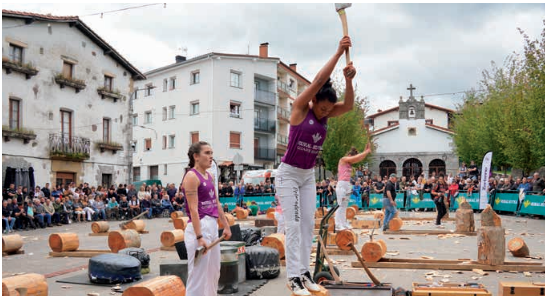
Irudi ikusgarria sortu zen San Juan plazan, aurreko igandean. AIURRI