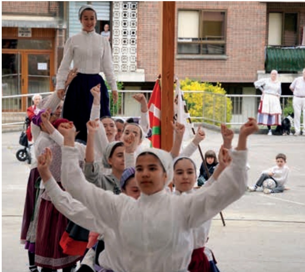
XIX. Urnieta Erromerian, iazko udaberrian. AIURRI

gatik, gazteek horrelako esperientziarik ez bizitzea. Haien artean oso hunkigarria da; ez da besterik gabe dantza egitea. Gurasoen konpromisoa txikiagoa izango balitz, uste dut haien esperientzia ez litzateke berdina izango.