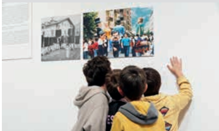
Lebiton konpartsatik harago doa erakusketa.