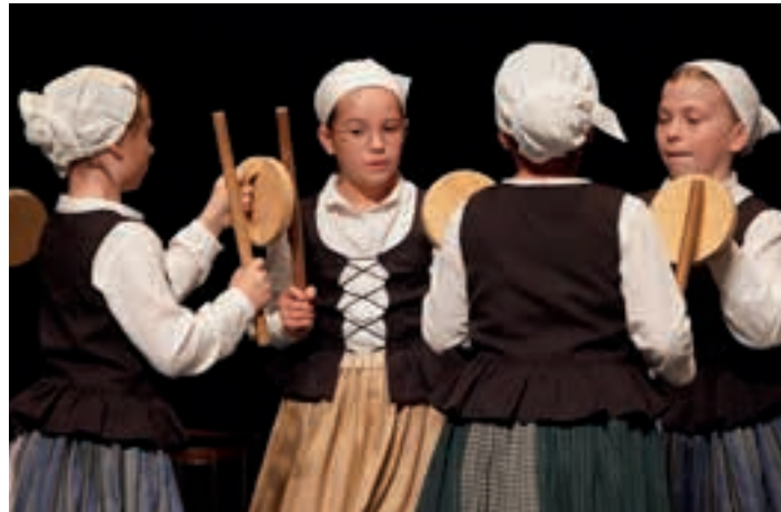
lazko emanaldia, Bastero Kulturunean. AIURRI