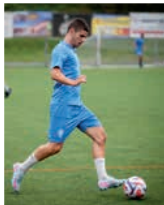
Artxiboko irudia.

Bi edo hiru taldek lortuko dute Ohorezko mailara igoera eta Euskalduna hautagaietako da. Aurrekoan Antiguoko B taldeak jokatu zuten Ubitarten eta liderra zergatik den ondotxo erakutsi zuen. Aurkari zaila izan zen urdiñentzat: 0-3 amaitu zen partida. Pasaian jokatuko dute azkenaurrekoa eta, azkena, Ubitarten, Goierri Gorri Bren aurka.