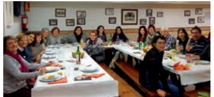
Euskaltegian bezala, Mintzalagunak egitasmoan euskaraz trebatzeko aukera dago.

Andoaingo AEK euskaltegian dagoeneko zabalik dago aurrematrikulaziorako epea. Informazio gehiago: 943 69 17 04 / 688 74 66 43 (whatsapp)/ andoain@ae.k.eus. Ate-irekiera jardunaldia maiatzaren 27an izango da, 10:00etan eta 17:30tan.