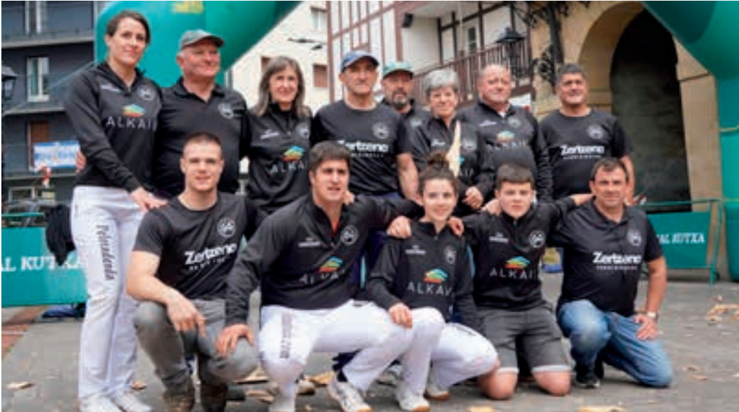
Zertzena elkarteko kideak, taldeko argazkian. AIURRI