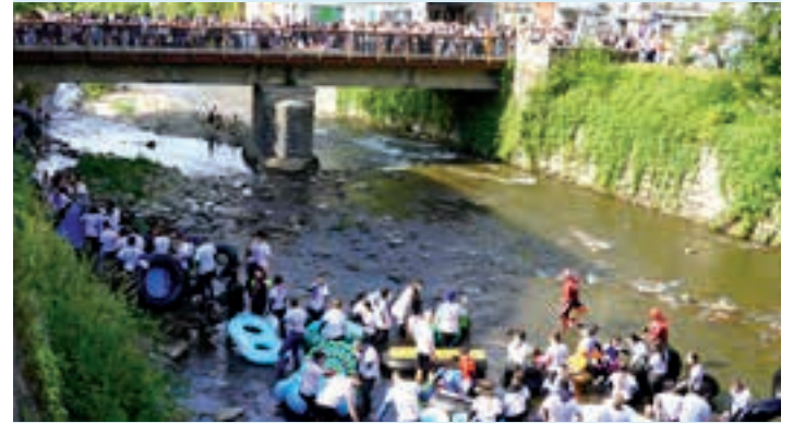
Errekan eta zubiaren inguruan jendetza elkartu zen. AIURRI