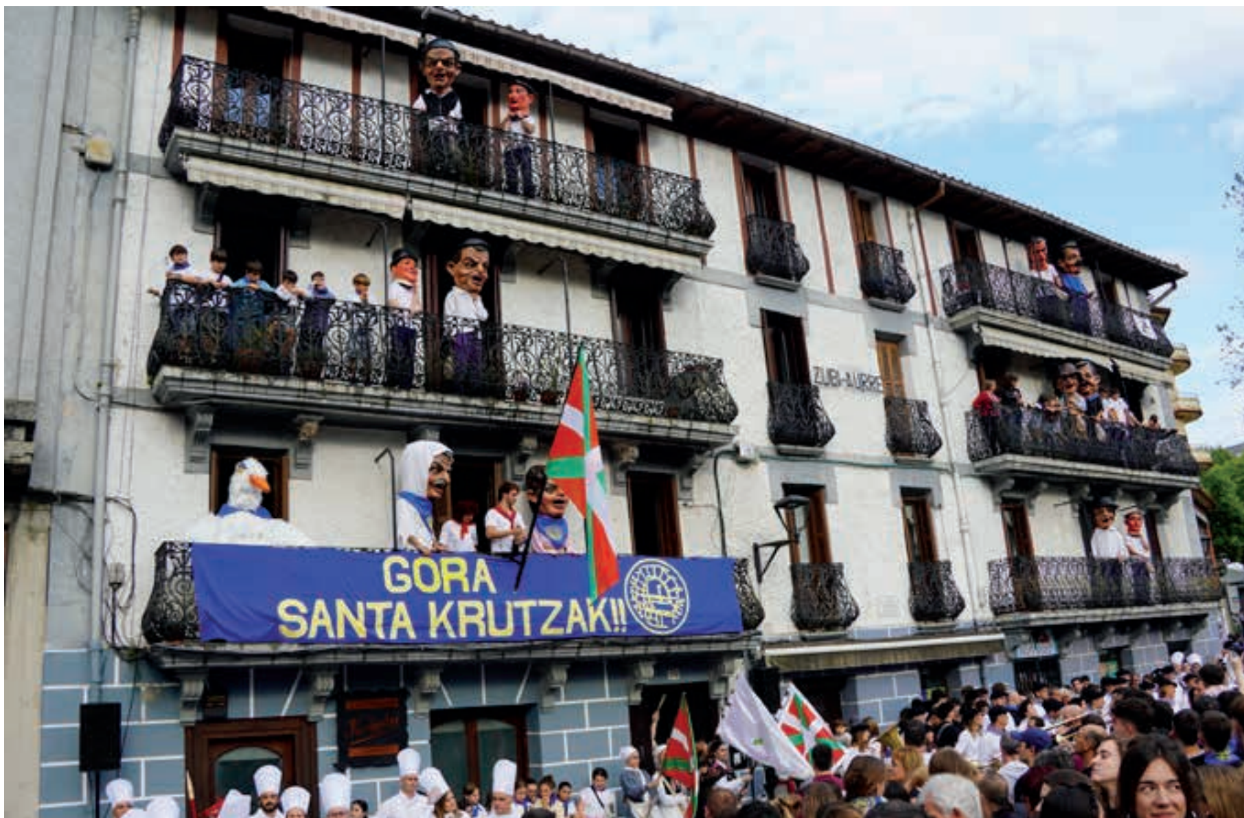
Lebiton eta Krutzi, Zubiaurre etxeko balkoian. Eta, gainerakoetan, konpartsako buruhandi guztiak. Zubian, aldiz, konpartsako erraldoi guztiak. AIURRI