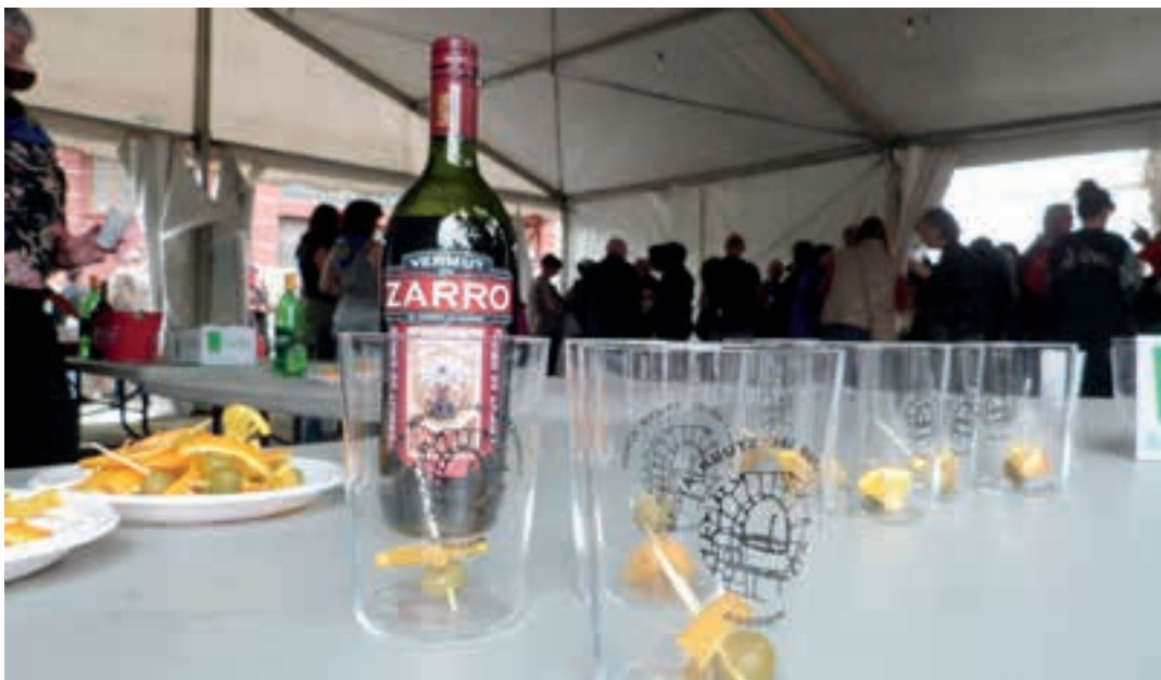
Bermuth musikatua egin zuten maiatzaren 2an. AIURRI