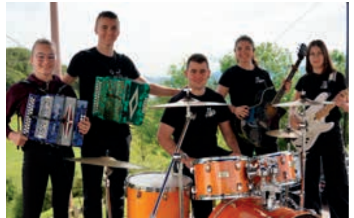
Komerik taldeko kideak, aurreko igandean.

Hernaniko eta Urnietako musikari gazteek osatzen duten Komerik taldeak girotu zuen festa, igandean