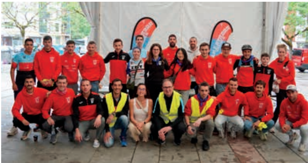
Zumeatarra taldeko boluntario talde handiari esker egin ahal izan zen maiatzaren leheneko krosa. AIURRI