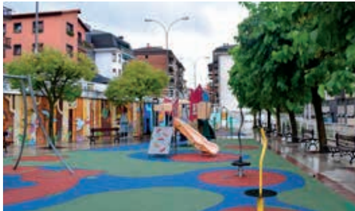
Maximo Yurramendi kaleko parkea.