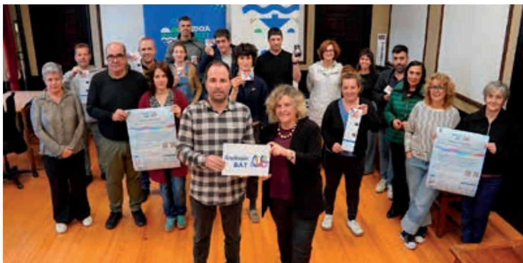
Agerraldi jendetsua egin zuten udaletxean, asteartean. AIURRI

Udalerrian egiten diren ekitaldiak jaso eta sustatu asmoz, argitalpen bateratua aurkeztu du Udalak. Zabalkunderako hiru euskarri izango ditu, gainera: APP aplikazioa, Andoain.eus webgunea eta hilabetean behin banatuko den eskuorria