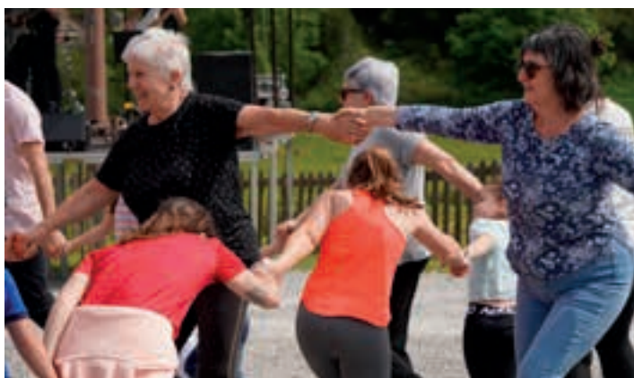
Dantza egiteko aukera aparta dago Azkorteke parajearen.

diogulako. Dena dela, urnietarroi zer edo zer kostatzen zaigu plazarako pauso hori ematea! Ez da erraza esplikatzeko Egape dantza taldeak egiten duen ika-ragarrizko lana euskal dantzen sustapenean, eta gero, nolako erreparoa daukagun plazara irteteko! Ez dakit lotsagatik ote den ala zergatik ote den!”.