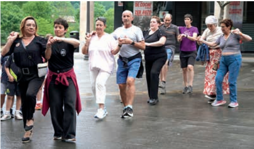
Iazko partaidetza handitu zen plaza-dantza emanaldian.