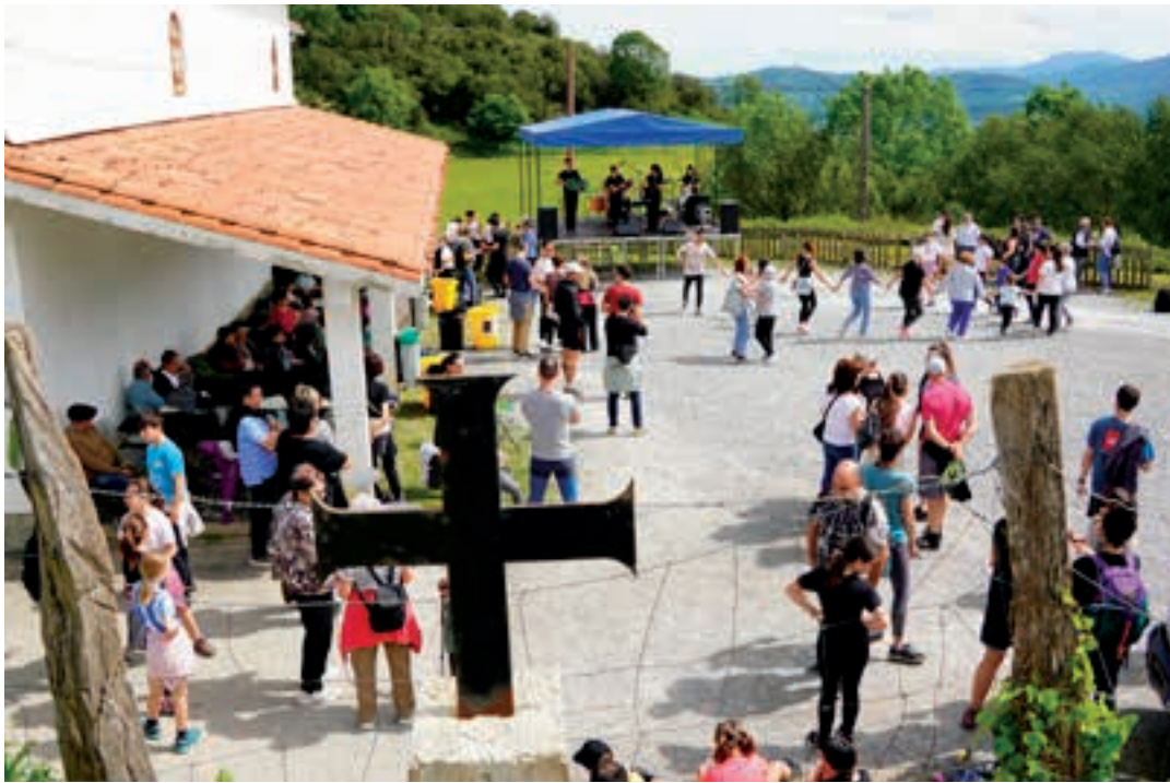
Akorteko paraje ederrean ospatzen da Santa Krutz jaia. AIURRI