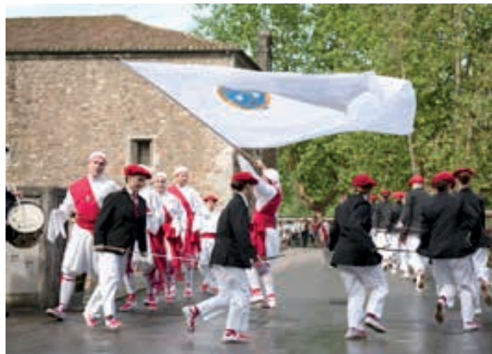
Bandera, lau haizetara, urteotako berrikuntza da. AIURRI