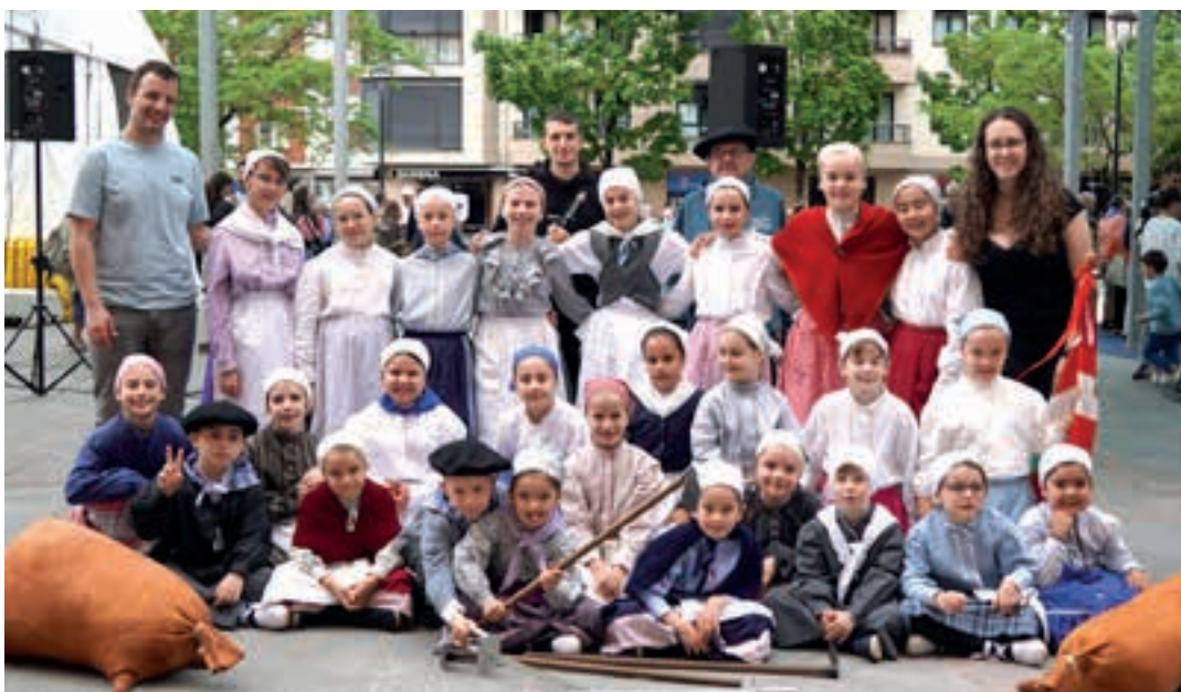
Urki dantza taldeko kideak, emanaldia amaitu berrian.