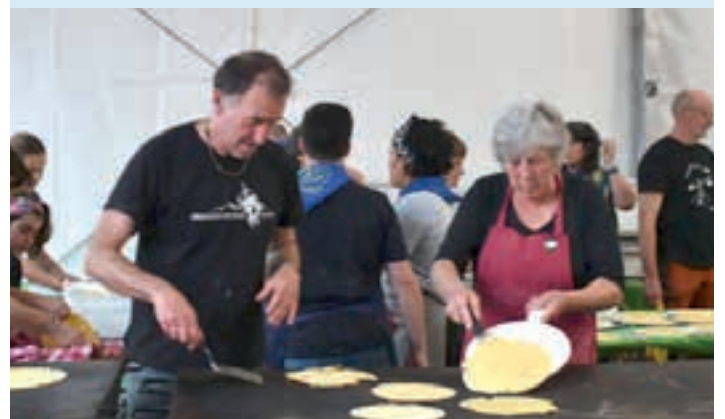
Basataloak lanean aritu ziren, igande arratsaldean.