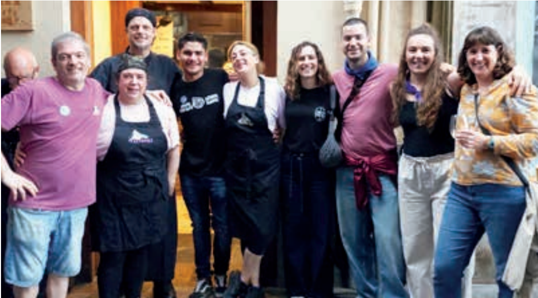
Txindoki taberna izan da aurtengo pintxo lehiaketako irabazlea. Pozarren ziren. Argazkian, epaimahaikideen alboan.