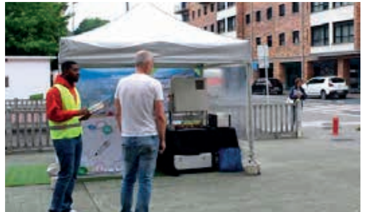
Informazio-gunea, Etxeberri plazan, artxiboko irudian.