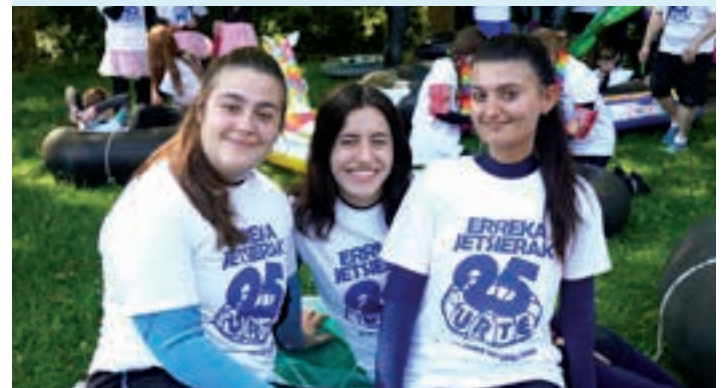
Olazarren hasi eta Olagainera iritsi ostean, herrigunerantz abiatu ziren. AIURRI