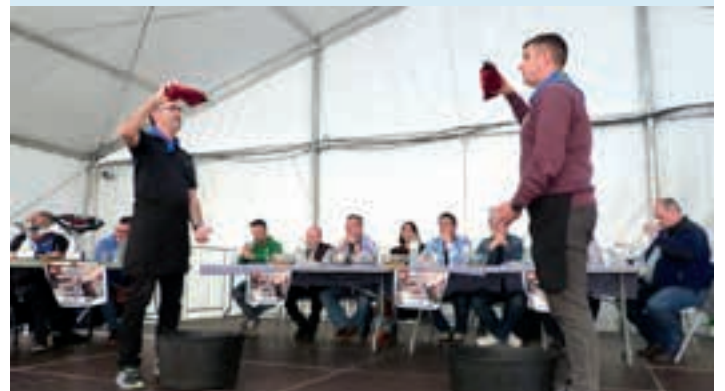
Zumeatarrak antolatutako txapelketan 12 sagardotegik hartu zuten parte. AIURRI