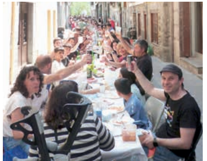
Horrela jarraituz gero, Kale Nagusi osoa beharko da auzo bazkarirako. AIURRI

Gaua iristearrekin batera, Lebi zezen-suzkoaren jaietako lehen irteera izan zen. Eta, txosnagunean, Hazas taldeak gaztetxoaren arreta bereganatu zuen.