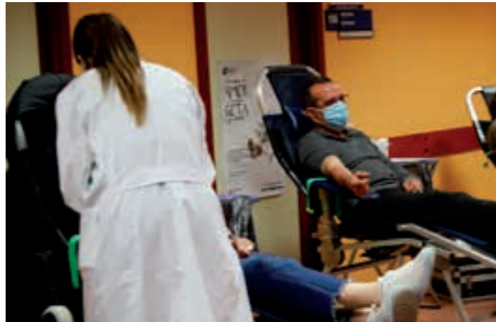
Odol-emaileak, artxiboko irudian. AIURRI

10:00-14:30, San Juan plaza. Maiatzak 16, larunbata.