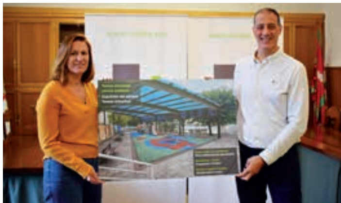
Agerraldia egin zuen Udalak, astelehenean. UDALA