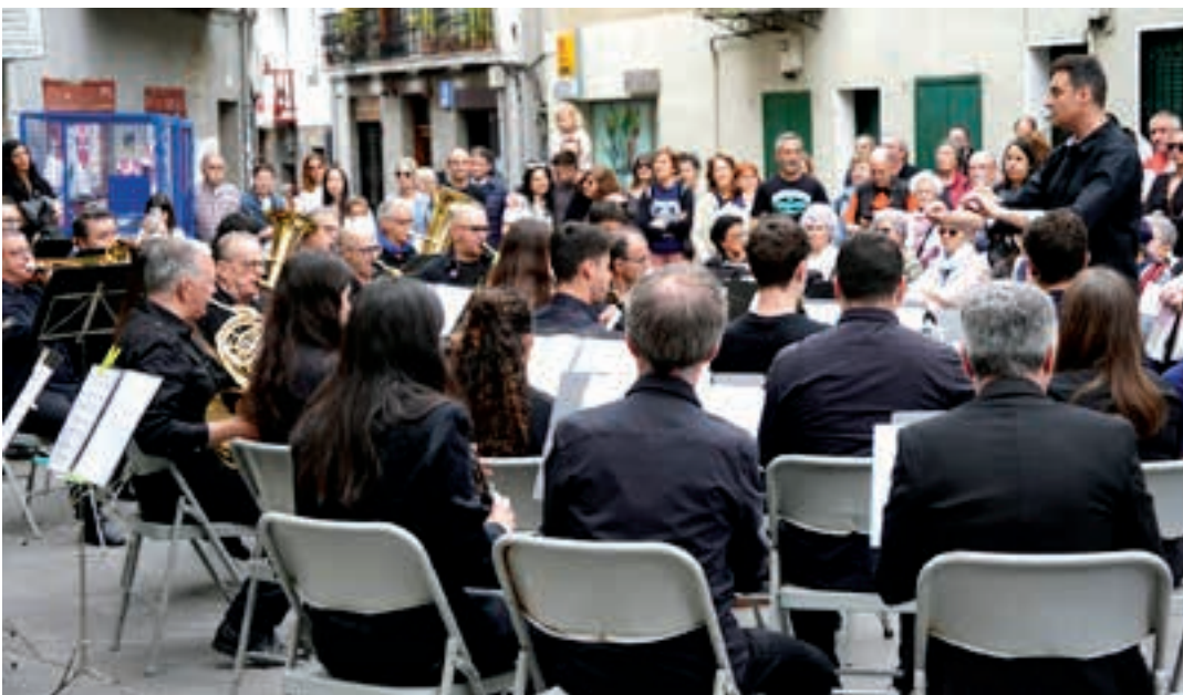
Udal Musika Eskolako Bandak emanaldia egin zuen Kale Nagusian.