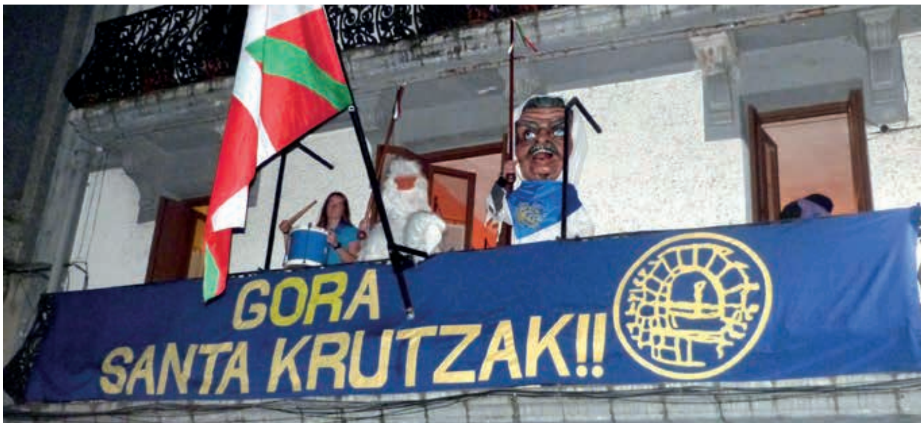
Igandean, Zezen-suzkoa amaitu berrian, Lebiton eta Krutzi igo ziren Zubiaurre etxera. Jai Batzordeko hainbat lagunekin batera, Andoaino Martxarekin agurtu zituzten Santa Krutz jaiak. AIURRI