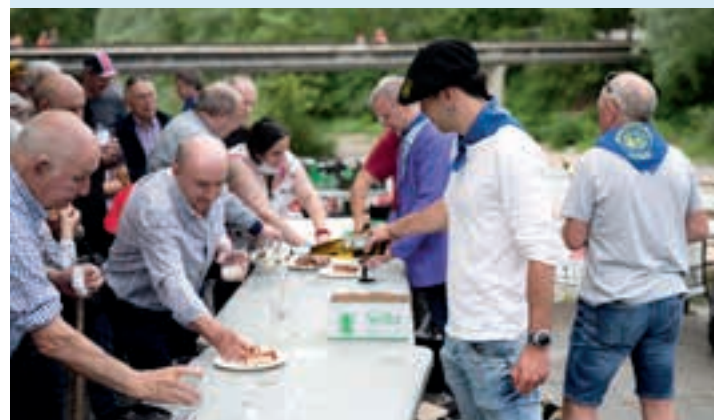
Goizean, txakolina. Eta, arratsaldean, sagardoa. AIURRI