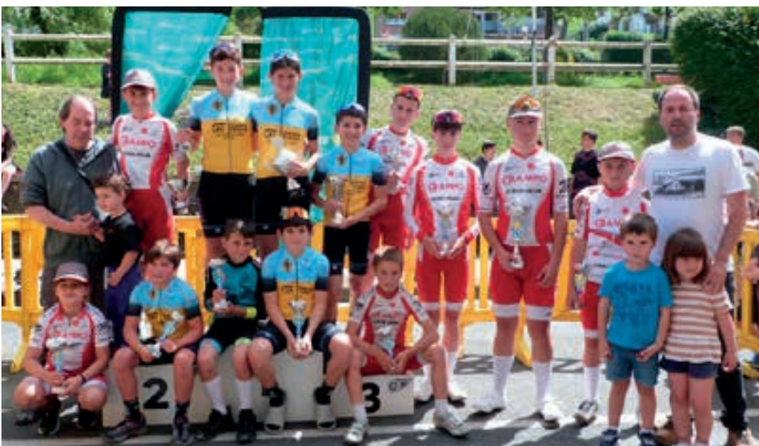
Haur eta gaztetxoek mailako txirrindularitza proba, Kale Berrian.

Gipuzkoako Foru Aldundia Diputación Foral de Gipuzkoa