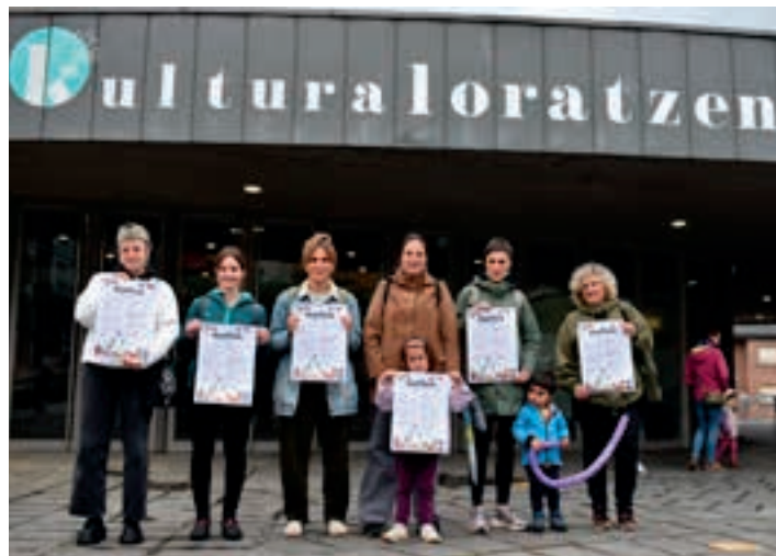
Agerraldia egin zuten, astelehenean, Plaza Morean. AIURRI

Santakruzak amaitu eta, bihar ramunean, prentsa-agerraldia deitu zuen Larramendi Kultur Bazkunak. Nago Huizi euskara