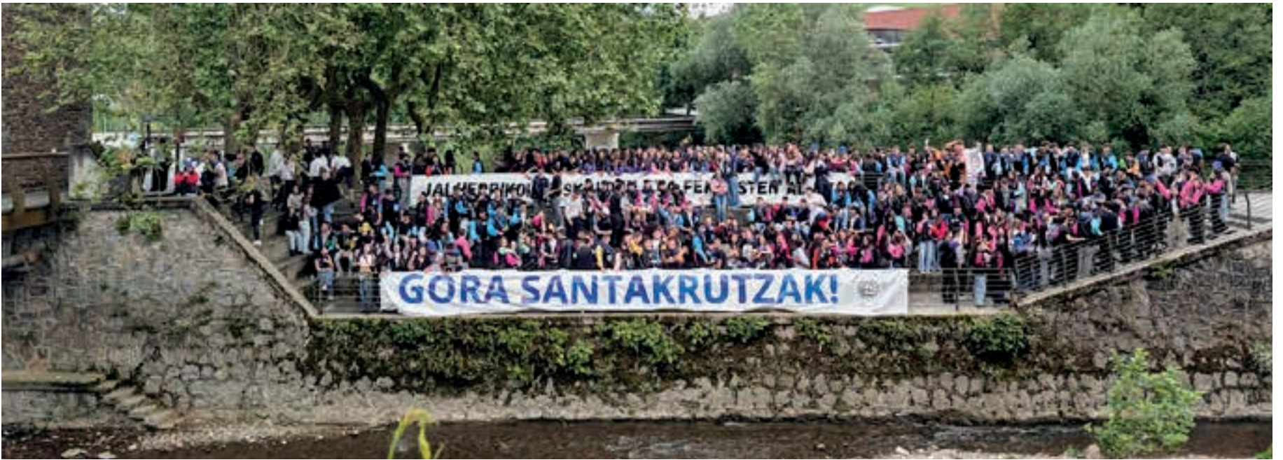
Askotxo ziren eta gehiago izan zitezkeen argazkia iragarritako orduan atera izan balute. Izan ere, 08:00tarako iritsi ziren gautxoriak ez ziren argazkian atera ordu laurden lehenago atera zutelako. AIURRI