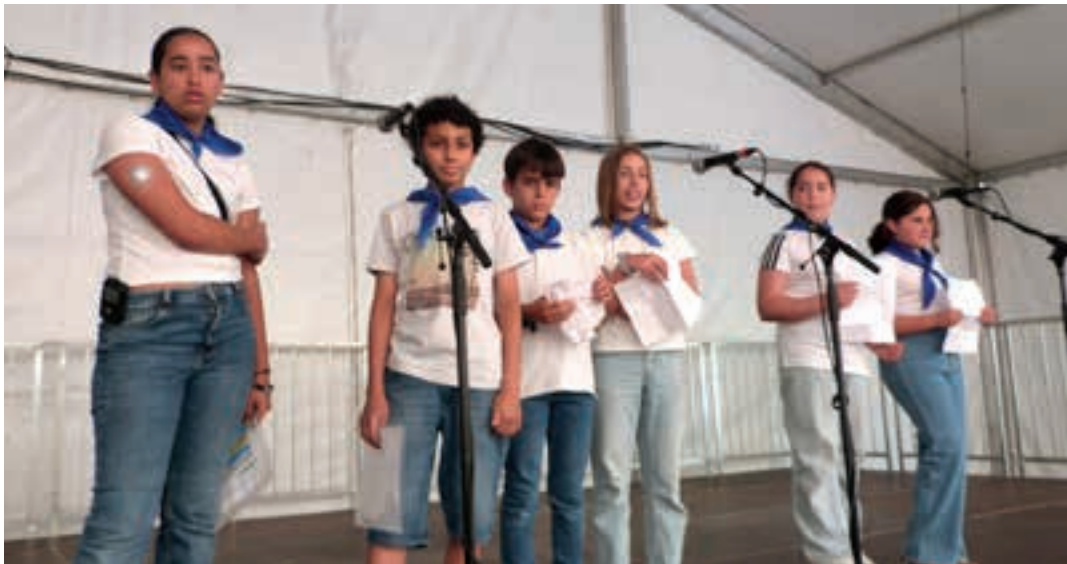
Haur pregoian hiru ikastetxeetako bina ikasle igo ziren oholtzara. AIURRI