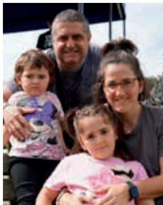
Ezusteke atsegina hartu zuten. AIURRI