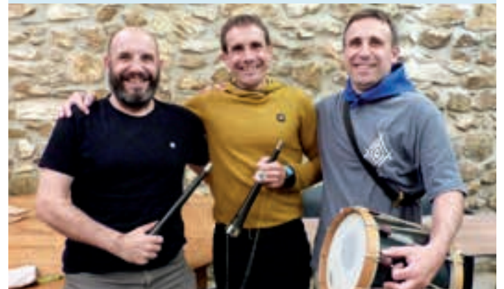
Sarasola anaiak, urte luzez, Andoaingo dultzaineroak. AIURRI

Konpartsakideak Sekulako festa egin zuten Mizpiradin, jasotako aitortza behar bezala ospatuz. Pregoia ematea ez baita ardura eskasa eta, behin mandatuarekin kunplituta, ospakizunetan murgildu ziren.