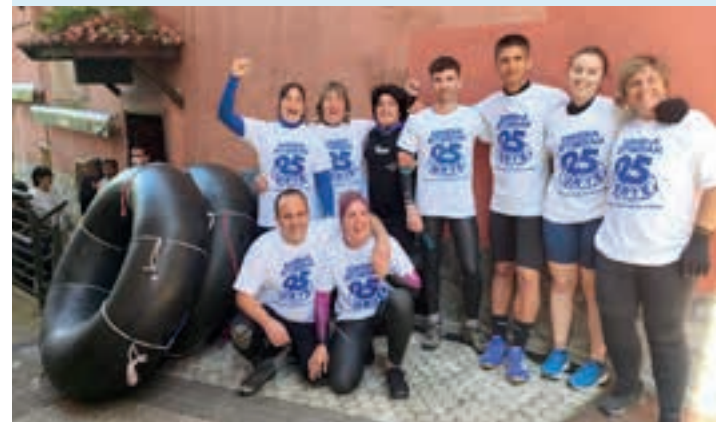
Xaxiko partaideak, taldeko argazkian. ARAKAMA