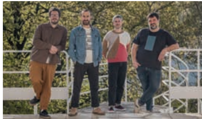
Lantaldea, Martin Ugalde Kultur Parkean. NAGORE LEGARRETA

Alde batetik, lan jardun eta antolakuntzari dagokionean, langileon bizigarritasuna, erabakietan parte-hartzea eta inplikazioan jartzen dugu fokua. Bestetik, sortzen ditugun ikus-entzunezkoak inklusiboak, berdinzaleak eta euskaltzaleak izan daitezen saiatzeko gara, gertuko komunitatean eragiteko asmoz. Azkenik, kooperatibismoaren eta Ekonomi Sozial Eraldatzaile-