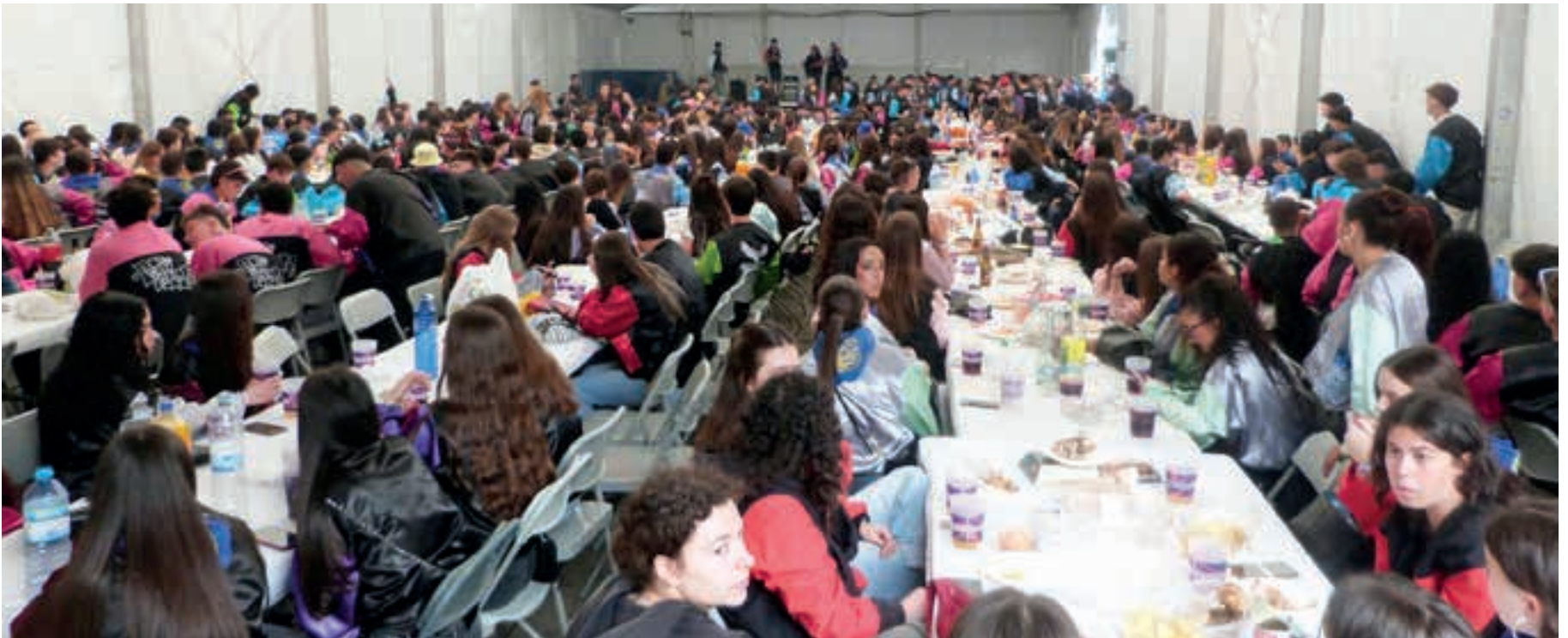
Zumea plazako karpan bazkaria egin zuten eta bertan zuten sagardoa edateko kupela. Une dibertigarri ugari izan ziren, bereziki, bazkalosteko jolas eta probatan.