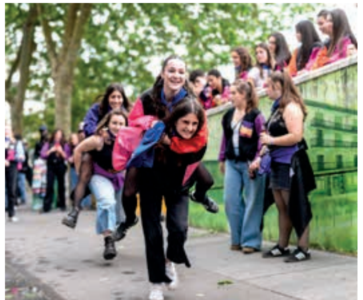
Kale Nagusian jolasak egin zituzten. AIURRI

Arratsaldean artisautzako garagardoa dastatzeko aukera izan zen. Bien bitartean, Iruzta taldeak girotu zuen Zumea plazako olanapea. Gauean, jaietako larunbatetako ohiturari eutsiz, Santa Krutz Peñaren danborrada aritu zen kalez kale. Eta, egunari amaiera emateko, Muxutruk taldeak erromeria egin zuen Txosnagunea. Hirugarren eta azken gauean, kalean egoteko giroa bikaina zen.