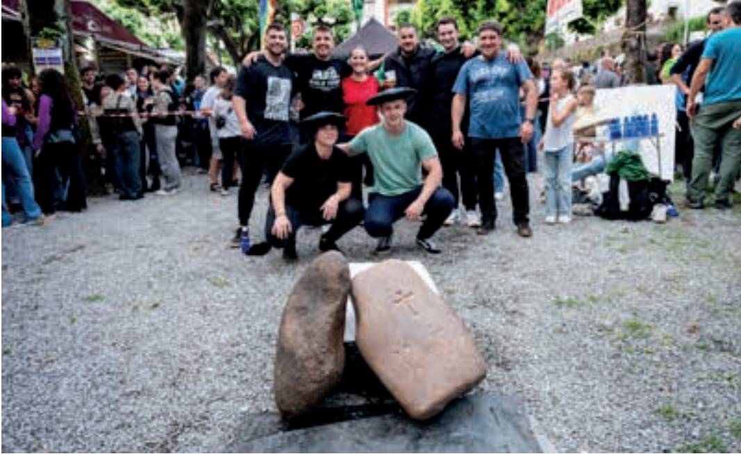
Amas eta Otamendi nagusitu ziren gizonezkoen eta emakumezkoen lehian.