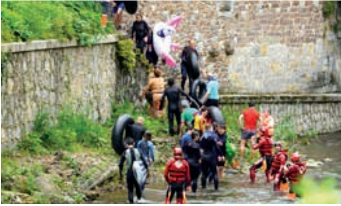
Erreka jaitsiera, aurreko Santa Krutz jaietan. AIURRI