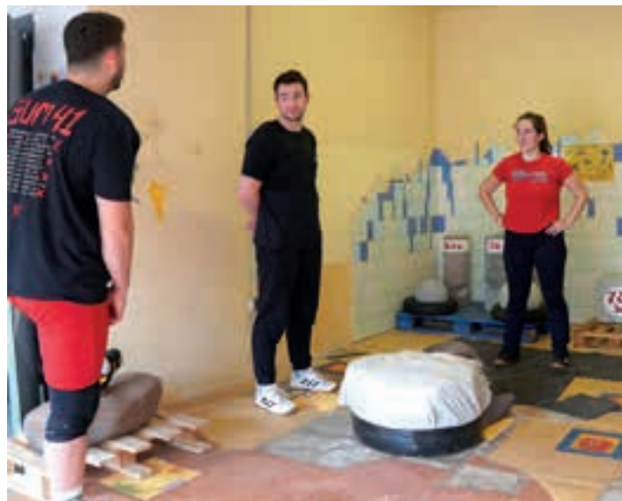
Jende ugari bertaratu da Dr. Huizi kaleko egoitzara, harriak probatzera.