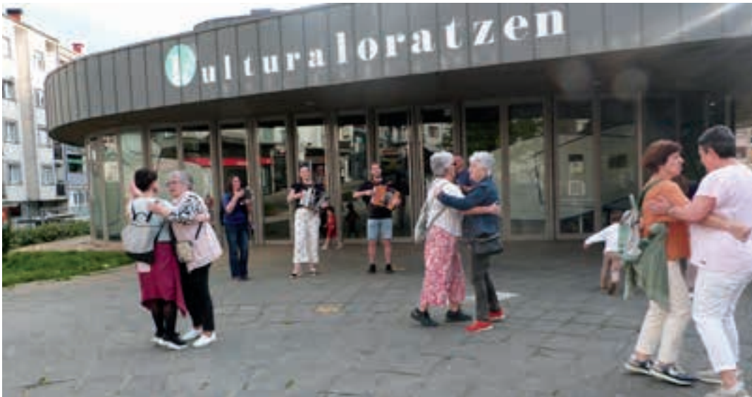
Plaza dantza, Plaza Morean, iazko jaietan. AIURRI