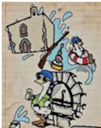
Egitarauan ageri da. AIURRI