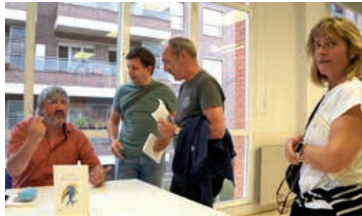
Garmendiak liburuak sinatu zituen ekitaldiaren amaieran. AIURRI