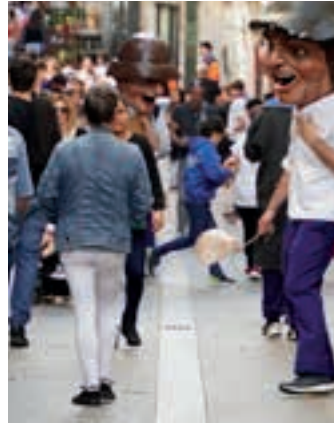
Kale Nagusia jai giroan. AIURRI