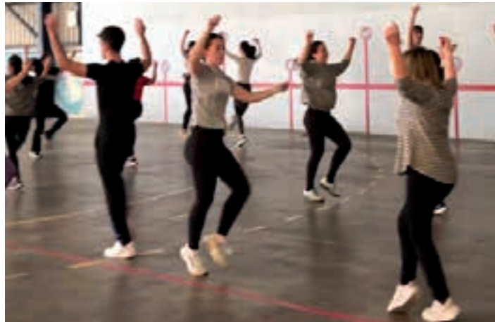
Entsegu betean daude Urnietako dantzazaleak. AIURRI