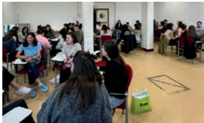
Urigainen jende asko elkartu zen aurreko larunbat goizean. MUGIMENDU FEMINISTA