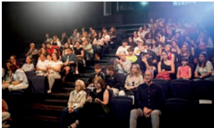
Kusle ugari bertaratu zen Sarobera. AIURRI

2020-2025 urte bitarteko idazlan sarituak, bestalde, liburu batean bildu dituzte eta Lekaion daude eskuragarri.