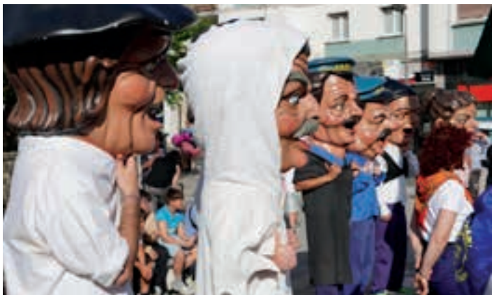
Lebi zezen-suzkoa iluntze aldera irtengo da jaietan. AIURRI