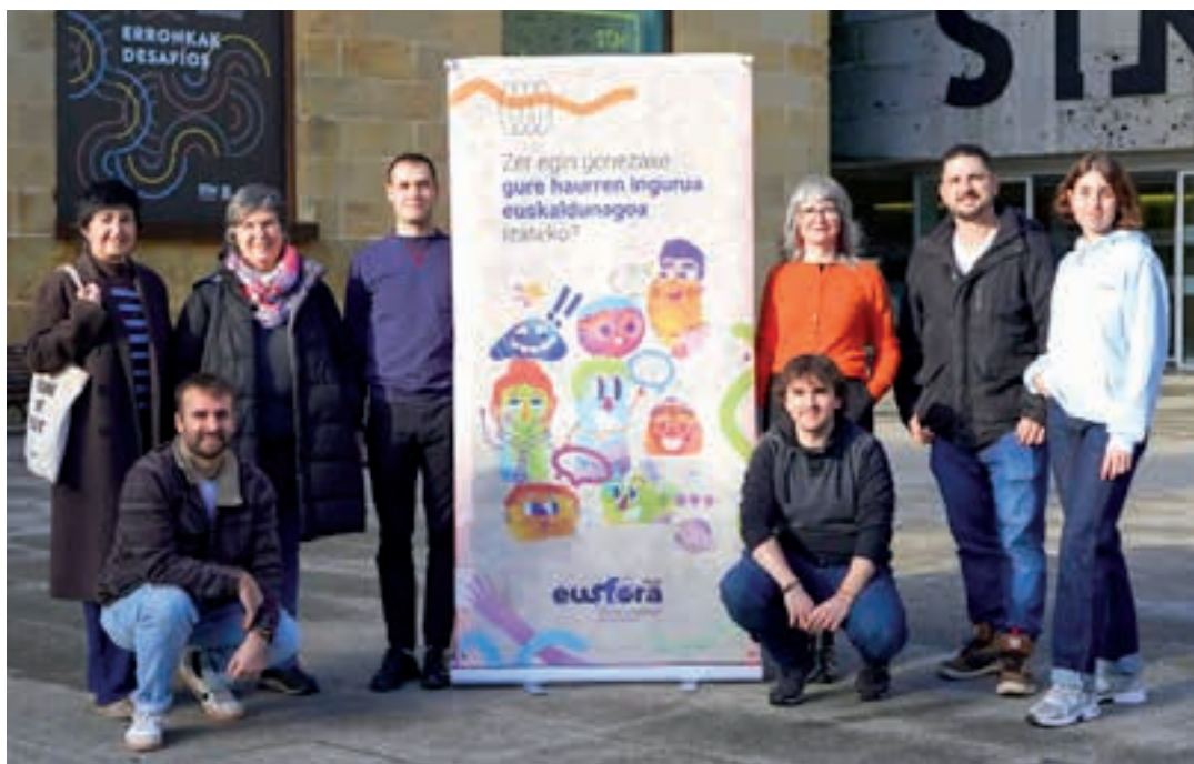
Eusfera egitasmoa aurkeztu zuen Taupa mugimenduak Donostian. EUSFERA