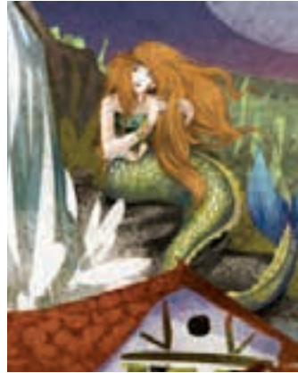
Euskal Mitologia. EUSFERA

Goizean hasita, familia giroko festa egin nahi dute Etxeberrieta plazan. Sari banaketa ekitaldia, bazkaria eta plaza-dantzak iragarri dituzte. DJ Mikeltxi bertan izango da. Abenduan egin zuen debuta herrian, eta orduko hartan haurrak eta gurasoak dantzan jarri zituen. Inauterietan izan ostean, hirugarrenez hurbilduko da Andoainera.