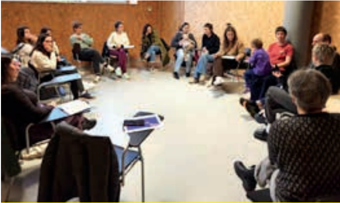
Martxoaren 11n egindako bilera, Arrate pilotalekuan. AIURRI