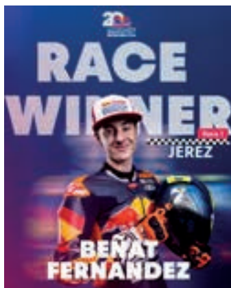
Andoaindarrak lehen lasterketan garaipena lortu du. RED BULL

Eskarmentua baliatu zuen eta pozarren zegoen aurrikusitako plana bete zelako: "Bujosari bere erritmoa egiten utzi nion. Banekien azkarragoa nintzela eta azken bihurgunean hura gainditzea nuen buruan. Plana ezin hobe atera da".