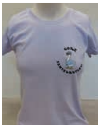
Kamisetak egin dituzte.

Kaimuturrean, Oria eta Leitza-ran elkartzen diren tokian, hegaztien komunitatea egonkortu egin da. Ahateak dira gehiengo baina bada antzarra, eta ez txikia! Jai Batzordeak auzoan bizi den antzarra maskota bilakatu du. Krutzi izenarekin bataiatu dute eta aurtengo jai egitarauan aurkeztu dute. Era berean, kamiseta berriak egin dituzte eta haietan ageri da Krutzi, nola ez, bluxa soinean.