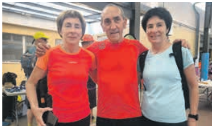
Ibiltari taldea, Ondarretako helmugan. AIURRI