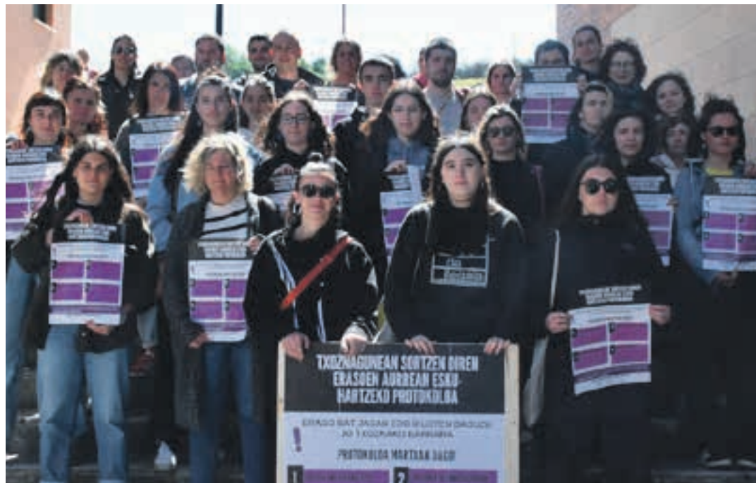
Txosnagunean sortzen diren erasoaren aurrean esku-hartzeko protokoloaren aurkezpena iaz.

Indarkeria eta eraso matxistetan jartzen da arreta handiena, baina, ahaztu gabe, "bestelako zapalkuntzak ere gauzatzen eta gorpuzten direla"