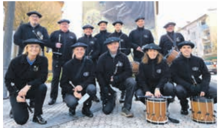
Olagain Txistulari Elkartearen kontzertua, artxiboko irudian.