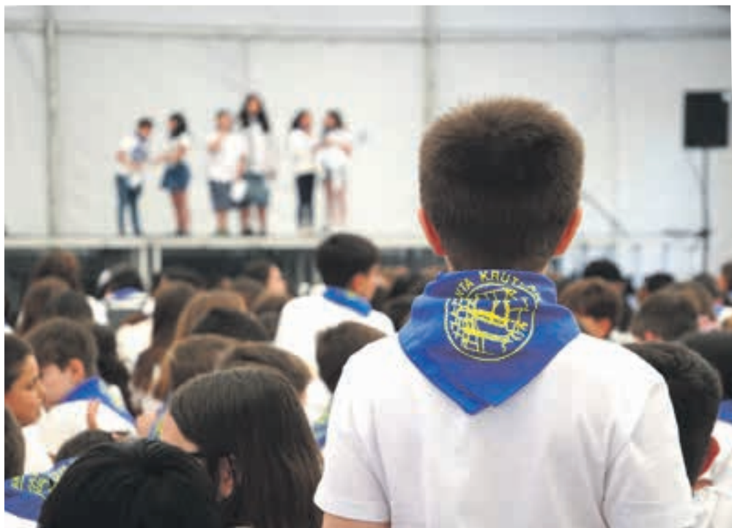
Txupinazoa Lebiton erraldoi eta buruhandien konpartsaren eskutik izango da aurten. AIURRI

Santa Krutz Jai Batzordeak egitaraua banatuko du auzoan, asteburu honetan. Honatx, aurtengo egitaraua. Aldaketarik izanez gero, datorren asteko gehigarri berezian argitara emango ditugu.