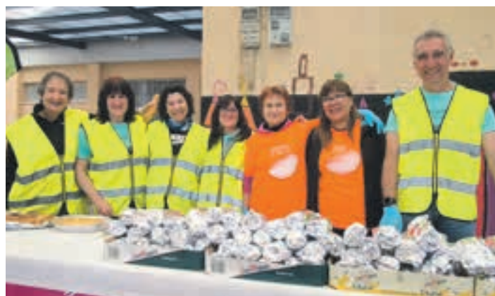
Boluntario taldeari esker aurrera atera ohi da ibilaldi neurtua. AIURRI