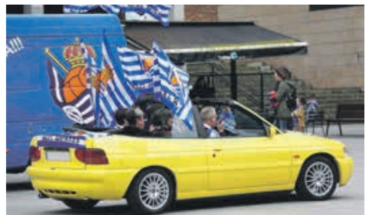
Zaletuak, Zumea plazan, larunbat arratsaldean. AIURRI

latu zituzten Gazte Lokaleko eta Ludotekako kideek. Salkinek eta Andoingo Udalak elkarrekin antolatutako ekitaldi-sortako lehena izan zen. Arratsaldean hasita, antzematen zen jendetza zebilela kalean. Gauean, partida hasita, hainbat tokitan baina, bereziki, Goikoplazan elkartu ziren zaletu gehienak.