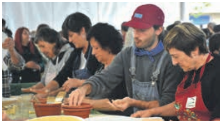
Sagardo dastaketa eta talo-jatea igande arratsaldean izango da. AIURRI

Festazaleen urteko hitzordu gorenetakoa iristear da. Lebiton konpartsak hartuko du protagonismoa, eurak baitira jaiari hasiera emango diotenak. Hoieitamargarren urteurrenean murgildu dira eta ondo merezita dute Jai Batzordeak egin dien aitorza.