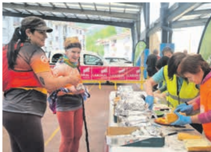
Edaria eta janaria parte-hartzaileentzat, iritsieran. AIURRI