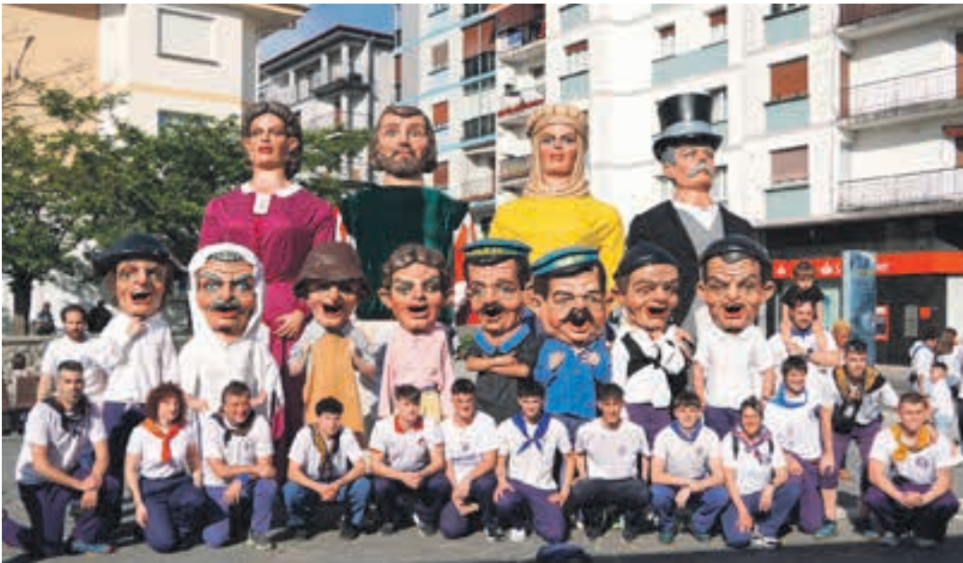
Lebiton konpartsa, 2025eko Santa Krutz jaietan. Aurten pregoia euren ardurapekoa izango da. AIURRI