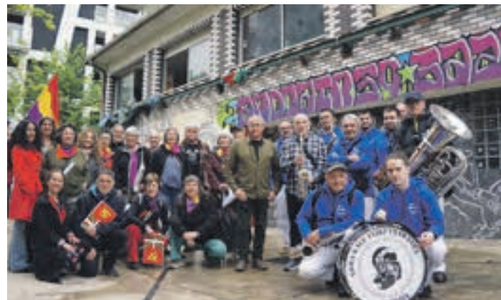
Banda Errepublikanoa Sebastopoleko dantzariekin, emanaldiaren aurretik.