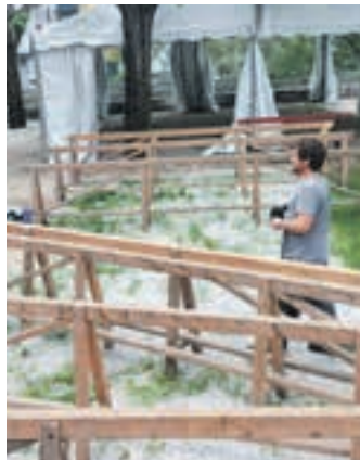
Txosna eremua. AIURRI

Azken bi urteetan bitan aktibatu da protokoloa jaietako dagokionez. Bata, eraso homofobo eta matxista batengatik, eta bestea, eraso arrazista gauzatu zelako. Ez dugu galdera hau morbotik irakurtzea nahi baina bai hausnarketa pare bat egin nahiko genituzkeela protokoloa aktibatzeak sortzen dituzten jarreraren inguruan. Lehenengo egoeran, txosnagunetik bi gizon kanporatu ziren, esanguratsua da nola une hauetan zenbait gizonen duten salbatzeko beharra, zenbat gizonen norbait jotzeko irrikaz eta desiraz baliatzen duten edozein “mobida”. Ze nekagarria protokolo arduradun ginenok bi gizon kudeatzetik lau kudeatzera pasatzea. Dena ez da jipoia eta hala izango balitz ere, agian hausnartu dezakezue guk ere baditugula ukabilak.