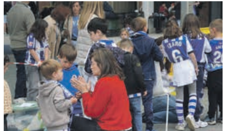
Aurpegi-margoketa eta txapa tailerra, Zumea plazan.