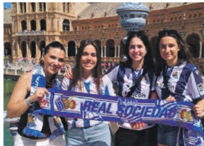
Euskaldunako jokalaria eta lagunak, Sevilla hirian.

Emozioz bizi izan zen finala Sevillan eta inguruotan. Bertatik bertara ikusteko aukera izan zuten hainbat zaletuk baina bertan geratu zirenek ere gogotik ospatu zuten garaipena. Egun gogoangarria izan zen larunbatekoa, Errealzaleentzat