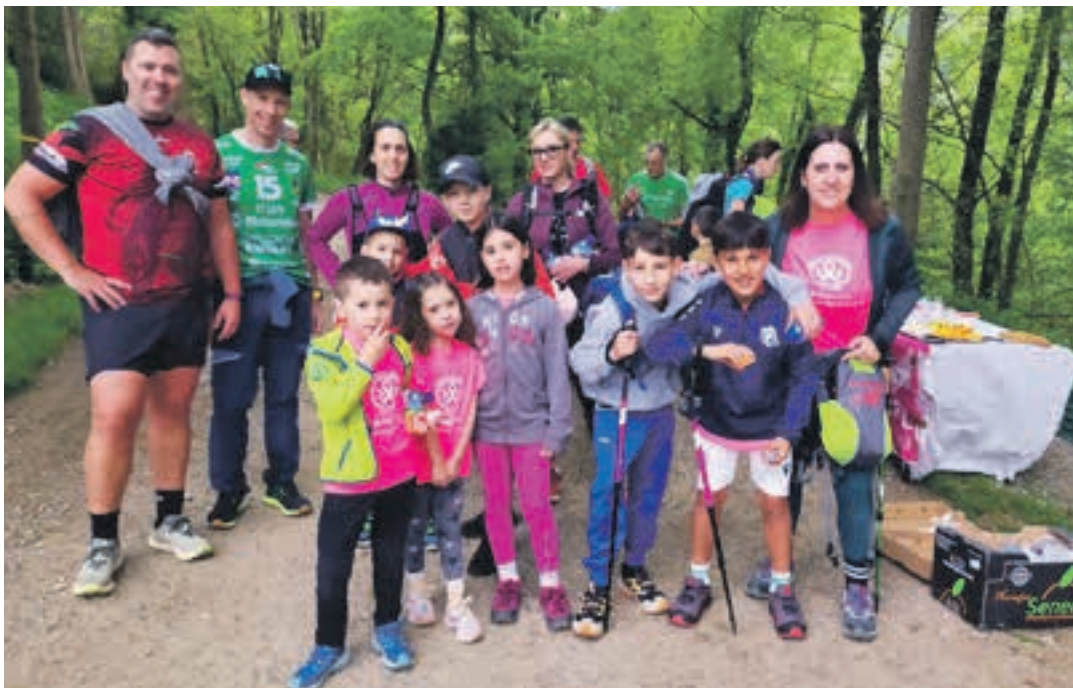
Ibilbidea osatu zuen helduen eta haurren taldea, Belkoain aldean. EUSKALDUNA MT