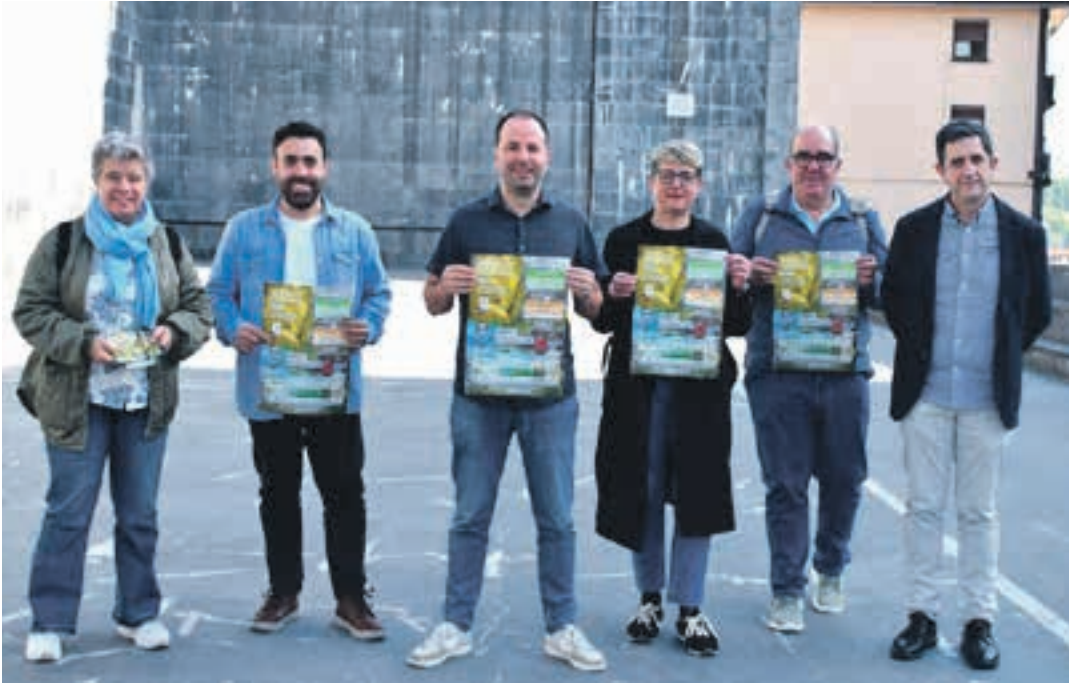
Udal ordezkariak eta teknikariak uda honetako eskaintzaren aurkezpen-ekitaldian. AIURRI