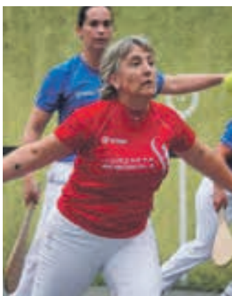
Iturzaeta memoriala. AIURRI