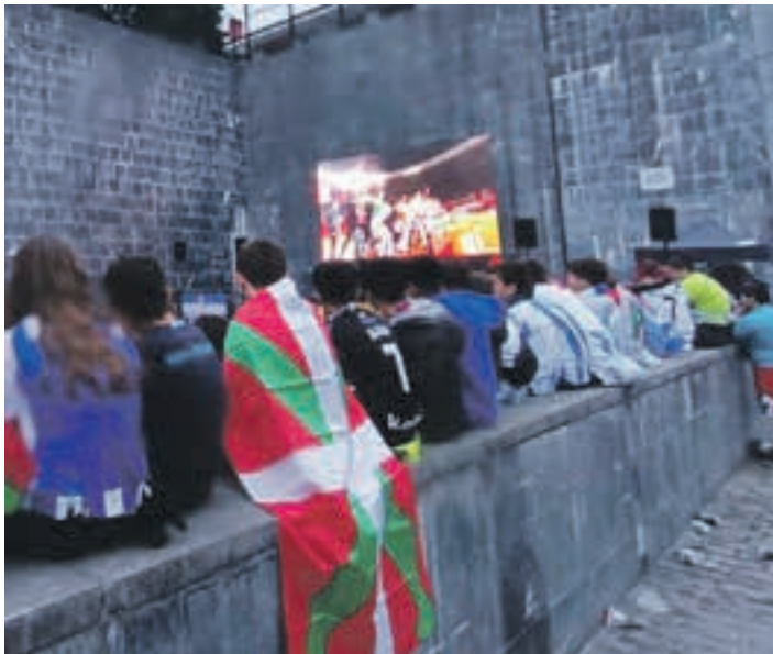
Zaletu taldea Goikoplazan, partidari hasiera eman aurretik.

Aritu nintzen, Goikoplazan, batera eta bestera begira: askotariko jatorria zuten herrikideak ikusi nituen plazaren erdian, elizarantz doazen eskilaratan eta inguruko beste eremuetan. Ez zait burura etortzen hain bizimodu ezberdinak daramaten herrikideak batu ditzakeen beste hitzordurik. Eta han ziren guztiak sufritzen, urduritzen eta, azkenik, gozaten eta pozez zorutzen. Ikuspegi sozialetik, komunitatea egiteko mugarria izan zen larunbatekoa. "GUazen Errealak!" izan da klubaren lelo nagusia, gu horren baitan norbanako asko eta ezberdinak batu daitezkeela aintzat hartuta. Beste gu horiek ere bertan direla, alegia. Inklusioaren eta aniztasunaren ikuspegitik, ez bairik gabe, erabaki ona izan zen pantaila jartzea. Errealak Kopa irabazi zuen eta, Goikoplazan ginonok, hein handi batean, komunitatea egin genuen.