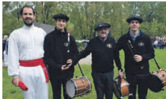
Dantzarria eta txistulariak, Miranda pasealekuan.