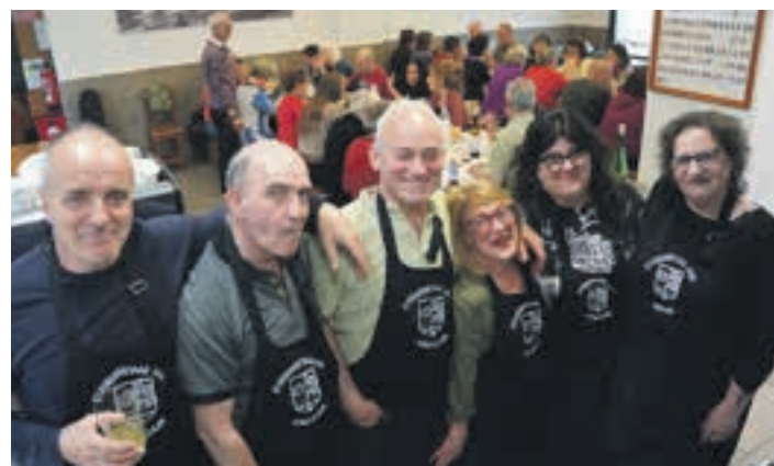
Bazkaria prestatu zuen Etxeberrietako lagun taldea, Kotoin.