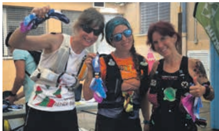
Ondarretara iritsitakoek pozarren ospatu zuten ibilaldia amaitu izana. AIURRI