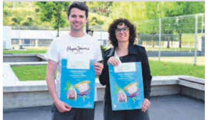
Artola eta Pozas zinegotziak. UDALA

TENISEAN TREBATZEKO TXANDA BAKARRA IZANGO DA, UZTARILAREN 13TIK 24RA