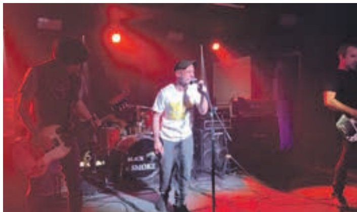
Hainbat musika talde igo ziren Andoaingo Gaztetxeko oholtzara. MUSIKAZUZENEAN