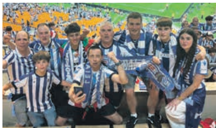
Andoaindar taldea La Cartuja futbol zelaian.

Asteburuan Sevillako irudiak eta bideoak eskegi ziren Aiurri.eus gunean eta sare sozialetan. Esan gabe doa haien guztien zabalkundea handia izan zela. Errealarekiko atxikimendua oso handia da eta, ondorioz, partidaren aurreko orduak ilusioz igaro ziren. Sevillan zirenek ez dute bizitakoa berehalakoan ahaztuko. Baina bertan geratu zirenek ere, aldi berean, gozatu, sufritu eta garaipenarekin ospatu zuten.