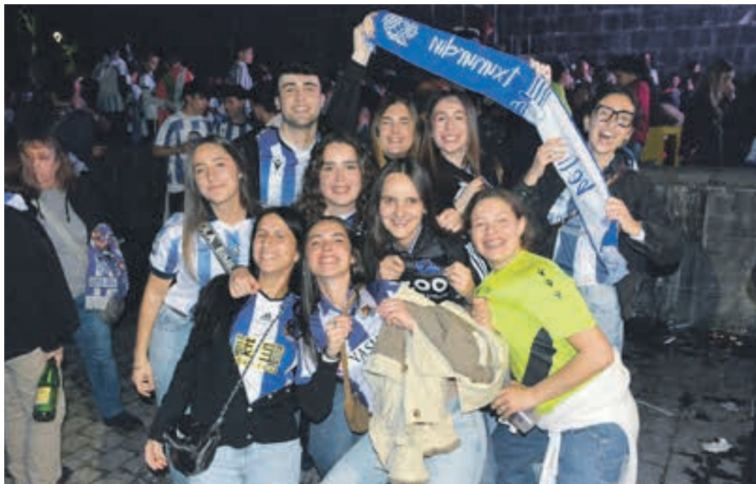
Lagun kuadrilla ugari elkartu zen Goikoplazan, larunbatean. AIURRI