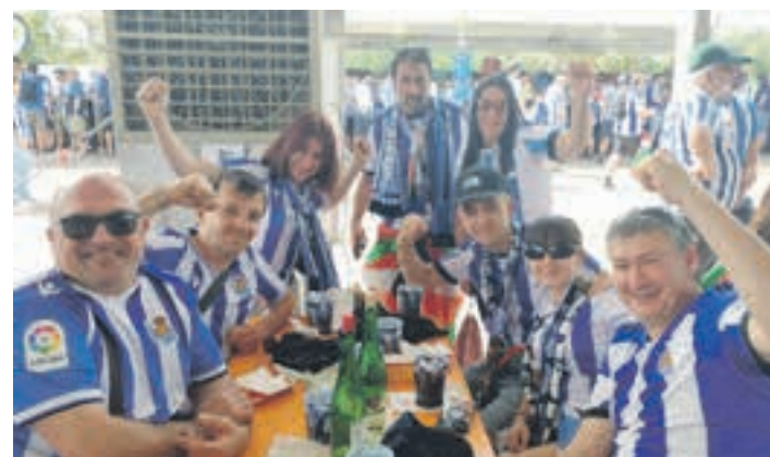
Argazki gehiago ikusgai daude Aiurri.eus webgunean. AIURRI