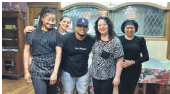
Pintxo lehiaketa igandean izango da, 19:00tan hasita. Argazkia 2024koa da, Hiru jaietxeak lehiaketa irabazi zueneko.