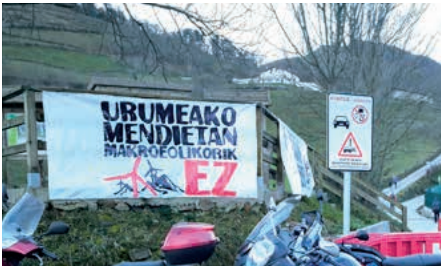
Egitasmoaren aurkako pankarta ikusgai zegoen urtarrilaren 1ean, Besabin. Atzean, Adarramendi. AIURRI