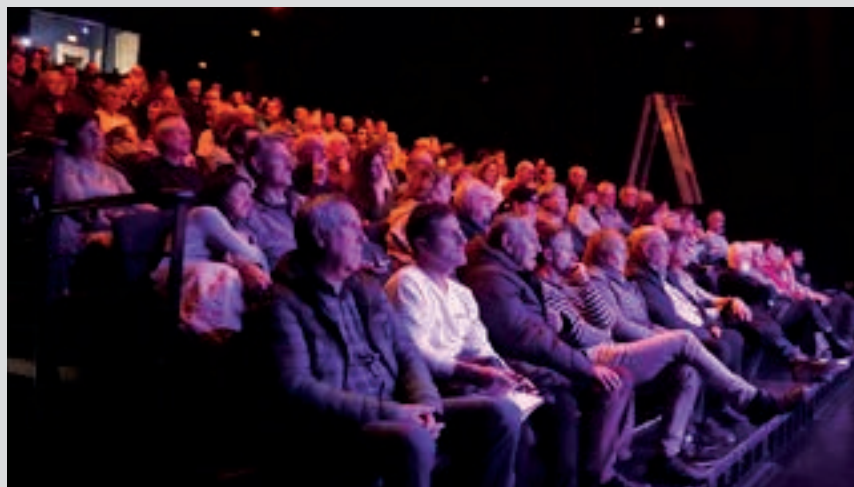
Hamaika galdera egiteko aukera eduki zuten urnietarrek. AIURRI