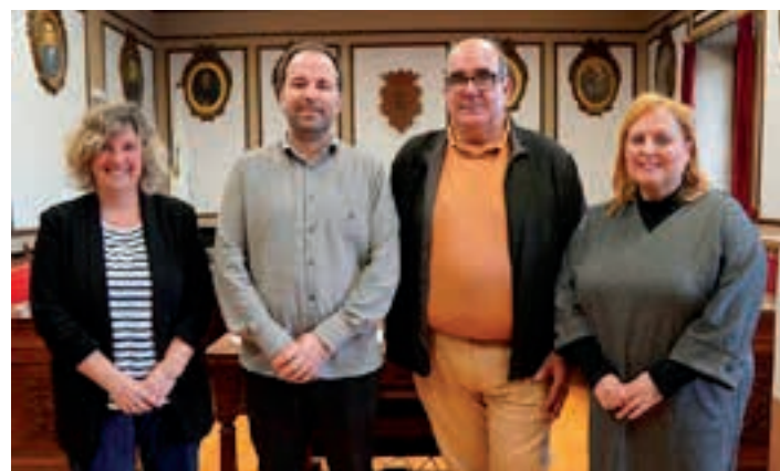
Alkatea eta ordezkari politikoak, udal pleno aretoan. AIURRI

Xehetasun gehiago Andoain.eus webgunean aurki daitezke.