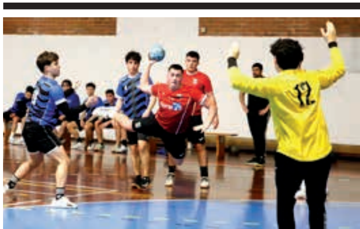
Urnietarren jaurtiketa ikusgarria, aurreko asteburuan. UKE