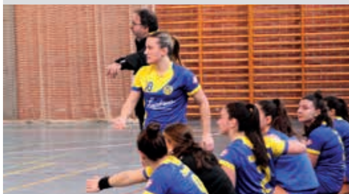
Erronka ez da txikia: datozen hamar partidatan aurrealdean irautea.

Joera ona Urtea amaitu aurretik sailkapenean atzetik datozen Irauli eta Malaperen aurka galdu zuten. 2025ari, ordea, garaipenaren bidetik ekin diote. Bitik bi lortu dituzte.