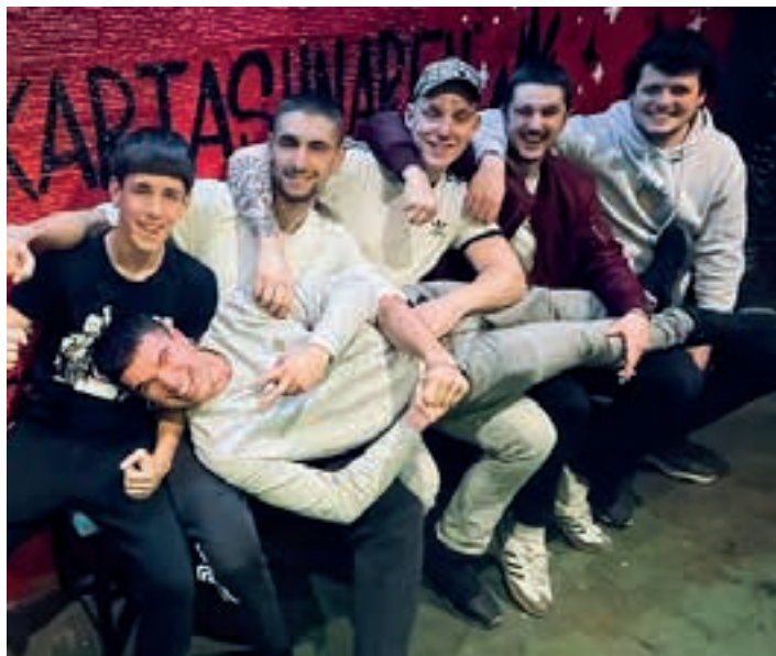
Aiztondoko eta Oiartzungo gazteek osatzen dute Gorroto Bala. GORROTO BALA

Isuna jaso berri du Aske antolakundeak, joan zen abenduaren 30ean Arabako Zaballako preso-ondorioz egindako martxaren ondorioz. Izan ere, Eusko Jaur-laritzako Barne Sailak, Ertzaintzaren txostena baliatuta, martxan parte hartu zuten 128 pertsoneri 1.200 euroko isuna ezarri zien. 153.600 eurokoa da, guztira. Jaialdi solidarioaren antolatzaileek egoera salatu dute: "Euskal preso politikoko elkartasuna kriminalizatzen dute, eta bide batez, antolakundearen zein Jardun Koordinadorearen ekimena mehatxatu eta oztopatzen dute. Euskal Herri langilea, ordea, ez dute hain erraz kikilduko".