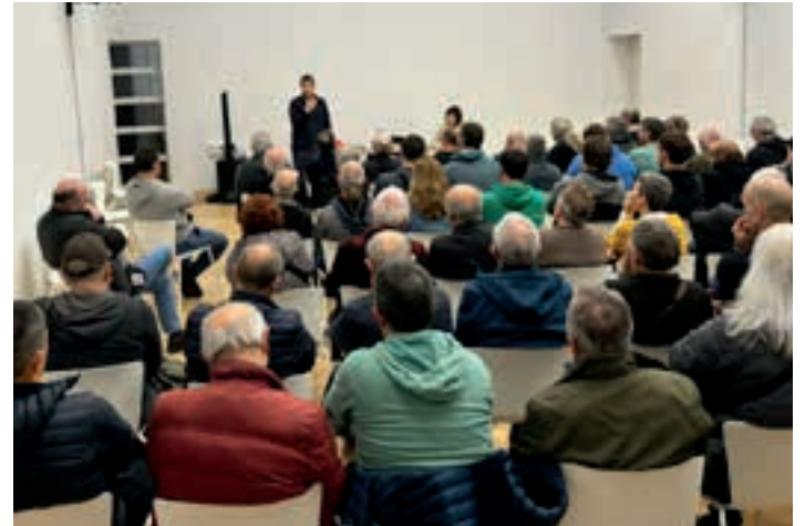
Beterrri-Buruntzako herritarrek Hernanin elkartu ziren, aurreko batean. AIURRI

Orain dela urtebete, otsailaren 13aren testuinguruan, Euskal Herriko torturatuak saretzeko asmoz martxan jarri genuen talde-sustatzailea aurkeztu genuen publikoki. Azken hilabeteetan Euskal Herriko Torturatuen Sarearen sortze-prozesuaren barnean, aurkezpen-batzarrak egin ditugu hainbat eskualdetan. Bertan, Nafarroako Torturatuen Sareko esperientzia oinarri, talde-sustatzaileko lagunek esku artean dugun erronka aurkeztu, eta berari eusteko deia egin diegu bertaraturiko pertsona torturatu guztiei.