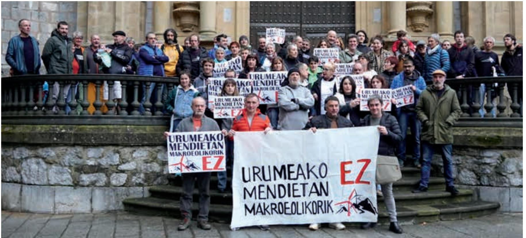
Astelehen arratsaldean egin zuten egitasmoaren aurkezpen ekitaldia Hernaniko plazan. Urumea bailarako hainbat herrikide hurbildu zen hitzordura.