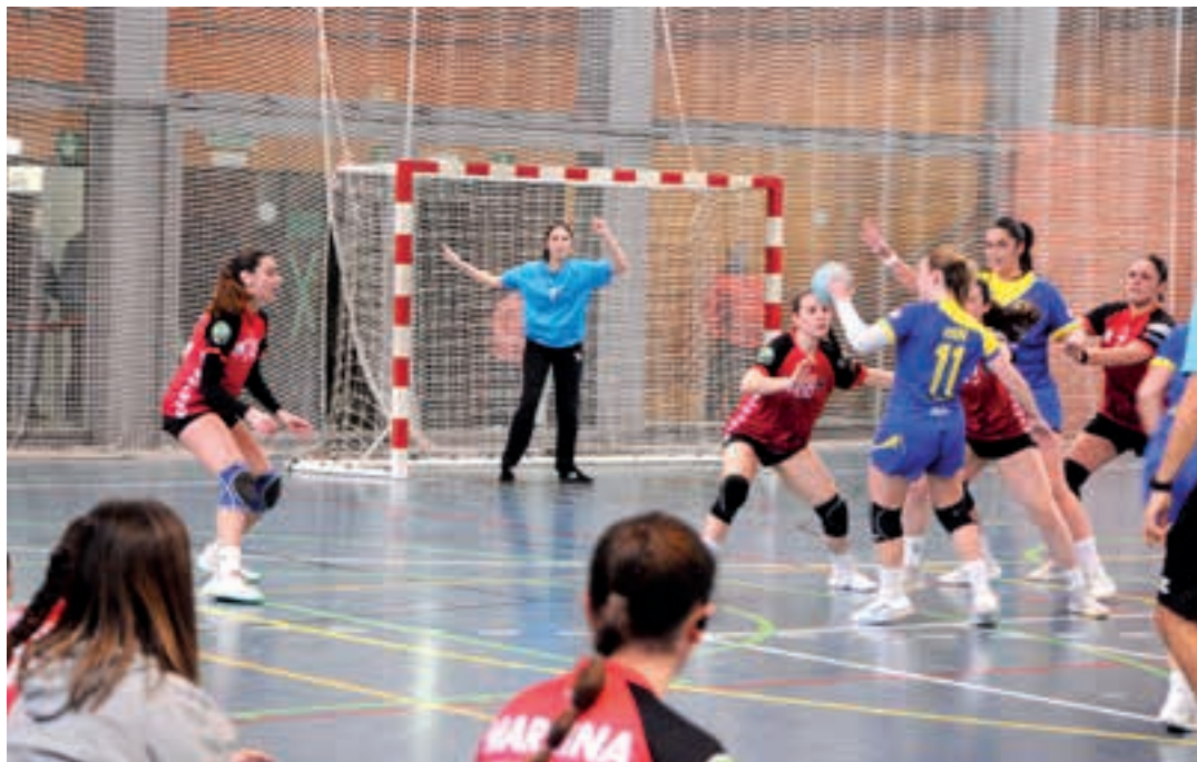
Aurreko asteburuko partida, Allurralde kiroldegian. AIURRI