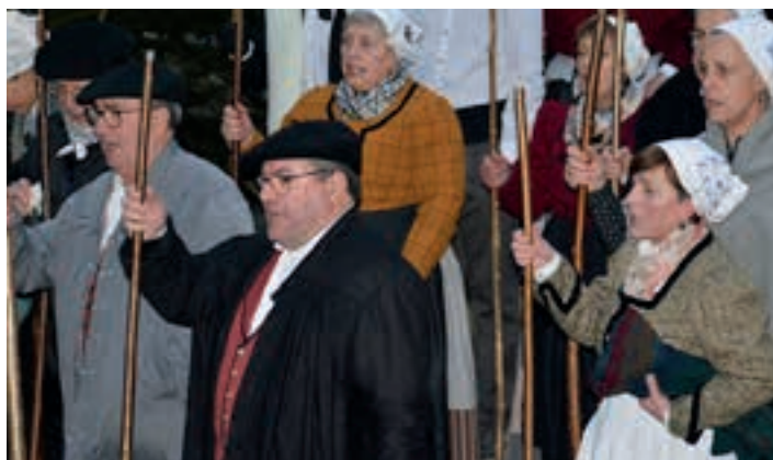
Santa Ageda bezperako kantu-erronda, iaz. AIURRI

Hitzik gabeko ikuskizuna, La Baldufa konpainiaren eskutik. Hauxe da antzezlanaz aurreratu daitekeena: Triku handia lasai bizi da haritz handi baten itzalean eta ingurukoak zaintzen ditu, munduaren zatitxo batez gozatzen duen bitartean. Egun batean, urtxintxa atsegin, bihurri eta jostalaria agertuko da. Elkarbizitza ez da erraza izango. Triku zaputza zein babeslea eta jakiteko gogoz dagoen urtxintxa ezagutuko ditu ikus-entzuleak. Otsailak 2, igandea. 17:30, Sarobe. 3 euro.