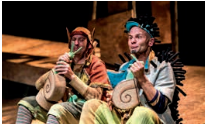
Hiru urtetik gorako familia ikuskizuna da. LA BALDUFA