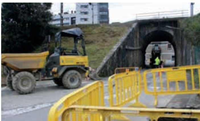
Astearte arratsaldetik itxita dago Kaletxikiko tunela, autoentzat. AIURRI