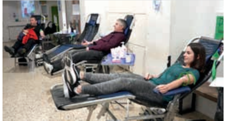
Hiru herrikide odola ematen, urteko lehen saioan. AIURRI