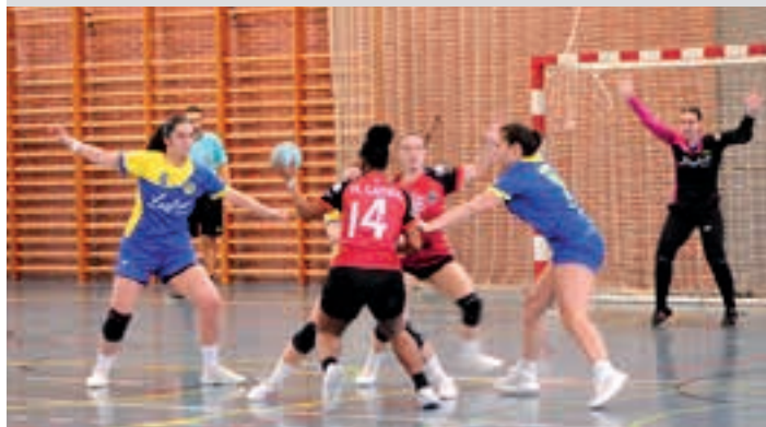
Une honetan taldea hirugarren postuan da sailkapenean. AIURRI

Joera ona Urtea amaitu aurretik sailkapenean atzetik datozen Irauli eta Malaperen aurka galdu zuten. 2025ari, ordea, garaipenaren bidetik ekin diote. Bitik bi lortu dituzte.