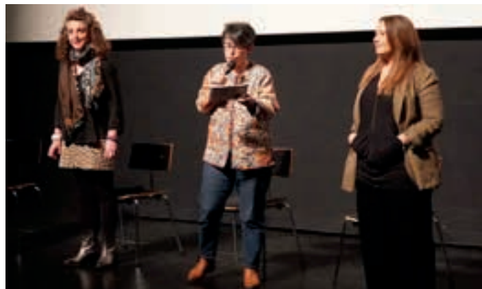
Zinema emankizuneko protagonistak, Bastero Kulturunean.

eta Oiartzungo gazteek osatzen dute eta abenduan kantu berriak grabatzen aritu dira Tolosako Bonberenean, Eguzki Azkarate-ren gidaritzapean.