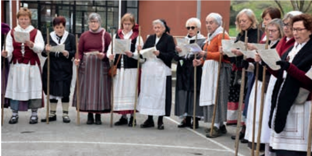
Santa Ageda bezperako kantu-erronda, iaz ateratako argazkian.

Agenda estua dute Urnietako kantariak: urtarrilaren 30ean, AEKren Zilegi Eskolan, Lurdes Iriondo eta Xabier Lete gogoan hartuko dituzte; urtarrilaren 31n kalez kale ibiliko dira, kalejiran; eta, otsailaren 4an, Santa Ageda bezperako kantu-erronda antolatu dute