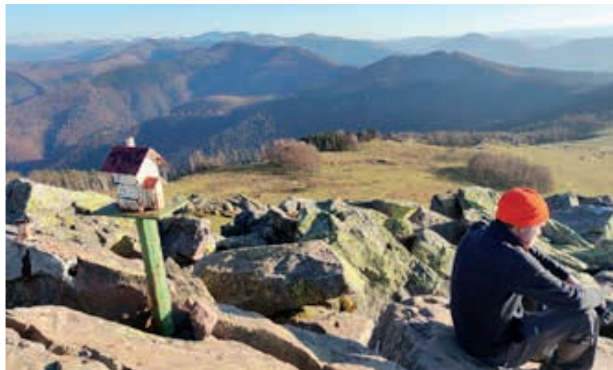
Adarra-Mandoegi mendilerroa hartuko lukete aurrikusitako bi egitasmoek. Irudian, Adarrako gaina.

Iritzi irmo hori babesteko, honako gogoeta hauek zerrendatu zituzten: