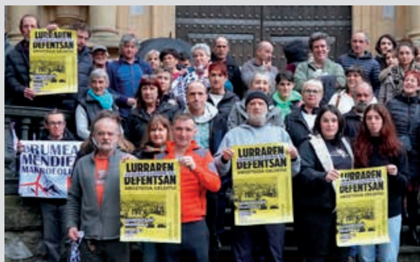
Larunbat honetan manifestazioa deitu dute Iruñean.

"Lurraren defentsan, kriminalizaziorik ez! Aroztegia gelditu!" lelopean, otsailaren 1ean Iruñean manifestazioa egingo dute. Deialdiarekin bat egin dute Euskal Herri osoko eragileek. Tartean dira, Euskal Herriko Bilgune Feminista, Gipuzkoako Mendizale Federazioa, EHNE Gipuzkoa eta Urumeako Mendiak Bizirik ekimena. Azken horiek elkartasuna adierazteko argazkia ateratu zuten.