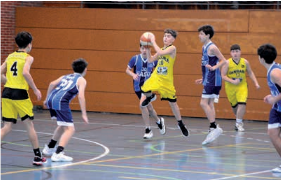
Ligaxkan nagusitasun handia erakutsi du Easo Basket Ernio taldeak. Haien atzetik sailkatu dira andoaindarrak. AIURRI