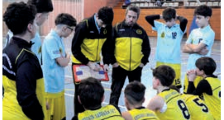
Akerbeltz Haundi taldea, atsedernaldi batean. AIURRI