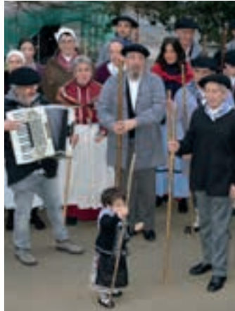
Santa Eskea

Ateri egon edo kazkabarra egin, Agate deunaren erronda kalean izango da berriro aurten, hutsik egin gabe. Errondaren ibilbidea ohikoa izango den arren, aurrerago horri buruzko xehetasunak emango ditu Manuel Larramendi Kultur Bazkunak.