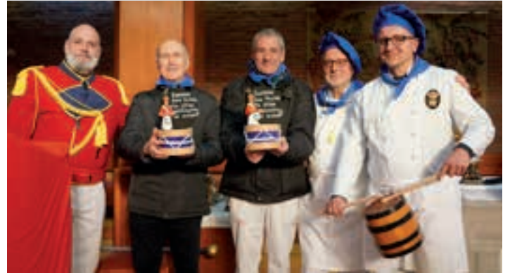
Egiako Maria Reina Parrokia-Egiako Tolosarrak taldeko buruzagiekin.