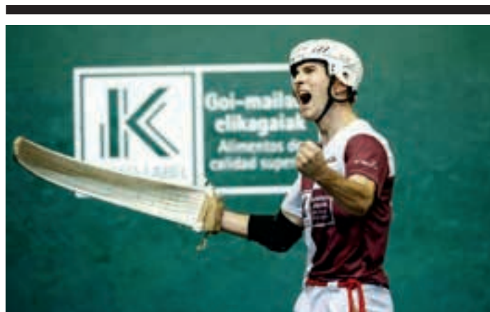
Ansak indartsu ekin dio txapelketari. ORIAMENDI