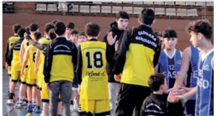
Galdu arren, andoaindarrak igoerako ligaxkan ariko dira. AIURRI