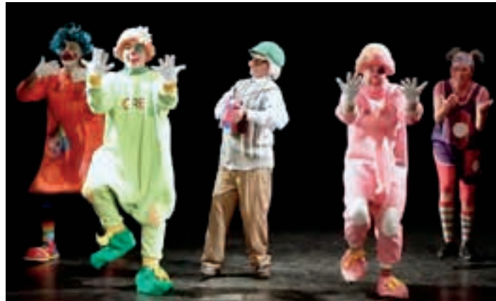
Porrotx, Marimotots, Pupu eta Lore eta Txapas. KATXIPORRETA

URNIETA Katagorriaren fabula Hitzik gabeko ikuskizuna, La Baldufa konpainiaren eskutik. Otsailak 2, igandea. 17:30, Sarobe. 3 euro.