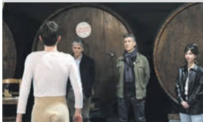
Aukeran Dantza Konpainiako kidea protagonistari Agurra dantzatzen.

Eskaintza Hilaren 6an denboraldiari hasiera eman zioten Oianumen. Asteazken honetan atea zabandu zituen Altuna sagardotegiak eta ostiral honetan iritsiko da Eularen txanda. Urnietako hiru sagardotegiak, beraz, martxan direla esan daiteke.