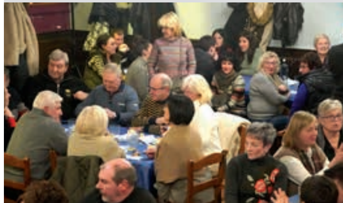
Jendetza elkartu zen Gaztañagan. AIURRI

Jendetza Gaztañagan Andoaingo txotx-irekiera festa Gaztañagan egin zen eta, datorrenean, Mizpiradin izango da. Aurtengoa ikusmin handia zegoela bistakoa da, 130 lagun elkartu baitzen.