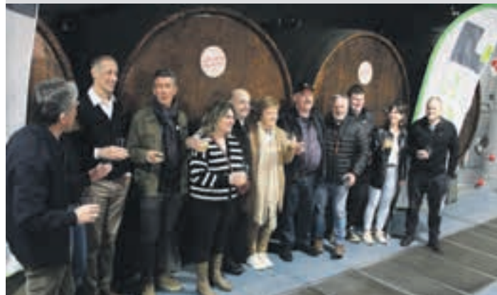
Herriko ekoizleak, ordezkari politikoeekin batera.

Ekoizleak Sagardogileak, urte luzez, bost izan dira Urnietan. Bada, orain hiru dira: Altuna, Eula eta Oianume. Hirurak irekiera-ekitaldian izan ziren. Gainerako biei dagokionez, Setien itxi zuten eta Elutxetan dagoeneko ez dute sagardoa ekoizten.