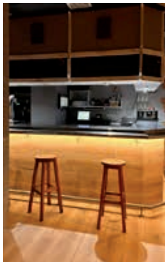
Irunberri eraberritu dute. IRUNBERRI

Kulturaz gain, politikoki aktiboa den gunea izan da beti Irunberri, noski. Nazioarteko Borroka desberdinekin solidarioak izan gara euskal herritarrek beti eta horrek ere lekua izan du gurean. Gatazka sozial zein nazionalak ere hausnarketarako tartea izan dute hasieratik Irunberrin eta horren adierazle argiena herriko kolore eta mota guztietako eragile desberdinek elkartean izandako bilera