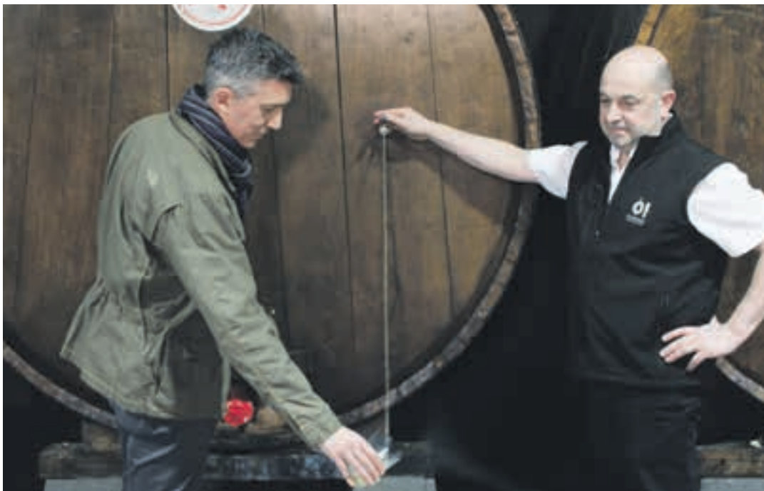
Asteazken goizean Tanco egin zuen txotx denboraldiaren irekiera. Arratsalde, hitzaldia eman zuen Urnietan. AIURRI