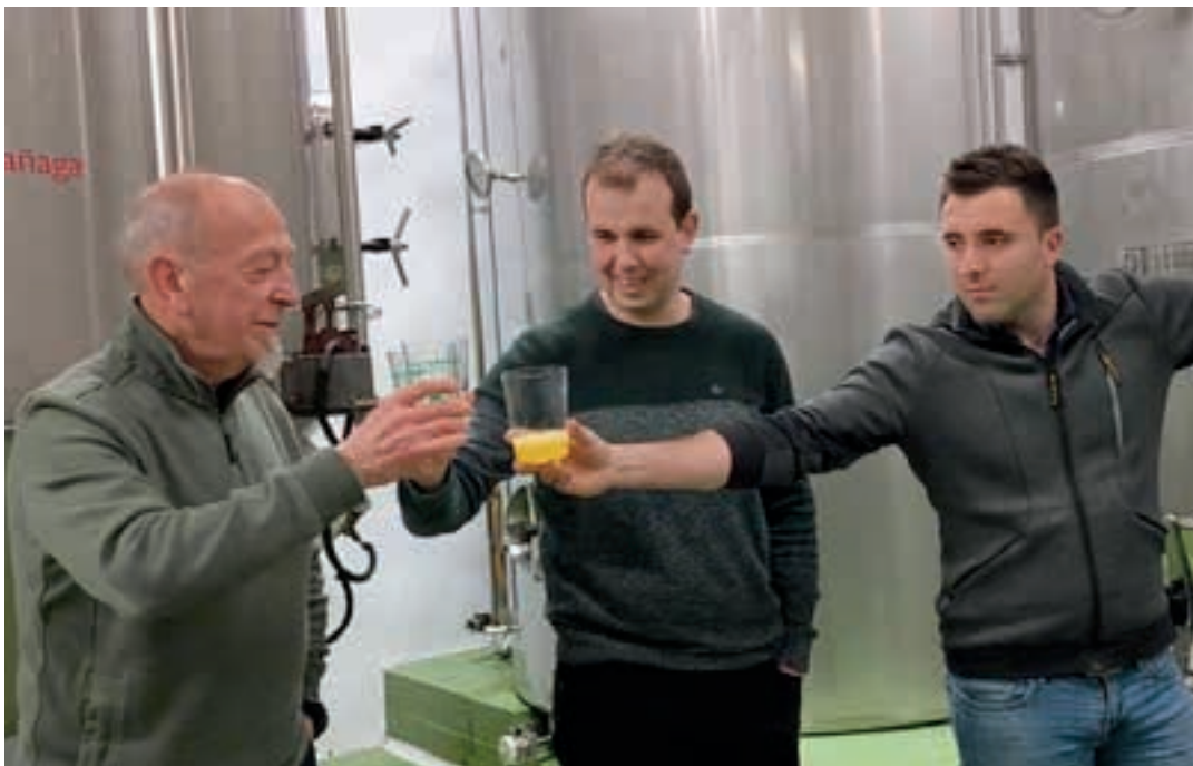
Lizaso eta Gaztañaga, Belokiren albo banatan. Azken hura izan zen irekiera ofiziala egin zuen andoaindarra.