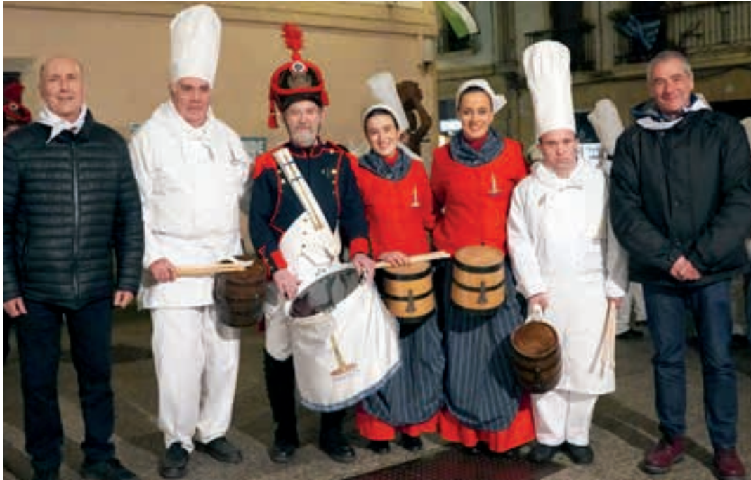
Alde Zaharreko Kañoyetan elkarteak gauerdian egin zuen ereserkiaren estreinaldia. AIURRI