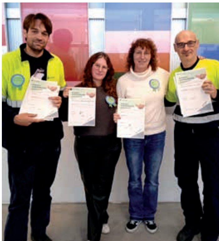
Euskara Planaren bidez, euskara normalizatzeko aurrerapausoak eman nahi dituzte.

Zer da, baina, Berbasarea? Langileen arteko euskararen erabilera handitzeko ariketa