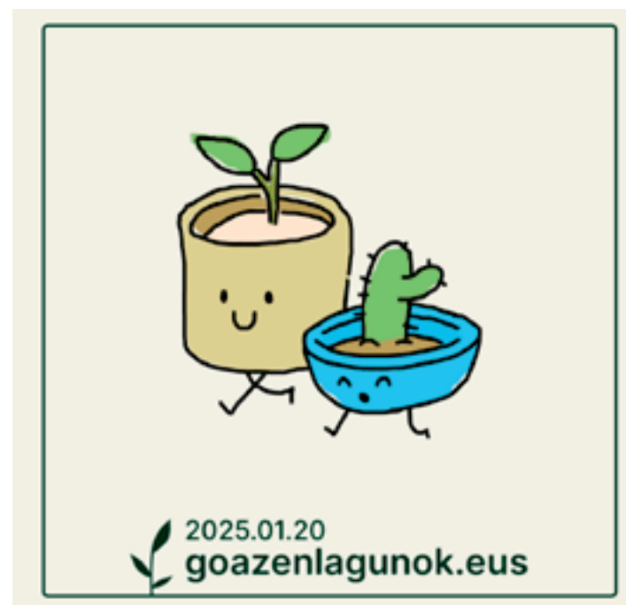
Mundu mailako ekimenarekin bat egin du TOKIKOMek. AIURRI

Sare sozial komertzialak, jendearentzako komunikazio tresna gisa sortu zirenak, gero eta putzu toxikoagoak bilakatzen ari dira. Atzetik dauden multinazionalen diru-gosearen ondorioz, desinformazioa hedatzeko, giza-talde ahulenei eraso egiteko eta eskuin muturreko mezuak haizatzeko makina erraldoiak bilakatu dira. Sare horiei eman diegun eragin ahalmena izugarriak ondorio zuzenak eragiten ditu jadanik mundu osoko giro sozial eta politikoan. TOKIKOMen uste dugu sare horietan jarraitzeak albo-kalte horien konplize izatea dakarrela, eta ez dugu gorpil hori elikatzen jarraitu nahi. Horregatik, hiru erabaki hartu ditugu: