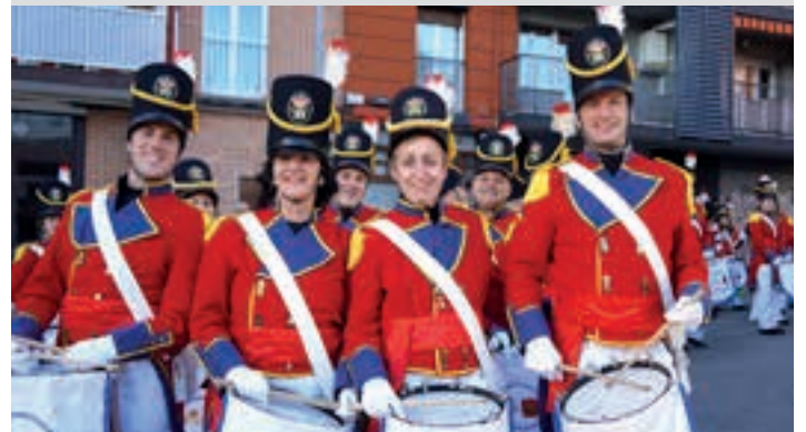
Hogeita bost urtez antolatu dute danborrada, Egia auzoan.