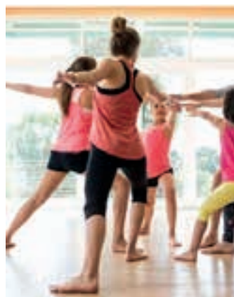
Urtarrilean izango dira saioak. YOGAKIDS

Iazko ospakizunean agerian geratu zen Olagainetik atxikimendua. Izan ere, 2024ko ekainean ehun lagun elkartu ziren ospakizunaz gozatzera. Aburuzan bazkaldu ostean, auzoan bertan segida eman zioten ospakizunari. Olagain auzoak batu zituen guztiak, orduko hartan. Oraingoan ere ez da ezberdina izango.