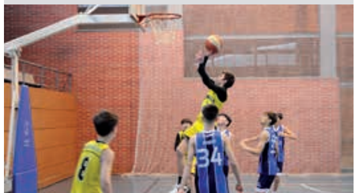
Ligaxkan saskiratzen gehien egin duen bigarren taldea da. AIURRI