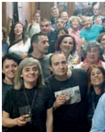
Iazko ospakizuneko argazkia. AIURRI

Bukatzeko, horra asteburuko hitzordua: ostiral honetan, Euskal Herriko mus-txapelketa Irunberrin.