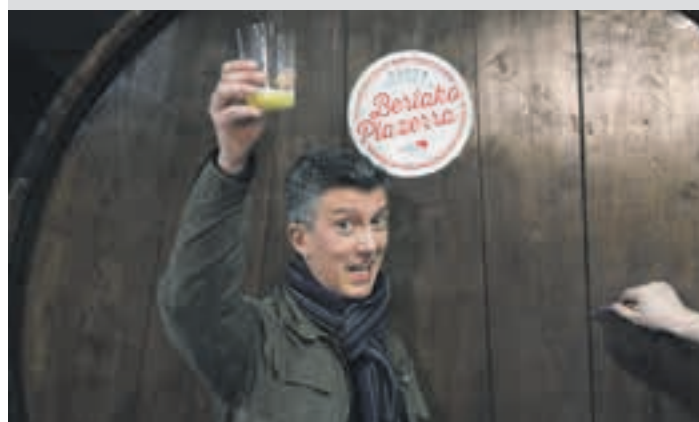
Sagardoa kupeletik edateko prest dago.

Ekoizleak Sagardogileak, urte luzez, bost izan dira Urnietan. Bada, orain hiru dira: Altuna, Eula eta Oianume. Hirurak irekiera-ekitaldian izan ziren. Gainerako biei dagokionez, Setien itxi zuten eta Elutxetan dagoeneko ez dute sagardoa ekoizten.