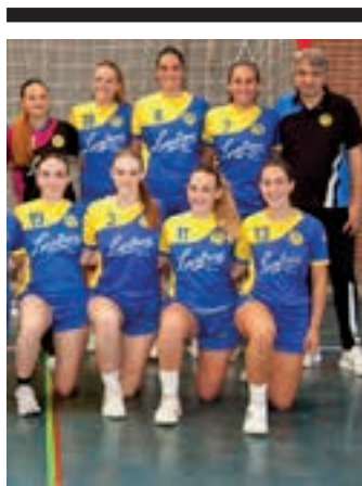
Leizaran Lanbroa taldea. AIURRI

Galdara nagusia matxuratu eta, hainbat egunez, igerilekua erabili ezinik izan dira Andoaingo Allurralde igerilekuko erabiltzaileak. Astearteaz geroztik berriro zabalik dago, eta ikastaro guztiak martxan daude berriro. Kirol Sailak, datozen egunetan, erabiltzaileei zer nolako konpentsazioa proposatu erabakiko du.