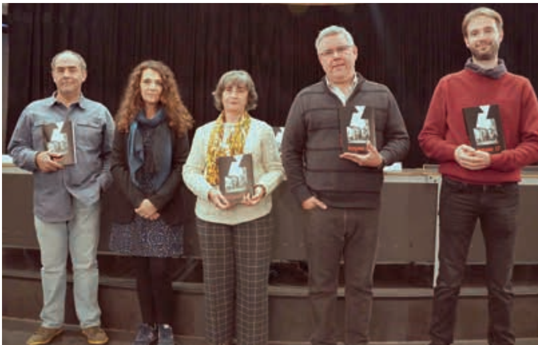
Leyçaur argitalpen berriena dagoeneko salgai dago. Aurreko astean egin zuten aurkezpen ekitaldia, Bastero Kulturgunean. AIURRI