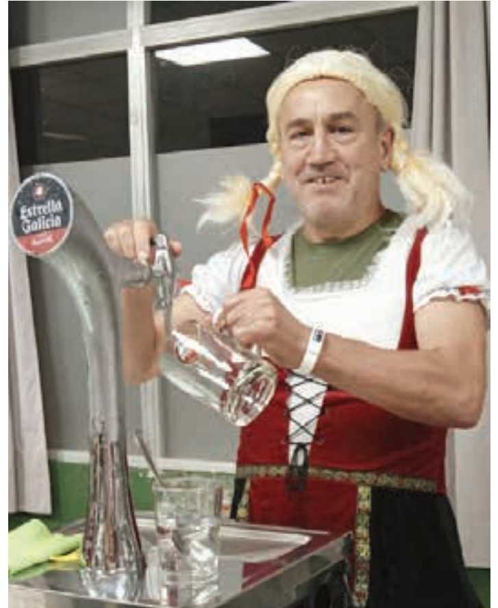
Denera, 80 ukondo, 150 garagardo litro eta 250 saltxitxa kontsumitu ziren. ETENETA

08:00-08:15 Harrera. 08:30-08:45 Parekatzeak. 08:45-11:45 Lehen txanda. 12:00-12:15 Parekatzeak. 12:15-15:15 Bigarren txanda. 15:15 Sari banaketa, zozketak eta agurra.