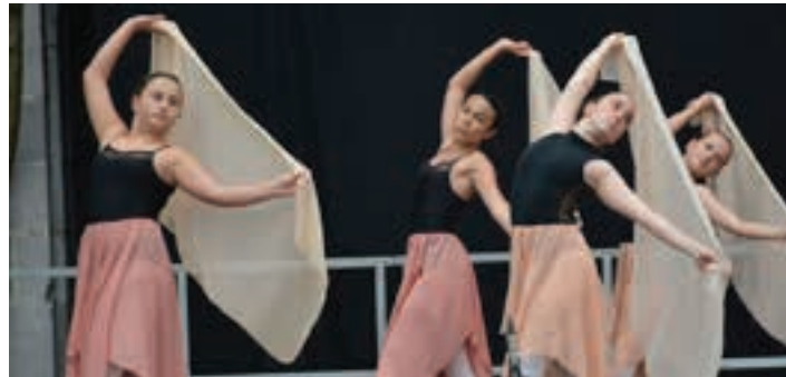
Azelain Ballet taldeko kideak, artxiboko irudian.