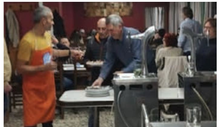
300 lagun pasatxo hurbildu ziren elkartearen, larunbat eguerdian hasita. ETENETA

litro eta 250 saltxitxa. 300 lagun pasatxo hurbildu ziren, larunbat eguerdian hasita. Gauzak horrela, azoka bikain ateratu zen. Eki-menarekin errepikatze asmoa dute, eta, dagoeneko, badakite jende askotxorentzat zerbiztua eskaini beharko dutela. Lana gogotik egingo zuten sustatzaileek, baina, erantzuna ikusita, lanean pozik aritzeko motiborik bazuten.