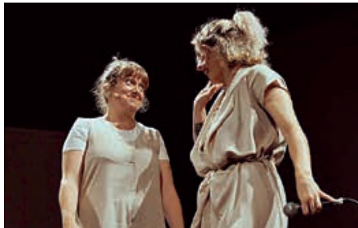
"Mira hadi" antzezilana, igande honetan, Saroben. LORALDIA

"Sukaldeko laguntzaile bila gabiltza, sagardotegi denboraldian Altunan (Urnietan) lan egiteko. 2025eko Urtarrilaren 22tik Maiatzak 11ra. Informazioa: 650 074 001".