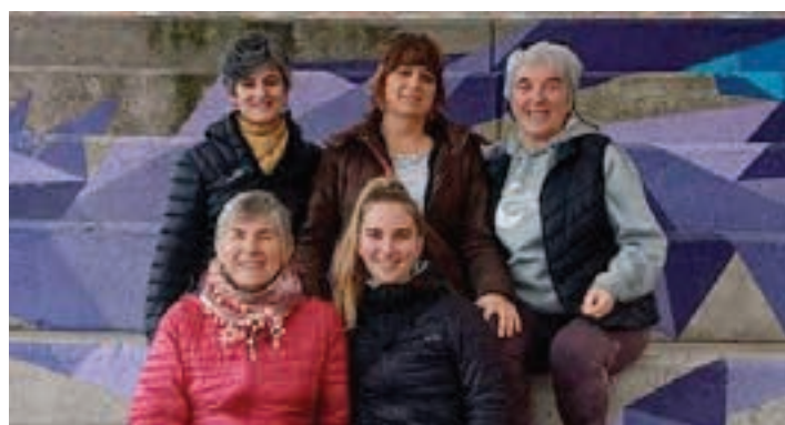
Jardunaldia antolatzen aritu den emakume taldeko hainbat kide. URNIETAKO EMAKUMEAK

Azaroaren 25ean, egutegiak gogoratuko digu Indarkeria Matxistaren Kontrako Eguna dela, batzuei behintzat. Seinalaturiko egun hau ez ahaztu arren, itxuraz, agenda gehienetan presente dagoen arren, zer gertatzen da urteko beste egun guztiekin? Zer gertatzen da gure