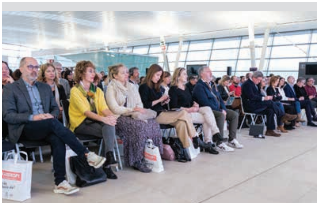
TOKIKOM jardunaldiak, 2023an. TOKIKOM

Hor azalduko da xehekiago eskualdeetako hedabide multimedien estrategia hori, hedabidegintzaren inguruko beste estrategiekin batera. Zehazki noiz argitaratuko dugun ez dakigu, baina negu-udaberri aldera izango dela espero dugu.