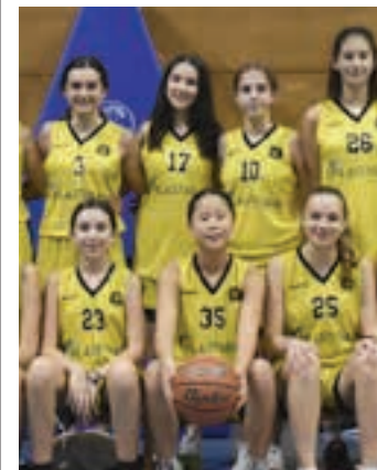
Ganbarako neskak, artxiboko irudian.