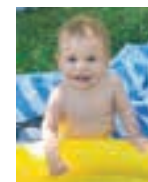
ANDOAIN Izar Urtetxo bat zuk Izar, kika berriekin duzu irrifar. Milaka muxu ditzazu har, amatxoren lagunak, bederatzia atso zahar. Ondo pasa!