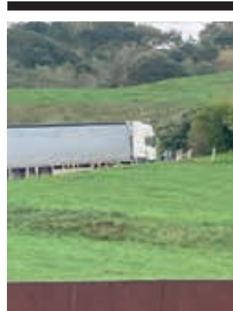
Astelehen goizeko irudia.