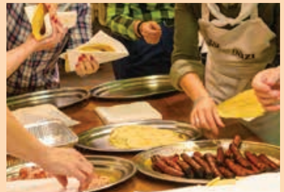
Taloak prestatuko dituzte Kotoi elkartearen. AIURRI

Zezen-suzkoa, Etxeberrieta plazan Gaueko 21:00ak aldera, eguraldiak ezustekorik ematen ez badu behintzat, Lebi zezen-suzkoa aterako da Gau Beltzaren hirugarren edizioari amaiera emateko.