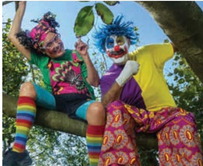
Porrotx eta Marimotots pailazoak. AIURRI

Andoaingo Udalaren 2025eko egutegia osatzeko lehiaketa. Gaia: "Merkataritza Andoainen". Epea: Urriak 31.