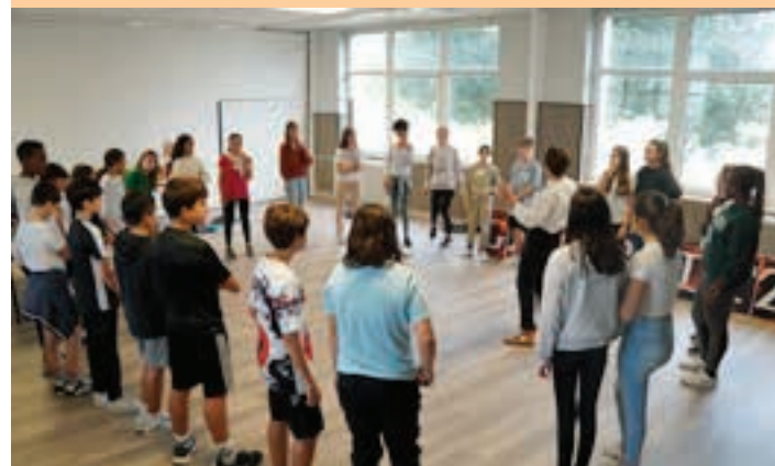
Ikasle-taldea entseguan, irakaslearen esanetara. AIURRI

Ikasturtea hasi denetik, bolo-bolo dabil Gau Beltza Magale-Salestarrak ikastetxean. Izan ere, egun berezia antolatzeko entsegu-lanetan murgilduta ibili dira. Aurreko astean, esaterako, dantzak entseatzeko aritu ziren.