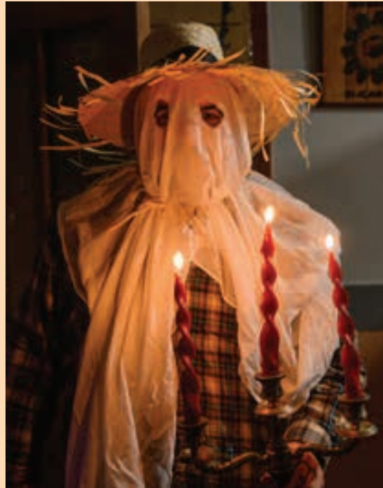
Irunberri Beldurraren etxea bilakatuko da. AIURRI

Beldurraren pasabidea, Kale Nagusian Goikoplazatik "Akerrak Okerrak" kalejira abiatuko da eta Kale Nagusian barrena igarotzean, Irunberri elkartearen ipinita izango da Beldurraren etxea.