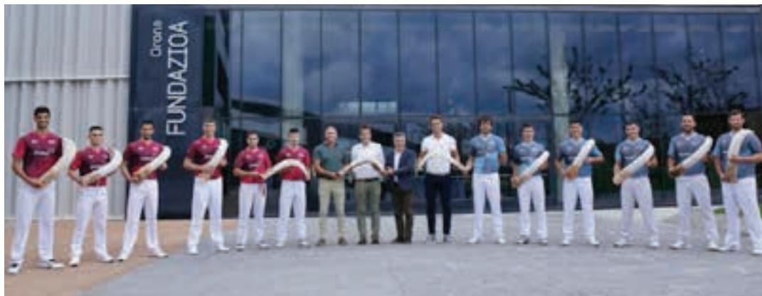
Lehen Mailako eta Bigarren Mailako lehiakideak, aurkezpen ekitaldian.