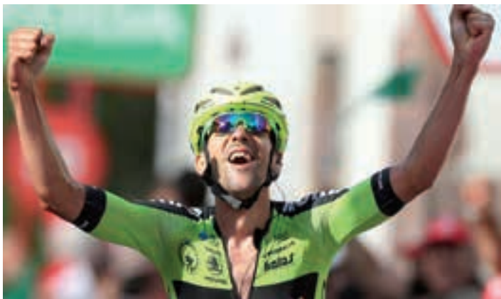
2019ko irailean Espainiako Vueltako etapa irabazi zuen, Nafarroako lurretan. Gogoangaria izan zen arratsalde hura txirrinduzaleentzat. MURIAS