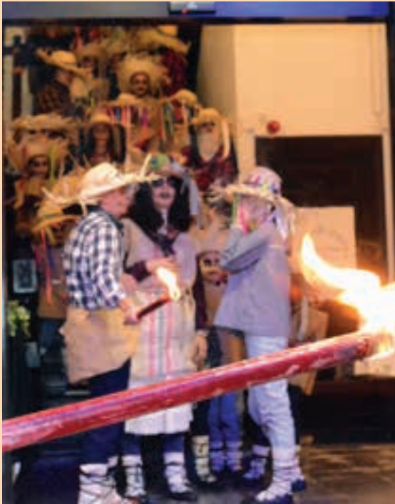
Arratsaldeko 18:00tan hasiko da ospakizuna. AIURRI

Jaiaren hasiera, Goikoplazan Txokolatea jan eta gero, jaialdiko lehen zatia biribiltzeko ekitaldia izango da plazan bertan. Txalaparta doinuen ondoren, antzezpena izango da eta, jarraian, Urki dantza taldearen emanaldia.