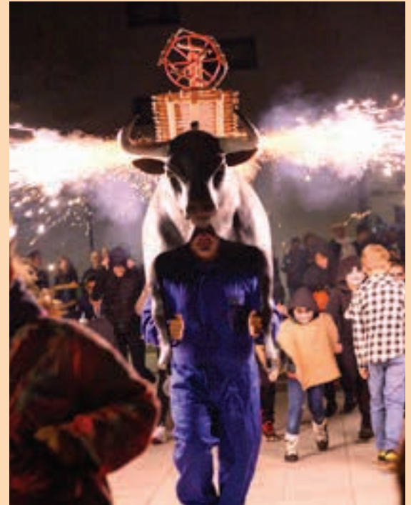
Jaiari amaiera emango diote, gaueko 21:00ak aldera. AIURRI

Zezen-suzkoa, Etxeberrieta plazan Gaueko 21:00ak aldera, eguraldiak ezustekorik ematen ez badu behintzat, Lebi zezen-suzkoa aterako da Gau Beltzaren hirugarren edizioari amaiera emateko.