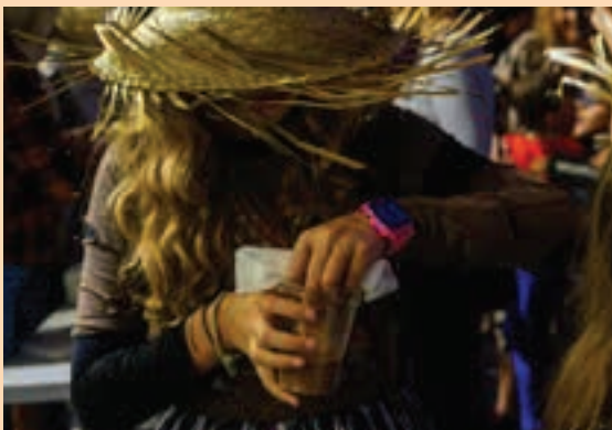
Txokolate-beroa Goikoplazan banatuko du Batzokiak. AIURRI

Jaiaren hasiera, Goikoplazan Txokolatea jan eta gero, jaialdiko lehen zatia biribiltzeko ekitaldia izango da plazan bertan. Txalaparta doinuen ondoren, antzezpena izango da eta, jarraian, Urki dantza taldearen emanaldia.