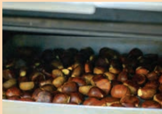
Gaztainak banatuko dituzte Irunberri elkartearen. AIURRI

Beldurraren pasabidea, Kale Nagusian Goikoplazatik "Akerrak Okerrak" kalejira abiatuko da eta Kale Nagusian barrena igarotzean, Irunberri elkartearen ipinita izango da Beldurraren etxea.