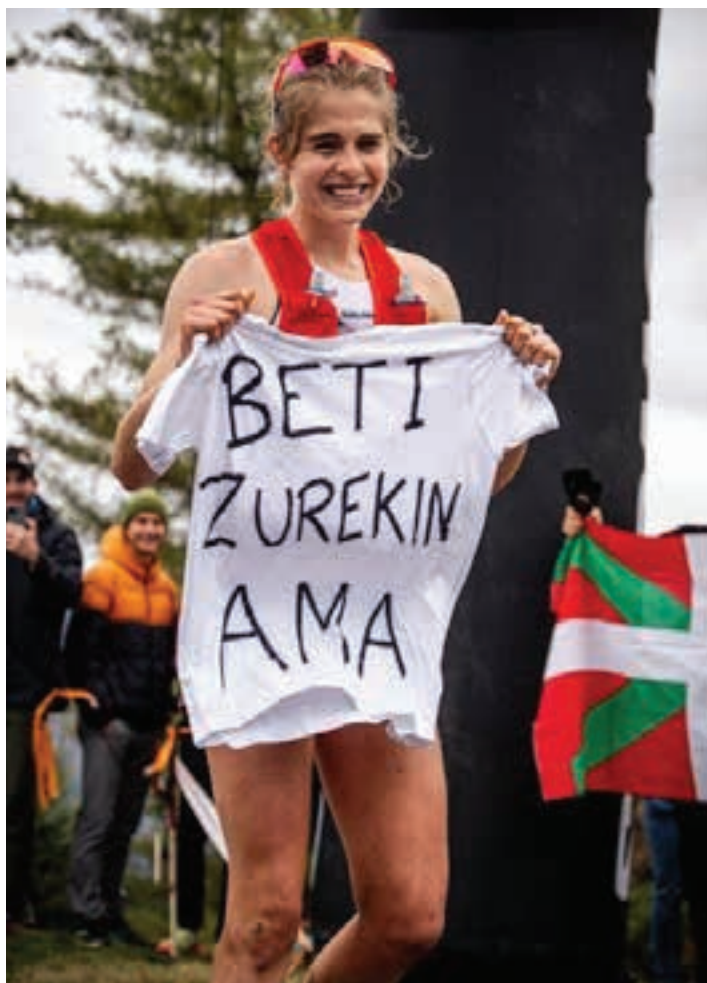
Malen Osa Ansa, helmugara iritsi aurretik. TONTORRETIK