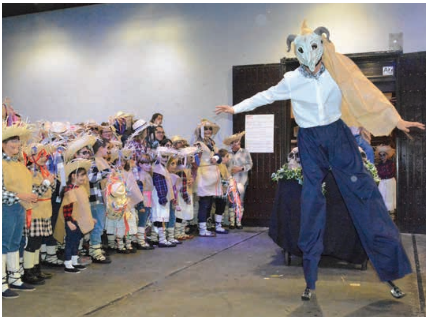
Urki dantza taldearen emanaldia amaitu ostean, hasiera emango diote "Akerrak Okerrak" kalejirari. AIURRI