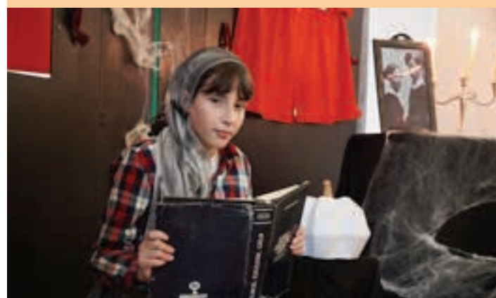
Narora Agra Rodrigo ikaslea, “Gaeuan mendian” ipuina kontatzeko prest. AIURRI

Gau Beltza eta Urnieta. Bi gai nagusi horiek izan dira Magale-Salestarrak ikastetxeko DBH1