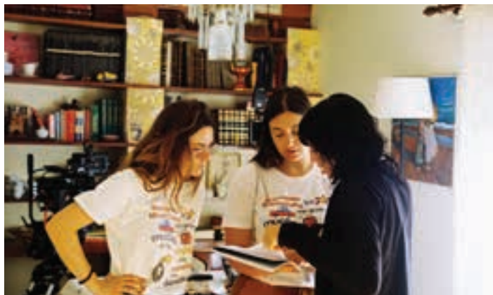
Film laburraren "b" aldea, kamararen atzekaldea. U. BOTAS