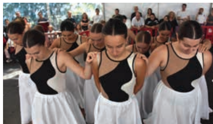
Jantzi garaikideekin egin zuten erakustaldia.

Festa-sorta luzea egokitu da aurten Urnietan, hain justu ere, Sanmielen aurreko asteburutik hasi eta Xoxokako jaien igandera bitarte. Bada, egitarau guztietan izan du txokoa Egape Dantza Taldeak