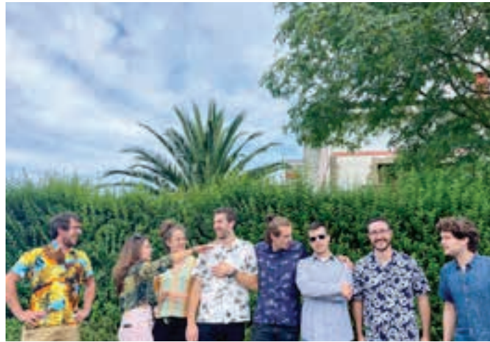
Aldapeko Basque Latin jazz musika taldea. ALDAPEKO

Kulturgunean eta Plaza Morean Irri aldizkariaren urteurrean ospatuko dute, Porrotz eta Marimotots eta herriko hainbat eragileren parte-hartzearekin. Besteak beste, herriko musika eta dantza eskolak. Bastero eta Plaza Morea. Urriak 27, igandea.