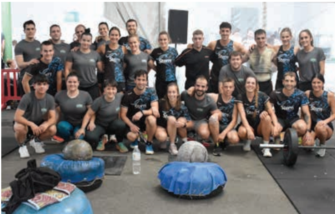
Erronka amaituta, taldeko argazkia atera zuten xoxokarrek eta asteasuarrek. AIURRI