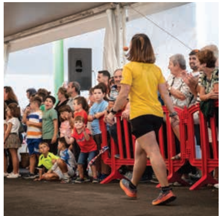
Une dibertigarri ugari bizi izan zen igande arratsaldean. AIURRI

Igandekoa igarota, amaiera eman zaie Urnietan hiru asteburu jarraian izandako ospakizun-sortari.