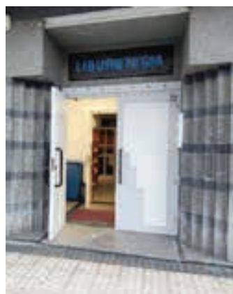
Udal Liburutegia. AIURRI

Aurreko astean Gernika-Palestina ekimenak deialdia iragarri zuen: "Genozidioa geldiarazteko eta konponbidea aldarrikatzeko dei egiten diogu euskal jendarteari, urriaren 21ean, herri guztietako udaletxeen aurrean 19:00tan izango diren kontzentrazioetan parte hartzera". Andoaingo Goikoplazan eta Urnietako San Juan plazan, beraz, hitzordu bana deituta dago.