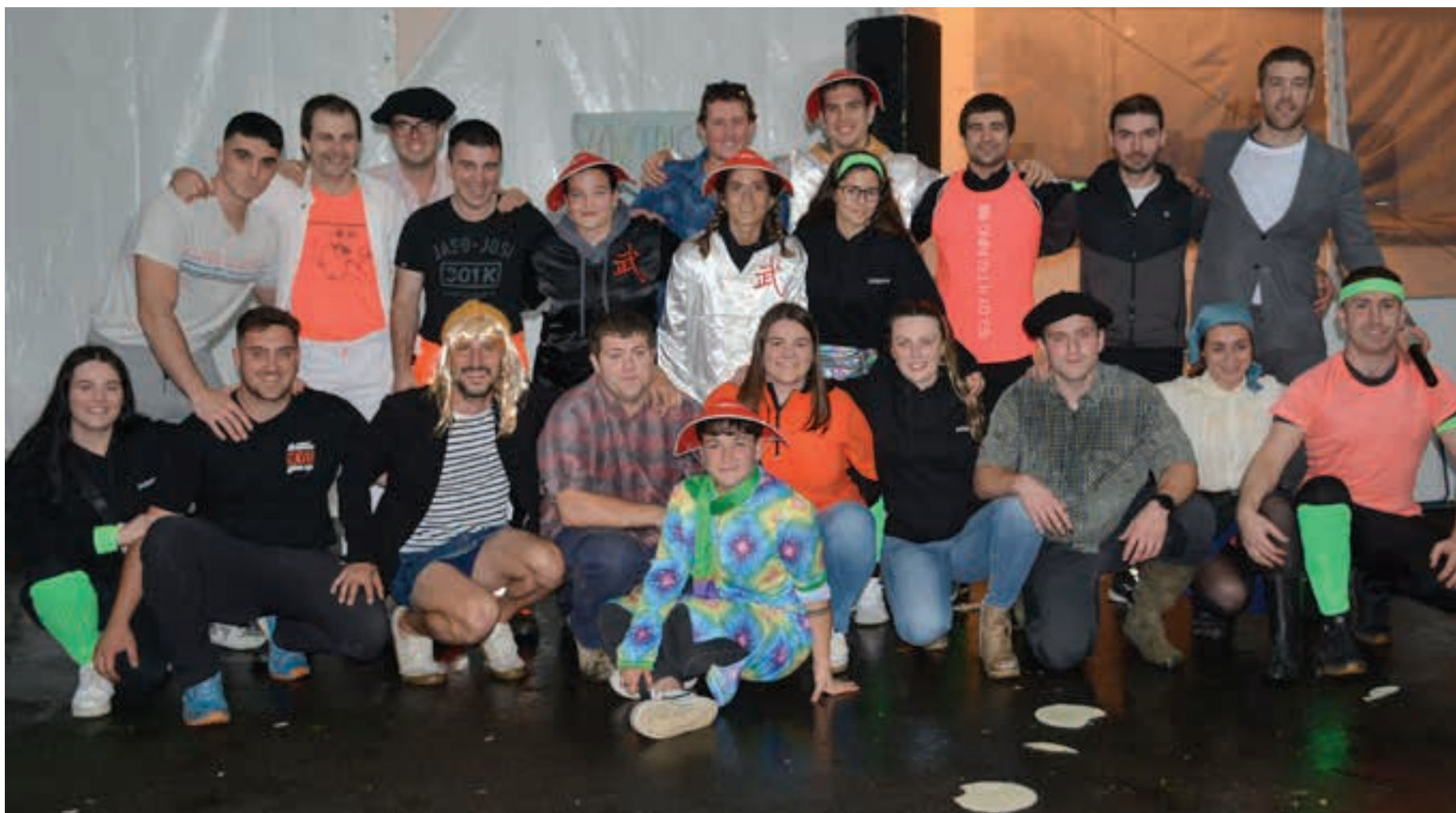
Ostegun gaueko auzo antzerkian parte hartu zuten auzotarrak. AIURRI