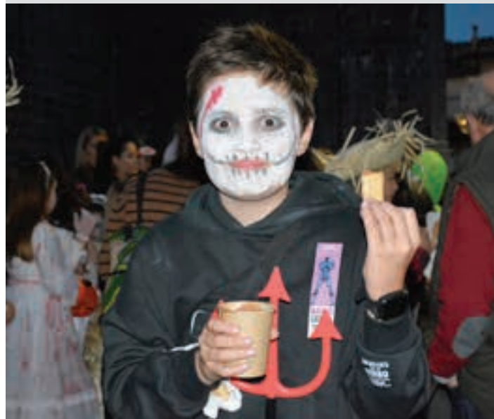
Txokolate beroa jateko aukera izango da Goikoplazan. AIURRI

Txokolatea, Goikoplazan lazko aurrikuspenei eutsiz, 500 lagunentzat txokolate beroa prestatuko dute Batzokiko lagunek. Glutenik gabeko bizkotxoak izango dira, hala eskatzen duenarentzat.