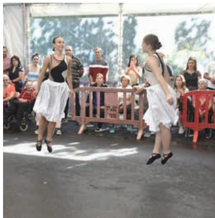
Azken urteotan, ikuskizun bikainak egin ditu Egape Dantza Taldeak. AIURRI