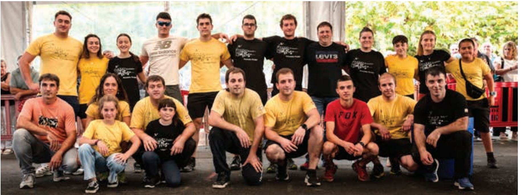
Auzotarren arteko desafioan aritu ziren partaideak, taldeko argazkian.