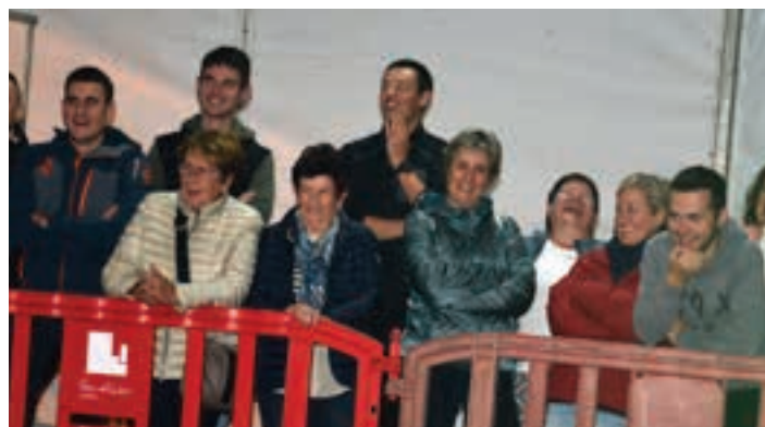
Barrez lehetzeko moduko ikuskizuna egin zuten auzotarrek. AIURRI