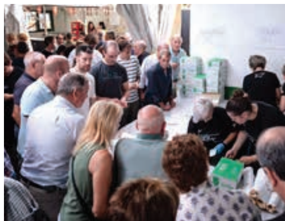
Sagardoa eta pintxoa dastatzeko aukera paregabea izan zen. AIURRI