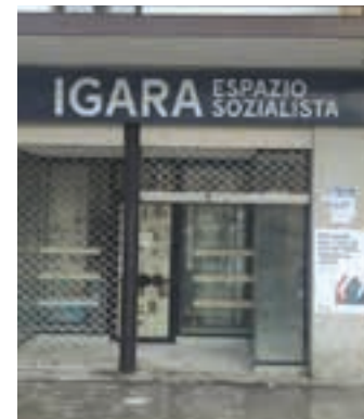
Igara espazioa. GEDAR

Bertan gauzatutako ekimenak askotarikoak izan dira. Adibidez, lehen hilabeteetan, elkartasun bilketa ugari egin dira (ikasmaterialarena berriki, neguko manta eta arroparena urtarrilean, edota jostailuena gabonetan). Horiei esker, eskualdeko hainbat norbanakori behin-behineko laguntza txiki bat eman ahal izan zaie. Bestalde, berehalako erantzun horietatik harago, langileon autoantolakuntza sustatzeko espazioek ere lekua izan dute Igaran. Horren adibide dira Etxebizitza Sindikatua eta Laneko Autodefentsa Sarea, esaterako. Hainbat pertsonari eman zaie etxebizitza zein lan arloko aholkularitza, eta etxejabe zein nagusien gehiegikeriei aurre egiteko