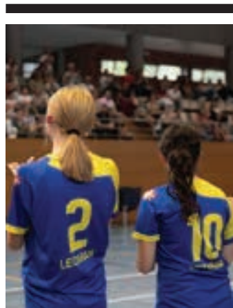
Leizaran taldea. AIURRI

Igandean jendetza elkartu zen Donostiako kaleetan, Gipuzkoan bereziki txirrindulariek pairatzen duten egoera salatzen. Haur eta gaztetxo mailako denboraldiari hasiera eman ezinik dabilta, Trafiko zuzendaritzarekin duten liskarra tarteko. Federazioko zuzendaritzak, gainera, dimisioa eman du. Ez da giro, une honetan, txirrindularitzan.