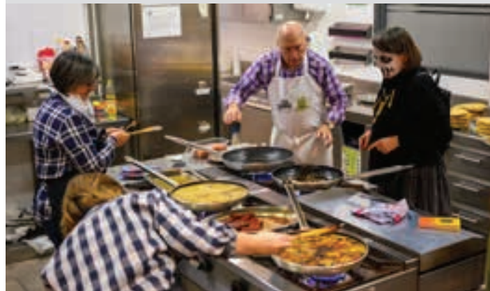
Kotoi elkarteko sukaldean prestatzen dira taloak. AIURRI

Txokolatea, Goikoplazan lazko aurrikuspenei eutsiz, 500 lagunentzat txokolate beroa prestatuko dute Batzokiko lagunek. Glutenik gabeko bizkotxoak izango dira, hala eskatzen duenarentzat.