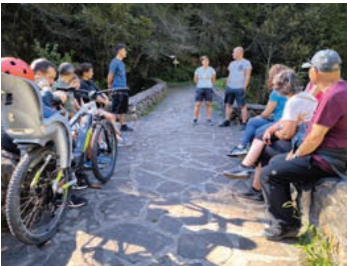
Bizikleta eta bertsoa uztartu zituzten aurreko larunbatean Andoainean. AIURRI

Mendiluzek aukerak zabaldu zituen: "Zergatik edo nondik datorren ez nago oso seguru, baina, hala ere, asma dezagun aitzakia ederra dugu". Azken bertsoaldiaren bideoa Aiurri.eus webgunean ikusgai dago.