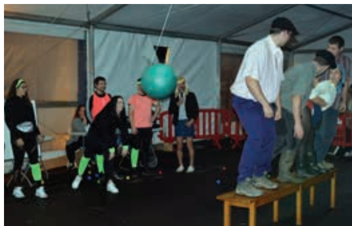
Askotariko jolasak egin zituzten emanaldian. AIURRI