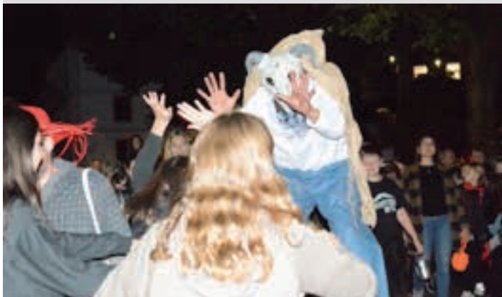
Aurreko bi urteetan bezala, "Akerrak Okerrak" kalejira ibiliko da kalez kale.

Jaiaren hasierako antzezpena eta dantza, Goikoplazan Urriaren 31n, ostegunarekin, 18:00tan emango zaio hasiera Gau Beltzari, aktore-taldearen eta Urkikoen eskutik.