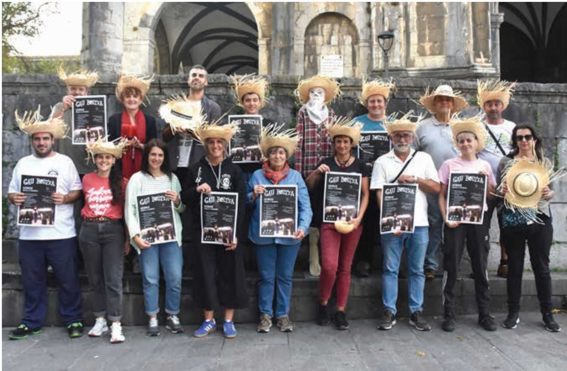
Gau Beltzako eragile ia guztiak elkartu ziren astearte arratsaldean, Goikoplazan. AIURRI