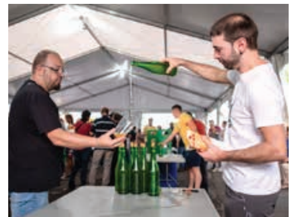
Auzoko sagardoa dastatzeko aukera ederra da. AIURRI