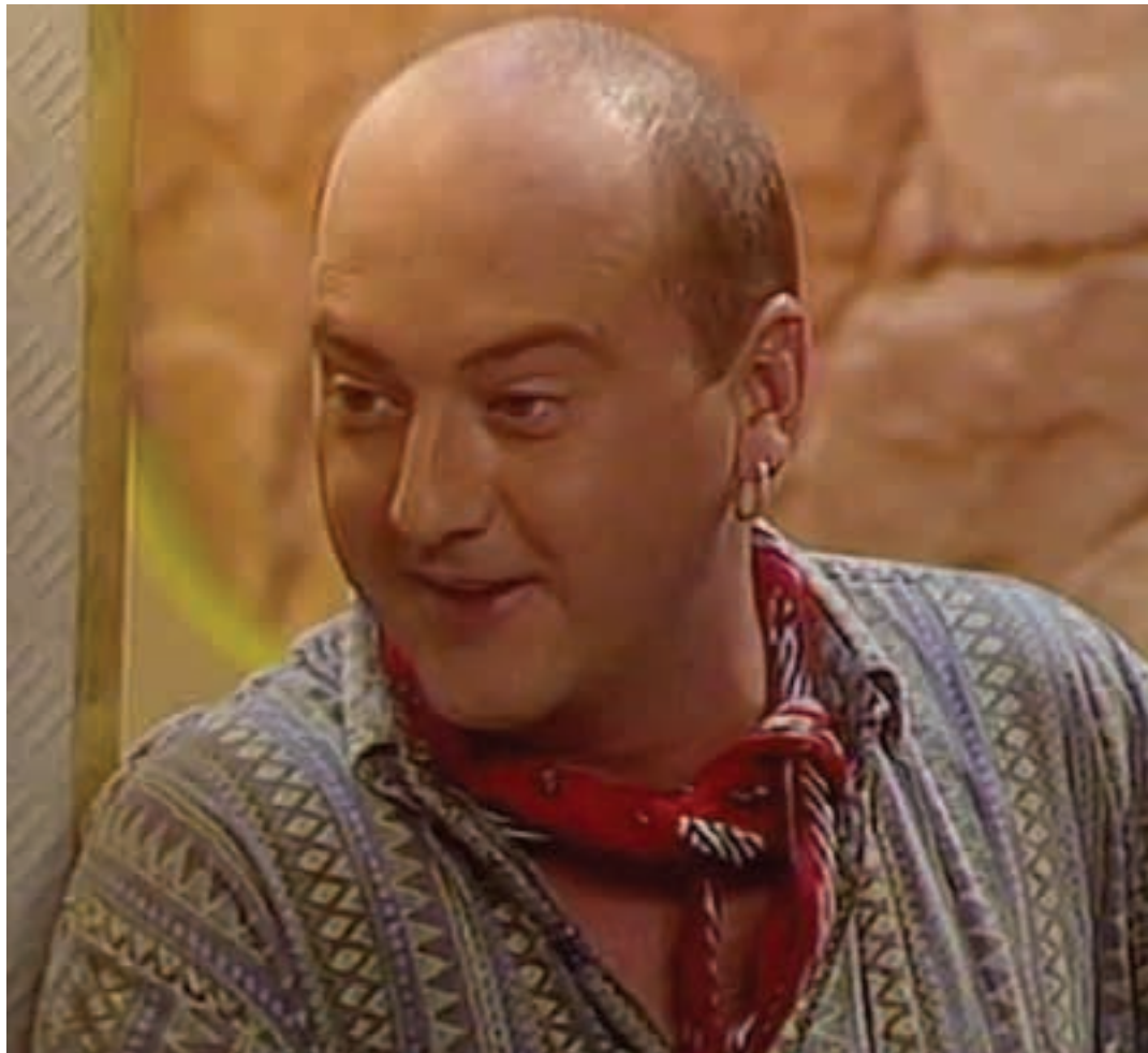
"Txapas" Varsovia tabernan, ziria sartzeko pronto, ziurrenik. GOENKALE

Goenkale -ren ibilbidearen erdian parte hartu ostean, ezkutatu egin zinen halako batean.