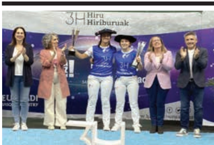
EMAKUME MASTER CUP