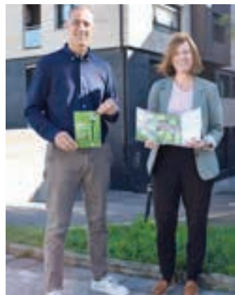
Segurado eta Mercader. AIURRI

dezakete urriaren 27a baino lehen. Bideak ohikoak dira: kutzak, postontziak, webgunea eta app-a. Gainera, urriaren 25ean informazio karpa bat ipiniko da. Goizean, Etxeberri plazan eta, arratsaldean, San Juan plazan.