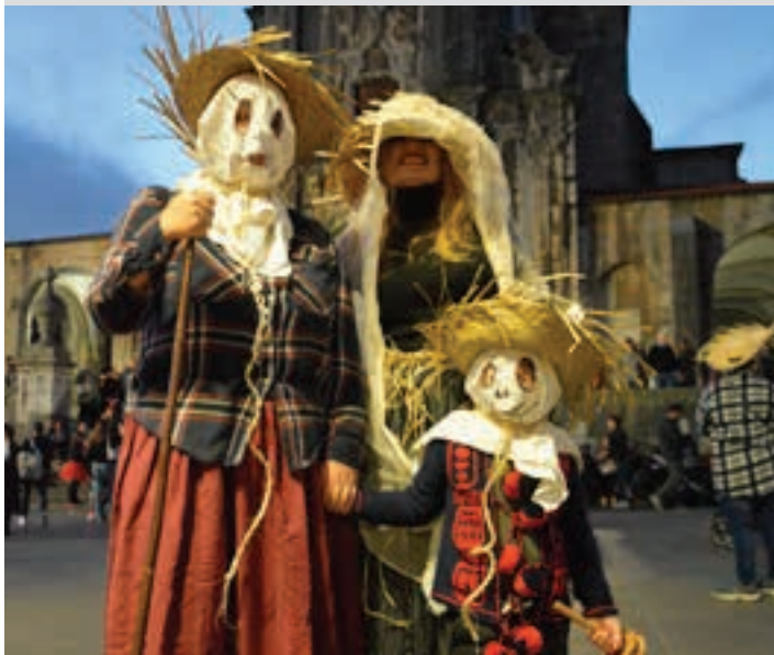
Euskal kutsuko mozorro ederrak ikus daitezke Gau Beltzan.

Jaiaren hasierako antzezpena eta dantza, Goikoplazan Urriaren 31n, ostegunarekin, 18:00tan emango zaio hasiera Gau Beltzari, aktore-taldearen eta Urkikoen eskutik.