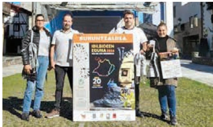
Usurbilen egin zuten aurtengo edizioaren aurkezpena. UDALA

12:00etan aterako da lehena Aginagan, eta azkena 14:00etan, udalerrri bakoitzeraino.