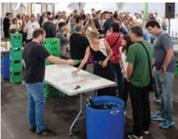
Sagardo dastaketa, ezinbestekoa azken jai egunean. AIURRI