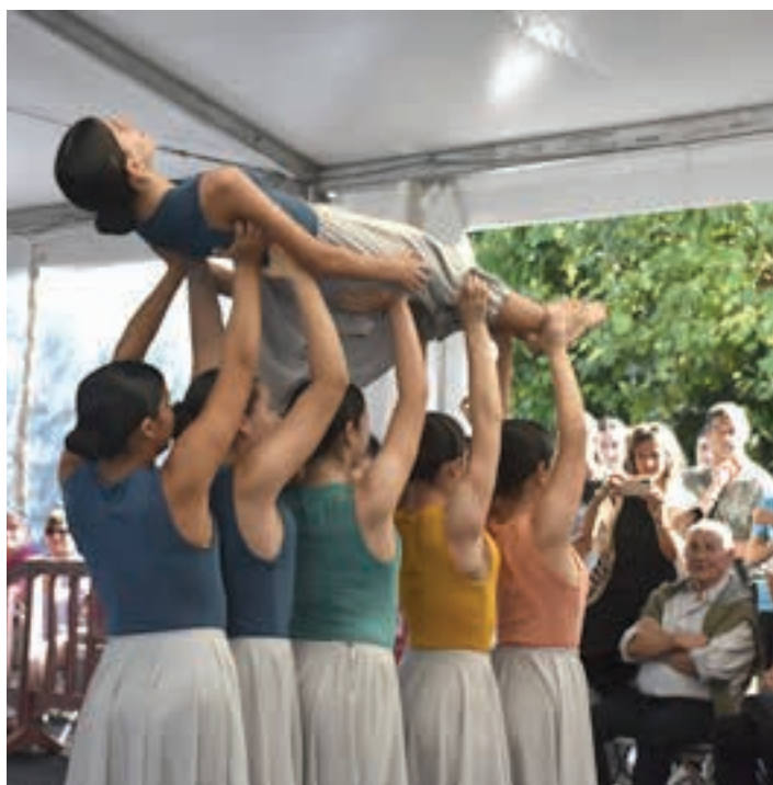
Publikoaren harrera beroa jaso zuten dantzariak.

Aurten, orotara, 20 kidek egin dute erakustaldia Xoxokan: DBH 3-4. mailako ikasleak; baita Baxilergoan daudenak ere. Nork bere piezak dantzatu arren, amaierako dantza elkarrekin egin zuten, emanaldia biribiltzeko. Txalo zaparrada batekin jaso zituzten ikus-entzuleek.