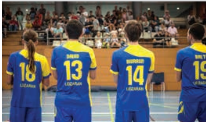
Senior mailako taldekideak. AIURRI

Ibilbide osoa egiteko kluba Txikitari taldean murgildu eta senior mailarainoko ibilbidea egin daiteke Leizaran taldean. Allurraldeko ekitaldian hori frogatzeko aukera izan zen, hamabost talde aurkeztu zituztelako.