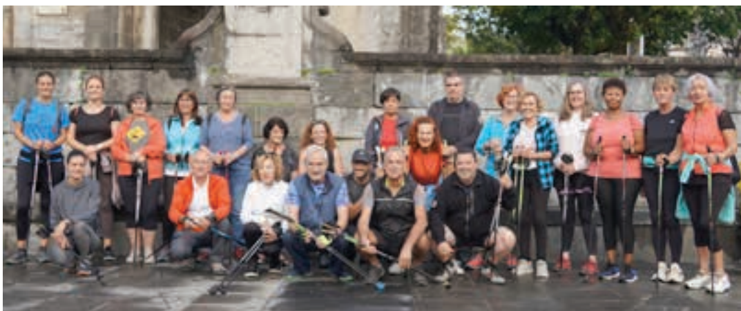
Nordic Walking ikastaroari ekin aurretik taldeko agazkia atera zuten Goikoplazan.