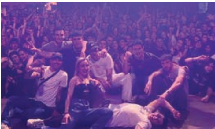
Mutiko taldeko kideak eta lagunak. JIMMYJAZZ