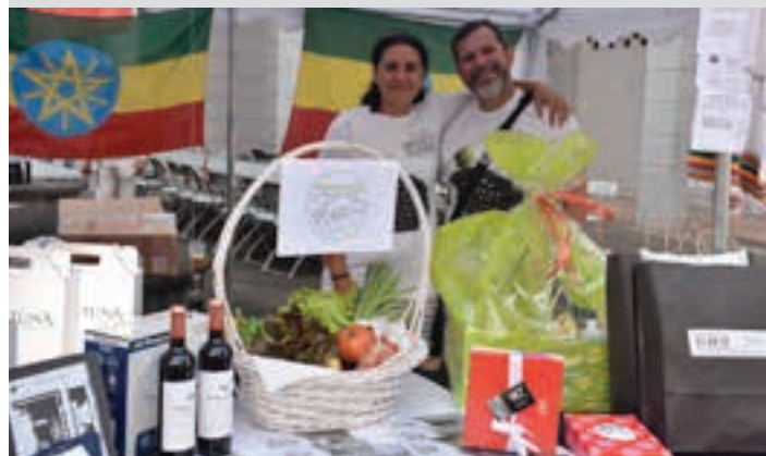
Elkartasun-saski erraldoia osatu zuten. AIURRI

Paella herrikoa Boluntario-sare zabala izan zen egun osoan. Hala nola, buru-belarri aritu ziren lanean urnietarrak paella goxoa prestatu ahal izateko. Zubitxo plazan izan zen hitzordua, musikaz girotuta.