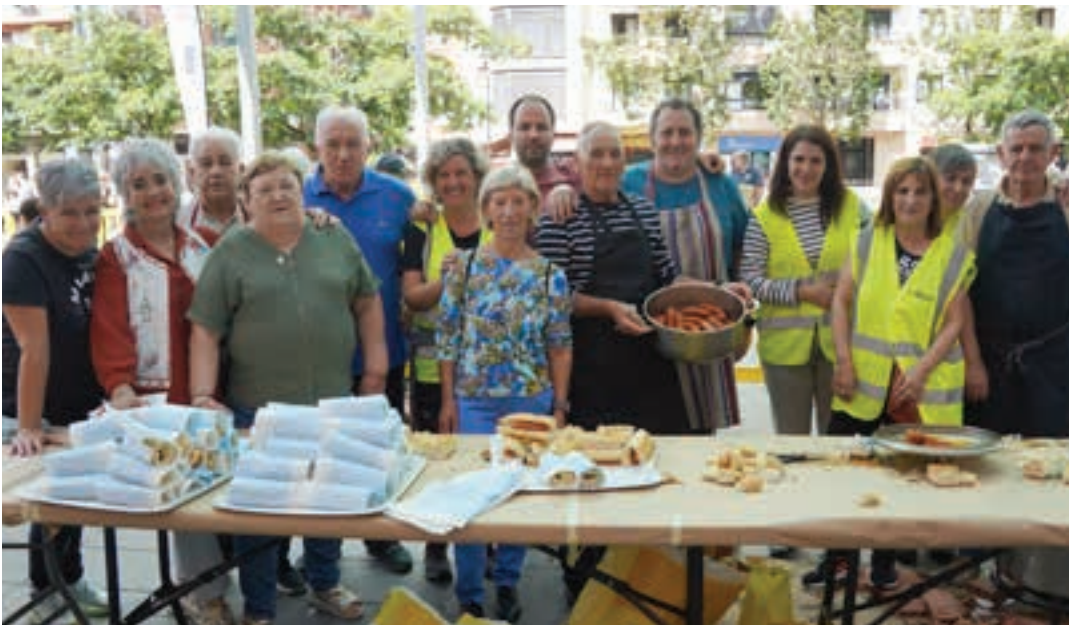
Hamaiketakoak antolatu zuten hainbat lagunek Zumea plazan.