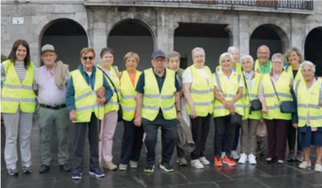
Ibili Andoain taldeko kideek irteera egin zuten udalerrian barrena. Asteazken honetan ekin diote asteroko hitzorduari. AIURRI