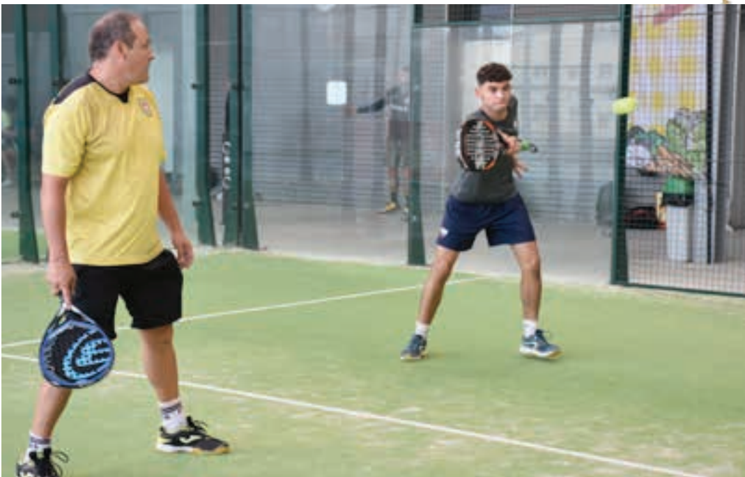
Bikote mordoxkak hartu zuen parte padel-txapelketan. AIURRI