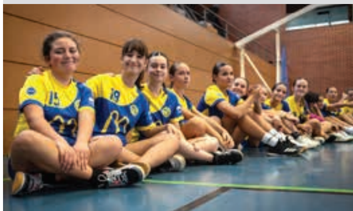
Haurrak, gaztetxoak eta helduak elkartu ziren aurkezpen-ekitaldian. AIURRI

Talde lana ezinbestekoa da Ehunka kirolari martxan jarri ahal izateko lan handia egin behar da eta, bereziki, laguntzaile ugari. Askoren lanari esker iritsi da gaurdaino Leizaran eskubaloia taldea. Haien lana aitortzea garrantzitsua da.