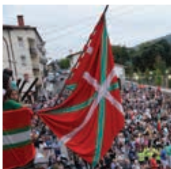
Jendez beteko da plaza. AIURRI

Txosnagunean, ostegun iluntzean, lehiaketa ezaguna eta kontzertuak iragarrita daude. Jaiak, ofizialki, ostiral arratsaldean abiatuko dira Mielaren jaitsierarekin eta txupinazoarekin.