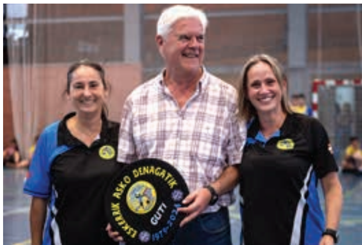
"Eskerrik asko denagatik" esaldia ageri da oparitu zioten txapelan. AIURRI

45 urte dira Leizaran taldeari eskainitakoak eta, horregatik, aurreko ostiralean klubaren omenalditxoak jaso zuen. Ezustekoa izan zen protagonistarentzat: ikusleen artean zegoela, ez zuelako horrelakorik espero.