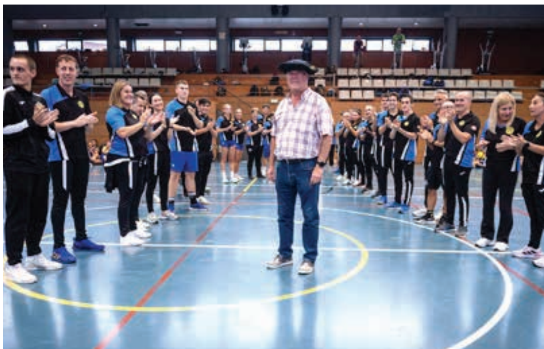
ikusleen artean zegoen aurkezpen-ekitaldian eta sorpresa polita prestatu zioten: Ondo merezitako omenaldia jaso zuen. AIURRI