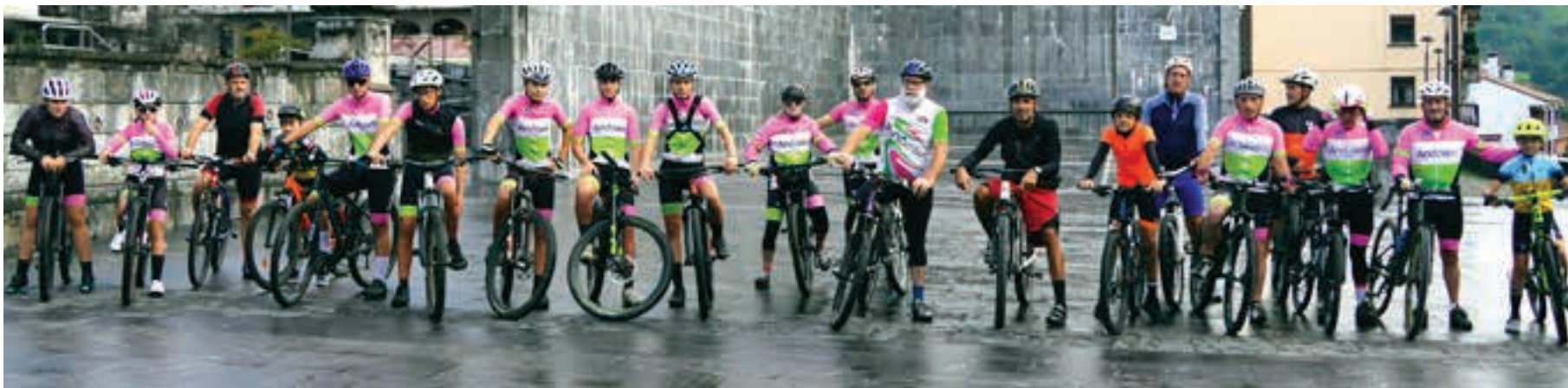
Leitzaran aldera abiatu ziren txirrindulariak, Andoaingo Txirrindulari Eskolakoen gidaritzapean. AIURRI