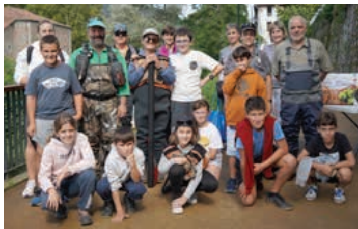
Ontza elkarteko kideak eta lagunak, Leitzaran ibaian.

dulari Eskola, Oskarbi taldea, Gazteleku Pelota Elkartea, Ontza Elkartea, Gipuzkoako Kirol Ego- kituen Federazioa, Zumeatarra Kirol Taldea, Kabutoken Kenpo- Kai kluba eta Real Sociedad Fundazioa. Jarduera fisikoa egitearen garrantziaz ohartarazteko eguna izan zen eta, bide batez, gauza berriekin probatzeko gonbita. Azken urteotan ekimenak izan duen garapena ikusita, bistakoa da "Mugitu Andoain" indartzen ari dela, urtez urte.