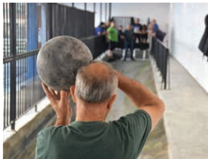
Tradizio handia du txapelketak, Urnietan. AIURRI