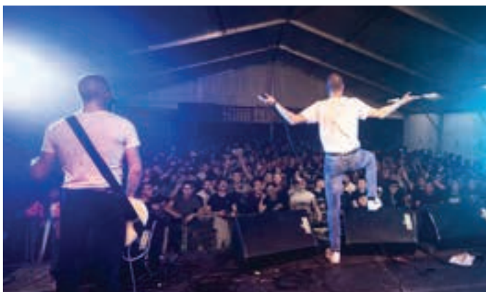
Iruñerriko taldea da Streetwease. STREETWEASE

Festa-giroa egun bat gehiago luzatu nahian, "elizako galaz" jantzita aterako dira txosneroak kalera igandean, arratsaldeko bingoaz eta kontzertuez gozatzeko: Bombadil eta Lilith Selektah.