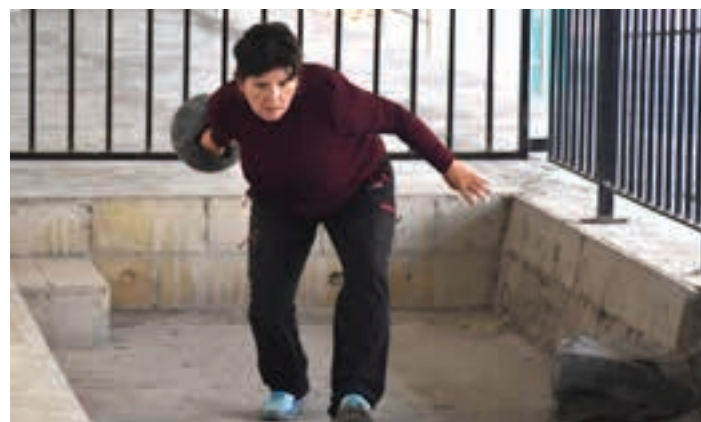
Inguruko herrietako jendea ere gerturatu zen parte hartzera.