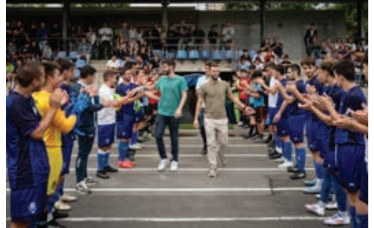
Jokalarien eta zaletuen babesa jaso zuten omenduek.