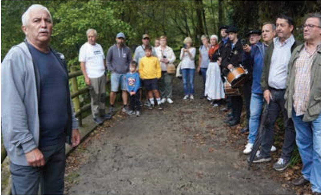
Ontza elkarteko kidea hizlari, alboan elkarteko kideak, Torralboren lagunak eta txistulariak eta dantzaria zituela. AIURRI