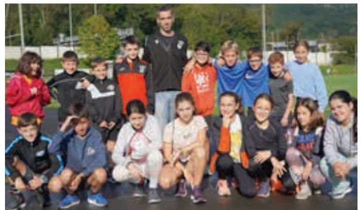
Aletismoan trebatzeko saioa Ubitarten, Zumeatarraren eskutik. AIURRI