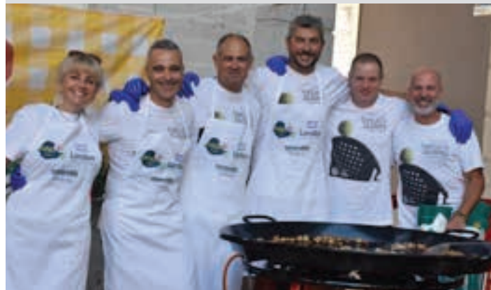
Bolondresak, paella-prestaketan. AIURRI

Paella herrikoa Boluntario-sare zabala izan zen egun osoan. Hala nola, buru-belarri aritu ziren lanean urnietarrak paella goxoa prestatu ahal izateko. Zubitxo plazan izan zen hitzordua, musikaz girotuta.