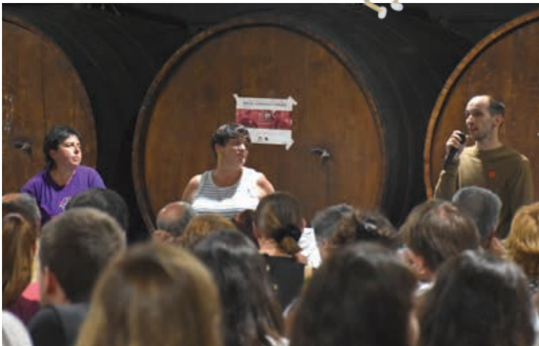
Kupelak atzean eta dozenaka ikusle aurrean, bertso-saio aparta egin zuten Enbeitak eta Colinak, Agirrerren laguntzarekin. AIURRI