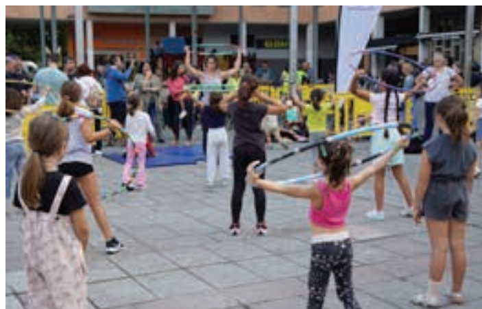
Gimnasia erritmikoa, Oskarbiren eskutik.