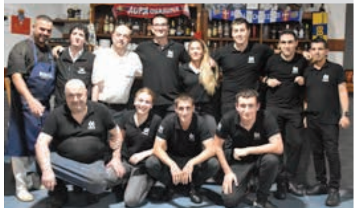
Zerbitzariak bertsozaleen aitortza jaso zuten. AIURRI

Ehun eta berrogeita hamar lagun Urnietatik, Andoaindik eta beste hainbat tokitatik hurbildutako 150 lagun elkartu ziren Oianume sagardotegian. Tripak bapo beteta, adi-adi jarraitu zuten bertsolarien jarduna.