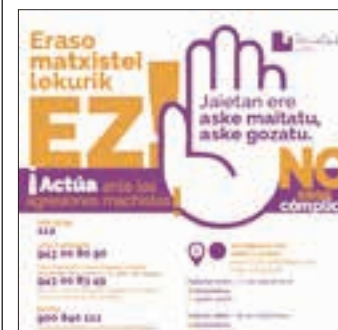
Udalak konpromiso argia erakutsi du eraso matxistei aurre egiteko. AIURRI