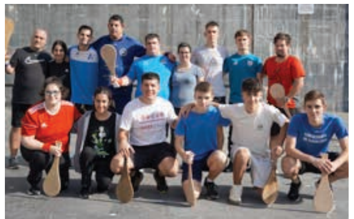
Palan aritu ziren lagunak, Gaztelekuk antolatutako saioan. AIURRI