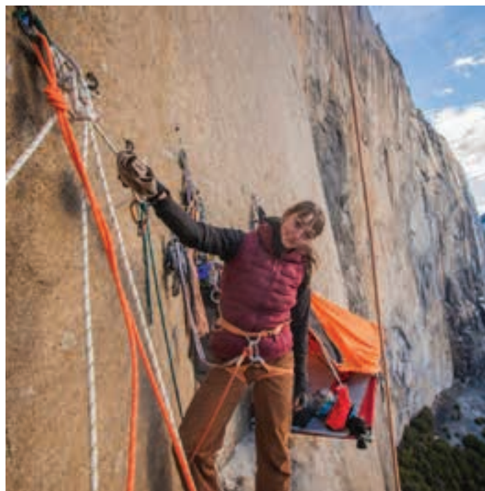
'CAPTAINS ON EL CAP'

Arratsaldeko 19:00etan ikus-entzunezkoak proiektatuko dituzte, Saroben. Bost ekoizpen eskainiko dira: 'Canto Rodado', Ekhi Alde zuzendari hernaniarrarena; 'Zerbait Aldatu da', Mikel Sarasola kayaker donostiar ezagunarena; 'La Gara', Julen Elorza zuzendari arrasatearrarena; 'Oinez', Bira ekoizpen-etxekoa; eta, azkenik, 'Captains On el Cap' 54 minutuko pelikula. Seb Berthe eskalatzailer belgikarrak The Dawn Wall bidea egitea du helburu, Yosemiteko El Capitan horman (Kalifornia, AEB).