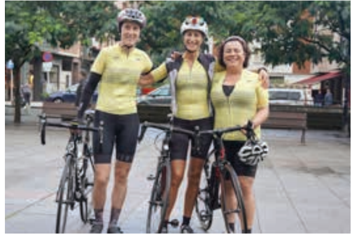
Txirrindandoain taldeko kideak.