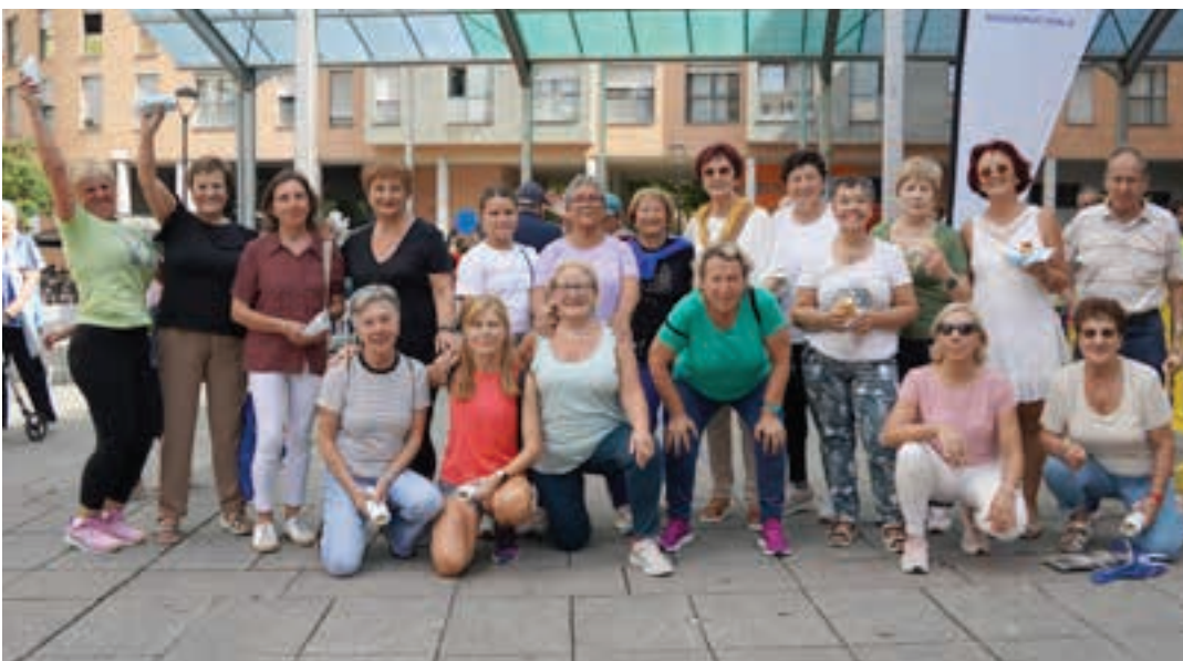
Gimnasiako kideak, saioa amaitu ostean. AIURRI