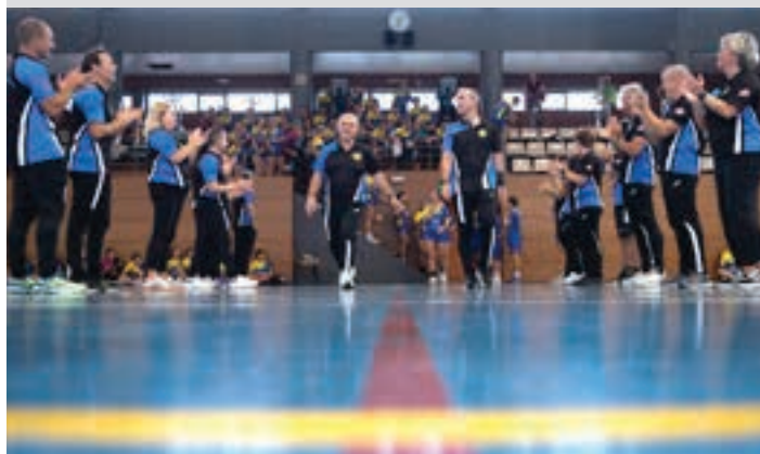
Prestatzaileen eta laguntzaileen lana ezinbestekoa da. AIURRI

Ibilbide osoa egiteko kluba Txikitari taldean murgildu eta senior mailarainoko ibilbidea egin daiteke Leizaran taldean. Allurraldeko ekitaldian hori frogatzeko aukera izan zen, hamabost talde aurkeztu zituztelako.