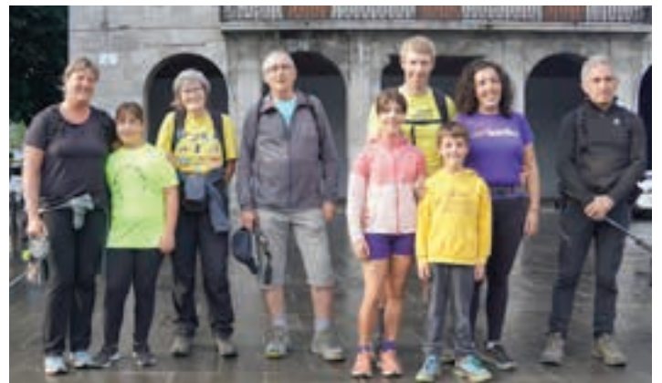
Mendizaletasuna sustatzea izan zen eguneko helburuetakoa. AIURRI