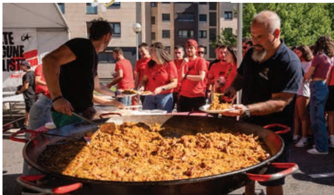
HAINBAT BAZKARI LARUNBAT EGUERDIAN: Txosnagunean herri-bazkaria eta bingo musikatu, San Juan plazan paella-jatea eta Oianumen emakumezkoen kuadrillaren bazkaria. Eguerdian hasita, beraz, jaiaren murgiltzeko aukerarik ez da faltako. AIURRI

18:00 Malatxo Txarangaren irteera txosnagunetik.