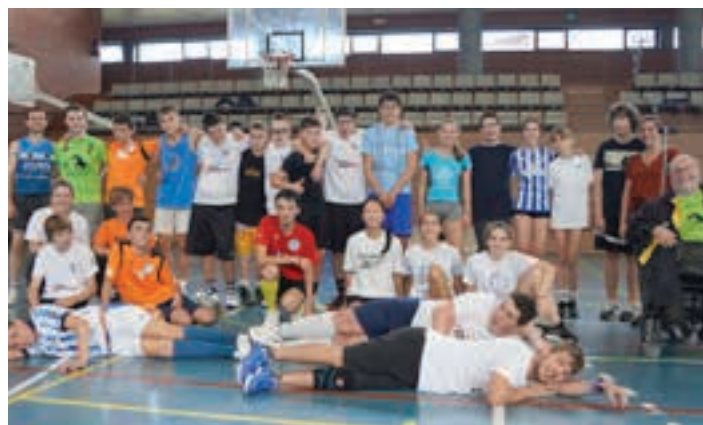
Saskibaloian, eskubaloian eta futbolean aritu ziren Allurralde kiroldegian. AIURRI