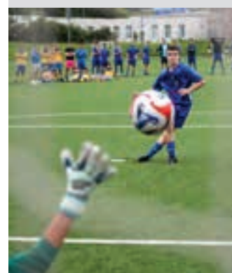
Penaltia jaurti zituzten. AIURRI

Dozenaka lagun elkartzeko Ubitarten, larunbat arratsaldean.