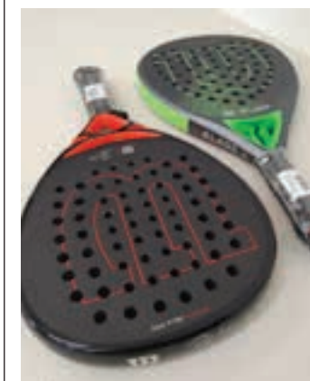
Paddle palak. WIKIPEDIA

tilek laster ekingo diote astero-astero jokatu den ligari. Aurreko denboraldian laugarren sailkatu ziren ligan, 30 partidatik 16 irabaziz. Ez litzateke txarra iazkotik gertu ibiltzea.