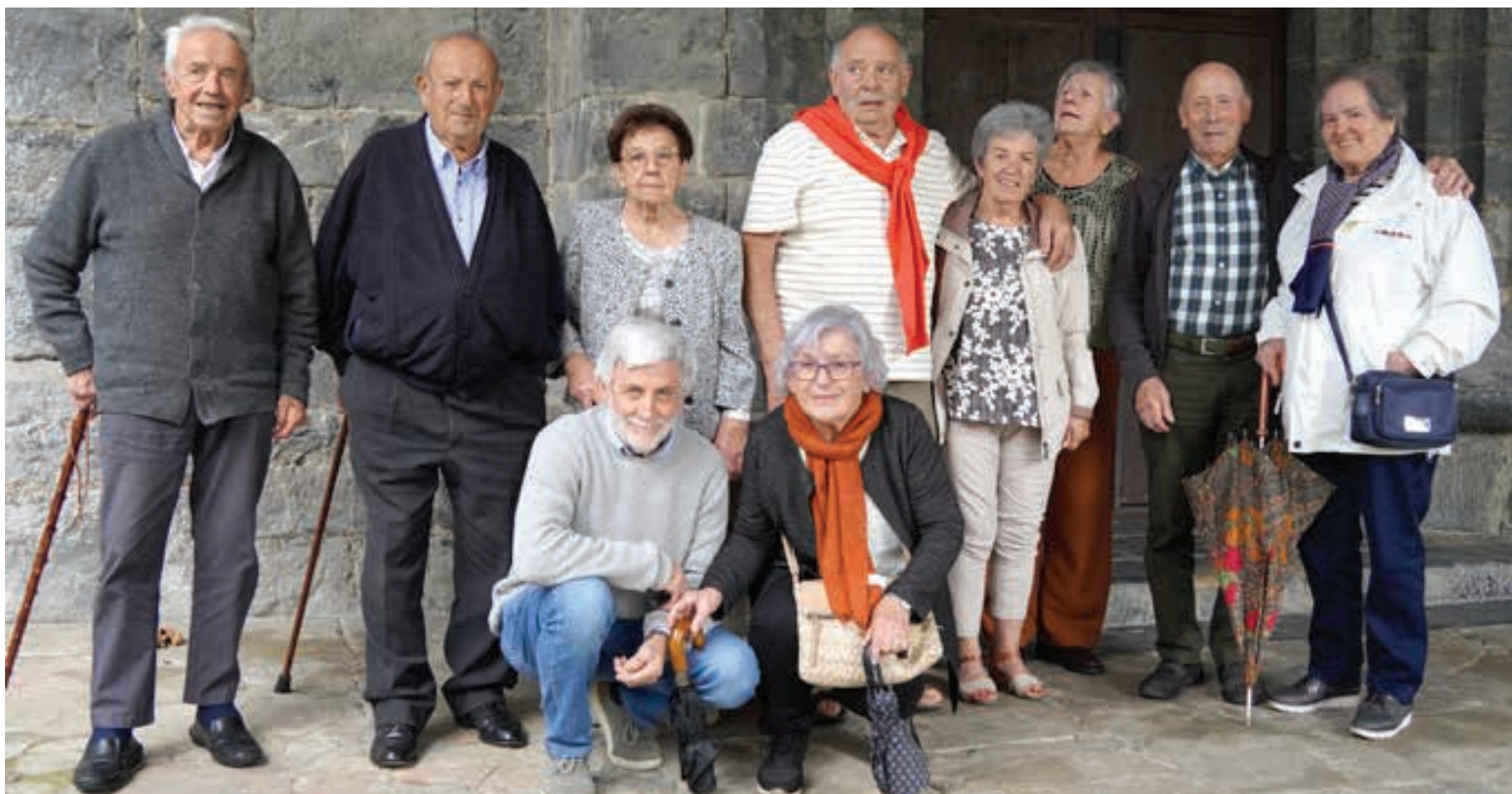
Sorabillan jaio edo bizi diren hainbat bizilagun elkartzeko aitzakia polita izaten da Amabirjinaren eguneko ospakizuna. AIURRI