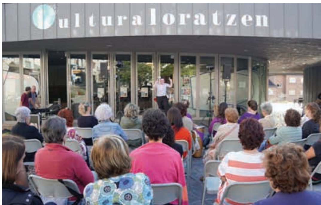
Egizabal aktorea udazken honetako Jabekuntza Eskolaren aurkezpen-ekitaldian.