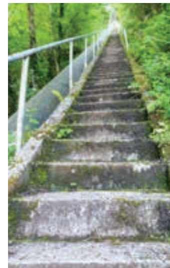
Eskailaratan gora ariko dira. AIURRI

Sortu berria da kluba esan bezala, eta dagoeneko 30 lagunetik gora egin dira bazkide bertan. Gipuzkoako beste edozein