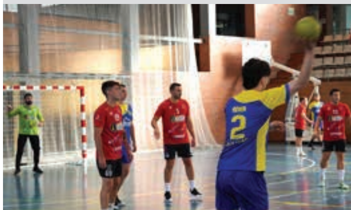
Basauriren aurkakoa izan zen Kopako lehen partida.