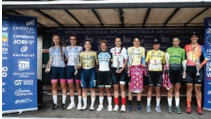
Aitzin-etapako podiuma, ostiral arratsaldean. AJURRI

Galiziarrek eta kanariarrak Gipuzkoako Itzuliaren aitzin-etapan, eta lasterketa osoan, Galiziako eta Tenerifeko txirrindulariak nagusitu ziren. Haietik gertu aritu ziren Euskal Herriko ordezkariak.