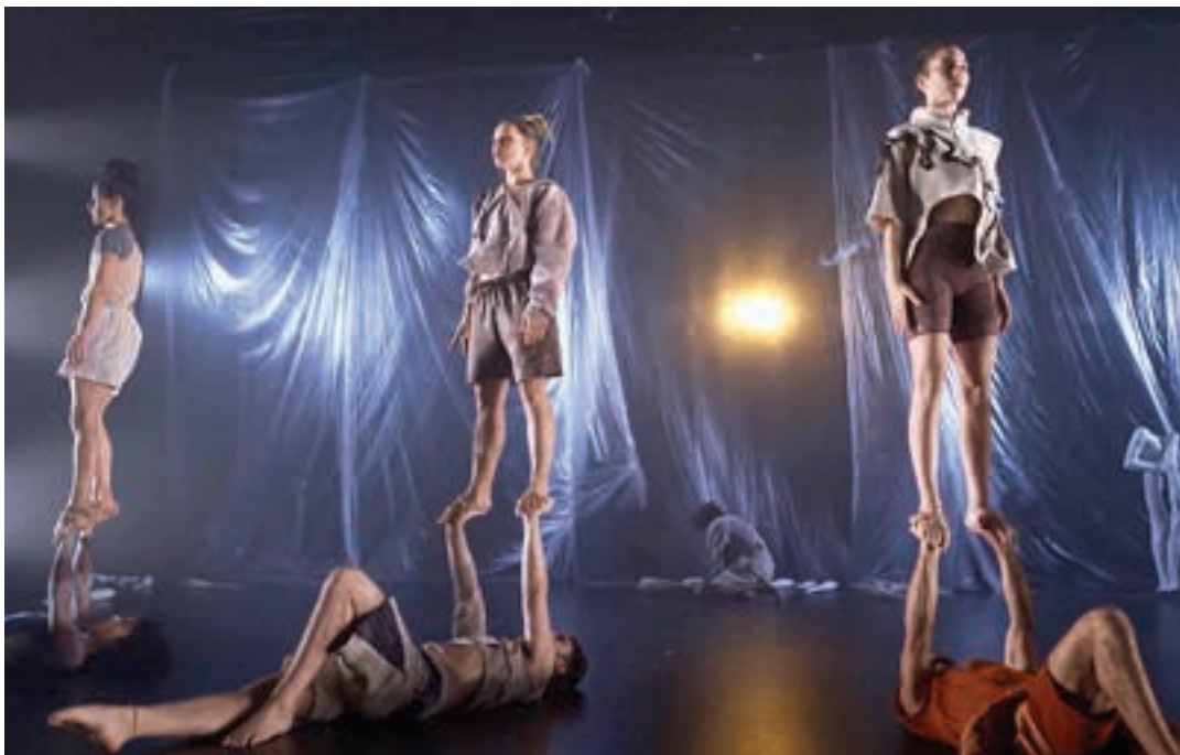
"Sustrai" ikuskizun berriena Andoainera iritsiko da ostiral honetan. AIURRI