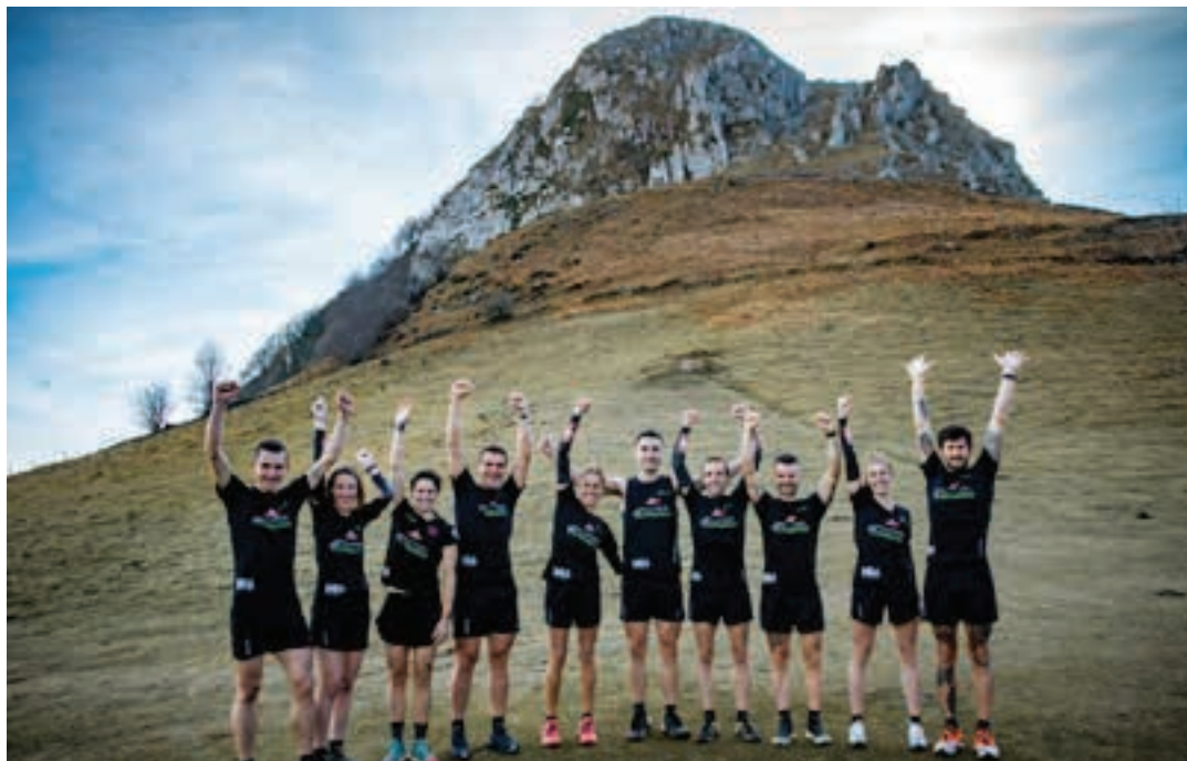
Osin Trail Kirol Klubeko hainbat partaide. Tartean dira Andoaingo lasterkariak. OSIN TRAIL KIROL KLUBA