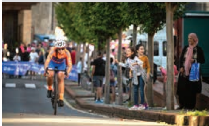
Ibilbide osoan, zaletuak topatu zituzten lasterkariak. AJURRI

Galiziarrek eta kanariarrak Gipuzkoako Itzuliaren aitzin-etapan, eta lasterketa osoan, Galiziako eta Tenerifeko txirrindulariak nagusitu ziren. Haietik gertu aritu ziren Euskal Herriko ordezkariak.