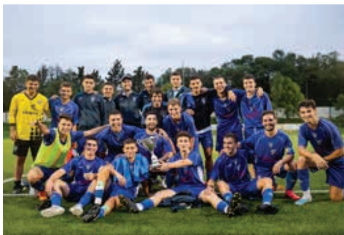
Euskaldunako jokalaria, pozarren, aurtengo koparekin. AIURRI

Kirol mailari dagokionez, Danenaren aurka berdinketa lortu zuen (0-0), eta penaltietan urdinak nagusitu ziren. Andoaindarraren bigarren partidari iritsi