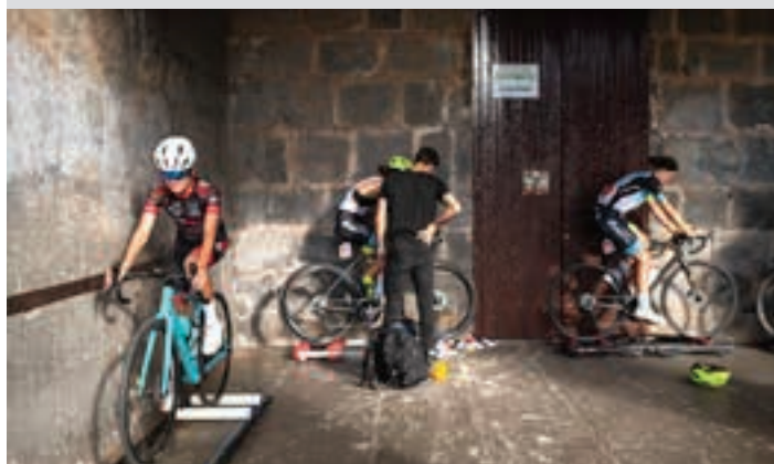
Hainbat partaide arrabola ganean, prestaketa-lanetan. AJURRI

Zaletuen animoak Animoak, autografoak... Urnietako zaletuak, bereziki gazteenak, sutsu agertu ziren. Hain proba zehatz eta teknikoan eskertzekoa da txirrinduzaleen animoak jasotzea. Ez baitzen inondik inora proba erraza izan partaideentzat.