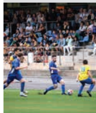
Euskalduna eta Danena.

Dozenaka lagun elkartzeko Ubitarten, larunbat arratsaldean.