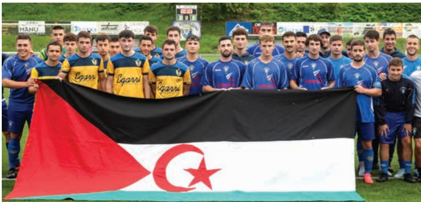
Hurria-Sahara elkarteak aintzat hartu zuen Euskaldunak, aurtengo edizioan. Argazkian, Danena eta Euskaldunako jokalaria Saharako bandera eskuetan dutela.