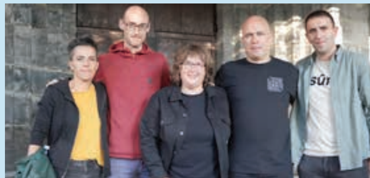
Lujanbio, Arzallus, Elustondo, Mendiluze eta Eskudero. AIURRI

Bertso-sorta zabala, Aiurri.eus webgunean.