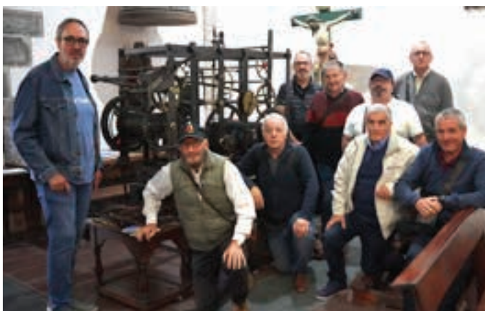
Burdinako kideak eta konpontzaileak, ordulari zaharren ondoan. AIURRI