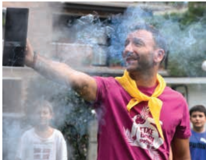
Ostiral arratsaldean abiatuko dira jaiak Urrietako auzoan. AIURRI

ANDOAIN Euskalduna Panticosa-Pico Bacias. Ibilbide luze edo laburra aukeran. Irailak 14-15.