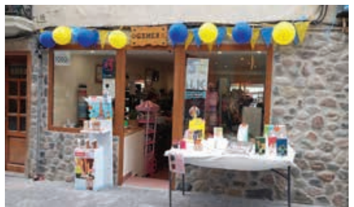
Gamer dendaren erakusleihoa, Kale Nagusian, iazko ekimenean.