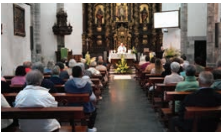
Meza egin zuten Amabirjinaren egunarekin bat eginez. AIURRI