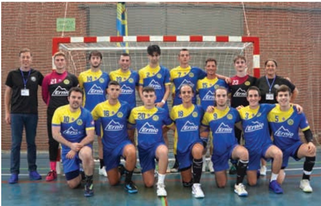
Leizaran Ernio Inmobiliaria taldea, lehiari ekin aurretik. AIURRI