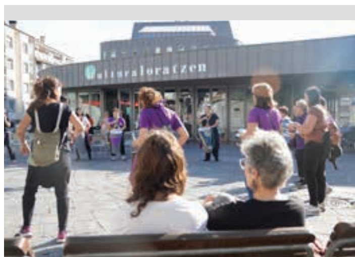
Batukada taldean sartzeko aukera dago. AIURRI