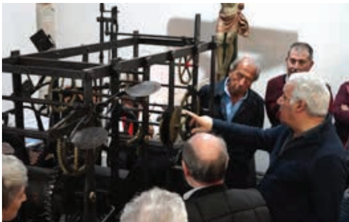
San Martin elizako aitzinako ordularia ezagutzeko aukera izan zen. AIURRI