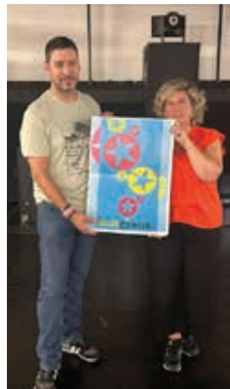
IkusZirkus zikloaren baitan aurkeztu dute "Sustrai". Eta datorren astean 'Mute' ikuskizuna taularatuko dute.