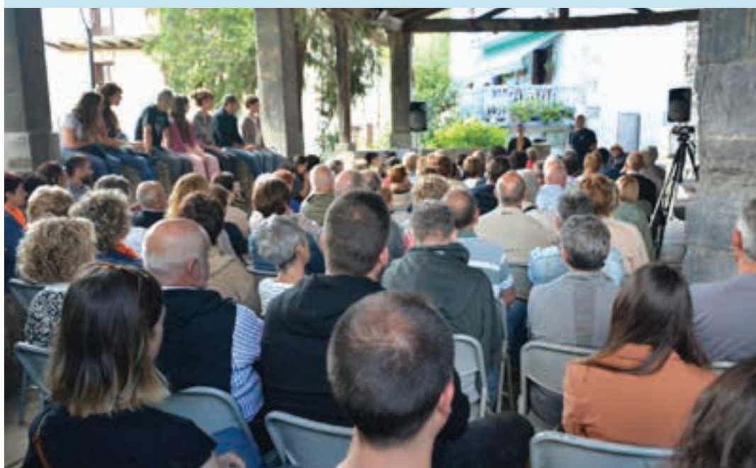
Aspaldiko bertso-saioa berreskuratu zuten Sorabillan, aurreko igandean.