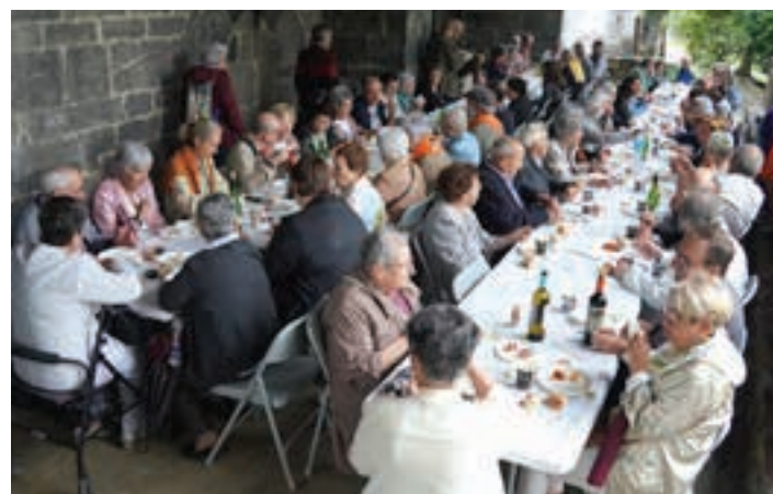
Hamaiketako egin zuten igandean, mezaren ostean. AIURRI

Amabirjinaren eguna ekitaldiz bete zen Sorabilla auzunean. Urteak dira jaiak bertan behera geratu zirela, eta haria erabat eten aurretik, meza eta hamaiketako antolatze ardurari eusten dio lagun talde batek. Aurten, eguna aberatsagoa izan da