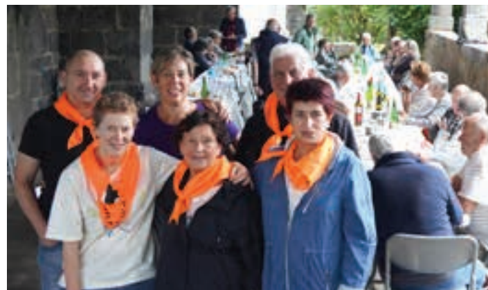
Antolaketa lanetan aritutako lagun-kuadrilla, hamaiketakoan.

Egun osoko makina bat argazki eta bideo, ikusgai dago, nahieran, Aiurriren web gunean.