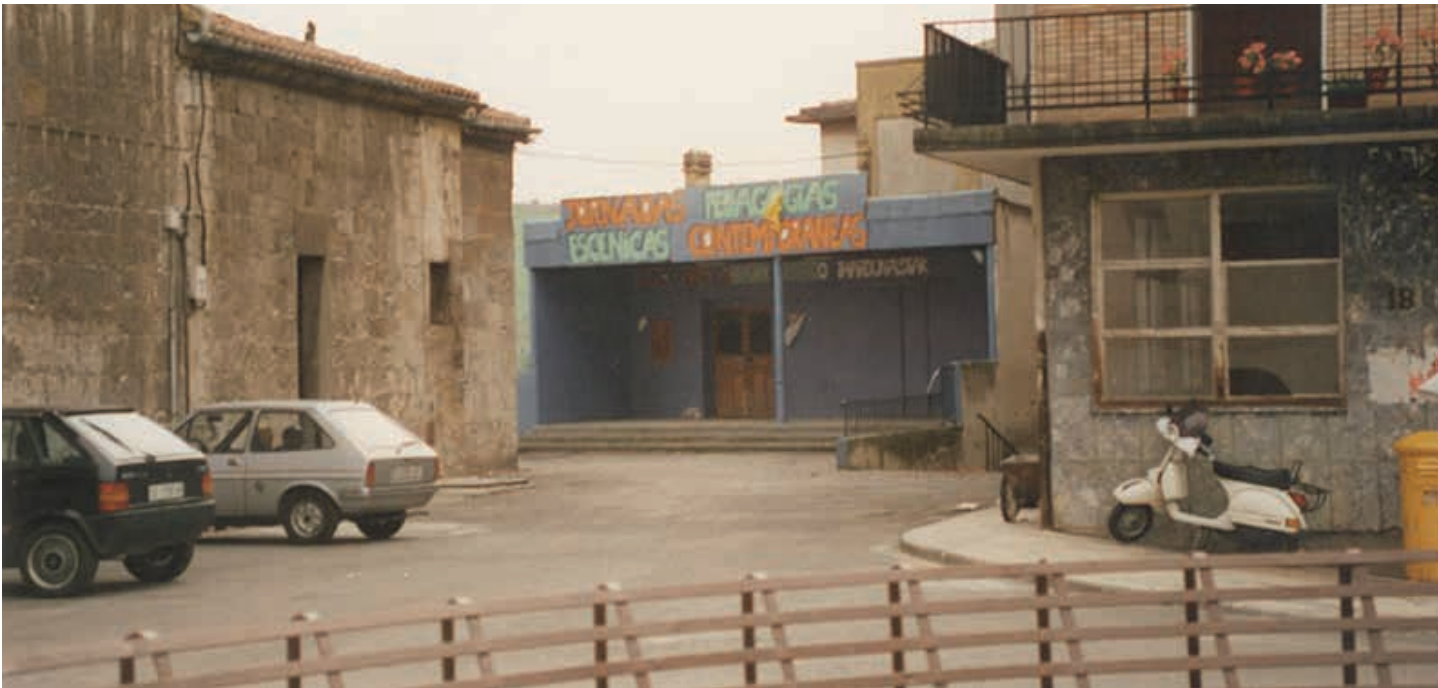
Sarobe eraikina sortu aurreko argazkia, 1990eko hamarkadan. SAROBE