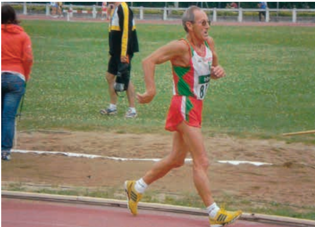
2008ko uztailearen 6an ibilketa-proban (martxa), Euskal Selektzioa ordezkatzuz. ARNAIZ