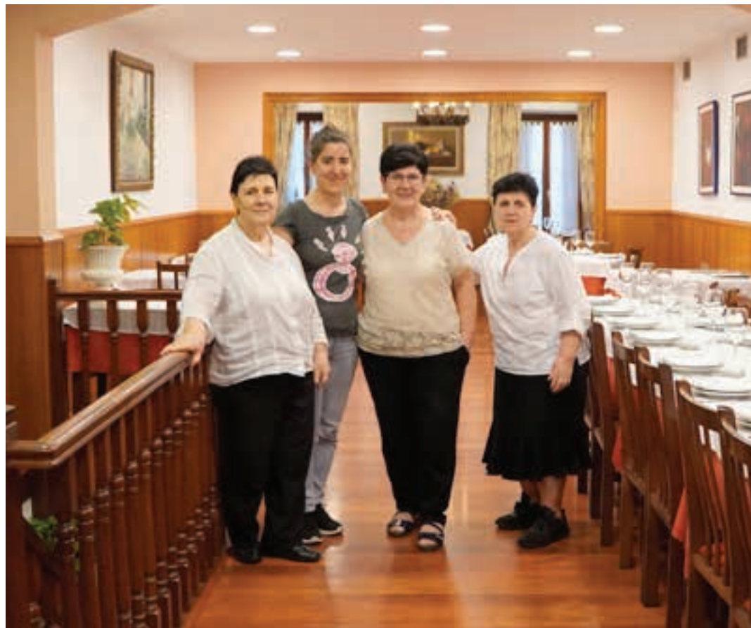
Zaldundegiko protagonistak, goiko jangelan.