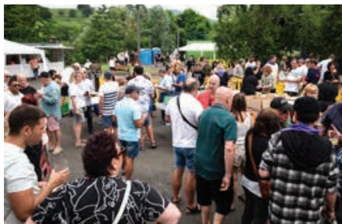
Auzotar ugari hurbildu zen igande goizean sagardo eta pintxo dastaketara. AIURRI