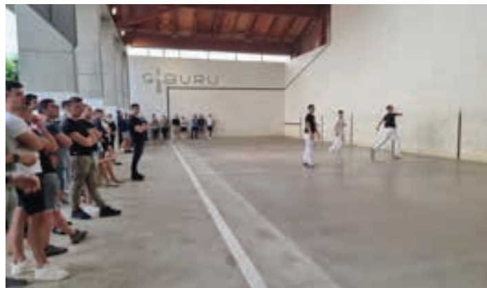
Zaletu asko hurbildu zen Goiburura, igande arratsaldean. AIURRI