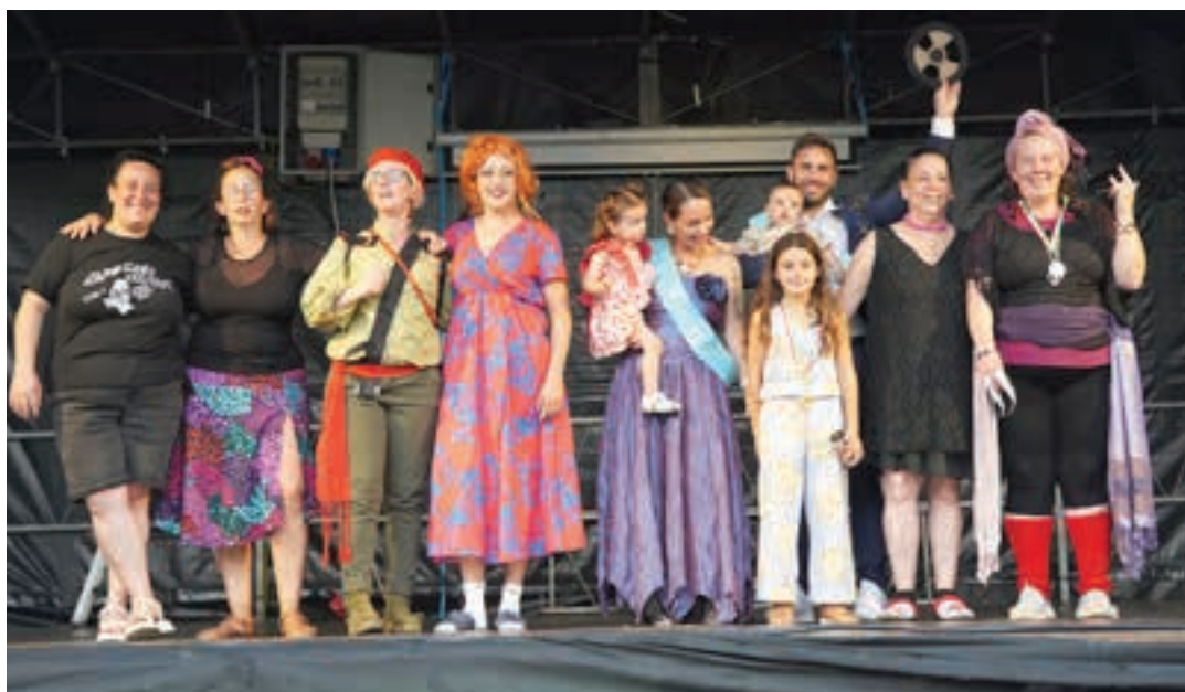
Aurkezleak eta play-back saioko partaideak, taldeko argazkian. Hainbat argazki eta bideo web orrian. AIURRI