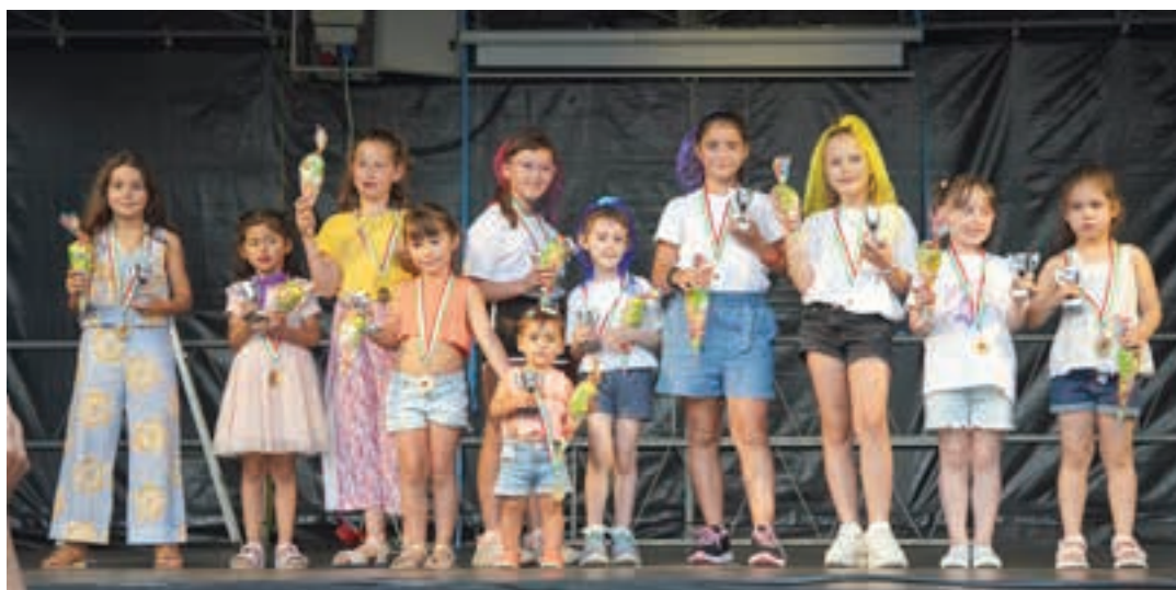
Play-back emanaldian parte hartu zuten haurrak.

sagardo-eta pintxo dastaketara. Eta, iluntzean, play-back saiora. Igande gauez pantaila handi bat jarri zuten taula-gainean eta ez ziren gutxi izan Eurokopako finala bertan ikusi zutenak.