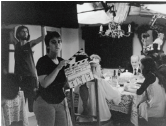
"Merry Christmas" laburmetraia grabatzen.