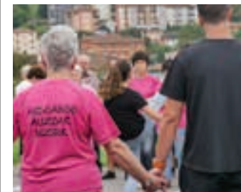
Soka-dantza Buruntzako jaietan. AIURRI