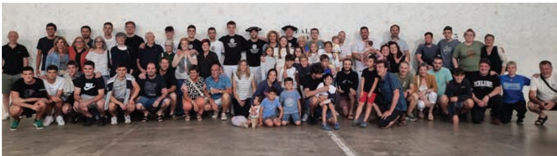
Finalaren ostean ohikoa da taldeko argazki handia ateratzea. Bertan ageri dira, askoren artean, antolatzaileak, pilotariak, lagunak eta zaletuak. Giro ederra sortzen da Goiburuko pilotalekuan. AIURRI