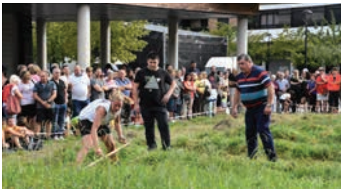
Desafioa Etxeberrietan, artxiboko irudian. AIURRI