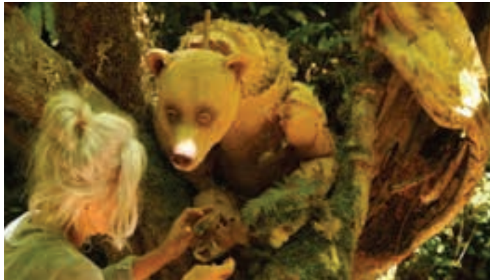
Adin-tarte guztiei eskainitako ikuskizuna da. PANTA RHEI

HARREMANETARAKO: Tel.: 943 300 732 / andoain@aiurri.eus