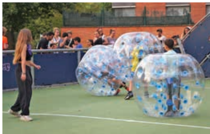
Bubble edo puxika handietan aritu ziren futboleak, asteburuan. AIURRI