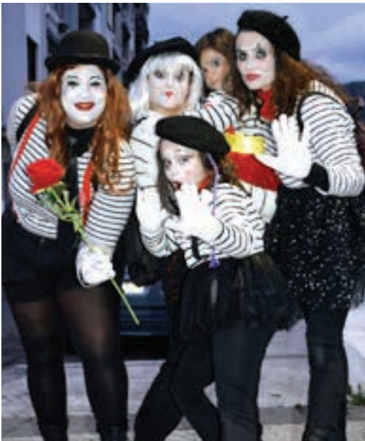
Mimoa, magia... Zirkoaren hainbat mozerro agertu ziren. AIURRI