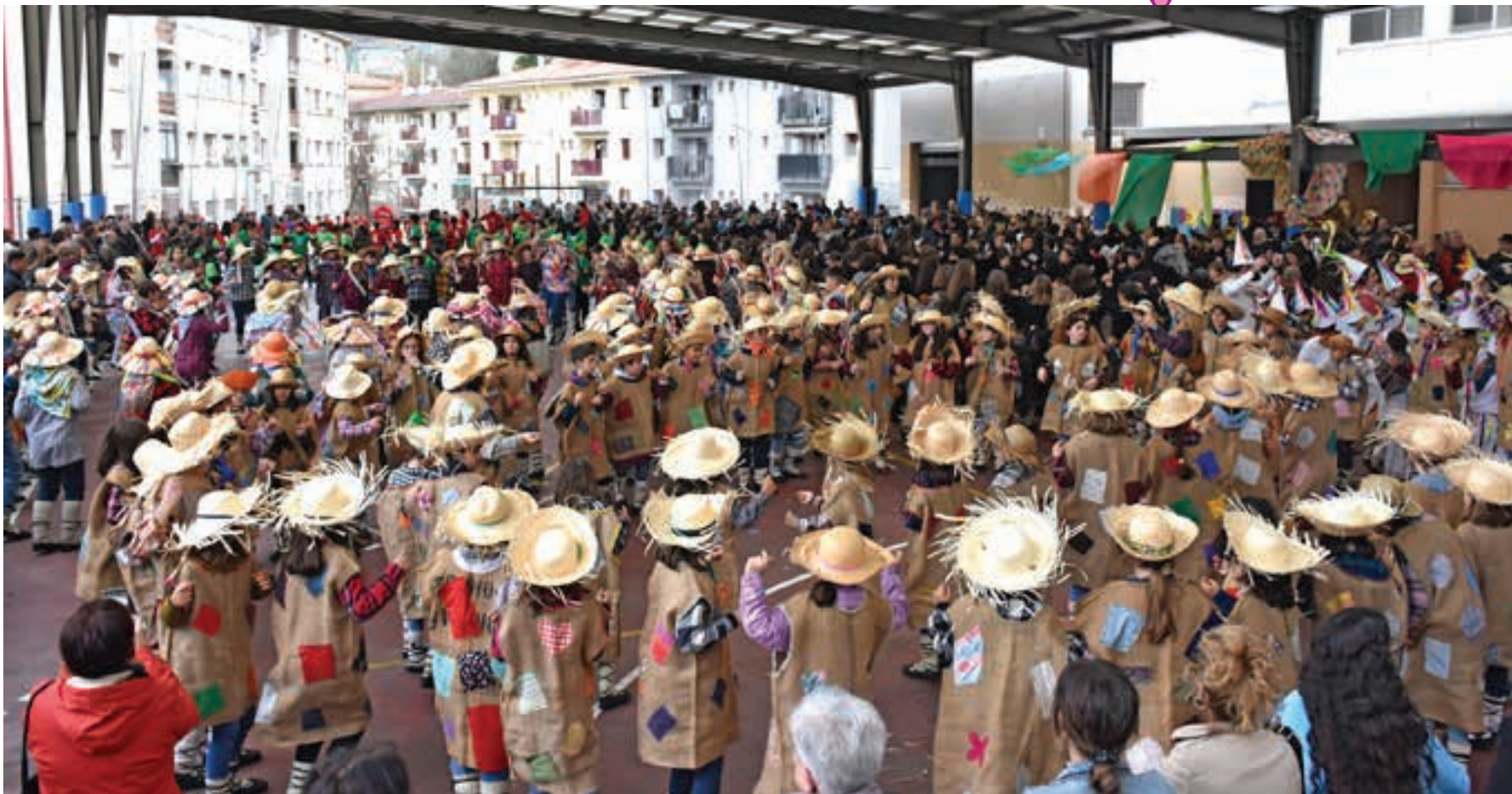
Ondarreta Herri Eskolako jolastoki estalian egin zuten Ostegun Gizeneko ospakizun nagusia. AIURRI