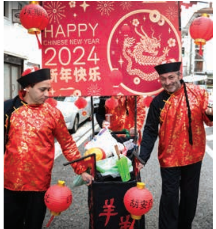
Txinako ospakizunak gogoko dituzte urnietarrek, larunbatean ikusitakoaren arabera.