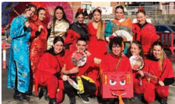
Txinatar ospakizun bat baino gehiago ikus zitekeen Urnietako Inauterietan. AIURRI

Txina, Irlanda, Italia, Mexiko, Sevilla, Eskozia... Askotariko herrialdeetako jaien topaleku izan zen Urnieta, joan den aste-buruan. Ohiturari jarraiki, makina bat gazte hurbildu zen Poxta Zahar elkarteak antolatutako egitarauera. Eguerdiko 12:00etan hasi zuten jaiak, taberna batetik besterako poteoarekin. Ondoren, Plazido Muxikan, bazkari herrikoa egin zuten eta Kitadelpare txarangaren laguntzaz eman zioten jarraipena, arratsaldean, Inauteri festari.