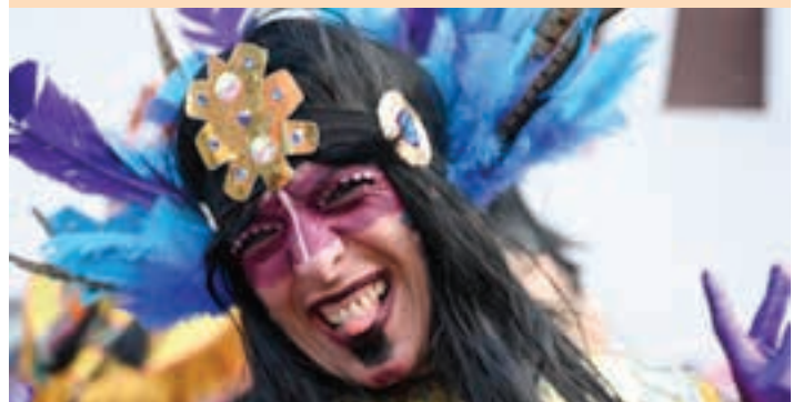
Inauterizale amorratu ugari bizi da Andoainen. AIURRI