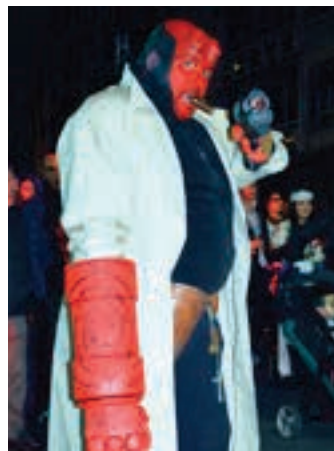
Hellboy heroia ilunabarrean. AIURRI