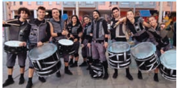
Bartzelonatik zuzenean iritsi ziren Brincadeira taldekoak. AIURRI