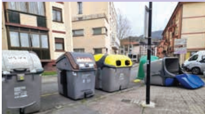
Edukiontzia lurrera bota zituen haizearen indarrak. AIURRI