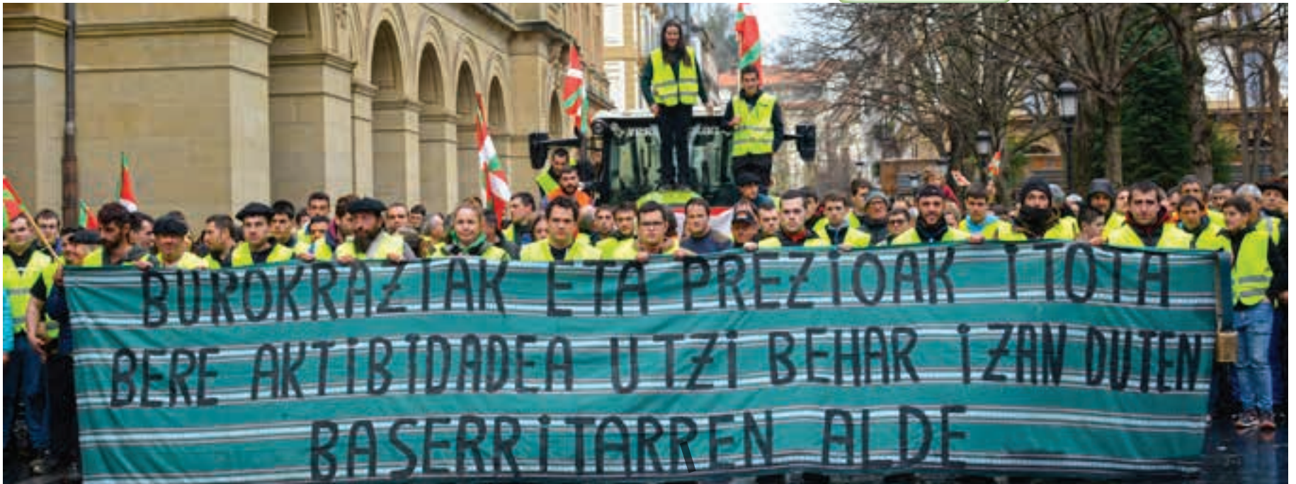
Andoaingo, Urrietako eta Aiztondo bailarako gazte ugari ageri da argazkian, Gipuzkoa plazan.