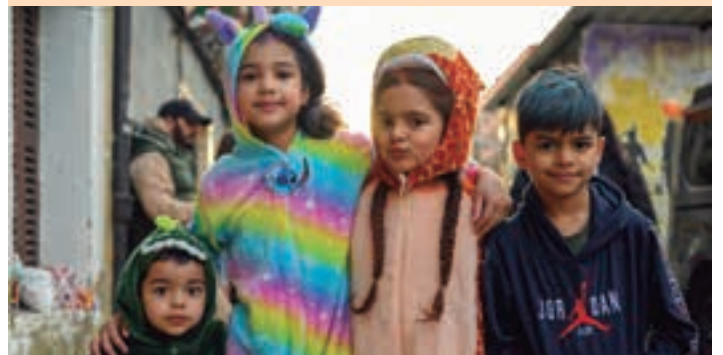
Etxeberrietako auzotarrak mozerro-desfilearen hasieran. AIURRI