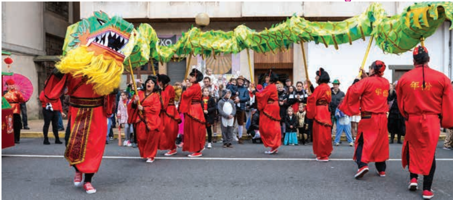
Txinatar ospakizuna Urnietara iritsi zen Los Vintages taldearen eskutik. AIURRI