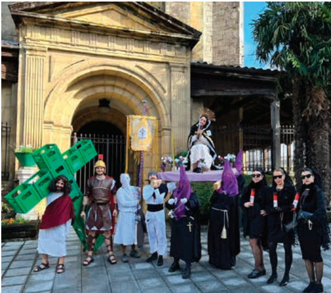
Garizuma bitarteko berrogei egun geratzen dira, Inauteriak amaitu berritan. Aste Santura bidaia egitea zen argazkiko kuadrillari begira jartzea. AIURRI