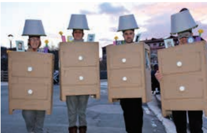
Larunbata, mesanotxeak kalera irten zirenekoa. AIURRI