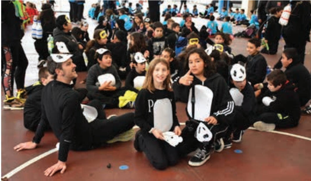
Ondarreta Herri Eskolako ikasleak jolastoki estalian, ostegun arratsaldeko ikuskizunean.