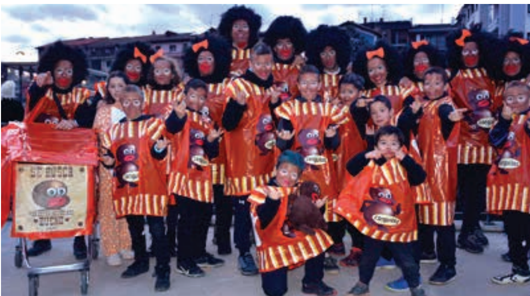
Familia giroan kuadrilla asko irten zen, aurreko larunbatean. AIURRI