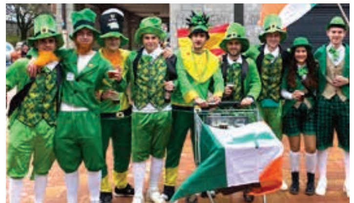
Irlandar ospakizuna, Saint Patrick's delakoa, Urnietako kaleetara ekarri zuten.