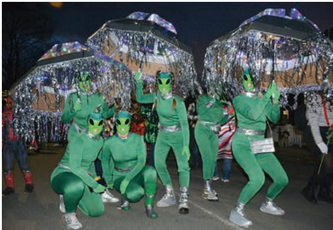
Extralurtarrak goizetik nabarmendu ziren. Iluntzean, Kaleberrian gora dizdira egiten zuten euren espaziontziek. AIURRI