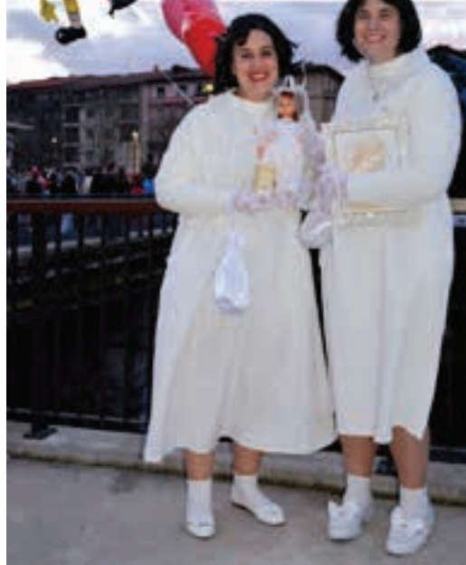
Lehen jaunartzea biziberritu zutenak ere baziren. AIURRI