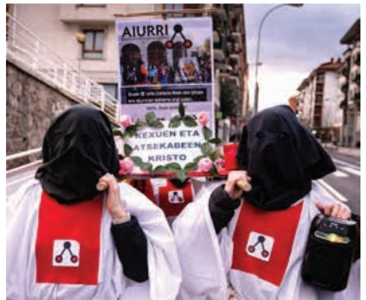
Aiurriren aldeko peregrinazioa, Idiazabal kalean. 2011ko Inauteriak biziberritu zuten bertan ageri zen QR kodean sartu zirenek. Orduan eta egun, Aiurri ezinbestekoa izaten jarraitzen duela adierazi zuten. AIURRI