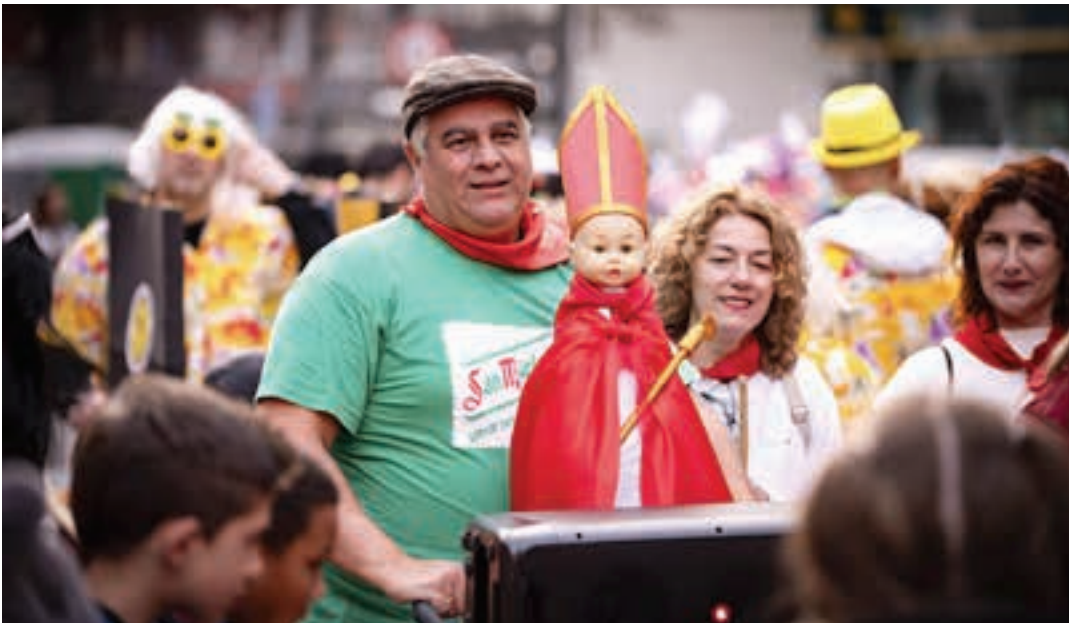
Uztaileko klasikoak Tourra eta Sanferminak dira. Udan igaro zen Tourra Urnietatik. Larunbatean, berriz, Iruñeko entzierroa. AIURRI