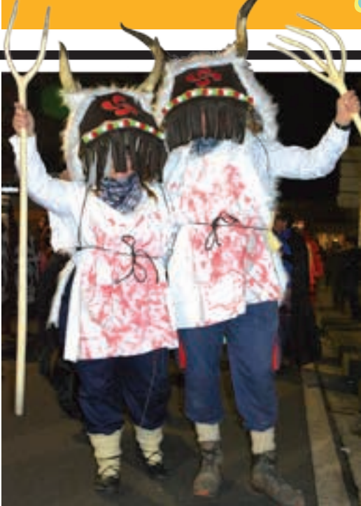
Euskal Inauteriak plazaratu zituen, hainbatek. AIURRI