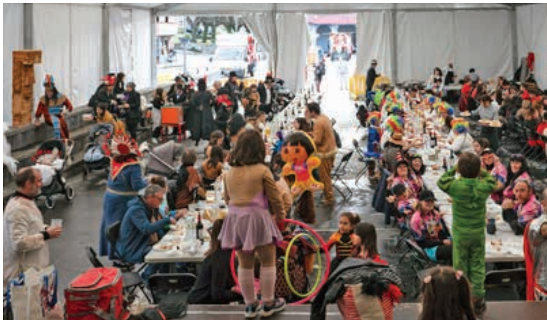
Igande eguerdian, Inauteriak jarraipena izan zuen Andoainen. Argazkian, Goikoplazako karpan antolatutako herri-bazkaria.