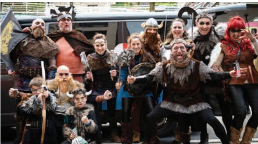
Bikingoen agerpena nabarmena izan da, aurten, Andoaingo eta Urnietako Inauterietan. AIURRI