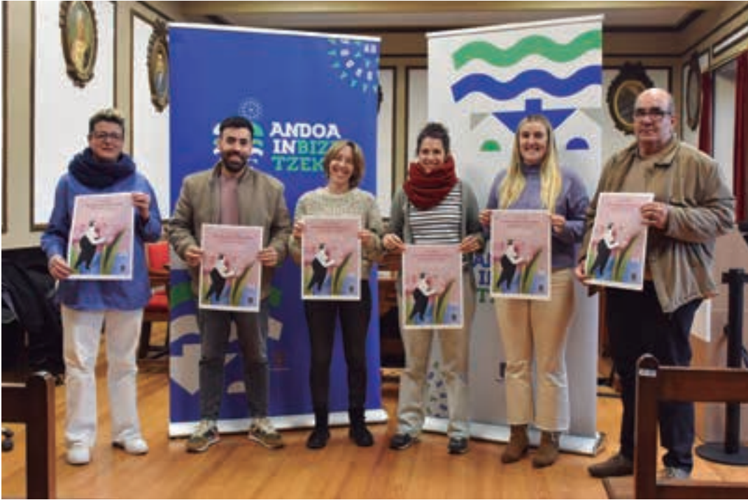
Udaberriko Jabekuntza Eskola aurkeztu zuten aste hasieran, Andoaingo Udaletxean. AIURRI