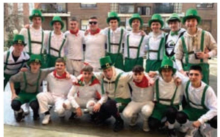
Garagardozeleak eta entzierozeleak Urnietan elkartu ziren. AIURRI