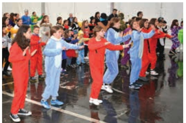
Larunbat goizean ekitaldia antolatu zuen Izartxo Aisialdi Taldeak.