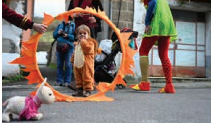
Zorionez, Inauterietako desfilea bere horretan egin zen. AIURRI