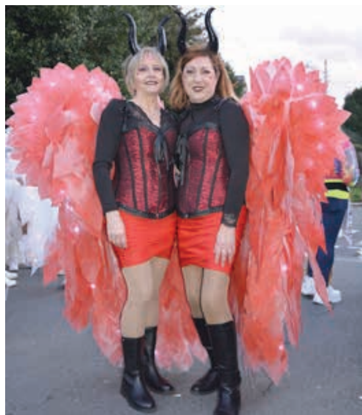
Zumbalokurak koreografia landua aurkeztu zuen, beste behin ere. AIURRI