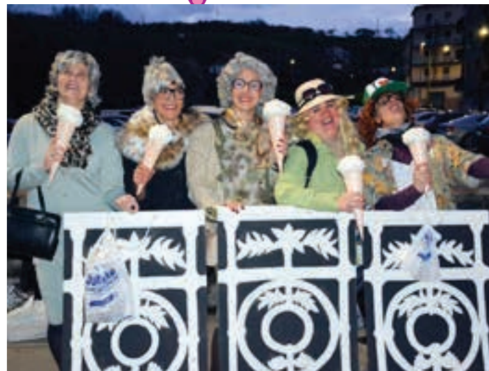
Santa Krutz zubiko armiarma-sarea hizpide izan zuten, iaz. Aurten, Donostiako postal parekaezina irudikatu zuten. AIURRI