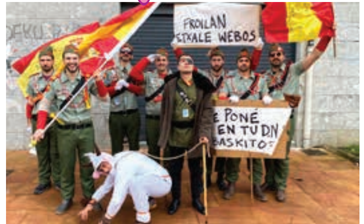
Satira eta kritika behar-beharrezkoak dira Inauterietan. AIURRI