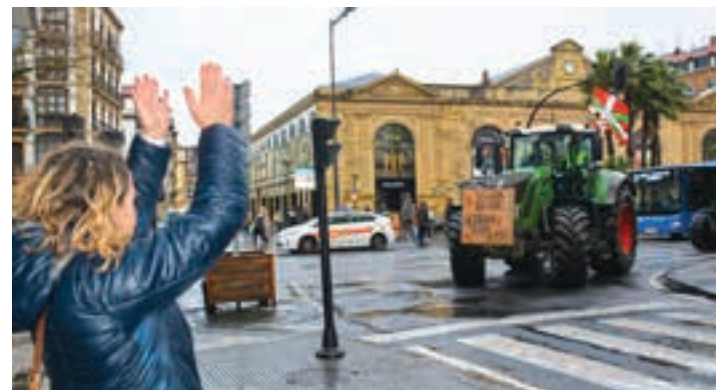
Donostian nekazariak kalekoen babes zabala jaso zuten.

dian, azokatan ez", "Esne eta haragi sintetikorik ez"... Donostian irakurri zuten agirian, "gizartea osatzen duten" hainbat eragile hartu zituzten jomugan: kontsumitzaileak, supermerkatuak, udalak, nekazarien sindikatuek, Gipuzkoako Aldundia, Espainiako Gobernu eta Europar Batasuna. Guztiei oso eskakizun zehatzak zuzendu zizkieten. Kontsumitzaileei saltoki handietan erosten dituzten jakiak nondik datozen begira dezatela. Saltoki handiei bertako produk-