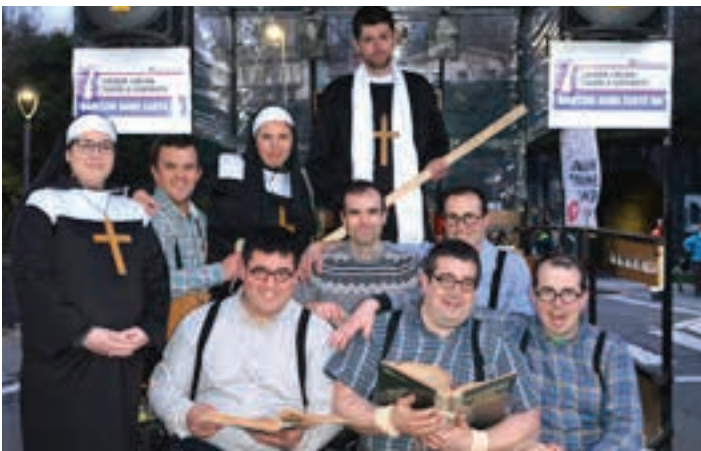
Garai bateko hezkuntza eredu bertikala eta euskararen aurkakoa irudikatu zuten.