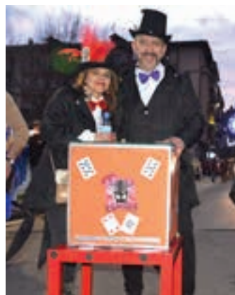
Magia saioa bikain irudikatu zuten. AIURRI