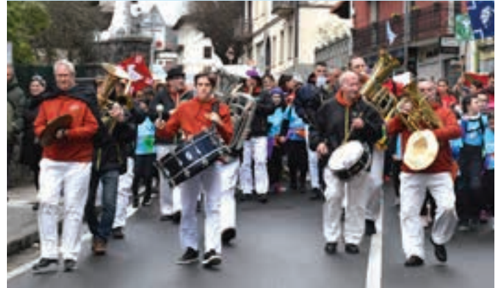
Gora Kaletxiki txarangak girotu zuen Inauteriaren hasiera. AIURRI