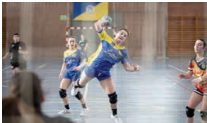
Leizaran Lanbroa taldeko jokalaria, aurreko larunbatean.