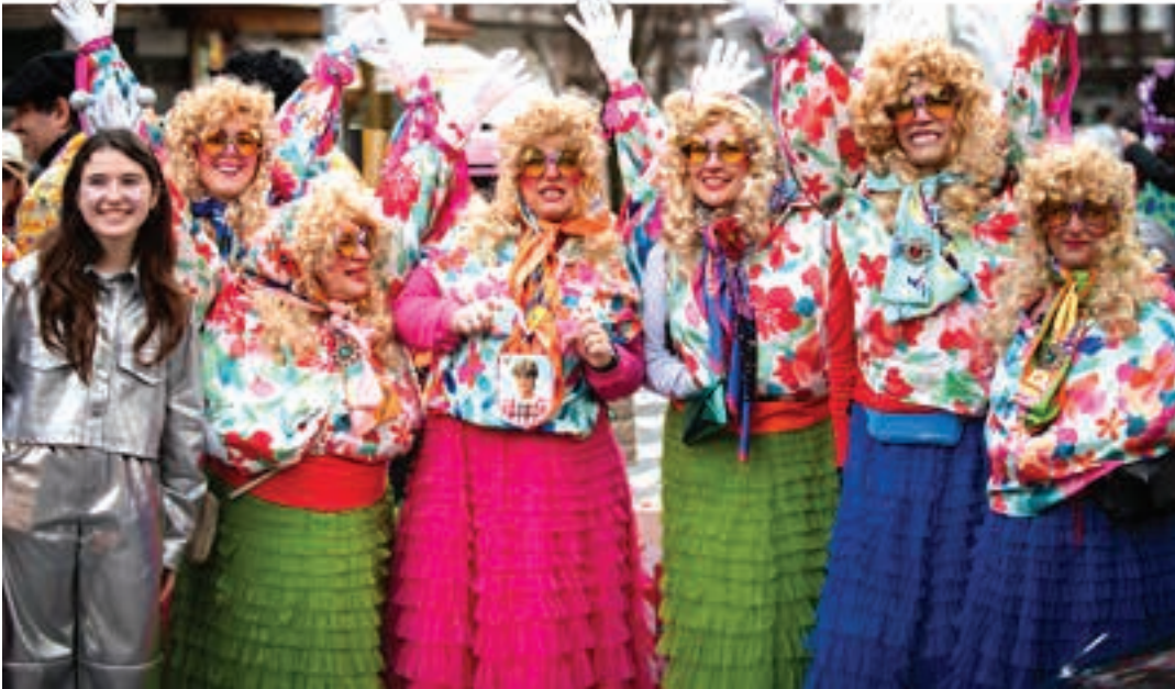
Bilboko jaien ikur nagusia da Mari Jaia. Mielaren herrira hurbildu zen pertsonaia ezaguna, aurreko asteburuan.