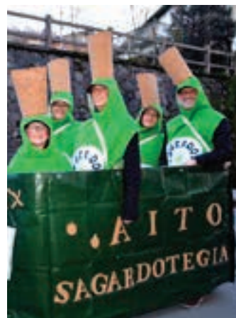
Irudimena landuz, gauza ederrak egin daitezke. AIURRI

grafia lantzea meritu handiko lan bikoitza da. Beste aldetik, bere kabuz mozorrotzen diren norbanakoak eta talde txikiak aipagarriak dira. Asko eta asko irudimen handikoak, gainera. Denek ere larunbat iluntzean bat egin zuten, Goikoplaza aldean. Mozorro, kolore eta soinu nahasketak horrek ez du parekorik. Indar handiko ospakizuna da, finean, larunbatekoa.