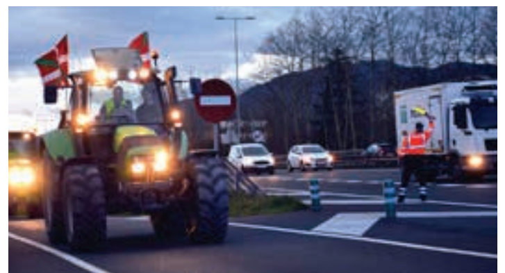
Ubilluts industriagunetik N1 errepidean murgildu ziren, Sorabilla auzoan. AIURRI

tuen salmenta susta dezatela eta ekoizpen kostuen gainetik ordain dezatela. Udalei turismoa lehen sektorearen gainetik ez jartzeaz gain, arindu dezatela burokrazia. Gipuzkoako Foru Aldundiari, berriz, baserritarren eskaerak "goiko karguen aurrean defendatzen" jarrai dezaten, batetik, eta bestetik, administrazioko tramiteetan lagun diezaieten.