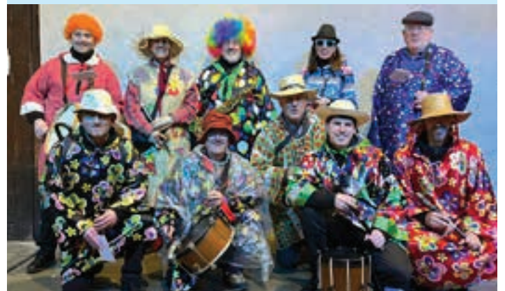
Andoaingo Olagain Udal Txistulari Elkarte, ostegun iluntzean.