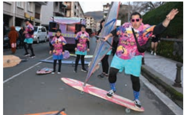
Kaleberria, olatuak hartzeko surf eremu bilakatu zuten Kolokaitos-ekoek.