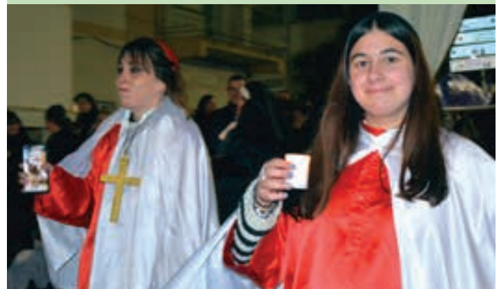
Azken bi urteetan Sardinaren ehorzketa biziberritu dute, Andoainen.

Lutoz jantzita eta kandelak eskuan, hamaika herrikidek parte hartu zuen, igande iluntzean, Lupercales taldeak antolatuta. Sardinaren atzetik, eta Joselontxos txarangak alaituta, segizioa Zumea plazatik igaro ostean, Goikoplazaraino heldu zen. Ehorzketako kide batzuek udaletxeko balkoitik mintzaldia eskaini zieten bertaratutakoei, euskaraz eta gaztelaniaz. Gai ugari jorratu zituzten, hitzartzean: hala nola, Andoaingo Udala, alkatea, zinegotziak eta klase politikoa, Basteroko eserleku deserosoak, astelehen goizean goiz jaiki eta lanera joan beharra, bizitzaren garestitzea... Garai batean Madrilgo komunitateko presidente izandakoari keinu eginez, "Cifuentes esku zuriko sardin lapurra" erre eta ehortzi zuten. 2023an berreskuratu zuten, Andoainen Sardinaren ehorzketa. Indartsu biziberritu da. Argazki-bilduma eta bideoa, ikusgai aiurri.eus webgunean.