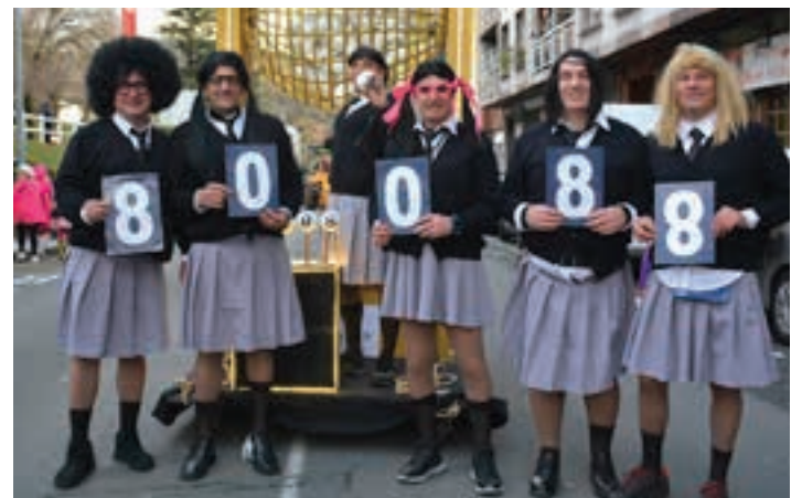
Gabonetako Loteria irudikatu zuen Andoaingo kuadrilla batek.

Txaranga hotsak erabat urrundu aurretik, egindakoaz hausnartzeko garaia da. Datorren astelehenean, otsailak 19, Inauterien osteko balorazio-bilerara deitu du Andoaingo Udalak. 19:00tan hasiko da Bastero kulturguneko ekitaldi aretoan.