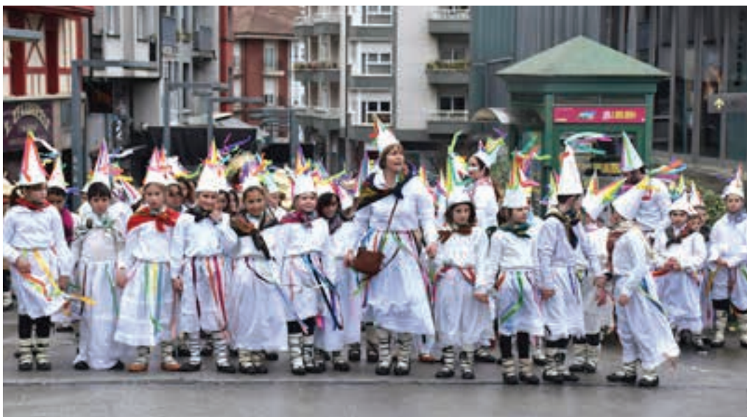
Aita Larramendi ikastolako ikasleek herri inauteriak irudikatzen dituzte. Argazkian, Kale Nagusian gora. AIURRI