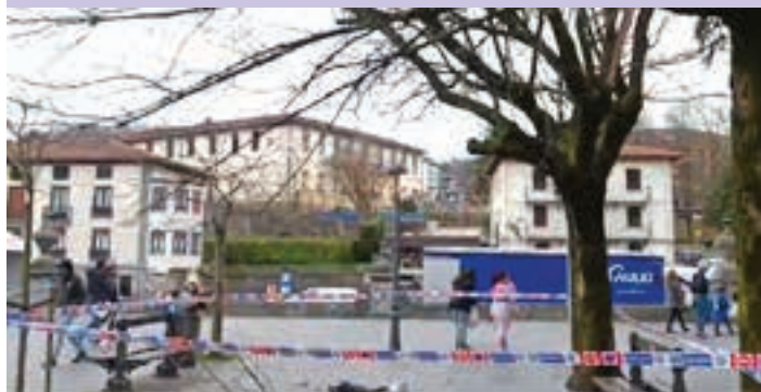
Goikoplazan, bazkalostean, haizeak zuhaitz adarra bota zuen. AIURRI