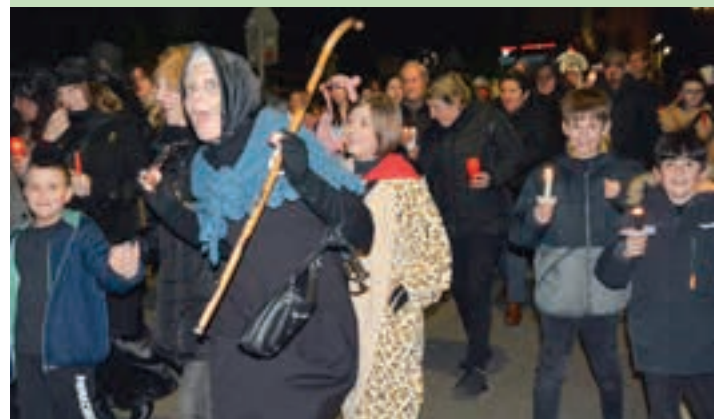
Lagun ugari elkartu zen mozarrotuta, igande iluntzean. AIURRI