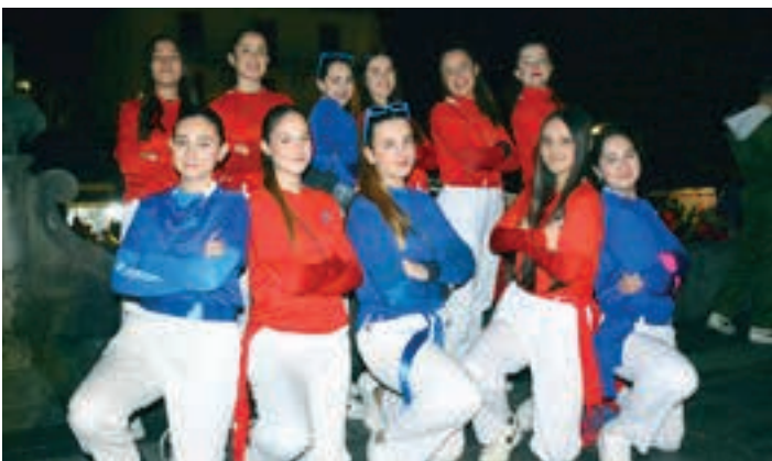
Pilotari profesionalen pare agertu zen gazte kuadrilla. AIURRI