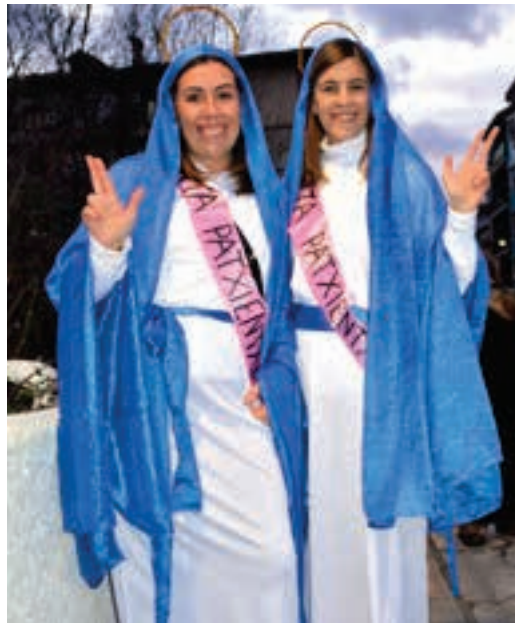
Erlijoari lotutako mozerrok ez ziren gutxi izan. AIURRI