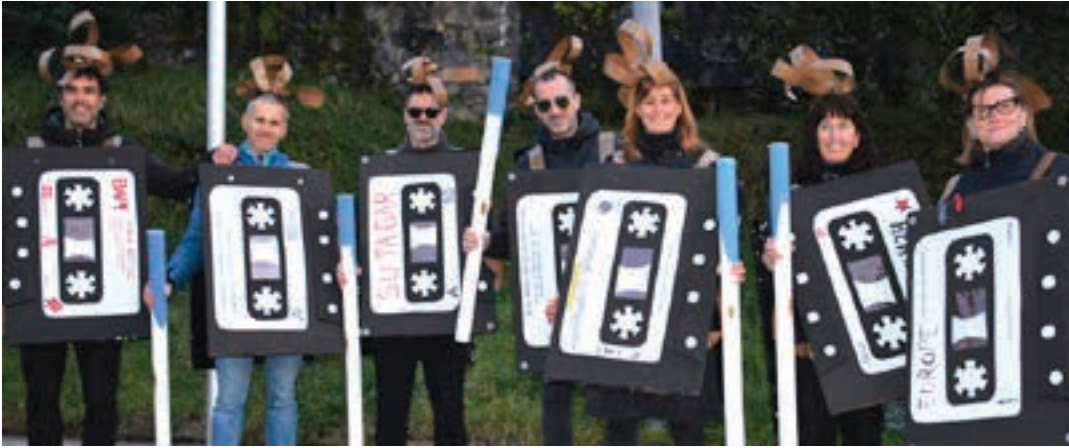
Radiokaseta eta bic boligrafoa XX. mendeko ikonoak, gaurko gazte askori ezezaguna zaiena. AIURRI