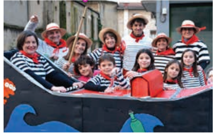
Veneziako gondola eta gondolariak, larunbat arratsaldeko kalejiran. AIURRI