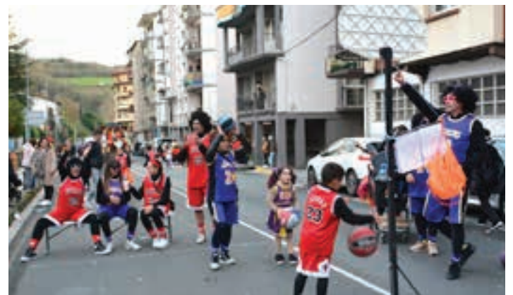
NBA liga ezaguneko kirolariek hainbat partida jokatu zituzten, Andoaainen. AIURRI