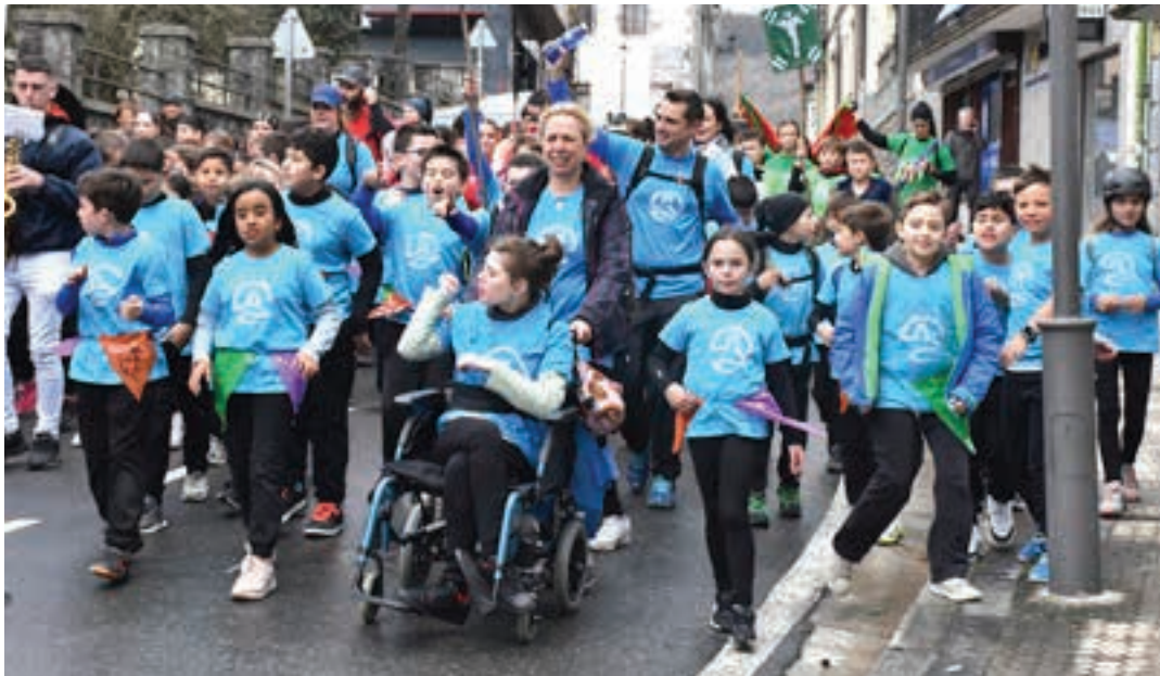
La Salle Berrope ikastetxeko ikasleak, Kale Nagusian behera.