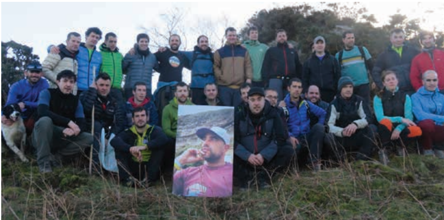
Laguntaldeak mendiaren haren omenezko plaka ipini du. AIURRI