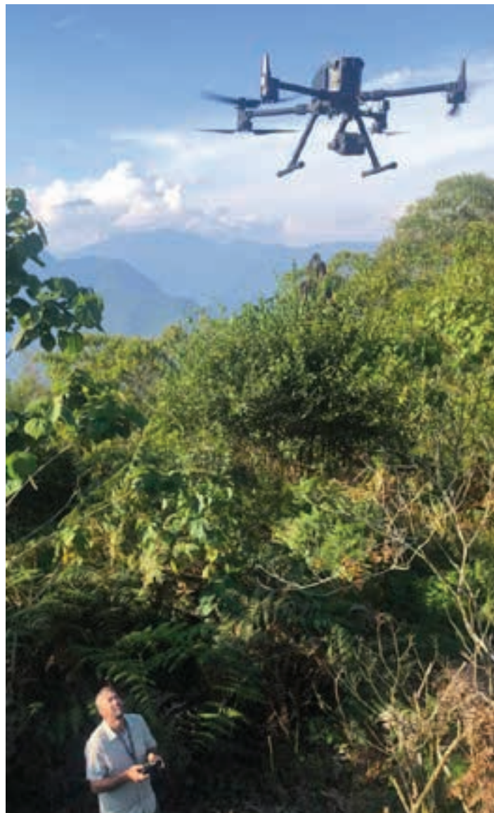
Lan profesionalak eta pertsonalak garatu ditu bikoteak, droneekin.