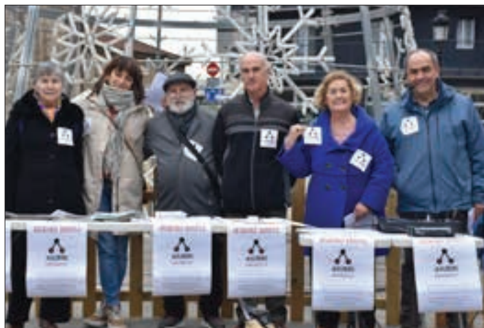
Argazkia aurreko igandekoa da. Datorren asteburuan jarraituko du ekimenak.