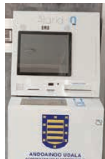
Anbrosia Olabide eraikinean, eguneko zentroaren kanpoaldean jarri dute makina.

Erabilera erakusteko laguntzaile bat izango da, astelehenetik ostiralera, 10:00etatik 12:00etara