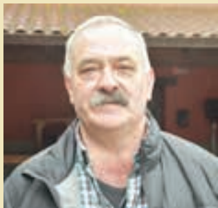
JUANJO URRUZOLA ELUTXETA SAGARDOTEGIA

"Aurkezpen-ekitaldi polita egin dugu, eta sagardo berriaren xehetasun asko eman ditugu. Sagardotegian gozo-goza egon gaitzke, liskarrik izan gabe. Ondo pasatzeko gunea da. Gure atek zabalik daude"