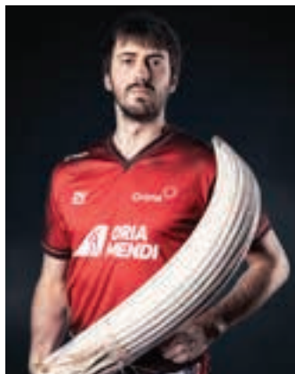
Barrenetxea IV. ORIAMENDI