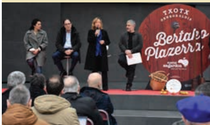
Erakundeetako ordezkariak, irekiera-ekitaldian.