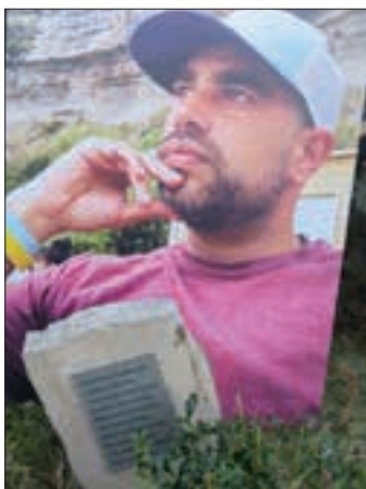
Mendian jarritako oroigarria, eta atzean haren afitxa. AIURRI