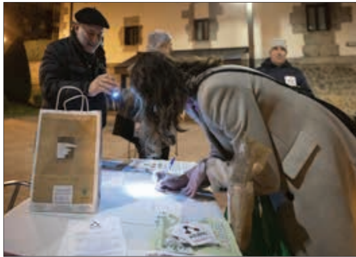
Ostiral iluntzean, urtarrilak 12, abiatu zen ekimena. AIURRI

Dagoeneko hemeretzi dira babesa eman duten taldeak: Aballarri guraso elkarteak, AEK, Aurrera Markelekin, Bagara feministak, Bertso eskola, Egape Dantza Taldea, Elkartasun Ekimena, Etxeberri auzo elkarteak, Inñistorra Euskaltzaleak, Manttala, Onbizi, Poxta Zahar, Sorginak, SurperH, Txanbolin, UKE, Urnietako Mugimendu Sozialista, Xoxokako auzo elkarteak eta Zanpatuz mendiko taldea.