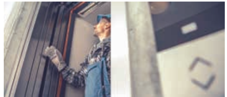
Igogailuen mantentze-lanak egiten ditu Bertako enpresak. BERTAKO

Enpresa euskalduna eta euskaltzalea da Bertako. Ahalik eta zerbitzu gehienak euskaraz eskaintzen ditu. "Edozelan ere, onartzen dugu gure teknikari guztiak ez direla euskal hiztunak; batzuk badira; beste batzuk ez. Baina euskararekin konprometituta gaude eta ahal dugun zerbitzu gehienak euskaraz eskaintzen ditugu. Adibide bat jartzearen, Tuteran aurrekontuak