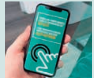
Bertako aplikazioa. BERTAKO