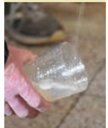
Sagardoa prest da. AIURRI

"Sagardoa aurtan oso ona dago. Itxaropen ona dugu, sektorean. Gurean, Aburuzan, jendea erreserbak egiteko deika ari da eta ilusio handiz gaude. Sagardoa probatzera hurbiltzeko gonbidea luzatu nahi diet, denei".