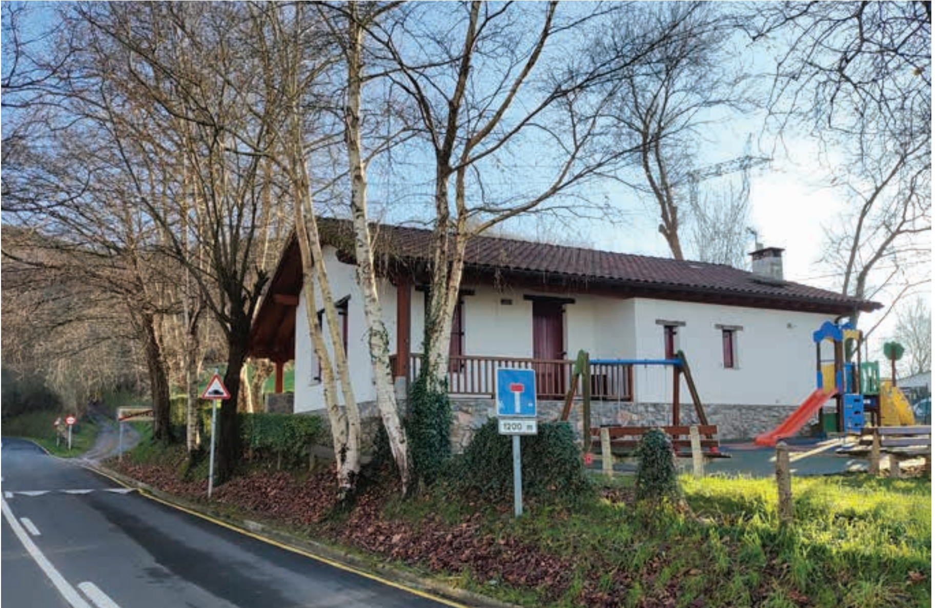
Goiburu-Xoxokako eskolan egin zituzten Urnietako biktimekin izandako bilera gehienak. Mintzatzeko "espazio eroso eta goxoa" topatu nahi izan zuten ekimenaren sustatzaileek. AIURRI