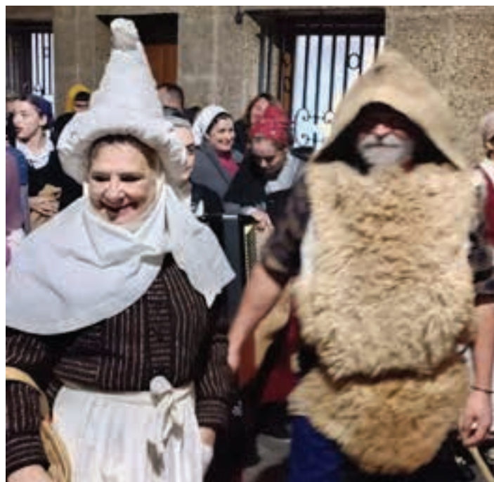
Mari Domingi eta Olentzero, Kale Nagusian.