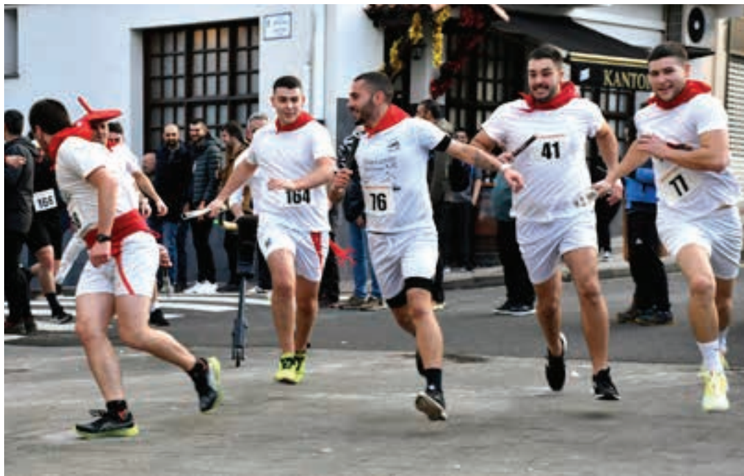
Aiurri astekaria eskuan, Sanferminetako entzierroa irudikatu zuen lasterkari-taldeak. Mozorro onenagatik saria jaso zuten.