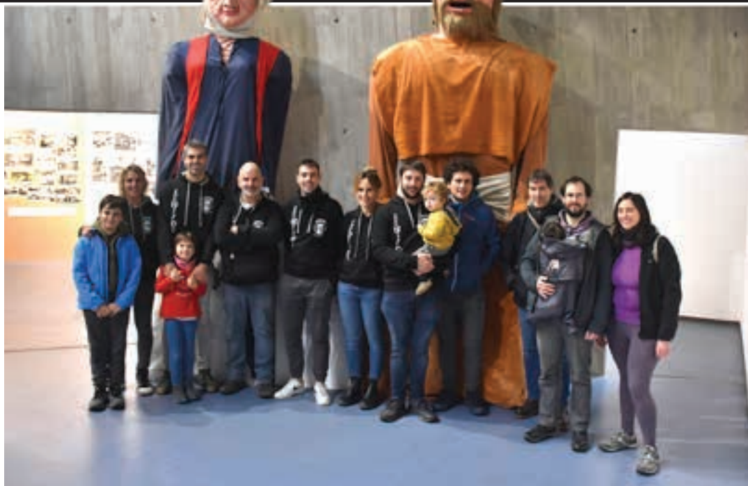
Aspaldiko erraldoiak berreskuratu zituen Lebiton konpartsak eta ikusgai jarri zituen Basteron. AIURRI