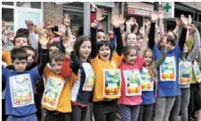
KORRIKA euskararen aldeko hitzordu nagusia izango da 2024an. AIURRI

Antzezlaren sinopsia honako hau da: 1957 urtea. Mosku. Gerra Hotza eta espaziozko lasterketa. Laika txakurtxoak nola edo hala bizirauten du hiri izoztuan. Ez daki bere zoriak espazioraino eramango duela Sputnik 2.aren barruan; eta gizateariaren historiara pasako dela Lurraren inguruan orbitan ibilitako lehen izaki bizidun legez.