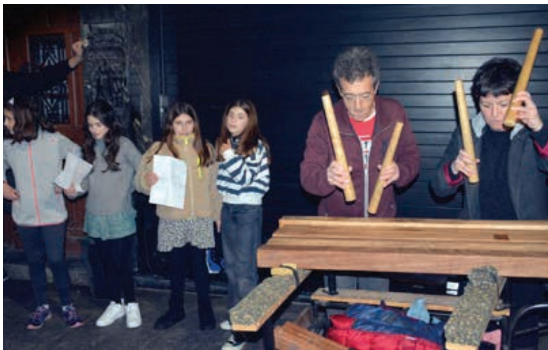
Bertsozale gazteak Maizorriko kideen ondoan, Gabonetako bertso-poteoan. AIURRI