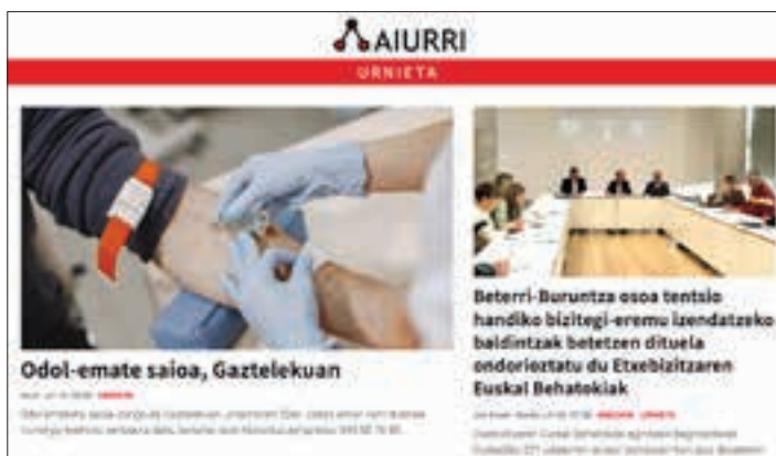
Aiurri.eus guneko Urnieta ataleko albiste-sorta. AIURRI

2004ko martxoaren 1an, estrai-nekoz, egunkari itxurako Aiurri izeneko astekaria banatu zen Urnietan. Bazuen atal bat, aurkezpen modukoa zena. Zer duzu esku artean goiburuean, egitasmoa aurkeztu zitzaion urnietarrei: "Aiurri izeneko astekaria da esku artean duzuna, irakurle, Urnietan astero-astero EUSKARA HUTSEZ argitaratzen hasi nahi dugun egunkari formatoko astekaria, gure herriei buruzko eguneroko informazioa bizi-bizi eta euskaraz, behar adina, eskaini nahi dizugulako. Andoainen duela hamar urtetik hona argitaratzen dugun Aiurri hamaboskaria osatzera eta indartzera datorren argitalpena da hau". Hogeit urte betetzear dira, geroztik. Asmoa, hein handi batean, bete dela esan daiteke. Aiurri astekaria erreferentziatzeko hedabide bilakatu da Andoaingo eta Urnietako biztanleriarentzat. Orduko hartan, ez genuen irudikatzen Internet-ek halako indarra hartuko zuenik. Bada, paperean ez ezik, digitalean ere ibilbide oparoa betetzen ari da Aiurri. 365 egunez berritzen