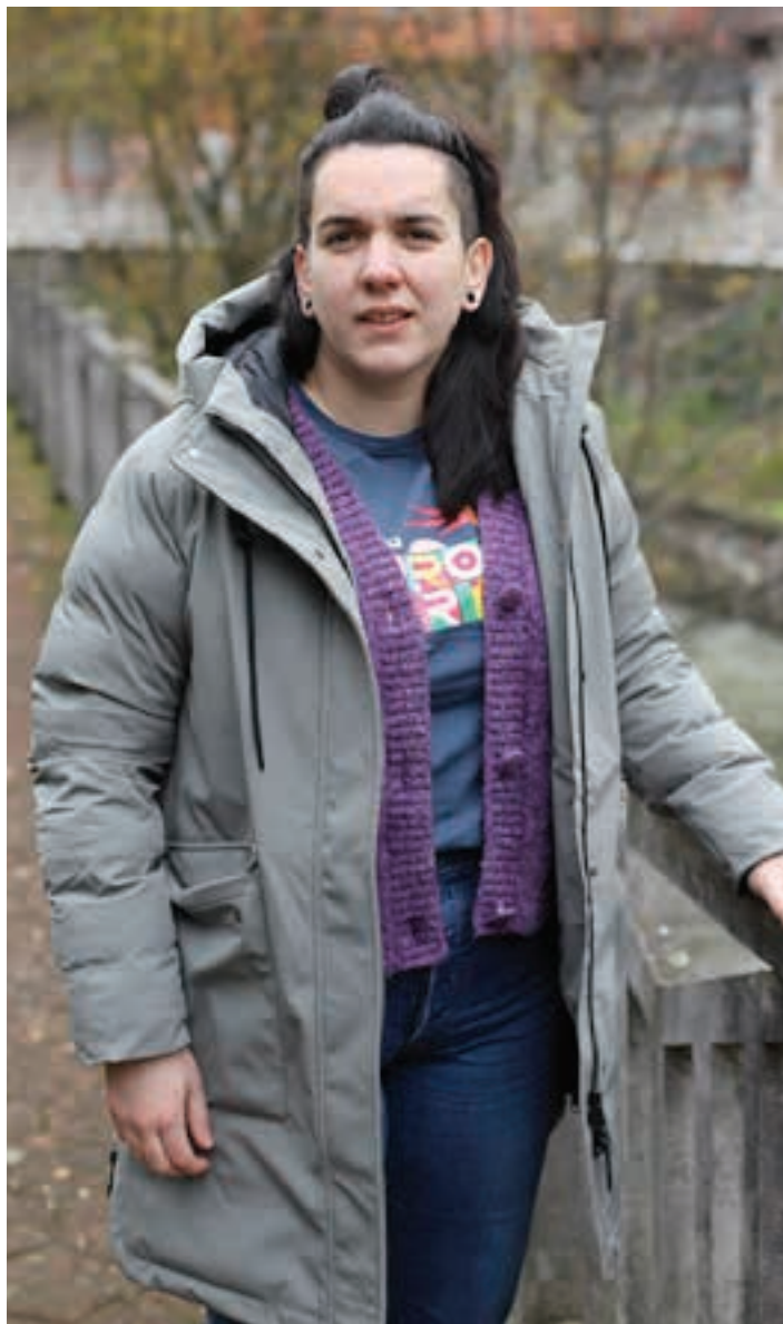
Aurreikuspen onak egin ditu Elordik, edizio berria hasteko gutxi falta denean. GOIENA

"AZKENENGO EDIZIOAN, KILOMETROZ KILOMETRO JENDETZA EGON ZEN"