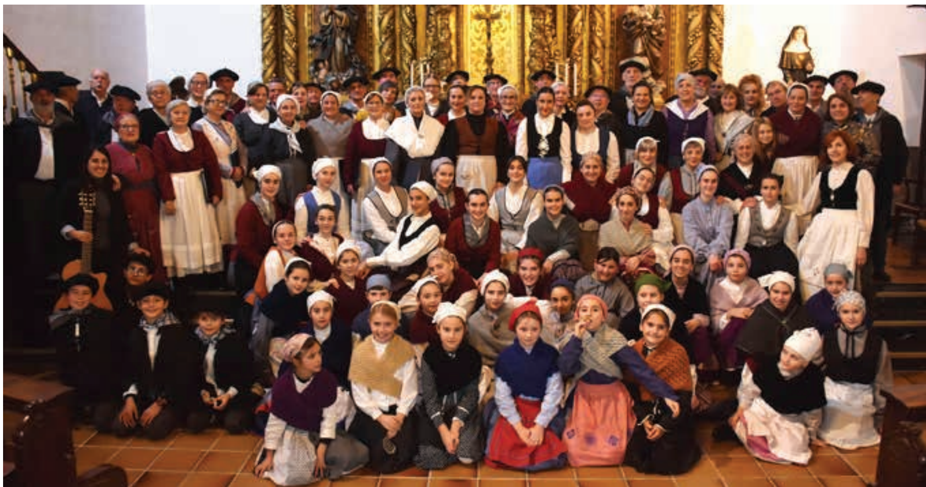
Andoaingo Udai Musika Eskolako abesbatzen Gabonetako emanaldi berezia, Kaletxikiko kaperan.