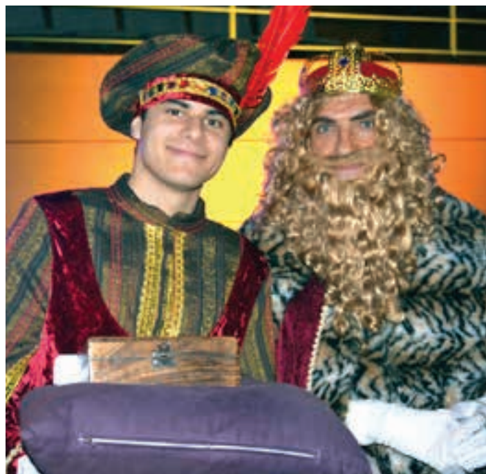
Gaspar erregea eta haren laguntzailea, Allurralde kiroldegian. AIURRI