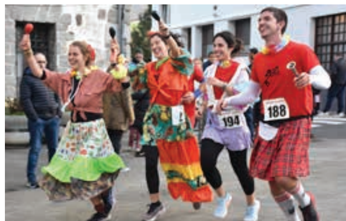
Gozatu ederra hartu zuten kuadrillek, urteari amaiera ematen dion lasterketan. AIURRI