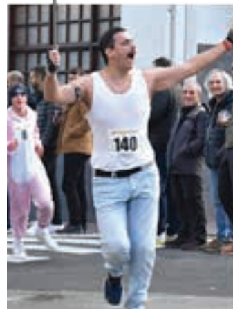
"Mercury" ere saritu zuten. AIURRI