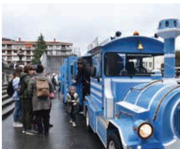
Txu-txu tren, Goikoplazan. AIURRI