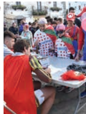
Izen-ematea, San Juan plazan. AIURRI