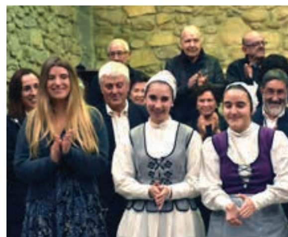
Olagain txistularien Gabonetako emanaldi berezia, gonbidatuekin.