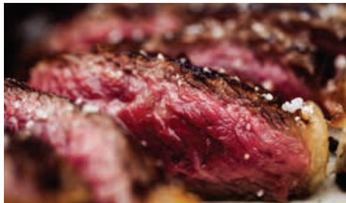
Txuleta, Oianume sagardotegian ateratako argazkian.