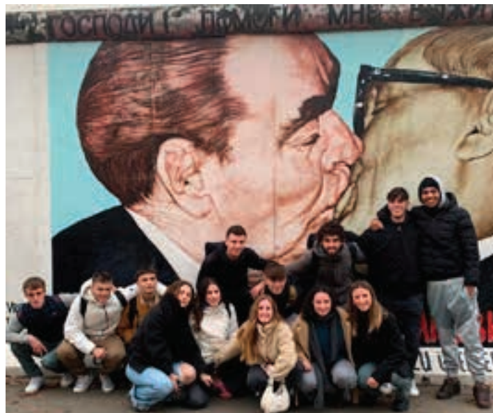
Lidergo Ekintzailean eta Berrikuntzan Graduko ikasle-taldea. VAZQUEZ

GAKO enpresa antolatzailea Mondragon Unibertsitatean Li-