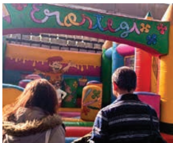
Gabonetako Haur Parkea, Allurralden. AIURRI