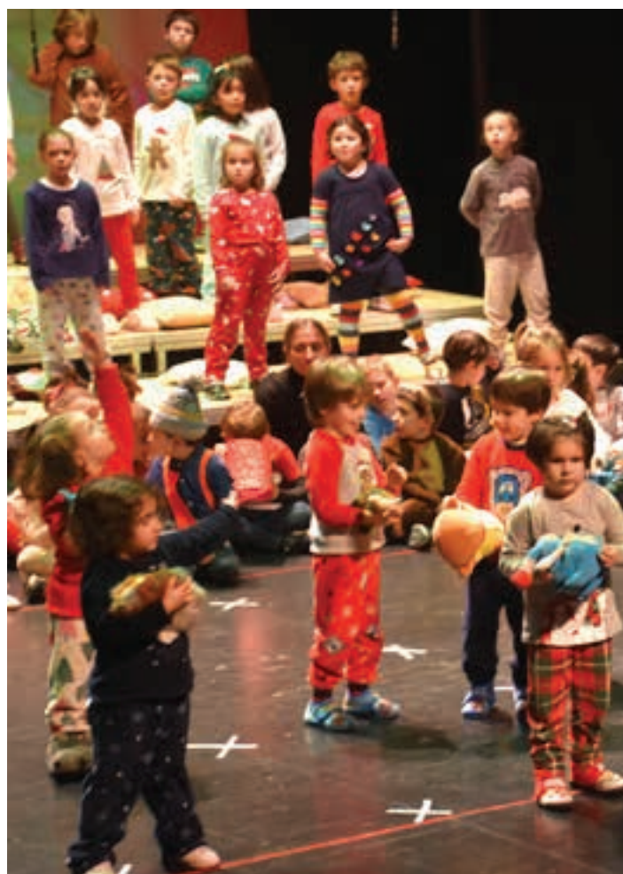
Udai Musika Eskolako gaztetxoek emanaldia Bastero Kulturgunean. AIURRI

Gabonak, bestalde, kantuan aritzeko aukera aproposa da. Eskaintza zabala izan da aurten.