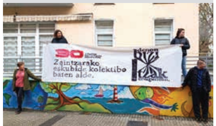
Greba Feministara deitzen zuen pankarta topatu zuten manifestariak.

Anbrosia Olabide eraikina Manifestazioari ekin aurretik, deitzaileek egin zuten iragarpena. Manifestazioaren ibilbidea zaintzari loturiko guneetatik igarotzekoa zen. Hala, Eguneko Zentrotik eta Gizarte Zerbizuen egoitzatik pasa ziren.