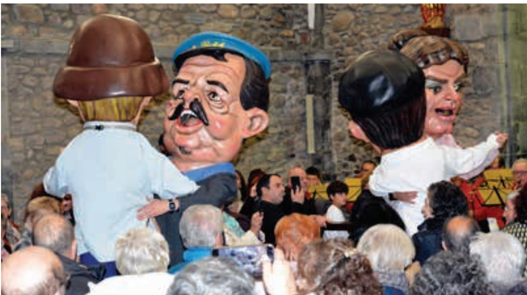
Lebiton konpartsaren parte-hartzea ikusgarria izan zen. AIURRI