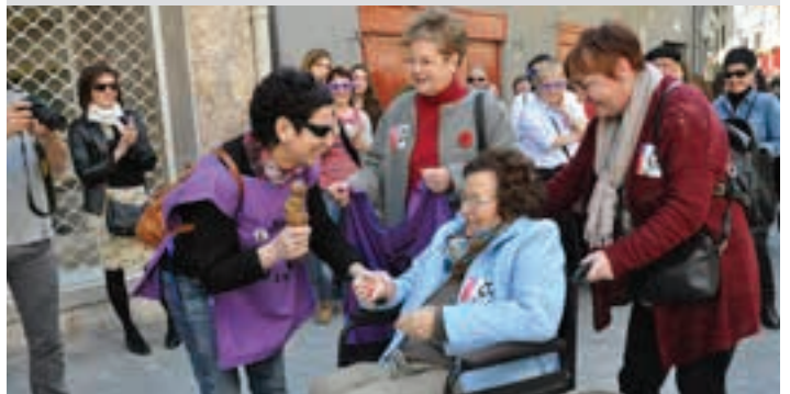
2014ko martxoko kalejira.