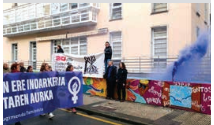
Ke morea lau haizetara zabaldu zuten, eguneko zentrotik igarotzean.

Osasun Etxearen aurrealdea Goikoplazan hasi eta bertan amaitu zen manifestazioa. Amaiera aldera, manifestua irakurri zuten Andoaingo Asanblada Feministako bi kidek. Besteak beste, Osasun Etxetik igaro ziren.