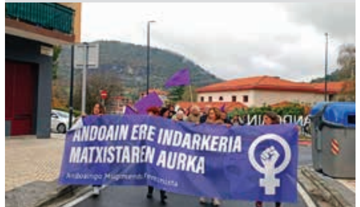
Nafarroa plaza zeharkatuta, Osasun Etxearen ondotik igaro zen manifestazioa.

Osasun Etxearen aurrealdea Goikoplazan hasi eta bertan amaitu zen manifestazioa. Amaiera aldera, manifestua irakurri zuten Andoaingo Asanblada Feministako bi kidek. Besteak beste, Osasun Etxetik igaro ziren.