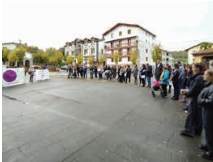
Isiltasunean egon ziren, indarkeria matxistak eragindako biktimak gogoan. UDALA

Ordu berean, San Juan plazan ere elkarretaratzea egin zuten zenbait herritarrek, Urnietako Udalak deituta. Tartean zen Bagara herriko talde feminista. Udalak, bere aldeik, herriko alderdiek aho batez adostutako adierazpen instituzionala irakurri zuten.