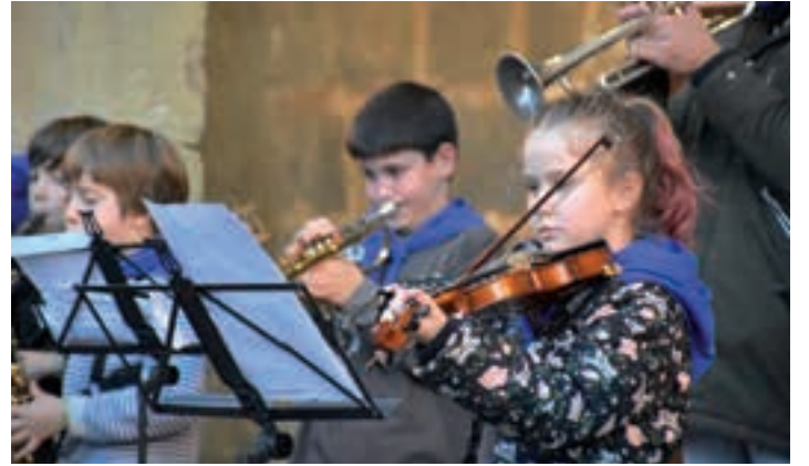
Kalera atera ziren musika-eskolako ikasleak zein irakasleak, ohiturak aginduta. AIURRI