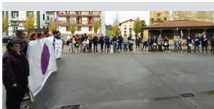
Lagun ugari elkartu zen herriko plazan, azaroaren 25ean. UDALA