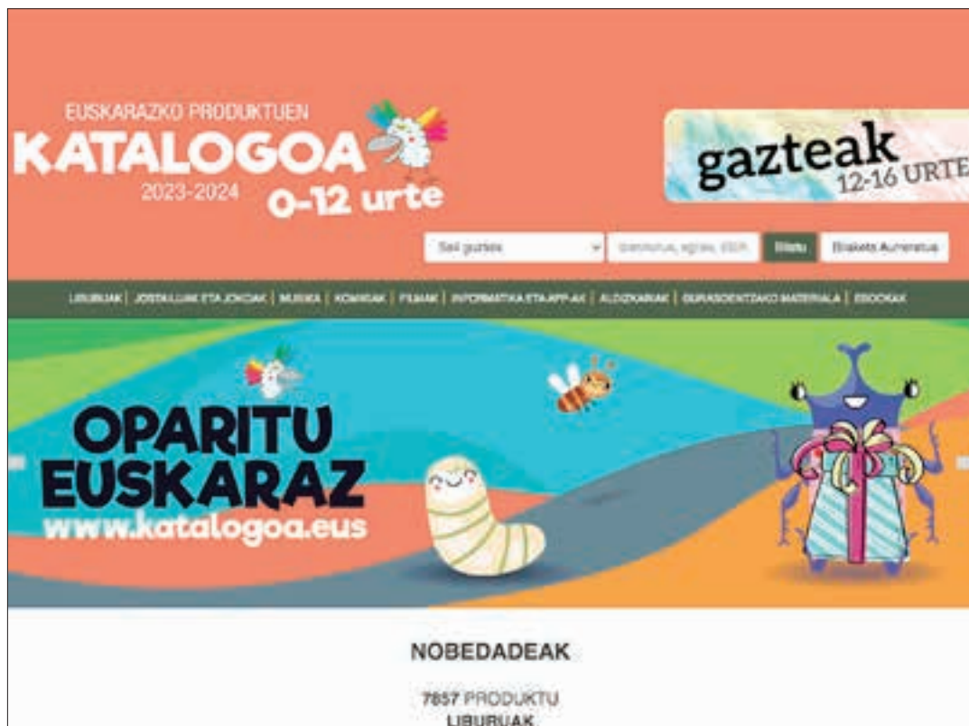
Paperezko euskarrian bezala, edizio elektronikoa ere 0-12 eta 12-16 urte arteko zuzenduriko eskaintza berezitua dute.

asko hazten delako Durangoko Azokarako”, gaineratu du Imazek. Halere, azoka, informazio iturri ezin emankorragoa dela dio. “Edozein datu biltzeko, azoka bera ere oso toki aproposa izaten da, urteko berritasunak