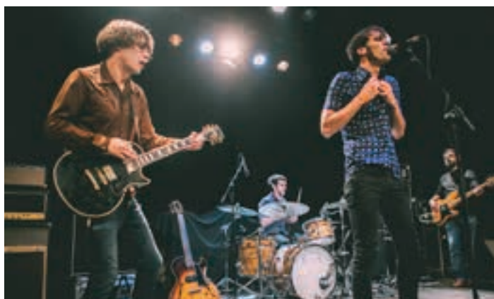
Audience musika taldea. AUDIENCE

Orain bi hamarkada pasata jaio zen konpainia Arabako hiriburuan. Harrezkero, ibilbide oparoa izan du, izan ere, guztira, hamabost ikuskizun ondu ditu, horietako asko, euskaraz: “Harri orri ar”, “Koxkak”, “Tri-paki salda”, “Lana”... Azkena, “Itsas Behera”, hain justu ere, Saroben ikusgai izango dena.