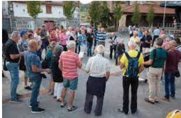
URNIETA Kantazaun kantari kalez kale, euskararen egunean

ANDOAIN Ospakizuna Irunberri elkartearen urteurrena. 12:30 Bermuta. 13:30 Urteurreneko ekitaldia. 14:30 Urteurreneko bazkaria. 18:00 Arrixku bertso taldea. 19:30 Malkogariyak. Irunberri.