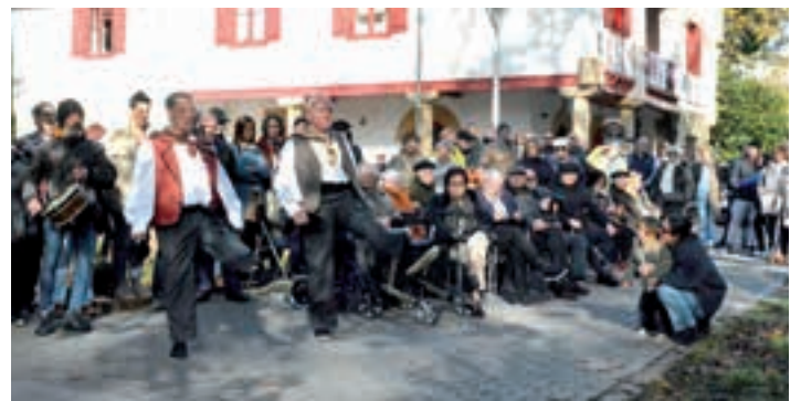
Ekitaldiko bideoa ikusgai dago Aiurri.eus webgunean.