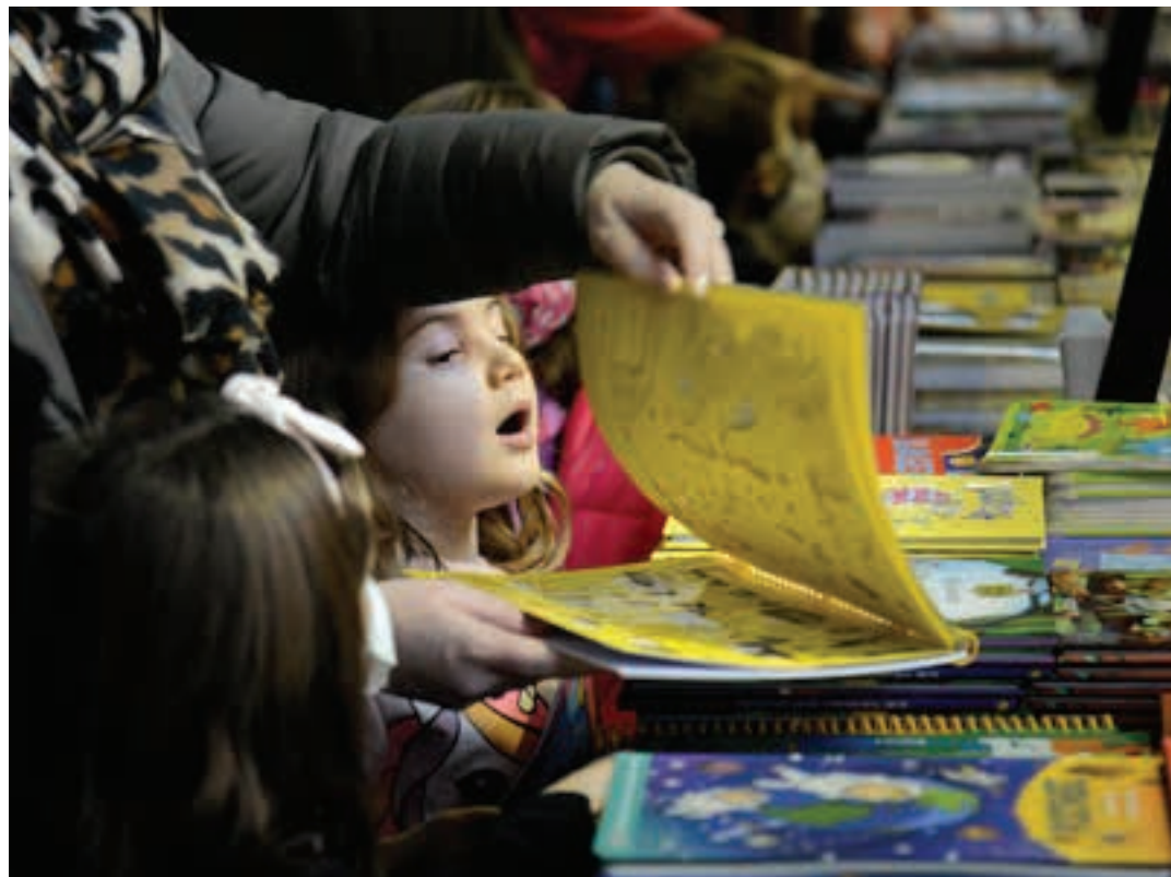
Euskarazko Produktuen Katalogoaren 64.000 ale banatuko dira aurten Hego Euskal Herri osoan.

Mende laurdena euskarazko sorkuntzaren erakusleio lana egiten, aisialdi tartea euskalduntzen. Konturatzeko, hogeitabosgarrena labetik atera berri dute, “zitz eta zazit!” aldarripean