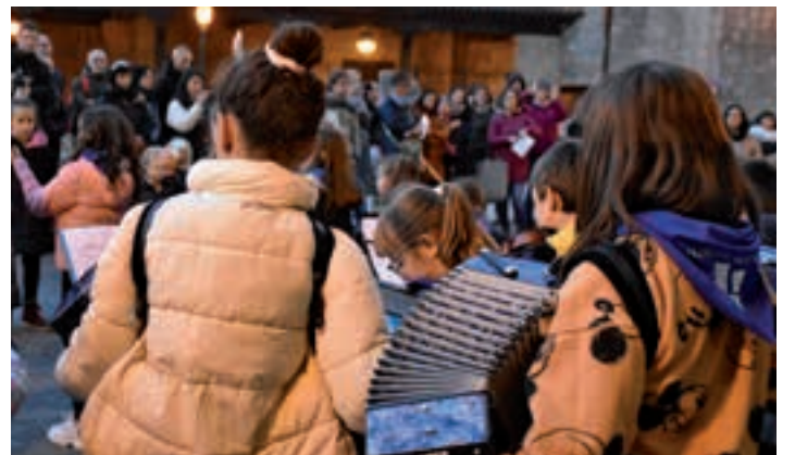
Makina bat doinuz bete zuten Urnieta, asteazken arratsaldean, musikagile gazteek. AIURRI

Arratsaldeko 17:30ean abiatu ziren kultur etxetik, eta, San Juan plaza igaro ostean, kalez kale aritu ziren, Plazido Muxikan edo Etxeberrri plazan geldialdia eginda. Trikitixa, panderoa, klarineta, melodika... Makina bat doinuz bete zuten Urnieta, asteazken arratsaldean, musikagile gazteek.