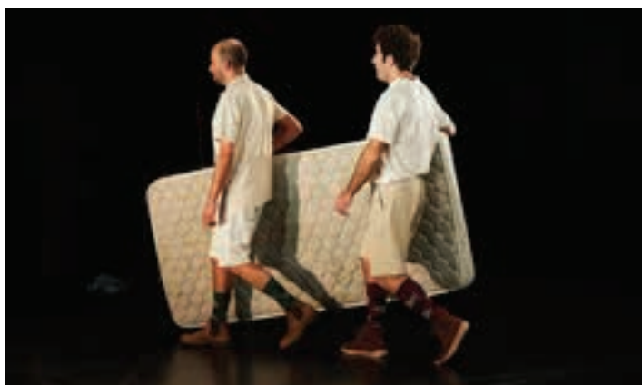
Iluntzeko 19:00tan hasiko da emanaldia. PEZ LIMBO