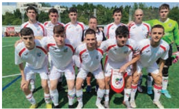
Urnietako senior mailako taldea, 2023ko udaberriaren. UKE

Asteburu honetan mutilen bi taldeak etxetik kanpo ariko dira. Urnietarrak, Hondarribian. Eta, andoaindarrak, Pasai Donibanen.