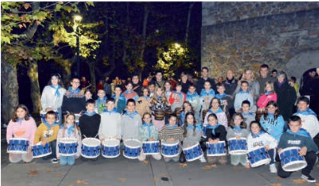
Aita Larramendi ikastolaren ereserkiarekin abiatu zen emanaldi berezia. Bertan izan ziren ikasleak, danborra jotzeko. AIURRI