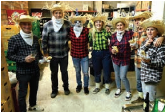
Kotoiko lagun ugari aritu zen lanean. Eta lanaren ostean, merezitako otordua. AIURRI