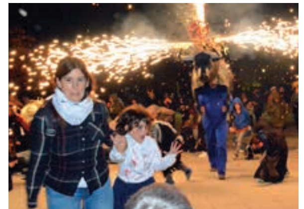
Lebiren inguruan jendetza batu zen, Etxeberrieta plazan. AIURRI