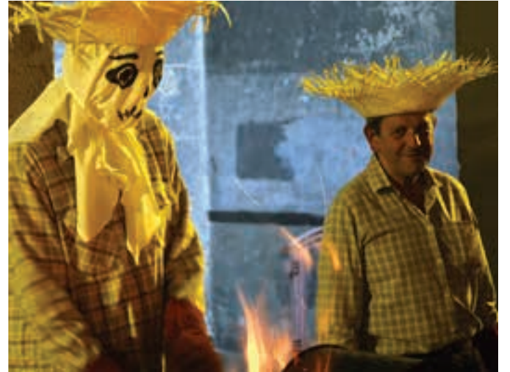
Gaztain-erreak eskaini zituzten plazan. AIURRI