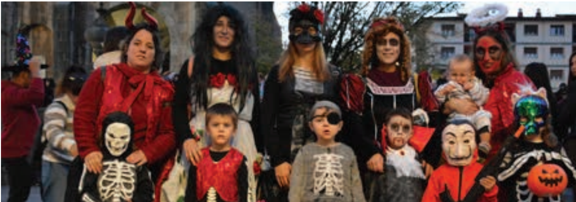
Arimaren Gauaren aldaera ezberdinak ikus zitezkeen, andoaindarren mozorroetan. AIURRI