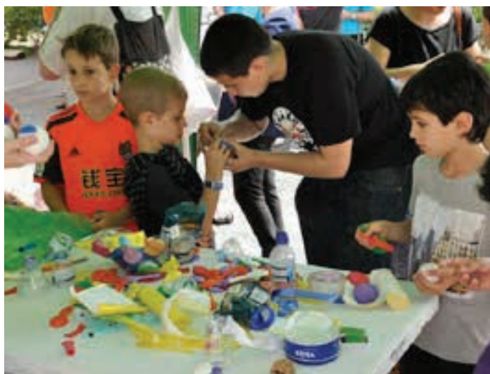
Eskaintza zabala eskaintzen du Andoaingo Udalak.

Mintzalagunen formula beretsua da. Batetik, Bidelariak, euskaraz hitz egiteko ohiturarik ez duten gurasoak. Bestetik, bidelagunak,