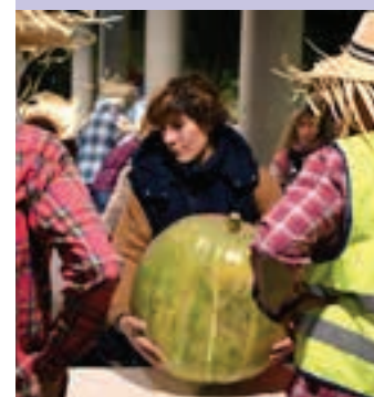
Ikusmina piztu zuen kalabazak.