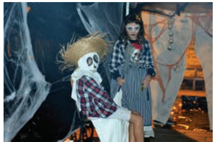
Banaka hartuta, mozzorro ederrak aurki zitezkeen. AIURRI