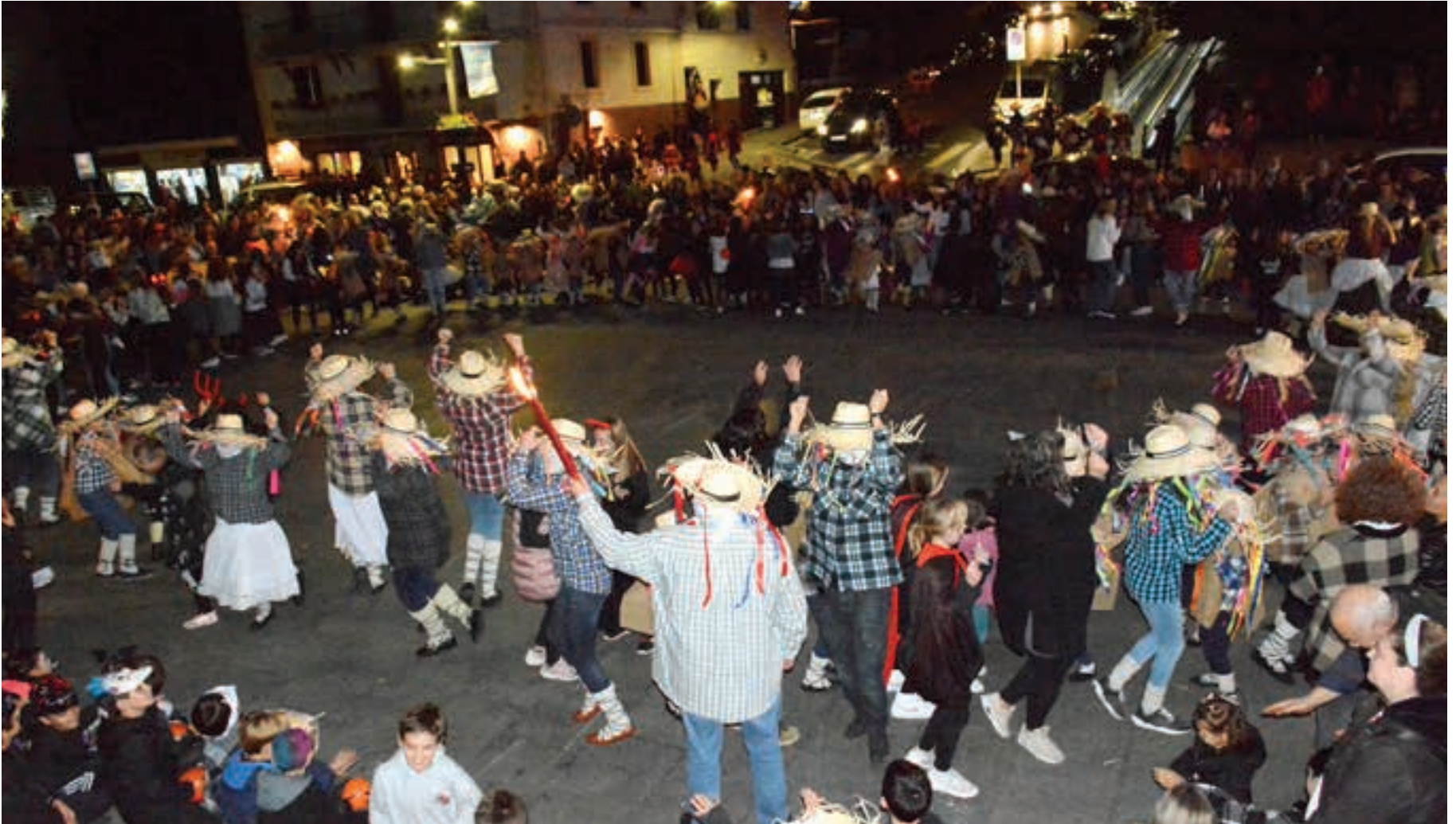
Urki Dantza Taldekoek, bigarren dantza-saioan, ikusleak gonbidatu zituzten dantzatzera.