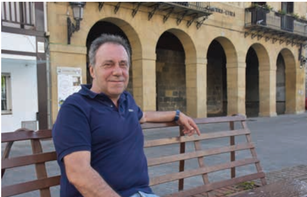
"ETak kitto esan zuenean prozesu bat abiatu zen, eta elkarbizitza egoerak modu naturalean garatu dira ondoren". AIURRI