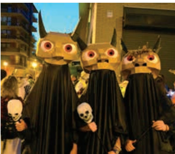
Arimen Gaua askotariko moztarok ikusteko aukera bilakatu zen. Gau Beltzaren argazki-sorta ikusgai dago Aiarri.eus webgunean. AIURRI