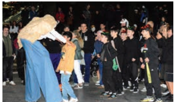
Akerrak Okerrak konpainiako kideekin gertuko hartu-emana sortu zen. AIURRI