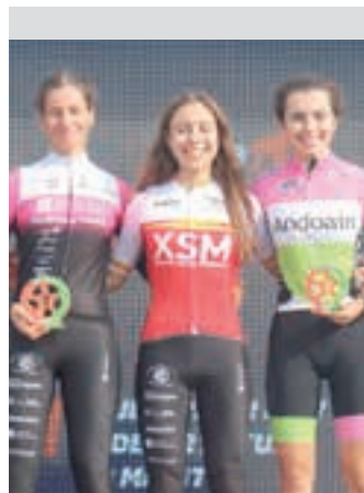
Aranguren, Katalunian. ANDOAINGO

Pausuak gutxinaka ematea gusatuko litzaidake, baina urrutira iritsi nahik nuke, profesional mailara.