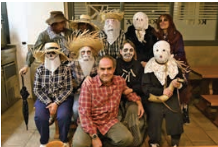
Larramendi Bazkuneko kideak, 300 talo eskaini eta gero. AIURRI

Txokolatea berotzen eta zerbitzatzeko, bide-segurtasuna bermatzeko, beldurraren pasabidea prestatzen eta ilarak zaintzen, taloak prestatzen eta zerbitzatzeko, edariak banatzen, dantzari talde handia bideratzen, antzezlanak prestatzen, Lebiton zezen suzkoa ateratzen... lana gogotik egin duten dozenaka lagunei, eskerrik asko. Ezinbestekoak izan dira.