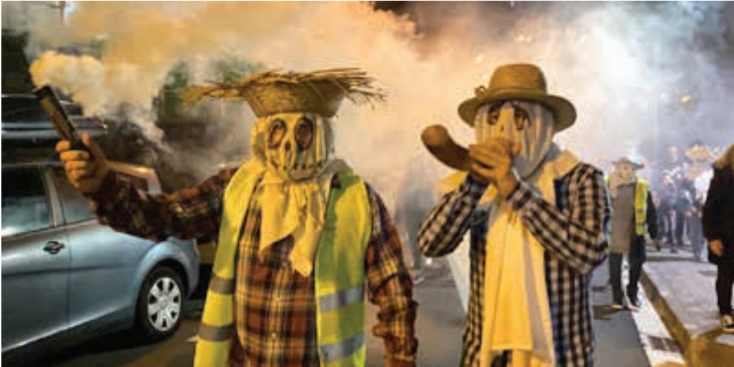
Exeberri plazatik kalejira irazi ziren San Juan plazara. AIURRI