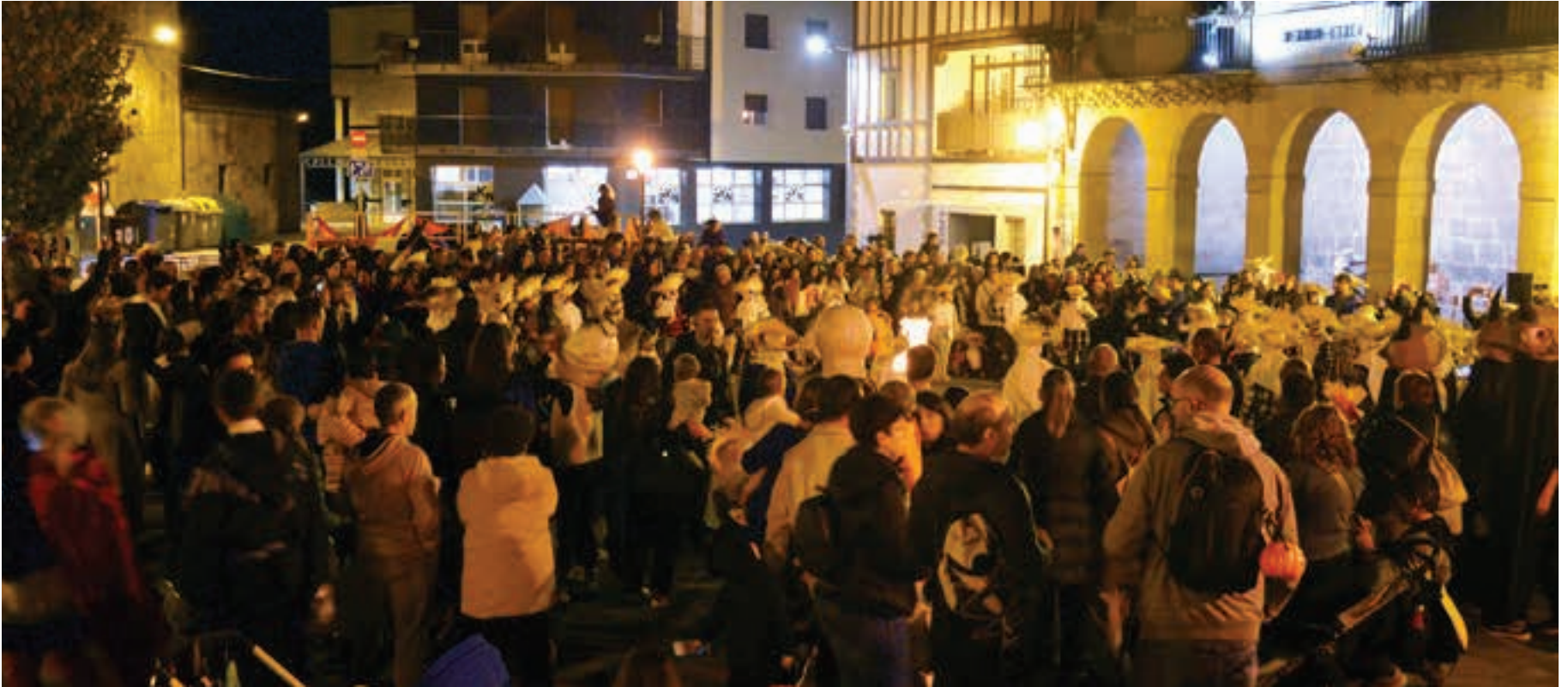
Etxeberri plazan hasi eta San Juan plazan amaitu zen ospakizuna. Irudian ikusten denez, jende ugari hurbildu zen.