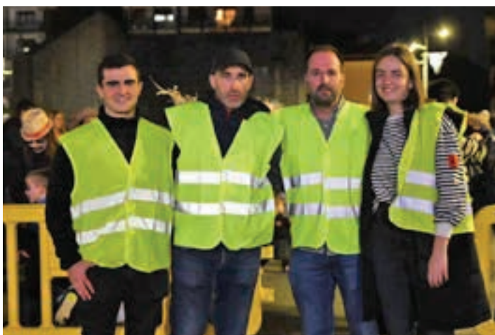
Segurtasuna bermatzeko lanetan herrikide taldea asko aritu zen.