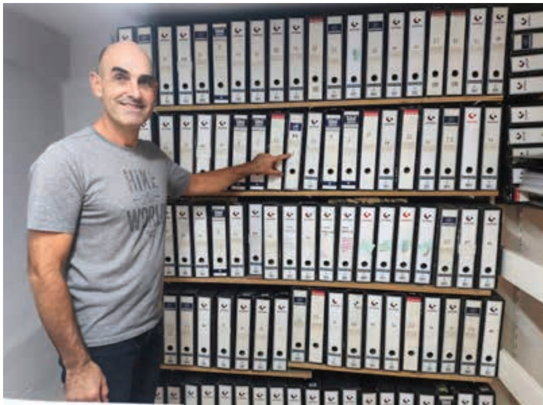
1994az geroztik egindako argazki bilduma osoa, Andoaingo Udal Artxiboan dohaintzan emateko asmoa dauka Igarategik. AIURRI

gutxi gora behera. Egin kontu, baby boom belaunaldiko bikote ugari ezkondu zela XX. mendearen hondarrean eta XXI. mendearen hasierako urteetan! Gu ere puntu demografiko harrigarri horretan jaiok gara, ahoz ahoz zabaltzen zen gure zerbitzua, eta lagun eta ezagun asko hurbiltzen zitzaizkigun erreportajeak eskatzeko. Gure artean txantxetan esan ohi dugu denboraldi hartan, egungo Facebookaren