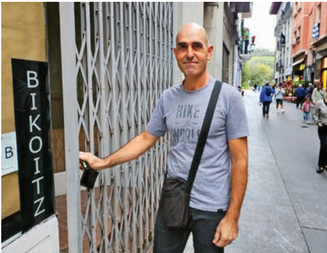
Igarategi urriaren 31n itxi zuen betirako Bikoitz argazki-denda. AIURRI