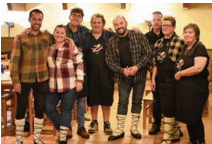
109 litro, 545 razio... Batzokiak prestatu zuen txokolate beroa.