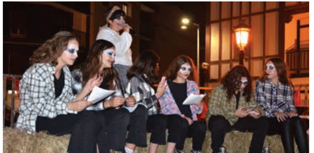
Salestar-Magale ikastetxeak antolatutako ospakizuna. AIURRI