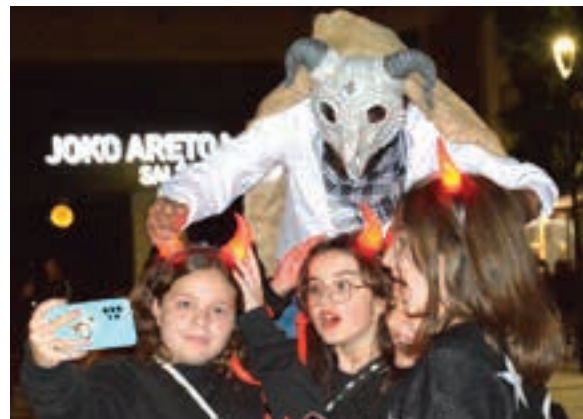
Une bereziak argazki bidez jasotzeko aroa bizi dugu. AIURRI