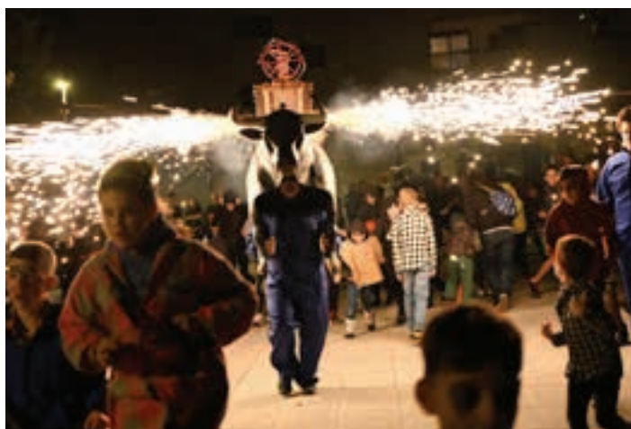
Lebiton konpartsako kideek eman zioten amaiera, ospakizunari. AIURRI