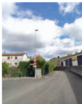
Urnieta Igerategi bidea itxita dago.