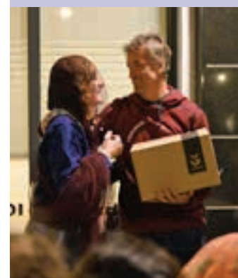
Telletxea, sariduna. AIURRI