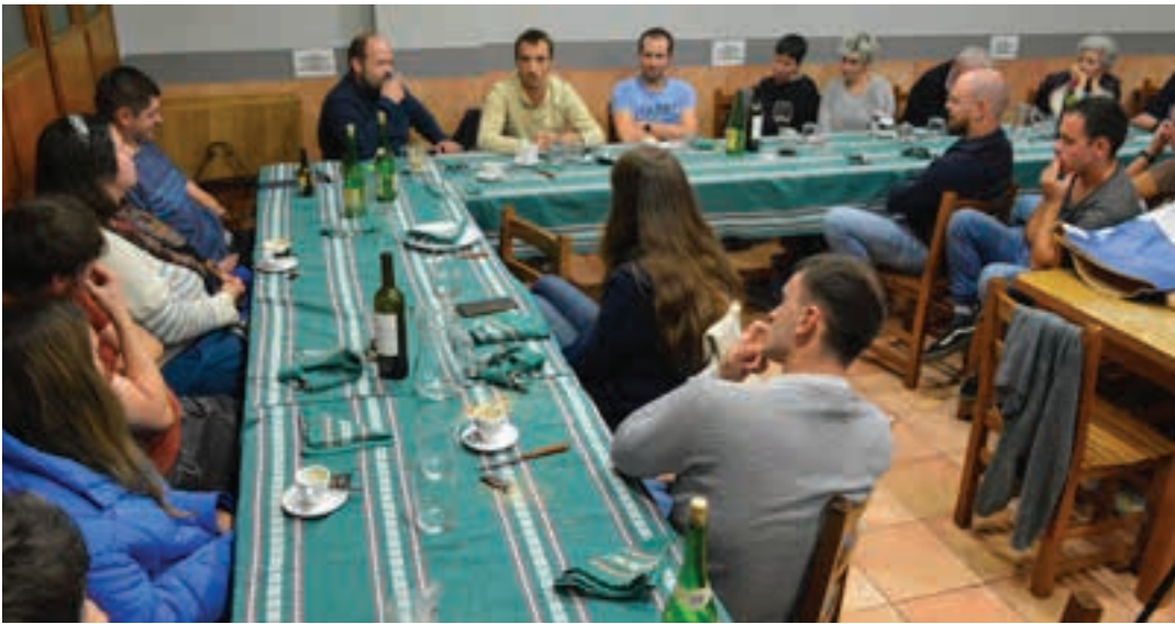
Aurreko ostiraleko bertso-afaria, Irunberri elkartean. AIURRI

Andoingo Kale Nagusiko elkartean laster hasiko dira urteurreneko ospakizunak. Atariko gisa edo, bertso-afaria antolatu zuten aurreko ostiralean. Gertuko saioa izan zen, Punttukaren bidez, bertsolari eta bertsozale ia guztiek elkar ezagutzen baitzuten