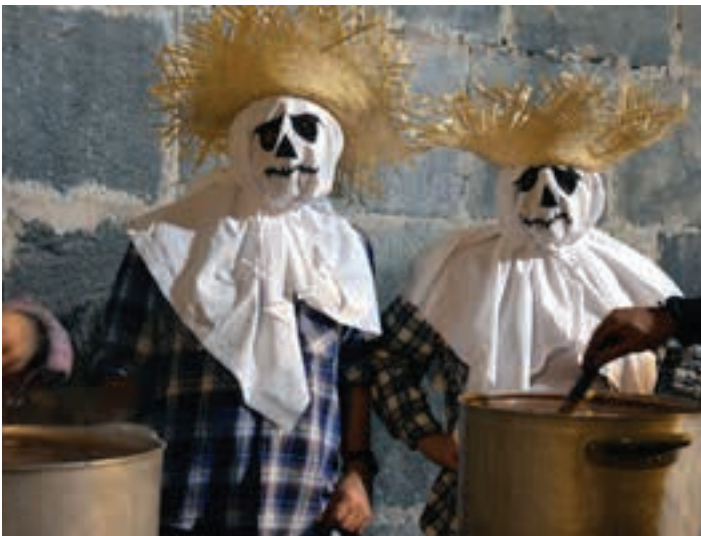
Txokolate beroa eskaini zuten Kontzejupean.