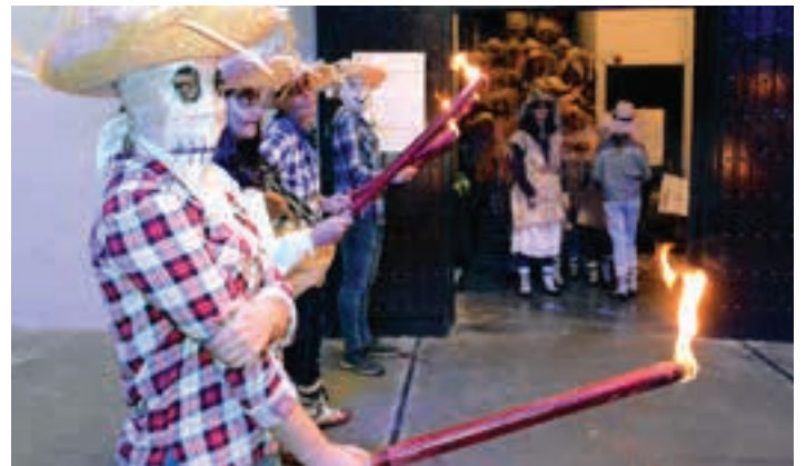
Urki dantza taldearen ikuskizuna jendetsua eta parte hartzailea izan zen.

maitasunez gogoratu, gau honetan beraiek gu ikusiko bait gaituzte eta guk haiek sentitu. Guri dagokigu galdutakoa berreskuratu eta segida ematea. Aukera gure esku dago! Ez dakigu jai aurretik non gauden, ezta hil ondoren nora joango garen; bizitza honetan garrantzitsuena bizitzea da, beraz, gaur eta orain,... kalabazak hustu, kandelak piztu, beldurra eragin eta iluntasuna bizi! Eguna egunekoentzat, gaua gauekoentzat...!".