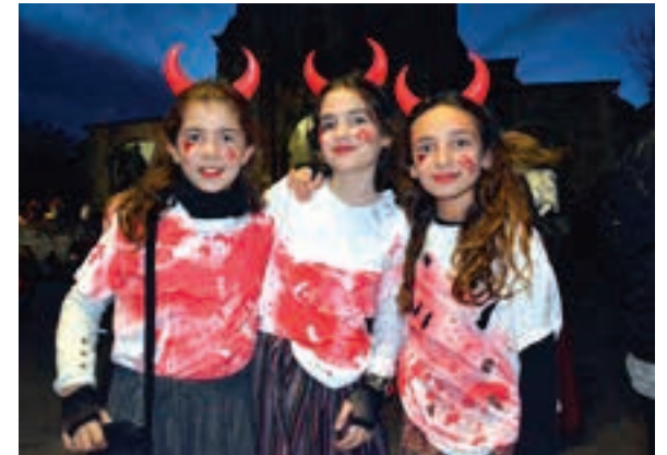
Lagun taldean gozatzeko moduko ospakizuna da Gau Beltza. AIURRI