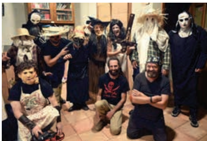
Beldurraren pasabidea ikusgarria zen, Irunberriko kideen lanaren ondorioz. AIURRI