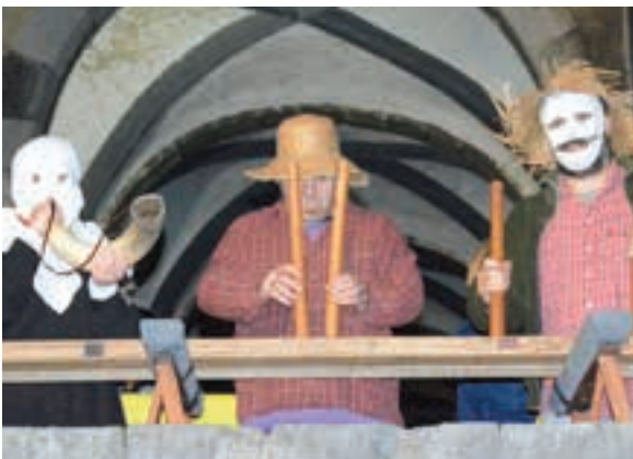
Maizorri txalapartako kideek eman zioten hasiera, ikuskizunari. AIURRI