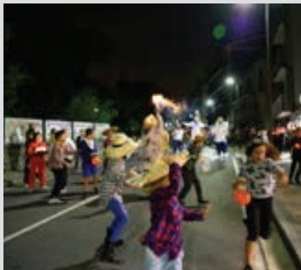
Kalejira, iaz, Kale Nagusian. AIURRI

Kalejira Andoingo Udaleko Kultura Lansailaren eskutik, Goikoplazatik abiatuko da kalejira. Iazko konpainia bera da. Ziur, aurtengo ere, ikuslegoa harrituko duela.