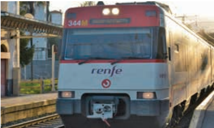
Andoaingo tren geltokia. AIURRI