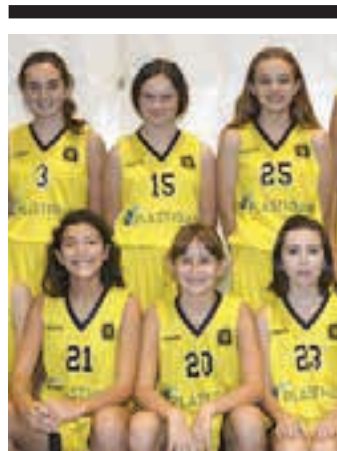
Artxiboko irudia.