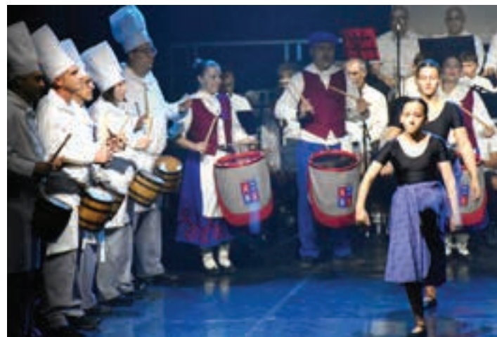
Egape Dantza Taldeko kideak, Urdanborreko kideekin batera. AIURRI