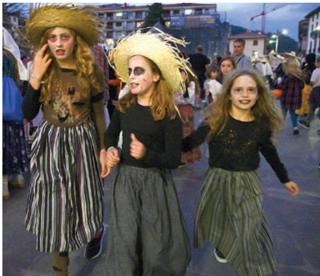
Mozorrotzeko aukera ugari dago. Argazkiko neska-kuadrilla, esaterako, eredu ona da. AIURRI

Eragile horiez guztiez gain, laguntzaileak behar dira. Lan zehatzak izango dira, hala nola, bide-segurtasunean laguntzeko eta elikagaiak zerbitzatzeko. Laguntza emateko prest dagoen boluntarioak mezua idatz dezake, 619 163 537 whatsapp zenbakira.