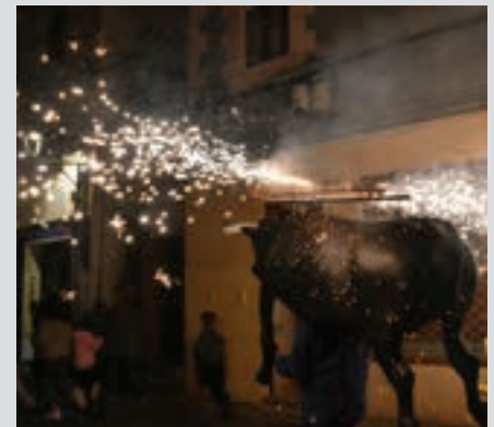
Lebiton, iazko Santakruzetan. AIURRI

Taloa Kotoi elkartearekin lankidetzan, taloa eskainiko da kalejiraren amaiera aldera. Txistorra, hirugiharra eta txokolata, aukeran. Txartela alde aurretik erosi behar da.