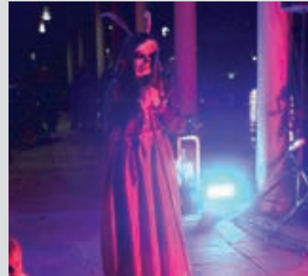
Antzezlan aurtan Goikoplazan da. AIURRI

Txalaparta Maizorri txalaparta taldeko kideek saioari hasiera ematen diotenean, eguneko lehen ikuskizuna abiatuko da Goikoplazan bertan.