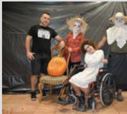
Beldurraren pasabidea, iaz.

Kalejira Andoingo Udaleko Kultura Lansailaren eskutik, Goikoplazatik abiatuko da kalejira. Iazko konpainia bera da. Ziur, aurtengo ere, ikuslegoa harrituko duela.