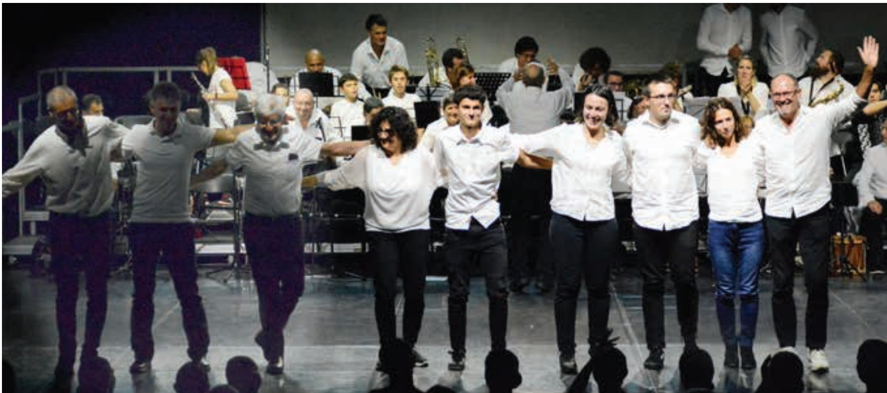
Txanbolin Txistulari Bandako kideak, emanaldiaren amaieran. Merezitako txaloak jaso zituzten. AIURRI