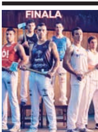
Aurtengo kartela. NAVARRA ARENA

Aurreko asteburuan Amasan aritu ziren, eta denboraldia Adunan amaituko da. Datorren azaroaren 4an izango da. Amasan Euskal Herriko eta Kataluniako partaideak izan ziren. Eskualdekoen artean TxirrinAndoain taldeko bi kide aritu ziren, erreleboka. Korrika eta mendi bizikletan aritu behar dute, zirkuito honetan. Igantzi, Kanpezu edota Durangon aritu dira, lehenago.