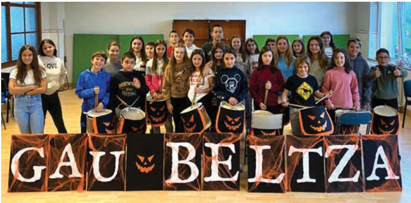
Prestaketa lanetan murgilduta dabilta Urnietan. AIURRI