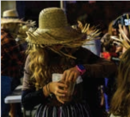
Txokolatea eskainiz hasiko da ospakizuna. AIURRI

Txokolatea Goikoplazara hurbiltzen denari txokolate beroa eskainiko zaio. Glutena hartzen ez dutenentzat ere egokia da. Batzokia elkartarekin lankidetzan prestatuko da.