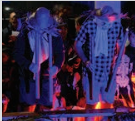
Txalaparta doinuekin abiatuko da antzezlan. AIURRI

Txokolatea Goikoplazara hurbiltzen denari txokolate beroa eskainiko zaio. Glutena hartzen ez dutenentzat ere egokia da. Batzokia elkartarekin lankidetzan prestatuko da.