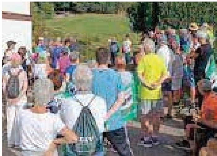
Aferak zeresana eman du, bereziki, Andoainen.

Andoaingo Udalean, bestalde, gobernu-aldaketa egon da. CIIa defendatzen zuen EAJ-PNV oposizioan da, baita PSE-EE ere.