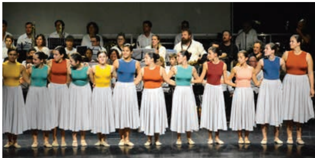
Kantutegian, Urnietako mendiei eta aurre-historiako lekuei aipamena egin zitzaien. Tartean, "Mulisko" gainari. AIURRI