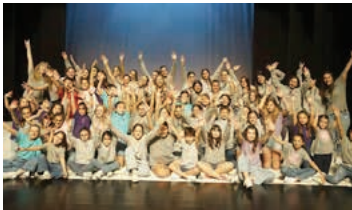
Klaap taldeko kideak, iazko Euskaraldian. AIURRI