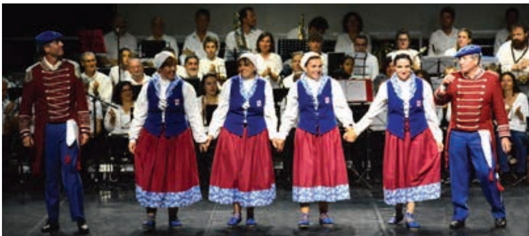
Urdanborreko kideak Urnietako ereserkia jotzeko unean igo ziren taula-gainera.