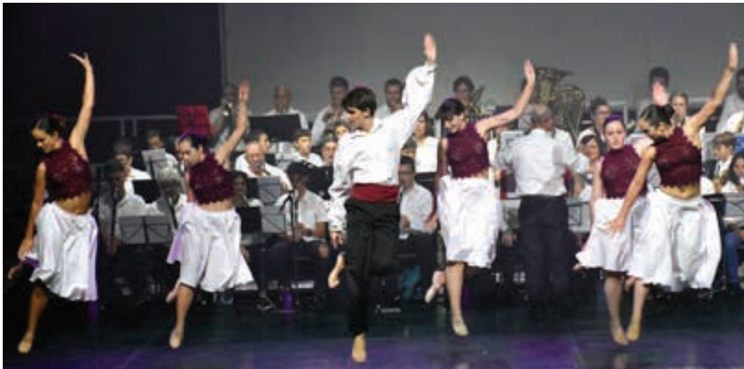
Muruamendiarazen koreografiak egin zituzten Egape Dantza Taldeko kideek. Argazkian, Idiazabal kaleari eskainitako pieza.