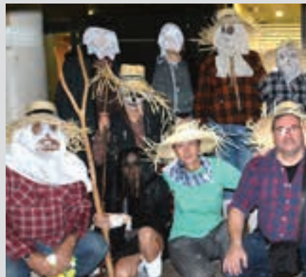
Taloa 5 eurotan salduko da, iaz bezala. AIURRI

Beldurraren pasabidea Irunberriko kideei esker, benetako beldurra sentitzeko aukera izan zuten, haur eta gaztetxoek. Aurtengo edizioarako prest dira.