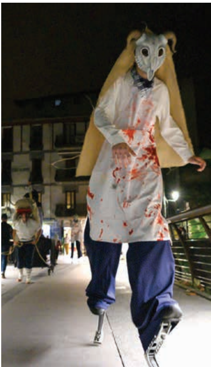
Iazko konpainia bera hurbilduko da Andoaingo Gau Beltzara. AIURRI

Dantzariak Aurtan Urki dantza taldekoak ere batuko dira ospakizunera. Haurrak eta helduak, guztiak batera, parte-hartzailea den saiotxo prestatzen ari dira.