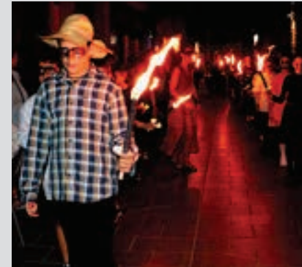
Urki dantza taldekoek saioa eskainiko dute. BARREN

Antzezlan Zer da Gau Beltza? Nondik dator arimen gaua? Antzeppen laburraren bitartez Gau Beltzan murgilduko gaituzte Goikoplazan agertuko diren aktoreak.