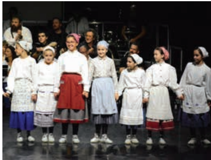
Egape Dantza Taldeko gaztetxoak, taula-ganean.