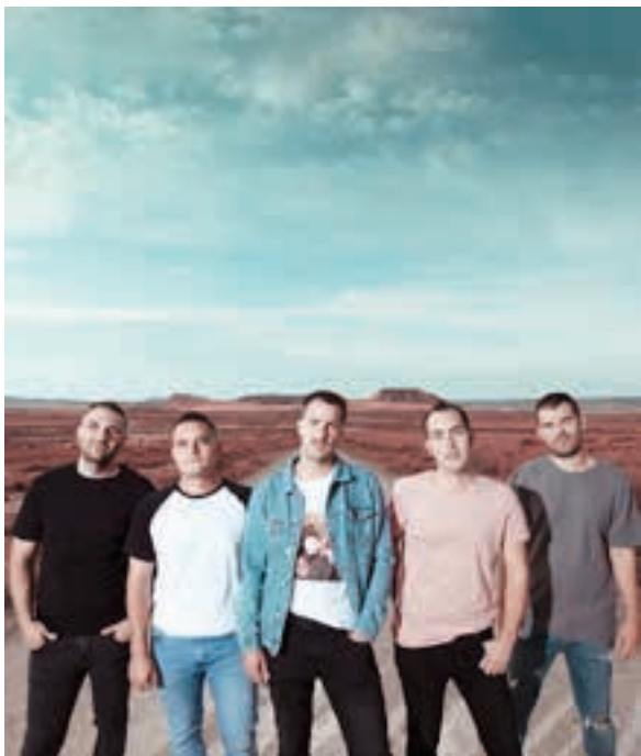
En Tol Sarmiento. ETS