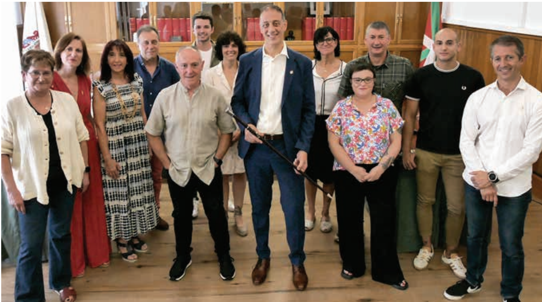
Udalbatzako kideak, kargua hartu berrian. AIURRI