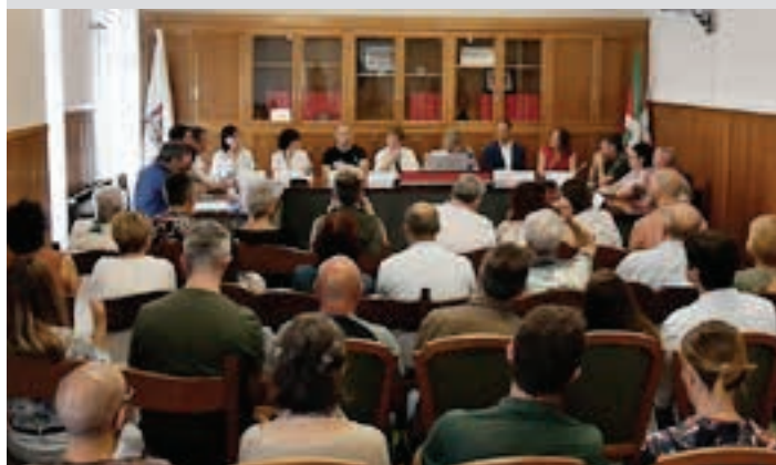
Larunbat eguerdiko plenoa. AIURRI

Etxekoak, lagunak eta alderdikideak Hiru familia politikoetako kideak elkartu ziren, pleno aretoan. Korporaziokideen alderdikideak, senideak eta lagunak ikus zitezkeen pleno aretoan, ikusleen artean.