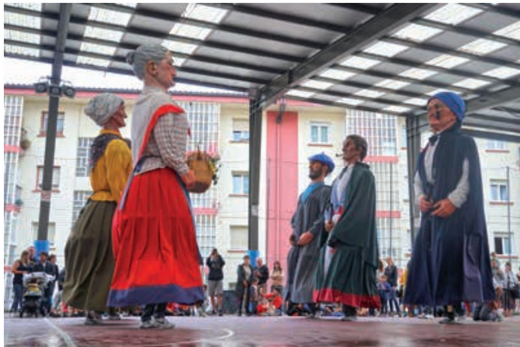
Lebiton buruhandi eta erraldoien konpartsa ostiral arratsaldean abiatuko da, Basterotik. AIURRI

10:00 Pilota: Pilota Eskolako umeen eskuzko partidak, Gaztelekuk antolatua, Arraten.