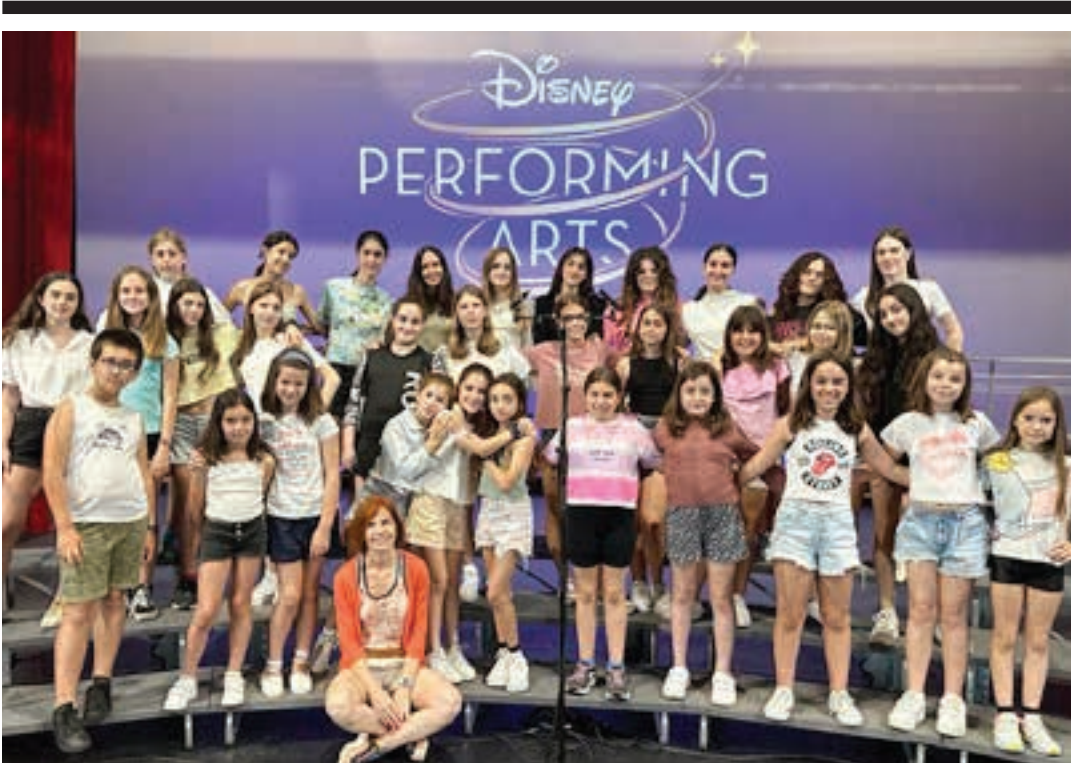
ANDOAINGO UDAL MUSIKA ESKOLAKO ABESBATZA