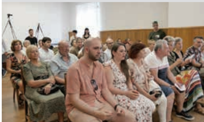
Pleno aretora herrikide ugari hurbildu zen. AIURRI

Amaren eskutik jaso zuen aginte-makila Aginte-makila jasotzeko unea berezia da, hartzailearentzat. Kasu honetan, gainera, polita izan zen amaren eskutik jaso zuelako. Iraganean amak zinegotzi jardun zuelako. Egur bereko ezpalak, beraz, biak.