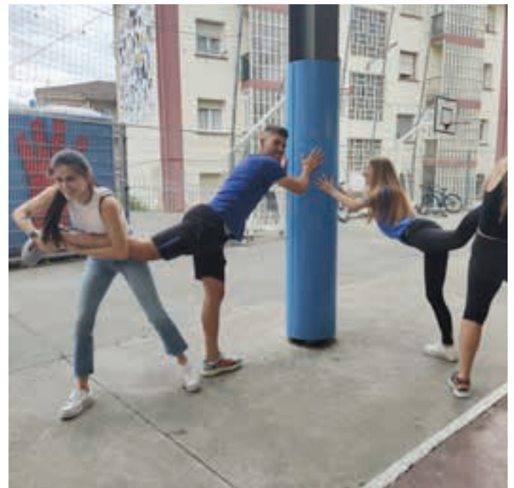
Perra jartzearen jokoa, batzuk perratzaile eta besteak abre paperean. AIURRI