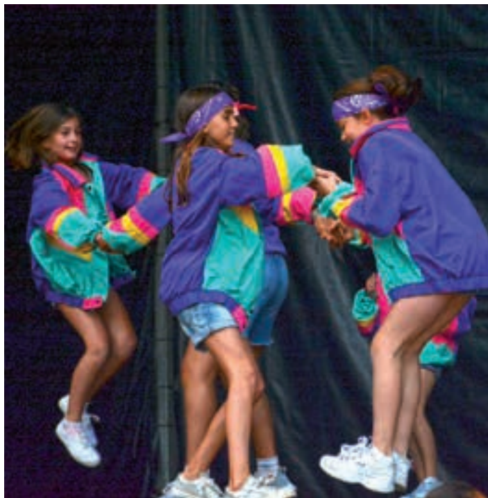
Klaap dantza akademia. AIURRI

16:00 Junior mailako Gipuzkoako Itzuliko 3. etaparen irteera Goikoplazatik.