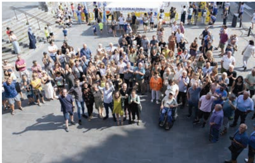
Kanpoan jende asko zegoen zain. AIURRI

EAJ-PNV alderdiei. Gure ardura eta gure helburua herritar guztien iritzia eta begirada kontuan hartzea izango da. Horretarako alderdi guztiekin elkarlanean aritzen saiatuko naiz. Lehen esan bezala, Andoainek erronka handiak ditu begi bistan, eta horiei aurre egiteko akordio zabalak lortzen saiatuko gara. Herri elkarte eta herritarrei ere orain arte esandako gauza bera esan nahi diet. Ez dut herritarrengandik urrun lan egingo duen alkatetza ereduetan sinisten. Orain arteko hurbiltasun berarekin lan egiten jarraituko dugu".