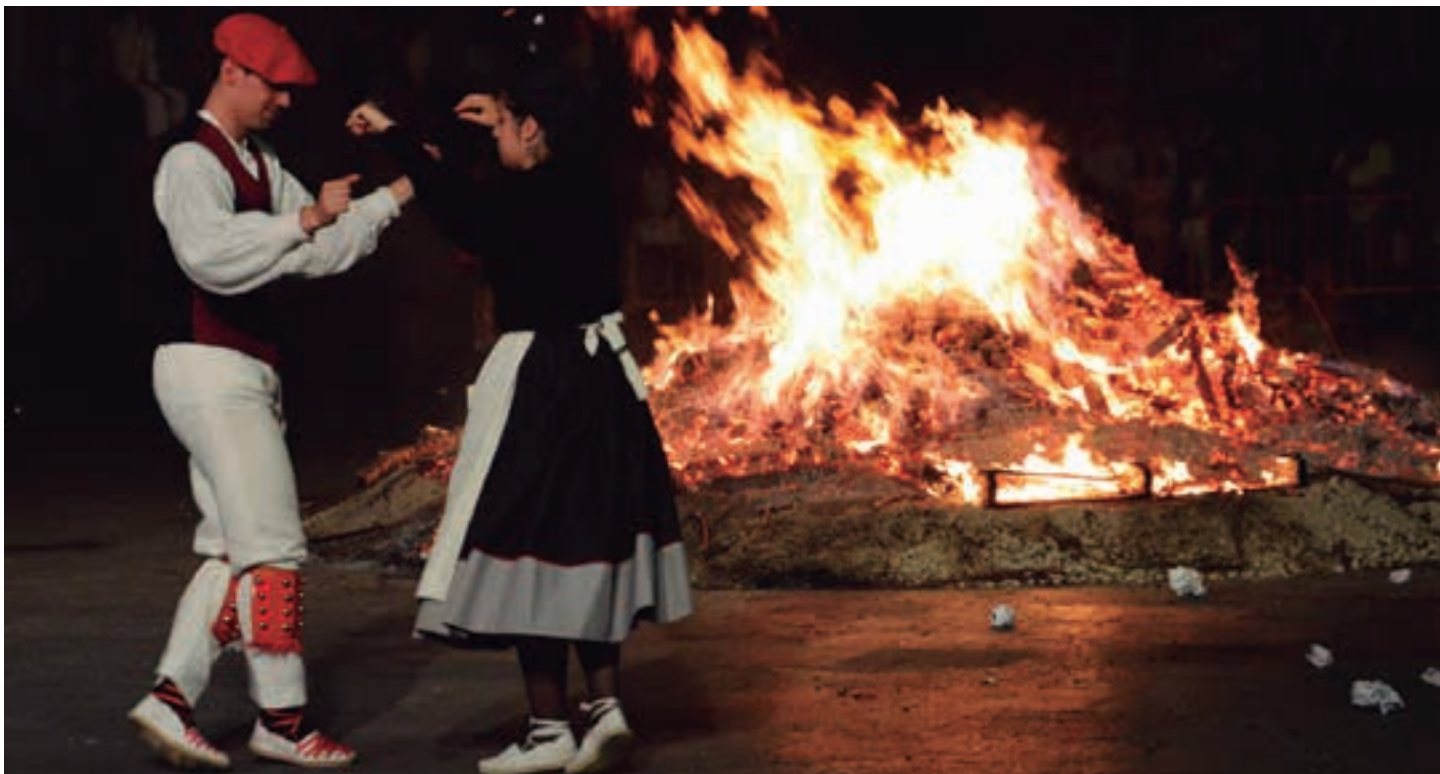
Urki dantza tadeko kideek emanaldi ikusgarria eskaintzen dute, Goikoplazan. AIURRI