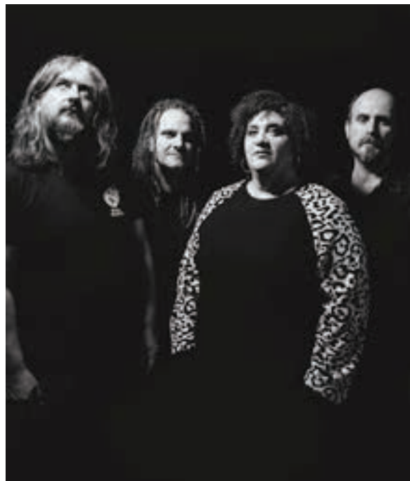
Zea Mays. ZEAMAYS