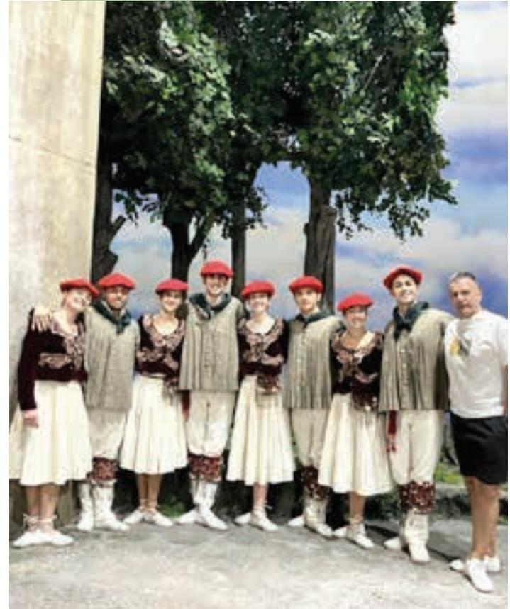
Aukeran Dantza Konpainiako dantzariak, Muruamendiarekin batera. AUKERAN

tza da nagusi Aukeraneke kideak agertzen garenean. XX. mende hasieran sortutako obra bat da “El caserio”. Gidoiari berrikuntzaren bat edo beste txertatu al zaio ehun urteren ostean? U.S.L.: Edukiari, ideiarri dagokionez, ez nuke esango. Jatorrizkoaren pareko jarraitzen duela esango nuke. U.I.U.: Madrildik hona ekartzean aldaketak izan ditu, baina ikuspuntu teknikitik, espazio bakoitzak dituen baliabideen eta azpiegituraren arabera. Ez da zarzuela batean dantzatzen duzuen lehen aldia. Nola uztartzen da zuen dantza antzerkiarekin eta musikarekin? U.I.U.: Ondo moldatzen gara. Egia da, tarteka, konplexua dela abesbatzarekin kooordinatzea, eta, gainera, zuzenekoetan beti egoten dira, emanaldi batetik bestera, desberdintasun txikiak. Beraz, horiei moldatu behar. Entsegu asko egin dituzue bi emanaldiei begira. U.I.U.: Astebete inguru daramagu hemen entseguekin. Lehen hiru