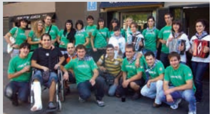
Poxta Zaharreko kideak, 2009ko Sanmieletan. AIURRI