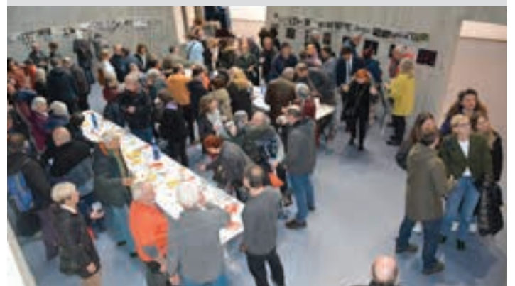
Ekitaldiaren ostean hamaiketako egin zuten.