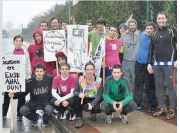
Korrika 2015ean, Urnietatik igaro aurretik. AIURRI

Sanmielen atariko bertso-afaria, urte amaierako San Silbestre lasterketa, hitzaldiak, kontzertuak, mendi-irteerak... Ekitaldi ugari antolatu ditu elkarteak hogei urteotan. Garrantzi handiko eragilea da, Urnietako gizarte-bizitzan.