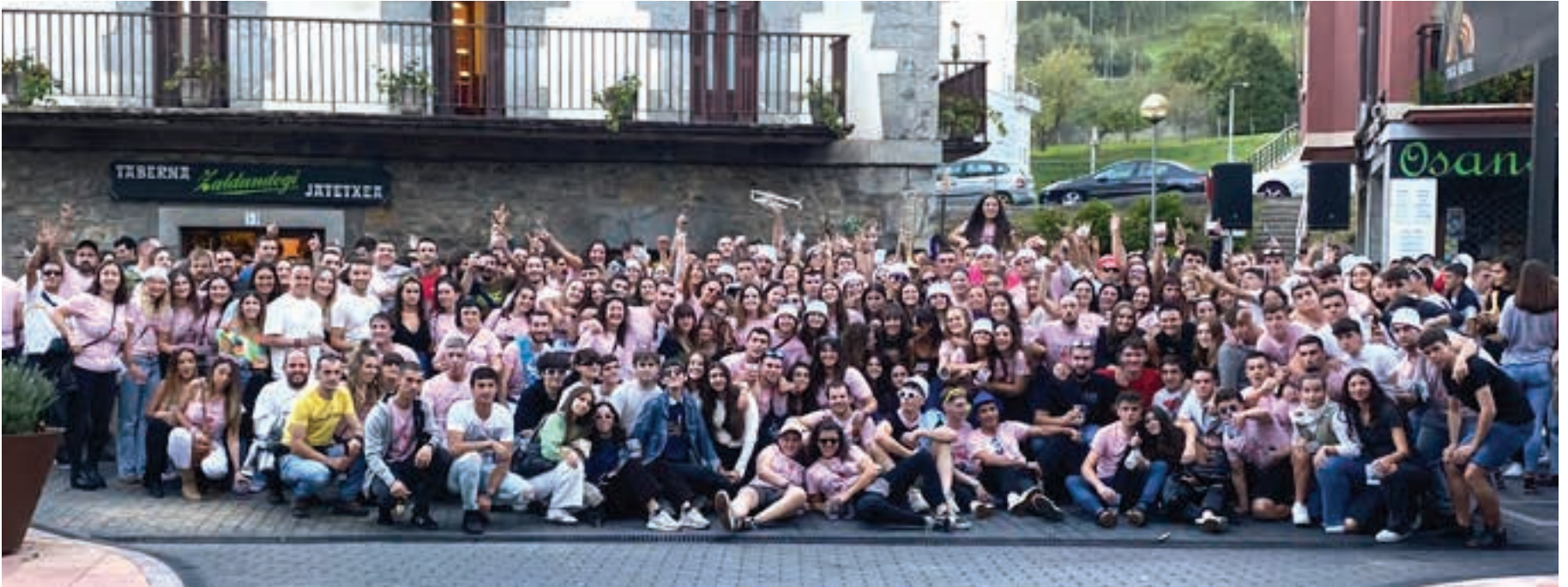
2022ko Sanmieletan jendetza elkartu zen Idiazabal kalean, kuadrillen egunean. POXTAZAHAR