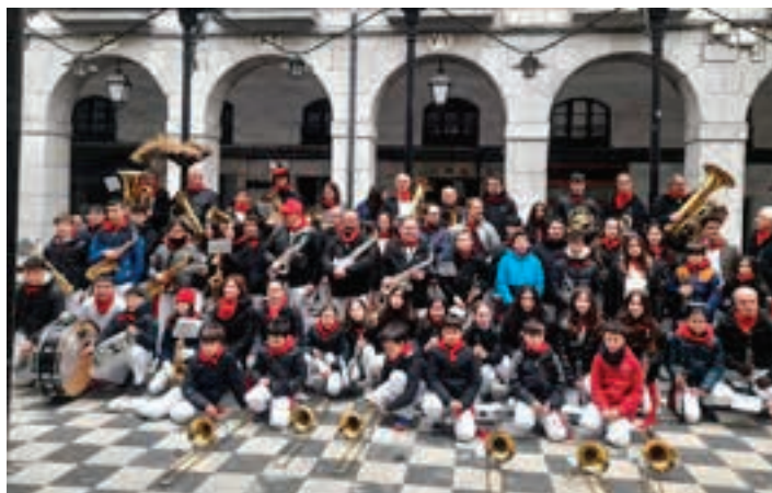
Tolosako Udal Banda Gaztea eta Gora Kaletxiki Banda, Tolosan. GORA KALETXIKI

Andoaingo taldearen hogeigarren urteurrena kalejira batekin ospatuko dute, larunbat honetan