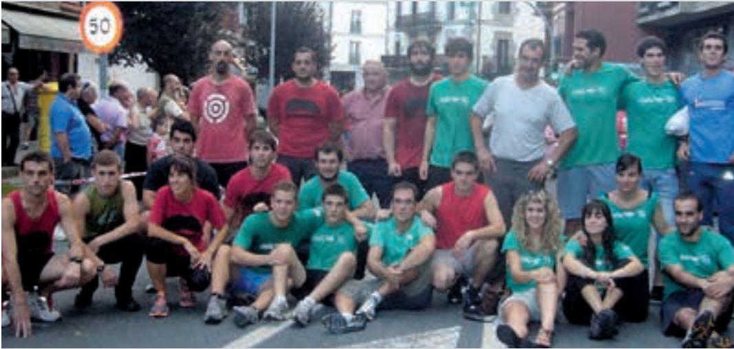
2012ko Sanmieletan, Sansonarri (gorriz) eta Poxta Zahar (berdea) lehiatu ziren Idiazabal kalean.

Goiko argazkiko desafioak zeresan handia eman ohi zuen, Urnietan. 2012an, irailaren hasieran, erronka bota zion Sansonarri Poxta Zaharri. Idiazabal kalean lehiatu ziren, eta Sansonarri izan zen garaile. Ondorioz, hitzartukoari jarraituta, gazteek afaria prestatu zieten irabazleei.