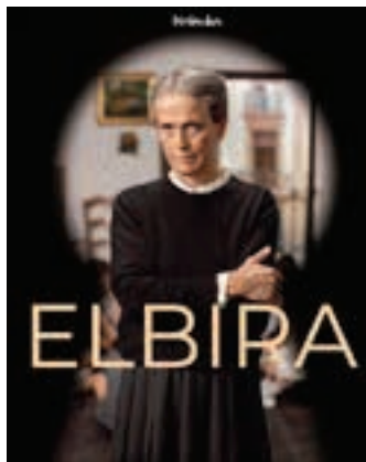
Dokumentalaren kartela.