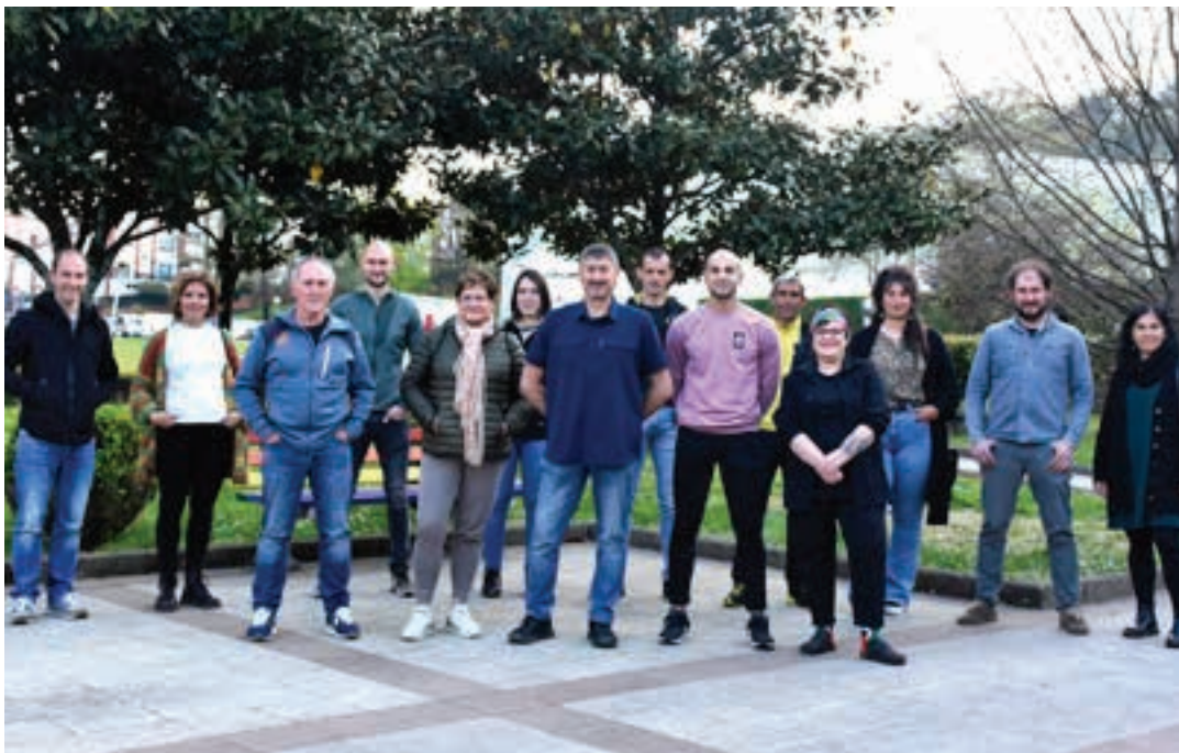
Astearte arratsaldean egin zuten aurkezpen ekitaldia. AIURRI