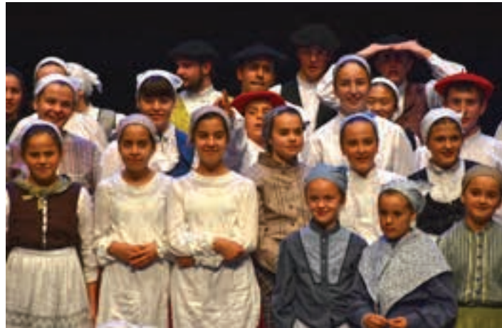
Urki dantza taldea, 2019ko edizioan.

Macaco taldeak ibilbide oparoa osatu du, eta "Vielame el corazon" disko berriena aurkeztera dator. 20:00, Bastero. 12 euro.