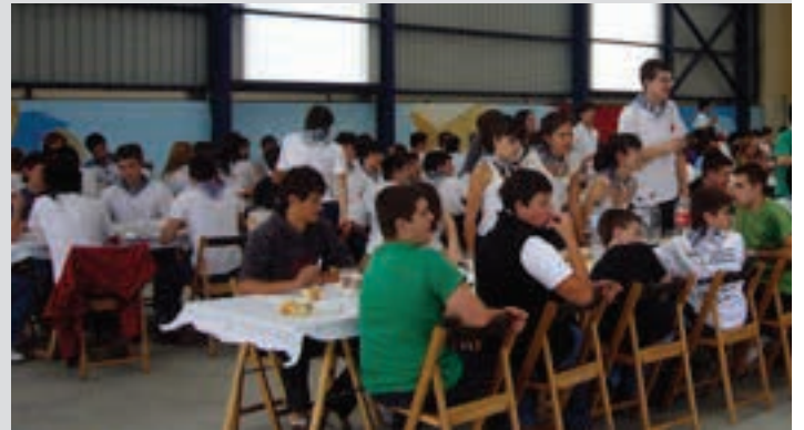
Herri-bazkariak indar handia dauka Gazte Festetan. Argazkia 2010ekoa da.