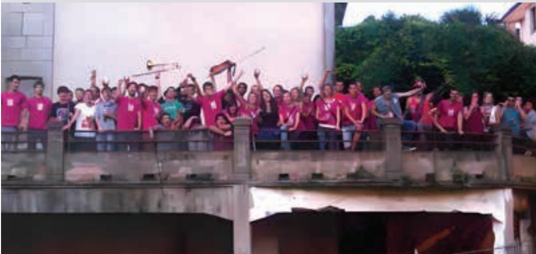
Elektro-txaranga ezinbesteko osagai bilakatu da gazteen ekitaldietan. Mikaela-Enean, 2014an. POXTA ZAHAR