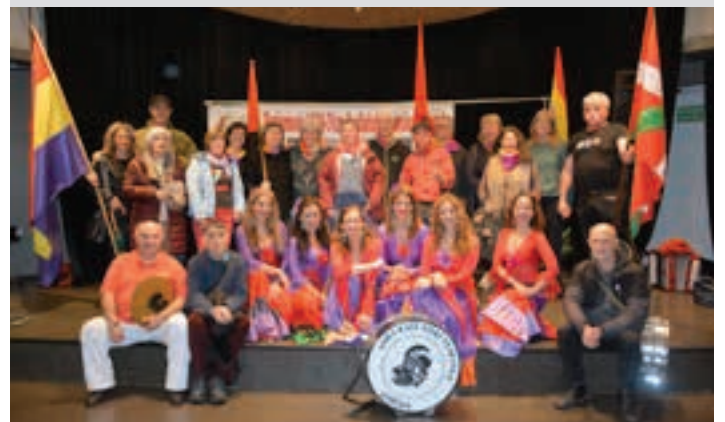
Abeslariak, musikariak eta dantzariak elkarrekin. AIURRI

Omenezko agurra Euriaren eraginez, ekitaldia Bastero Kulturguneko ekitaldi aretoan egin zen. Ohi bezala, biktimen omenezko agurrarekin eta lore-eskaintzarekin hasi zen ekitaldia. 25 lagun dira desagerrarazitakoak eta eraildakoak.