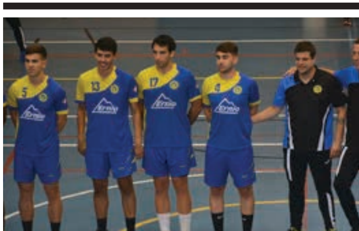
Leizaran taldeko kideak, artxiboko irudian. LEIZARAN