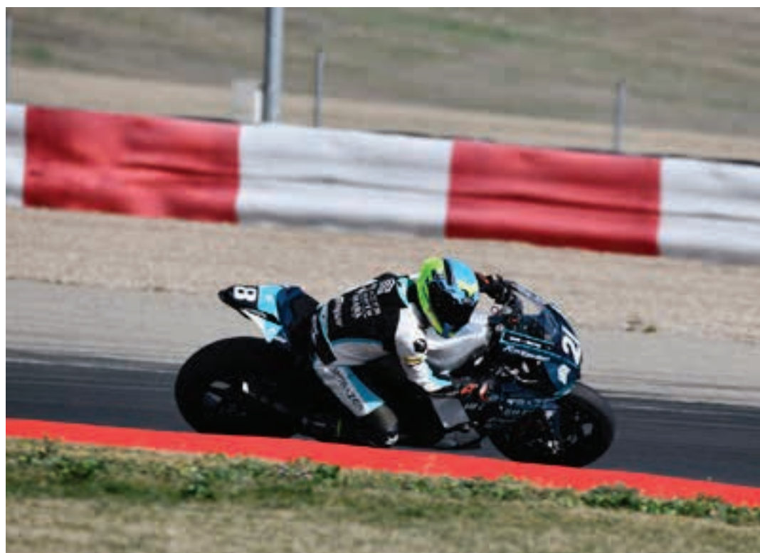
Probaz gozatzeraz doaz eta horretarako ezinbestekoa izango da arazo mekanikoak saihestea. CARRACEDO

zara. Erresistentzia landu dut, batez ere, prestakuntzan, azken urte erdian". Nola ote da gauez