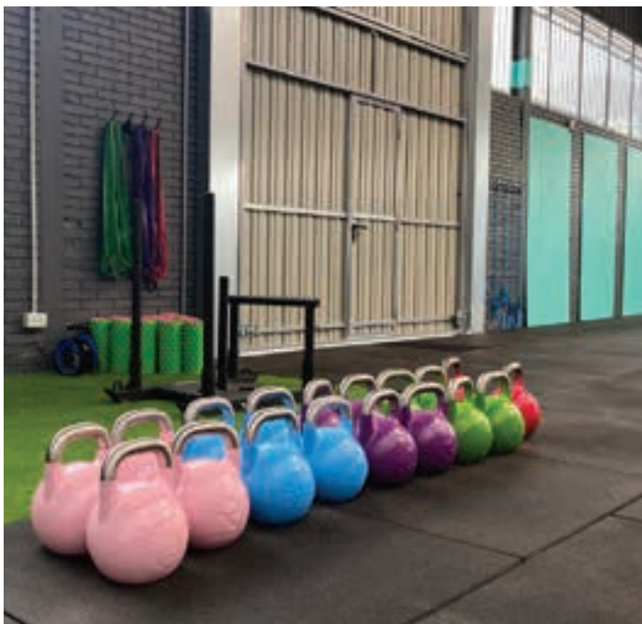
Instagram eta webgunearen bidez harremanetan jartzeko aukera dago. AIURRI

Zer sentitzen duzue jendeak aurre- rapausoak ematen dituela ikustean? U.P.I.: Poza ematen dit jendearen motibazioak gorantz egin duela ikustean. Orain hamar minutu