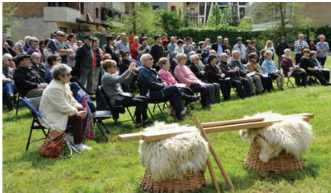
2019ko ekitaldiko irudia. Lehen lerroan, frankismoaren lehen kolpe latza pairatu zuen belaunaldia.

Lehena. Horiei guztiei, frankismoaren "biktima" izatea beraiek hautatua ez izan arren, halakotzat ere jo behar ditugu, eta gorazarre egin. Zutik, errespetuz eta duintasunez eutsi zioten beren familiarren