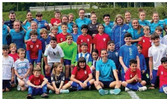
Euskaldunako jokalarri gazteak pozarren hurbildu ziren jokalarriengana. EUSKALDUNA