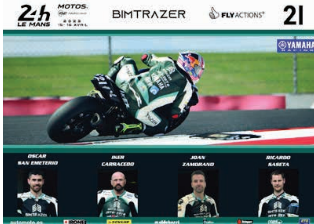
Bimtrazer Fly taldearen aurkezpen fitxa, Le Mans-eko lasterketan. LEMANS

Topera joaten omen dira beti, ordubetz, eta zortzi txandatan. Nekea areagotuz joaten da, "eta fisikoki oso indartsu egon behar