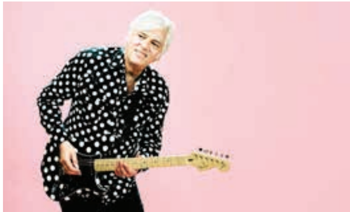
Robyn Hitchcock.