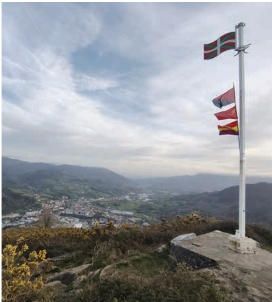
Astearte iluntzean jarri zituzten bandera ezberdinak, Buruntzako ikurrinari eusten dion mastan. AIURRI