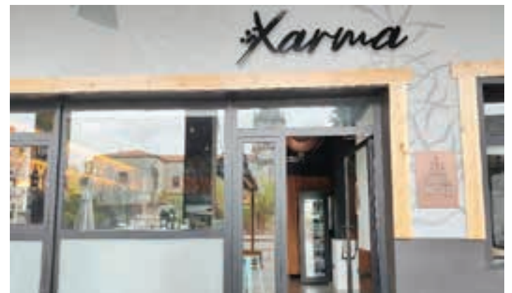
Taberna zabalik dago, Goikoplazan. AIURRI

"EKITALDIK ANTOLATU NAHI DITUGU LOKAL BARNEAN NAHIZ TERRAZAN"