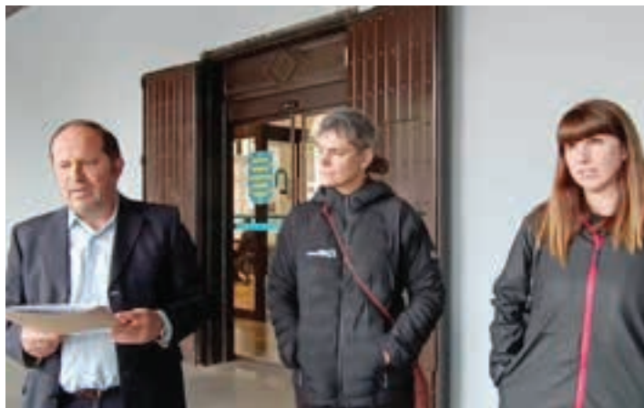
Plataformako eta Aita Larramendi ikastolako ordezkariak.

Lanen lizitazioa eta lurren lagapena bertan behera uztea eskatu dute ikastolak eta plataformak