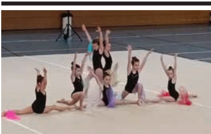
Apirilaren 1ean egin zuten erakustaldia, Allurralden.