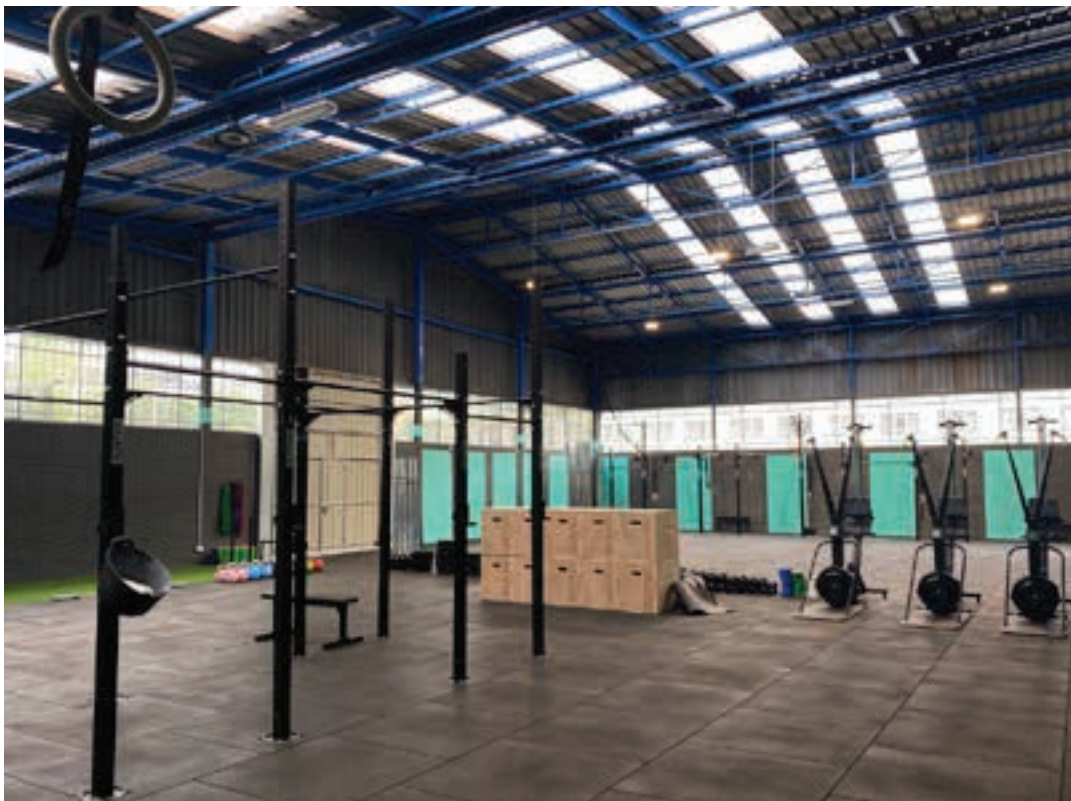
Urnietako Erratzu industrigunean dituzte instalakuntzak. AIURRI