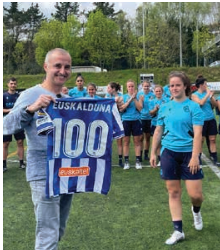
Parada lehendakariak oroigarria eskaini zion Realari, Eizagirreraren bidez. EUSKALDUNA