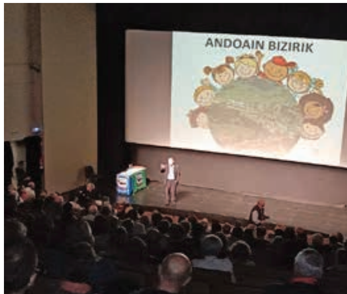
Herri bilera deitu zuten Bastero Kulturgunean, aurreko larunbatean.