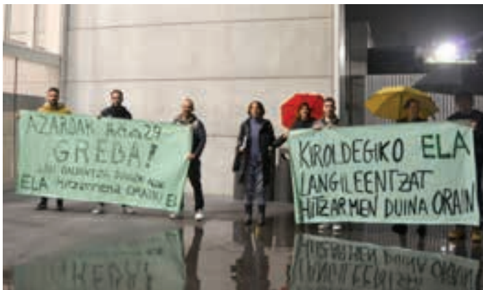
Aurreko ostiralean kalez kale ibili ziren, Urnietan. AIURRI