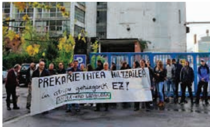
Elkarretaratzea egin zuten enpresaren kanpoaldean. AIURRI

Nazkatuta daudela aldarrikatu dute langileak, "gure lan eta bizi-baldintzak hobetuko dituen hitzarmen bat beharrezkoa ikusten dugu". Hala, aurrera begira, aipatu bezala, hiru greba egun ezarri dituzte: "Kiroldegiko langileak lan-hitzarmenaren alde!".