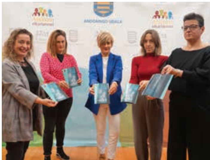
Udalerrri osoan zabaldu dute eskuorria. AIURRI

Emagin elkarteak egin du diagnostiko-lana eta beren arabera, etorkizunari begira lau