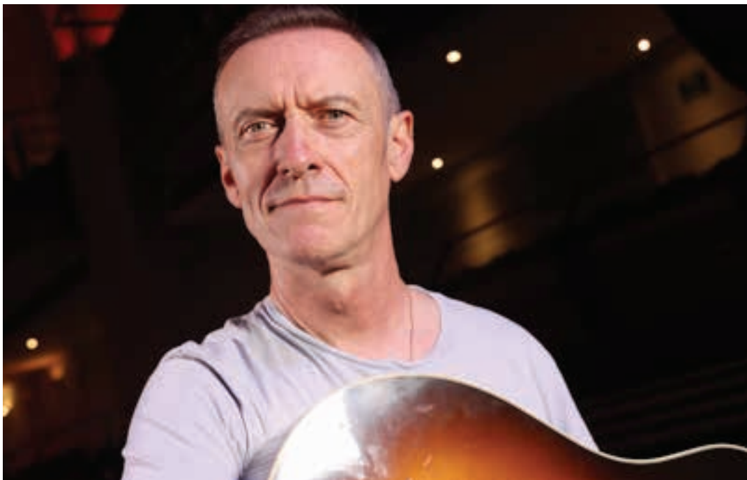
Disko berriarekin aurkezpen bira abiatuko du Euskal Herrian barrena, Andoaindik abiatuta. TTAP