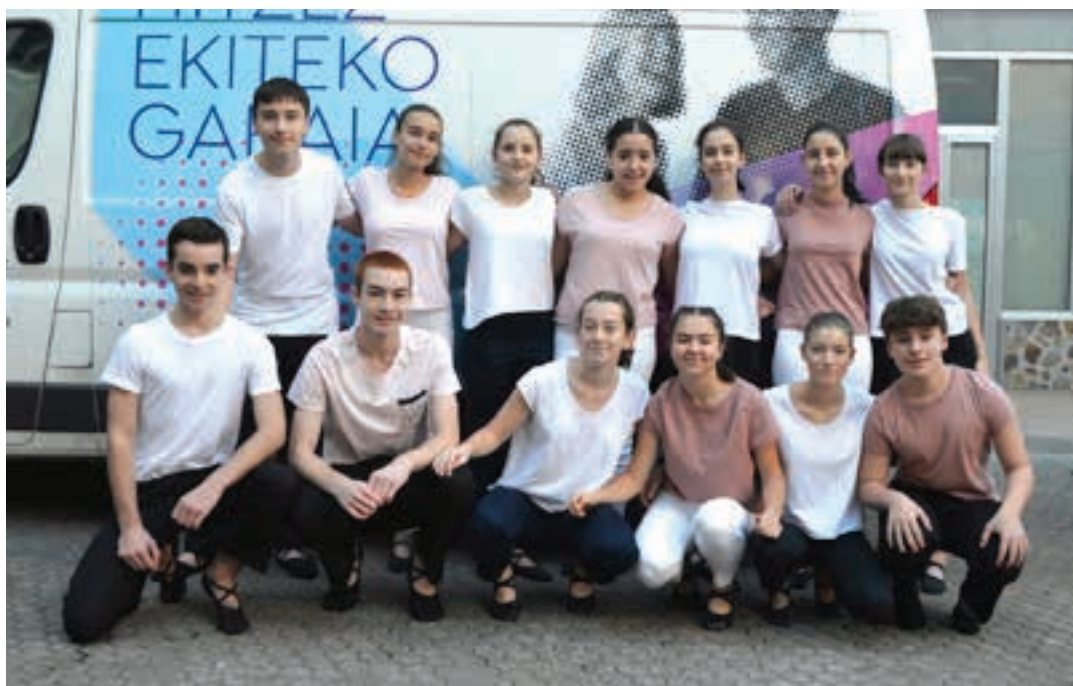
Egape Dantza Taldeko kideak, Zubitxo plazan egindako emanaldiaren ondoren . AIURRI