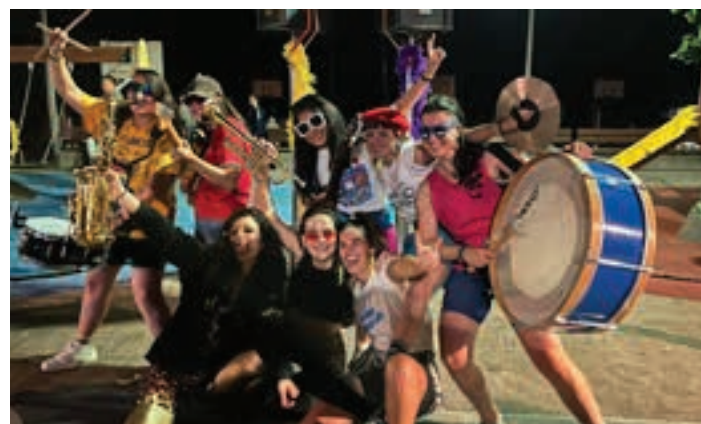
Andoaingo kideak biltzen ditu bere baitan Elektropottotte taldeak. ELEKTROPOTTOTTE

Herritar batzuk jada hurbildu dira haien txapak jasotzera eta arropari begiratu bat ematera. Euskaraldiaren gaineko edozein informazio jaso nahiko bazenu ere, bertan eskainiko dituzte argibideak.