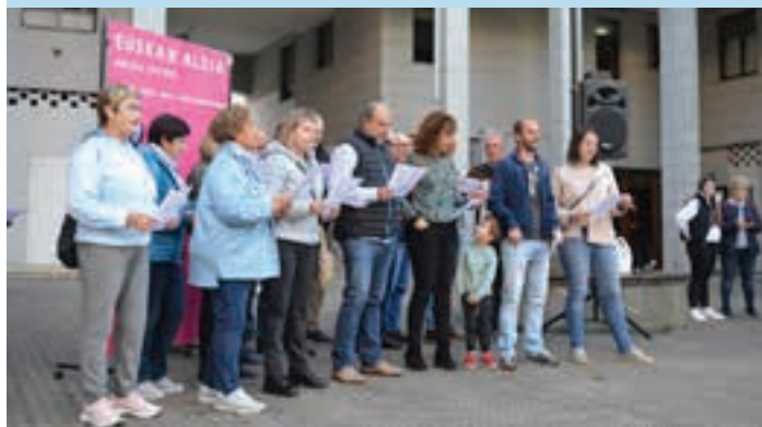
Kantuan aritu ziren, Zubitxo plazan. AIURRI

Sentsibilizazioa Bertso eskolako kideek "Egun da Santimamiña" kantari letra aldatu zitoten, Euskaraldiari lotutako koplak sortzeko. Kopla horiek herritarren artean banatu zituzten, elkarrekin abesteko.