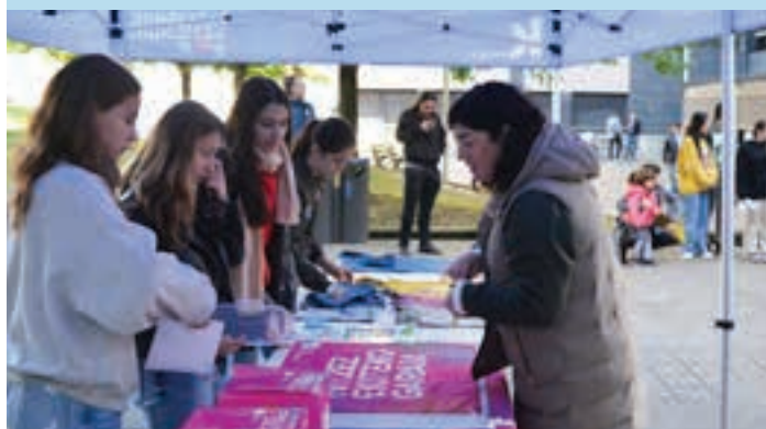
Banderolak eta arropa erosteko aukera izan zen. AIURRI

Sentsibilizazioa Bertso eskolako kideek "Egun da Santimamiña" kantari letra aldatu zitoten, Euskaraldiari lotutako koplak sortzeko. Kopla horiek herritarren artean banatu zituzten, elkarrekin abesteko.