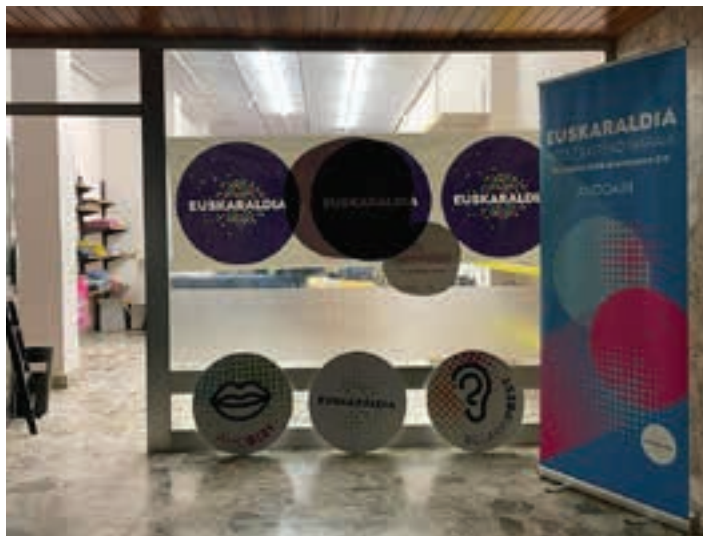
Kale Nagusian zabalik dago Euskaraldiaren egoitza. AIURRI

Herritar asko dabilta Euskaraldiko txapak non jaso daitezkeen galdezka. Bada, Andoaingo Euskaraldiak ZASako lokala ireki du horretarako: Kale Nagusiko 33. zenbakian dago. Astegunetan, asteazkenetik ostiralera irekiko da; 17:30-20:00 bitarteko zabalik izango da. Azaroaren 12ko eta 17ko larunbatetan, aldiz, goizaldean egongo gara bertan, 11:30etatik 13:30era.