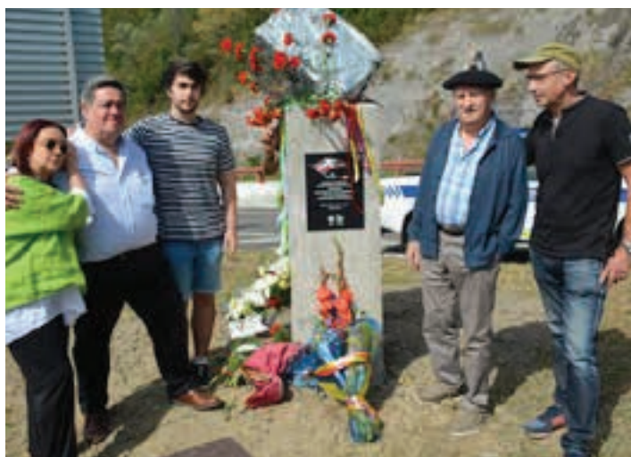
Herederu usurbildarraren eta Irulegi andoaindarraren senitartekoak, ekitaldian. AIURRI