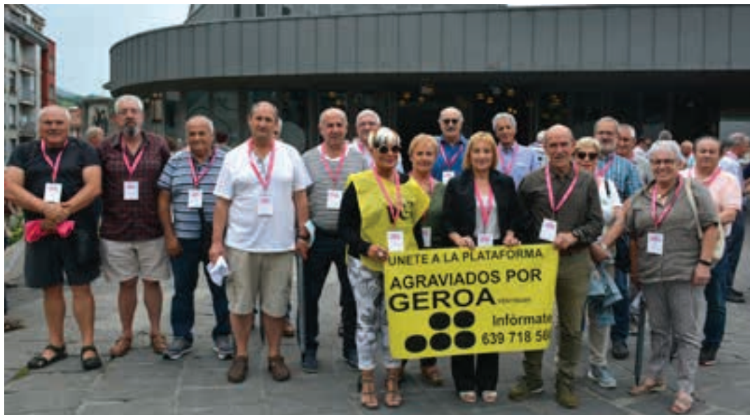
Andoaingo zenbait kaltetu, Basteron ekainean egindako batzarrean. AIURRI