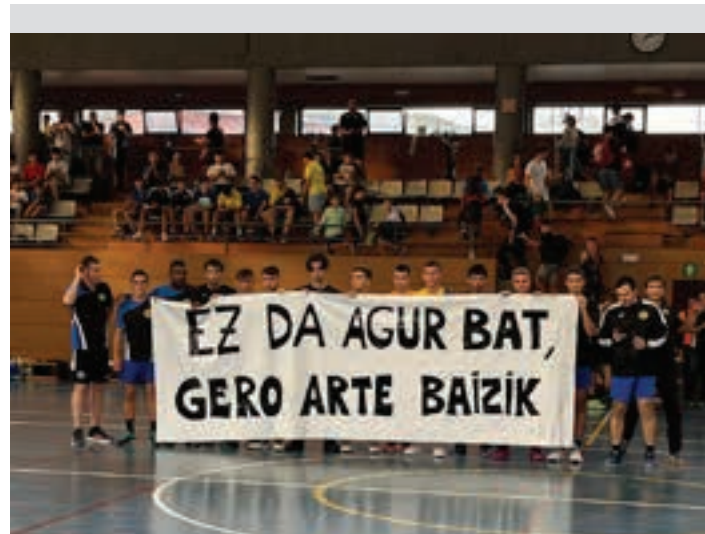
Lagunek adierazpena irakurri zuten, Allurralden. LEIZARAN

Asko gara era batera edo bestera gure aletxoa jartzen dugunak gure nahiak bete daitezten. Beraz, gure aitormenik zintzoena klubeko bazkideei, gure gurasoei, epaileei, erakunde babesleei, erakunde publikoei, elkarte gastronomikoei eta merkatariei, lantaldeei eta zuzendaritzari".