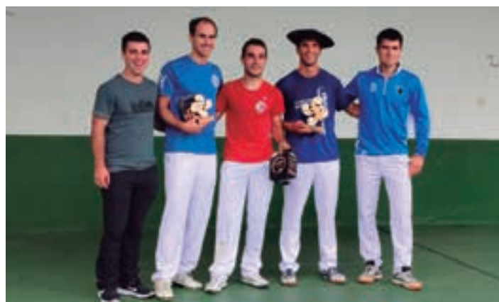
Sari banaketa ekitaldia. XOXOKAKO JAI BATZORDEA