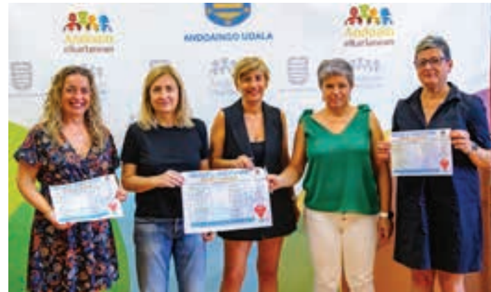
Ekimenaren aurkezpena egin zuten aurreko astean. UDALA