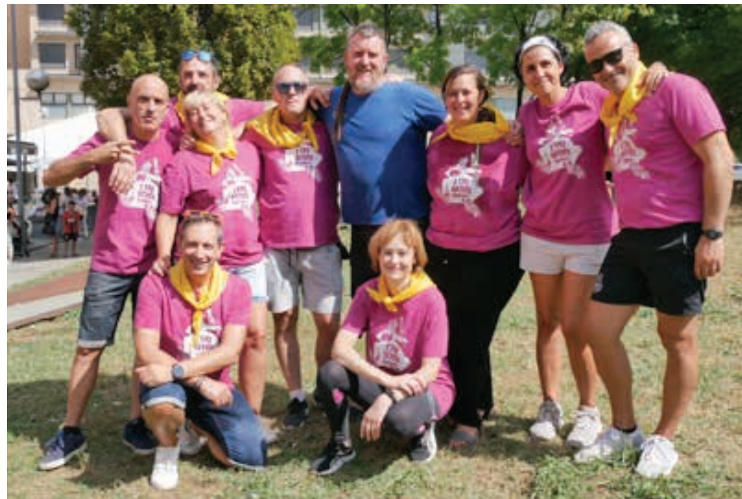
Talde lanari esker egiten dira jaiak Etxeberri plazan.

Etxeberri plaza bizigune berri samarra da Urnietan, eta haren inguruan hainbat familia ekimen handia erakusten ari dira. Auzoko festak ospatu berri dituzte, eta festara udalerriko gainerako herrikideak hurbildu dira