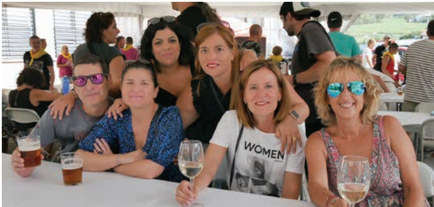
Auzo bazkaria egin zuten, larunbat eguerdian. Auzoko gurasoak eta familiak elkartzeko hitzordu aproposa. AIURRI