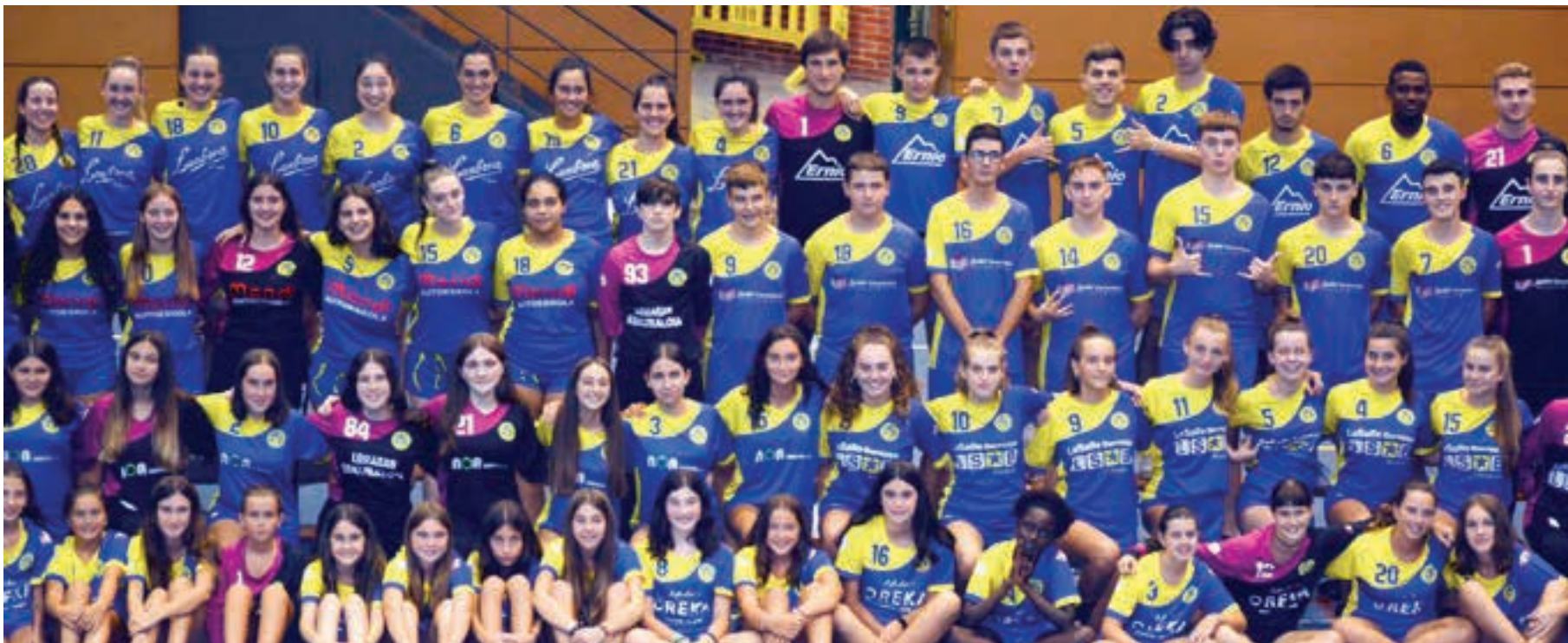
Hamahiru talde aurkeztu ditu Leizaran eskubaloi taldeak, denboraldi honetarako. Aurreko asteko aurkezpenaren argazki-bilduma eta bideoak Aiurri.eus webgunean ikusgai daude. AIURRI