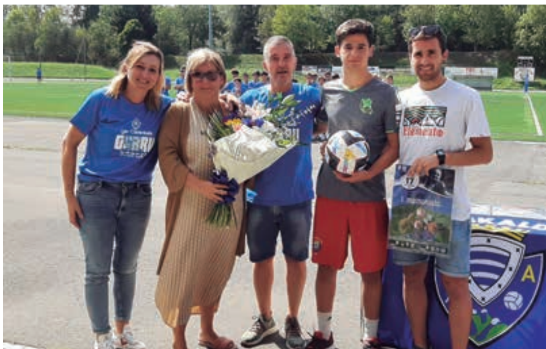
Euskaldunako zuzendaritzako kideak Gurruren senitartekoekin batera, omenduaren memorialean. EUSKALDUNA