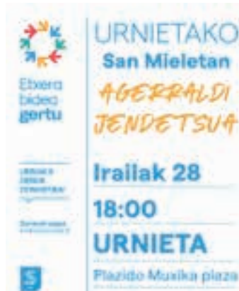
Etxeraten afitxa. ETXERAT

Jaiak hurbildu ahala, salgai jarri dituzte herri bazkariko txartelak. 13 euroan Zaldundegin eta Matxon salgai daude. Begetarianoak kontuan hartu dituzte. Aurtengoan, larunbatean izango da herri bazkaria, urriaren lehenean. Poxta Zahar taldeak beste bi hitzordu nagusi antolatu ditu egun berean: elektrotzaranga eta kontzertuak.