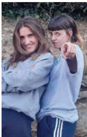
Itxaso eta Nago.

N.H.: Taldekide guztiak neskek eta genero disidenteeak izatea eta eredu maskulino horri lekuri ez egitea hautu politiko bat da. Elektrotzaranga ulertzeko modu gehiago daudela erakutsi nahi dugu.