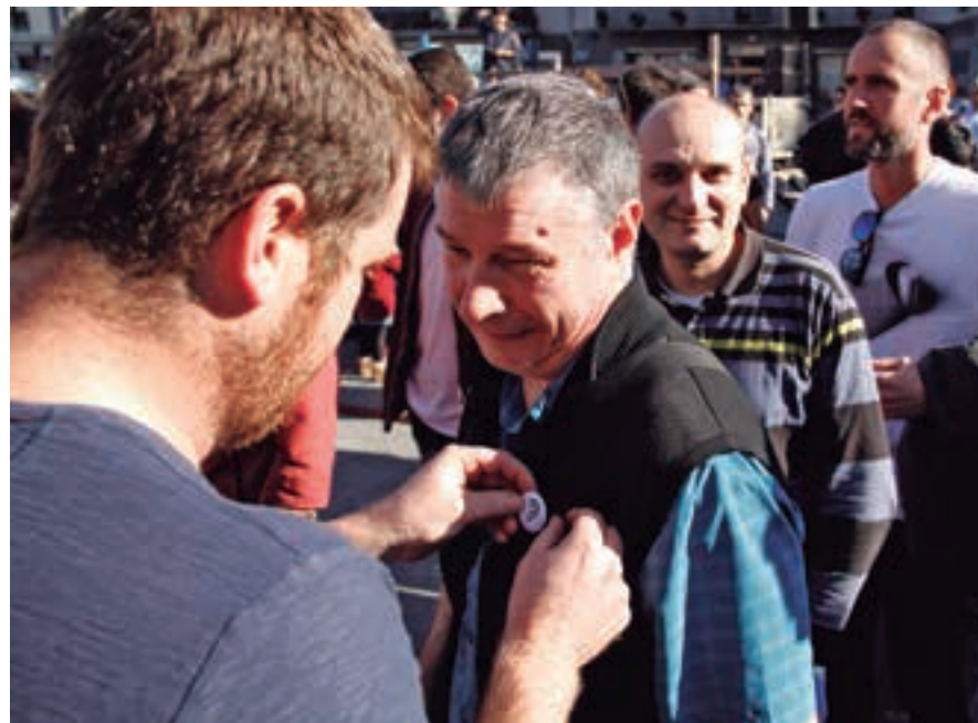
Ahobizi eta Belarriprest aritzeko ariketa azaroan hasiko da. Hori baino lehen, Euskaraldiaren ospakizuna izango dugu Andoainen. Datorren ostiralean, hain zuzen, arratsaldeko 19:00tan hasita. AIURRI