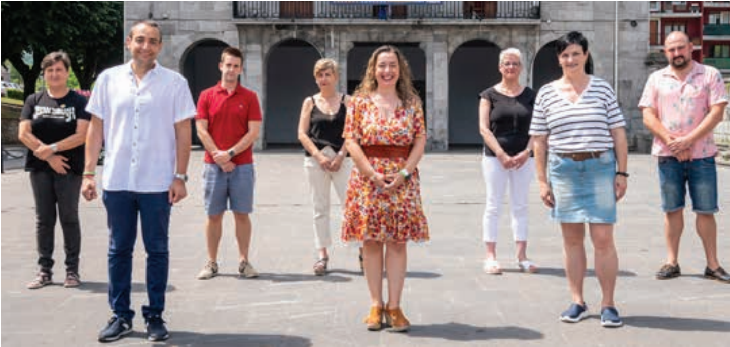
Andoaingo PSE-EE eta EAJ-PNV alderdien agerraldi bateratua, artxiboko irudian.