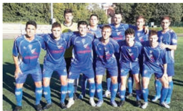
Sari nagusia etxean geratu da, aurtengo edizioan.

ROGLIC TXAPELDUN HANDIA DA. ERORKETAK VUELTA IRABAZTEKO AUKERA EBATSI DIO