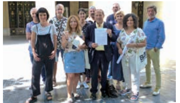
Herri plataformak Aldundian alegazioak aurkeztu zituen unean. AIURRI

Bestalde, gaiarekin zerikusia duten eragile guztiei gonbitea egiten die "andoaindar guztien interesak kontuan hartuko dituen bide bateratuari ekiteko. Bihartik aurrera, plataformak helburu hori lortzeko lan egingo du".