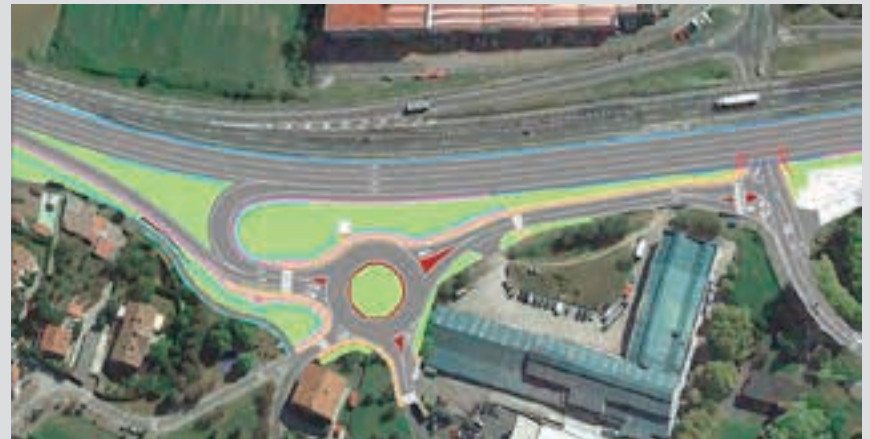
C2 proiektuak Sorabillan, Erretoretetik oso-oso gertu, biribilgune bat eta begizta bat ipintzea eta errail kopurua handitzea aurreikusten du. SORABILLA-ERROTAGAIN

C2 proiektuak ez du pantaila akustikoak eta zoru isilak instalatzeko neurririk aipatzen, eta ez da jasotzen Eragin Akustikoaren Azterketak proposatutako neurririk: "pantaila akustikoak (hesiak) eta zoru isilaren erabilera zehatz-mehatz aztertzea eskatzen da".