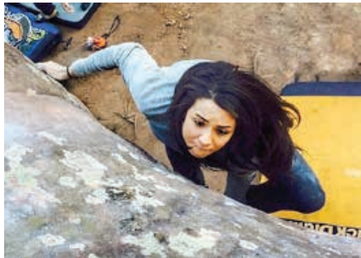
‘Amagana’ Itziar Zabalen filma da. AMAGANA

DATORREN OSTEGUNEAN MENDIZALEEK HITZORDUA DUTE, SAROBEN