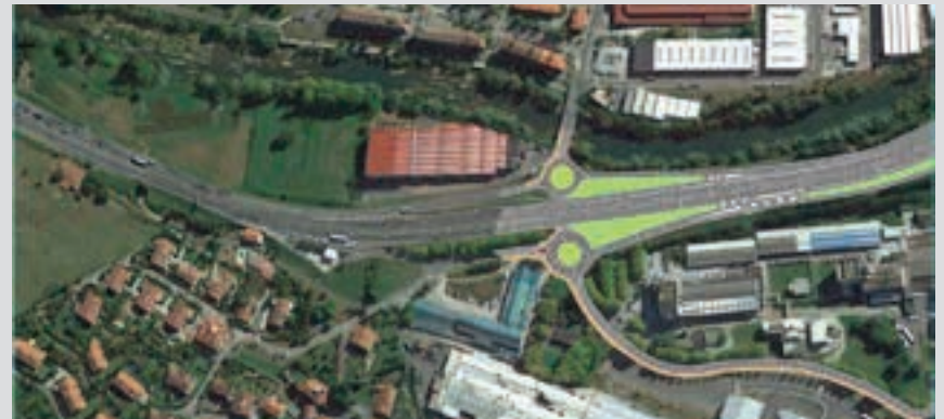
Sorabilla-Errotagain elkartek planteatzen duen biribilgune bikoitza. SORABILLA-ERROTAGAIN