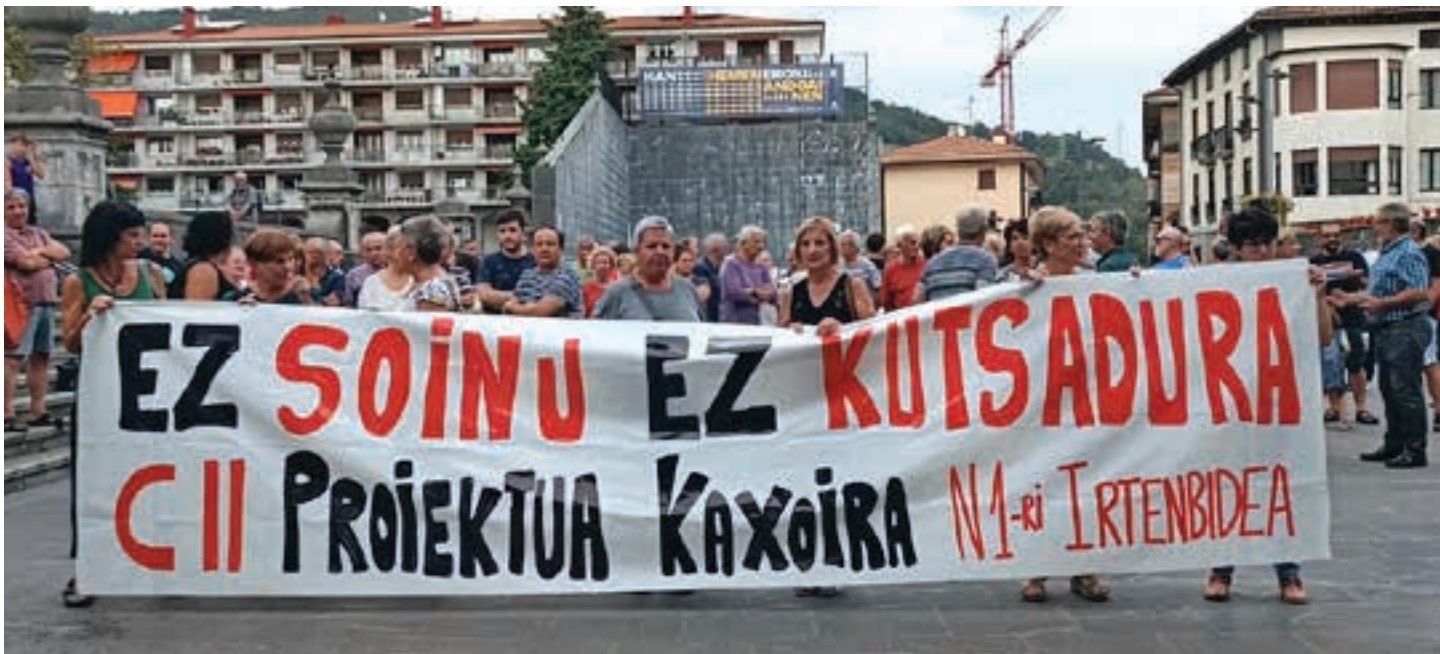
Irailaren 12an ez ohiko plenoa egin zen Andoainen. Herri plataformak mezu argia zeraman pankartan. C2 egitasmoa kaxoian sartzeari eskatzen dute. AIURRI