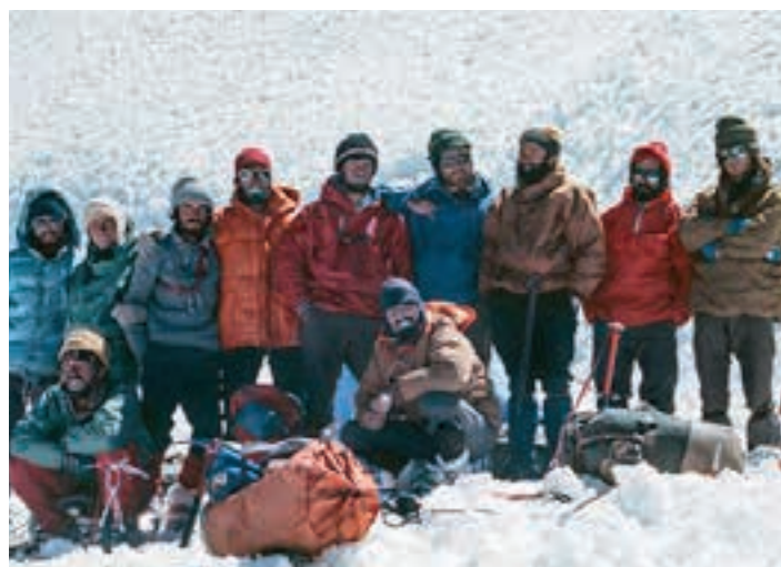
‘Mendiak 1976’ ikus-entzunezkoaren irudietakoa. MENDIAK1976