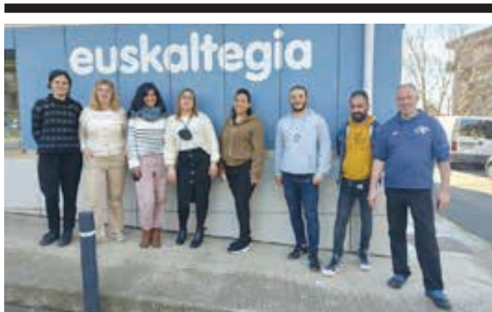
laz abiatu zen ekimena. AIURRI