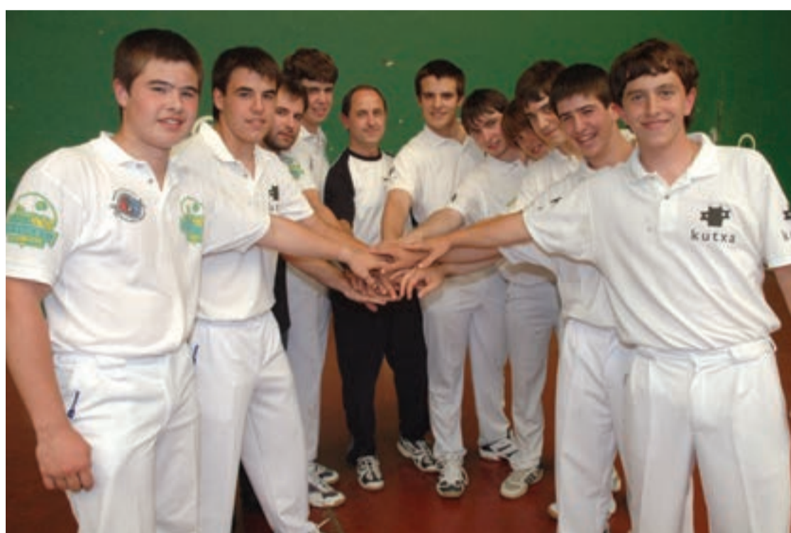
Arrate pilotalekuan denboraldiko azken partida jokatu dute. Ez dira agurtuko zaletuen laguntza eskertu gabe.

Andoaingo taldeak denboraldi borobila egin du, final aurrekora iristea sekulakoa baita.