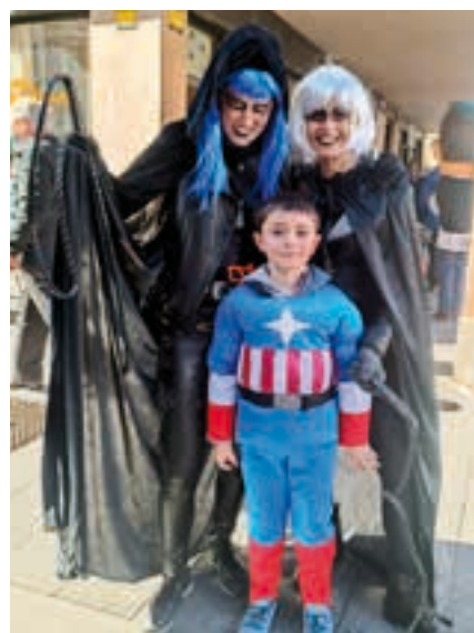
Super Heroiak Andoainen ikus zitezkeen.