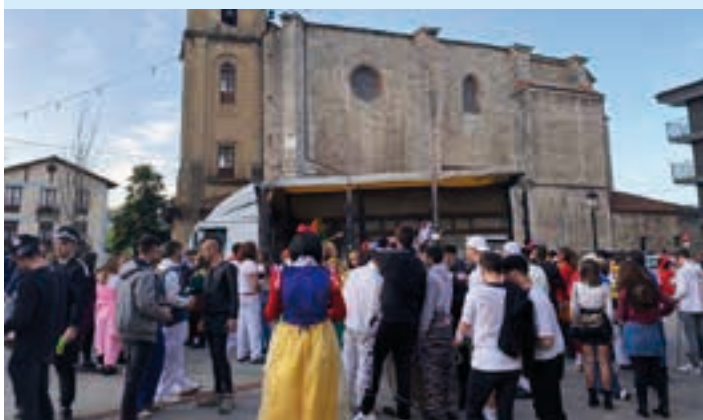
Poxta Zahar taldearen arratsaldeko kalejira. AIURRI

Kalez kale Arratsaldean ere izan zen zer gozatua. Idiazabal kalean barrena ibili ziren hara eta hona zenbait talde, alde zurretik prestatutako koreografiak jendaurrean erakusteko. Talde handian edo koadrilan, jende asko murgildu zen inauteri festan.