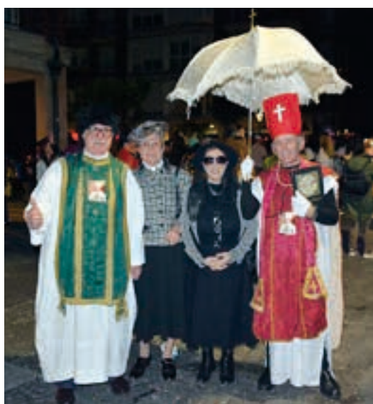
Batzuk ez dira mozorro bakarria janztearekin konformartzen. AIURRI