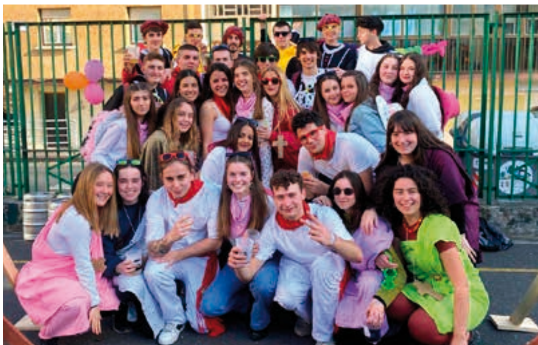
Gazteak ospakizunez gozaten ikustea pozgarria izan zen. Askorentzat lehen bazkaria izan zen. AIURRI