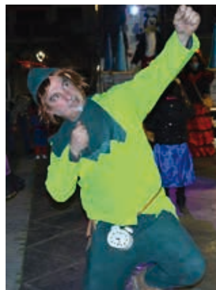
Kamera aurrean bikain. AIURRI