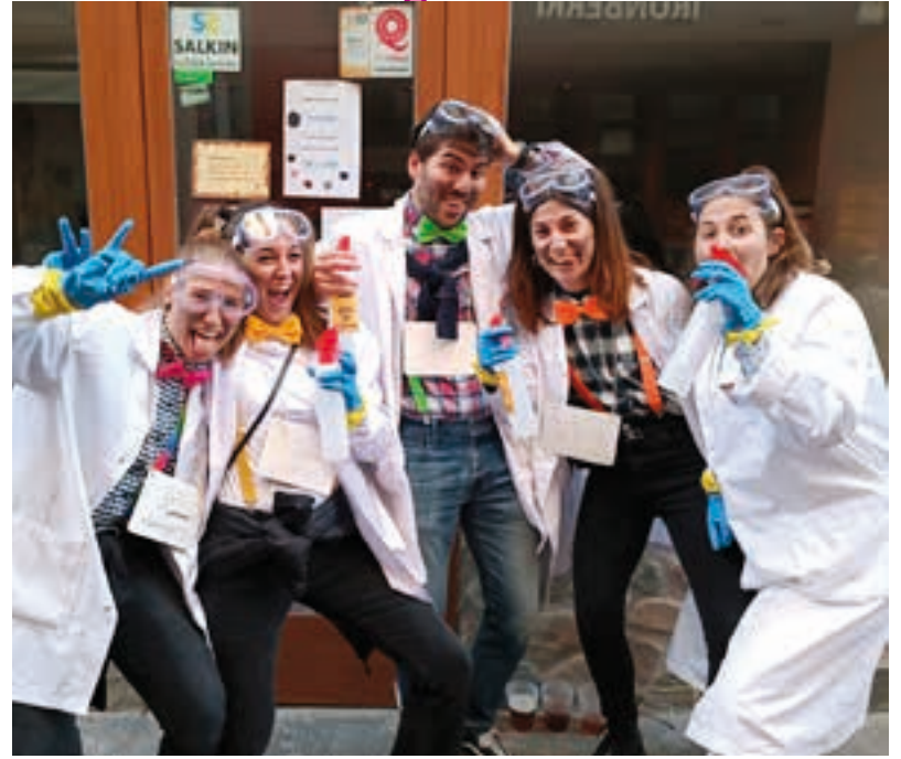
Ez zen izan goiz ona laborategian, bai aldiz laborategitik irteterakoan! AIURRI