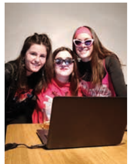
Irunberriko DJ hirukotea. AIURRI