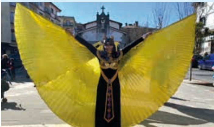
San Juan plaza, ospakizunen abiapuntua. AIURRI

Plazaz plaza Eguerdia partean, karroza musikatua izan zen San Juan plazan, eta dantza ikusgarriak egin zituzten egipziarrez mozorrotuta. Dantza saio gehiago eskaini zituzten herrian zehar. Eguraldia lagun izan zuten egun osoan.