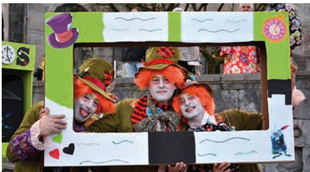
Argazki hauek eta askoz gehiago ikusgai daude Aiurri.eus webgunean. AIURRI