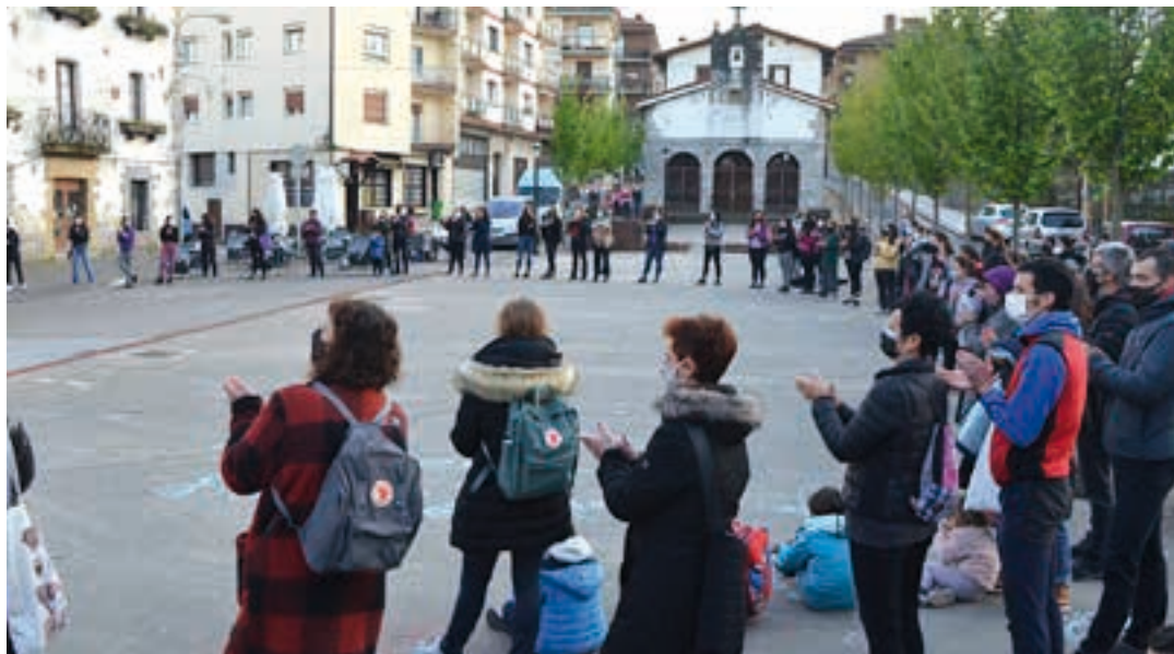
lazo elkarretaratzearen amaiera. Aurtengo hitzordua martxoaren 8an izango da San Juan plazan, 18:00tan hasita. AIURRI

Martxoaren 8ko ekitaldien baitan, jabekuntza eskolaren aurkezpena egingo dute martxoaren 9an. Antolatzaileek adierazi bezala, "Jabekuntza eskolan parte hartu nahi duten emakumeak euren artean ezagutzeko espazioa izango da"