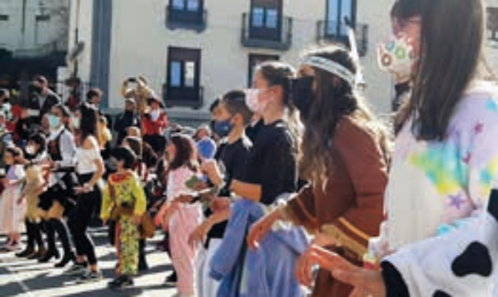
La Salle Berrozpe ikastetxeak dozenaka lagun elkartu zituen eguerdian.

Plazaz plaza Desfilerik ez egitea erabaki zen Andoainen, eta kalejira bakarrak erraldoi eta buruhandiena eta txistulariena izan zen. Pandemia aurreko partaidetza lortu ez bazen ere, herrikide ugari mozorrotu eta inauteri festan murgildu zen.