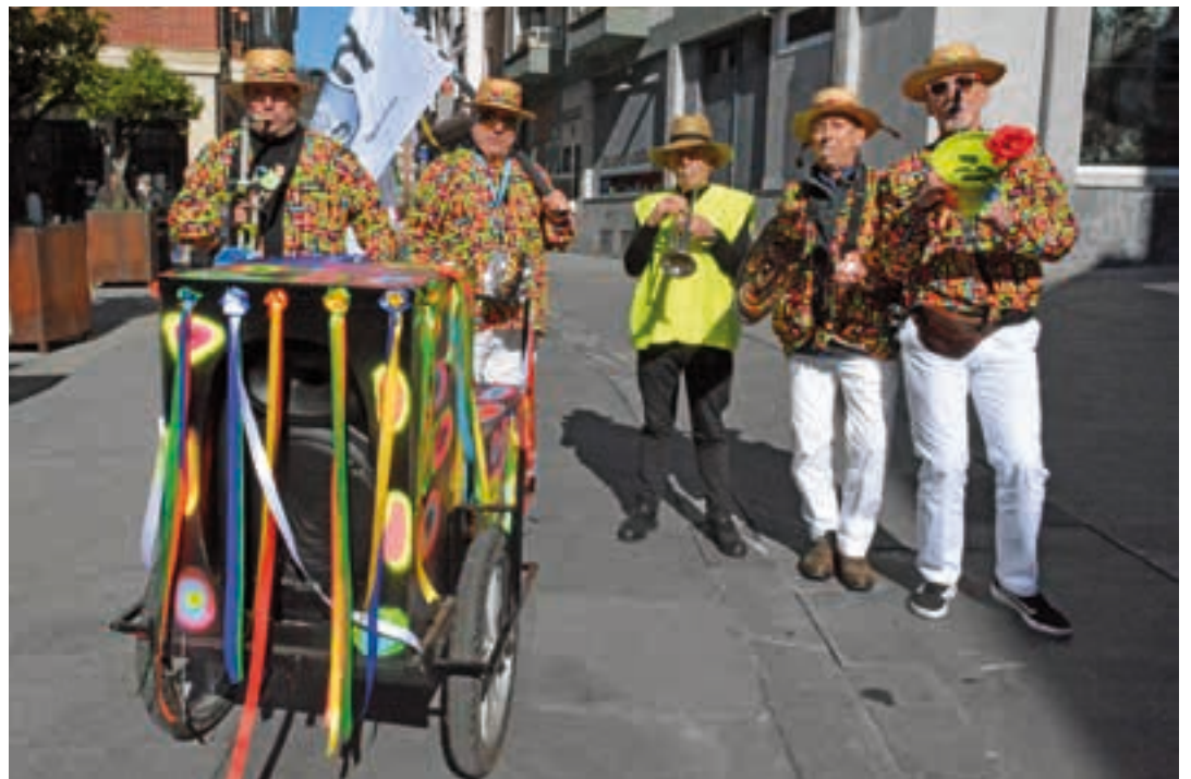
Txaranga doinuen sortzaile itxura osoa izan arren, megafoniaz lagunduta kalejiran ibili ziren. Hutsik egiten ez duen taldea da. AIURRI

lazko etenaldiaren ondoren, inauteri festa berreskuratzeko ahaleginak ezinbesteko laguntzailea izan du: Eguraldia. Eguzkitsu eta epel igaro zen larunbata, eta hari esker kalez kale bizitako ospakizuna bikaina izan zen