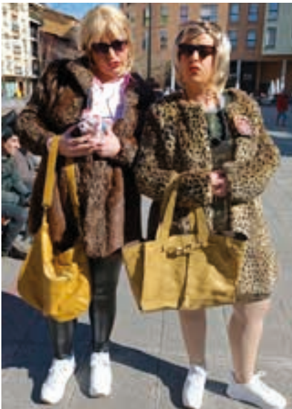
Zelai ahizpak! AIURRI