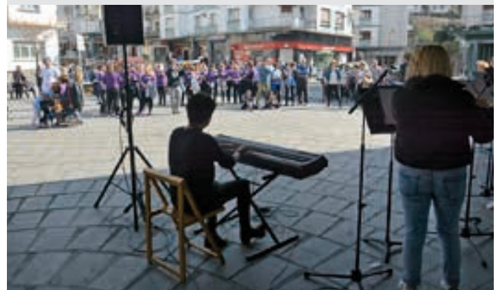
Bastero plaza. AIURRI

Aurkezpena Plaza Morea izena hartuko du aurrerantzean Bastero plazak. Goiz osoan zehar ekitaldi-sorta iragarri du Udalak, "Plaza gurea da" izenburupean.