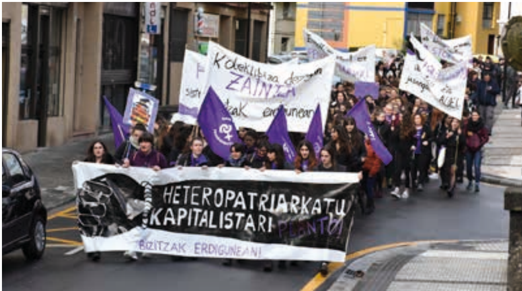
2019ko manifestazioa azken urteetako jendetsuena izan zen.

Transfeminismoari buruzko hitzaldia, Afrika Bibang eta Dudik P taldeen emanaldiak, Plaza morearen aurkezpen ekitaldia... martxoa ekitaldiz beterik dator. Feminismoa lehen lerroan jartzeko garaia da