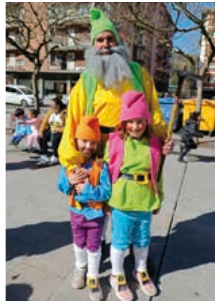
Kolare biziekin, ikusgarri zeuden. AIURRI