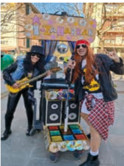
Ez dadila Rock and Rolla falta. AIURRI