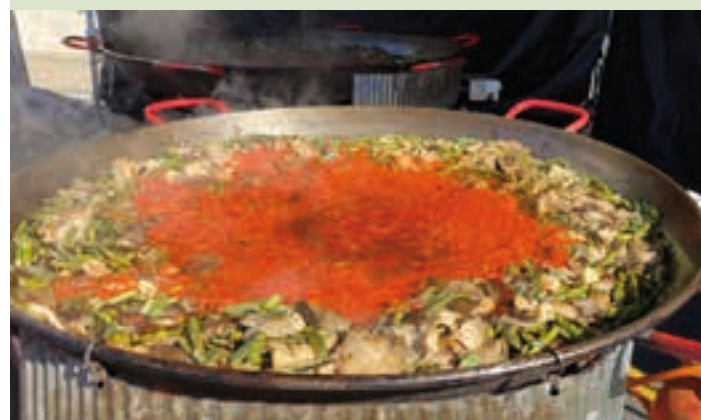
Barazki-paella, larunbatean eskaini zuten bazkaria. AIURRI

Otordua kalean Bat baino gehiago animatu zen etxeko bazkaria kalean sukaldatzera. Originaltasun osoz bazkaldu zuten zenbaitek lisatzeko oholtzaren gainean. Proposaturiko gaia margolanak izan arren, askotariko mozorroak ikusi ahal izan ziren.