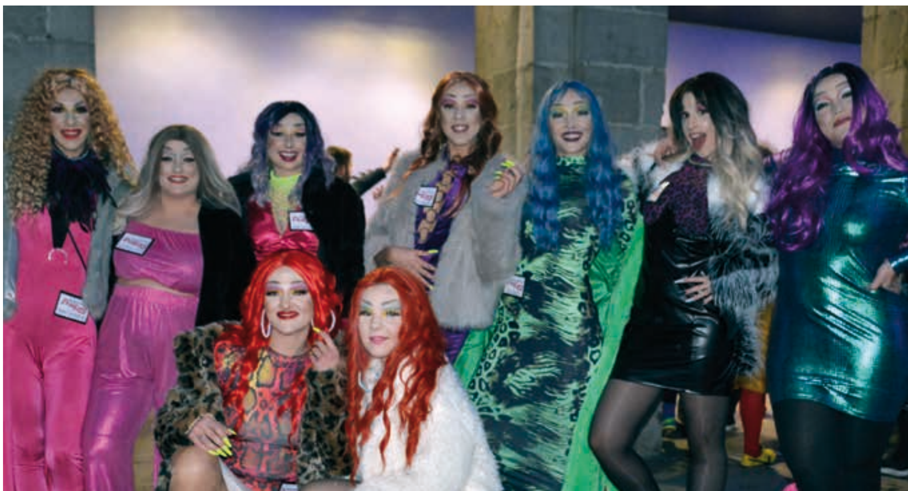
Pandemia aurretik gertatzen zen bezala, iluntze aldera jendetza elkartu zen Goikoplazan. AIURRI