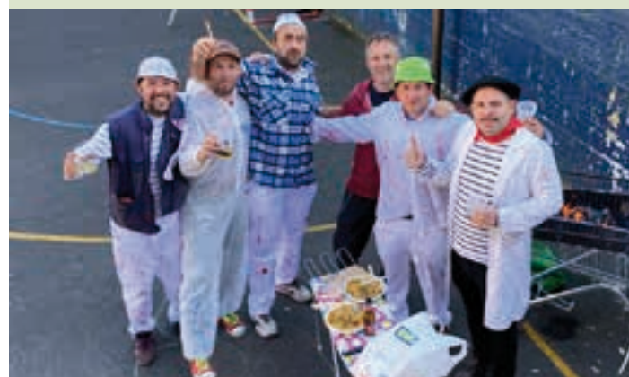
Umorea nagusi izan zen egun osoan. AIURRI

Otordua kalean Bat baino gehiago animatu zen etxeko bazkaria kalean sukaldatzera. Originaltasun osoz bazkaldu zuten zenbaitek lisatzeko oholtzaren gainean. Proposaturiko gaia margolanak izan arren, askotariko mozorroak ikusi ahal izan ziren.