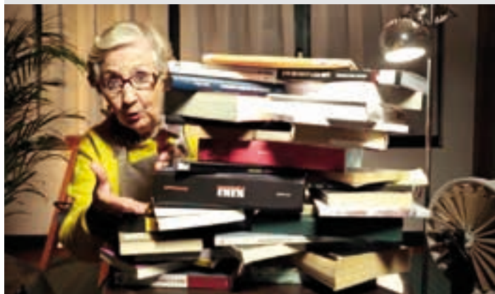
Estereotipoei buruzko ikus-entzunezkoa. FABRICANDO MUJERES

Ikus-entzunezkoa "Fabricando mujeres". Honela dio sinopsiak: Maitek bere lantegian espazio subertsibo bat sortu du emakume-ereduaren estereotipoei aurre egin ahal izateko". Martxoak 4, ostirala. 18:00, Sarobe. Gaztelania.