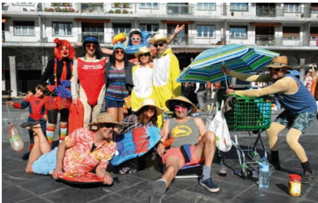
Zerura begira jarri eta eguzkia nagusi zen. Plazara gerturatu eta hantxe zeuden lehen udatiarrak. AIURRI