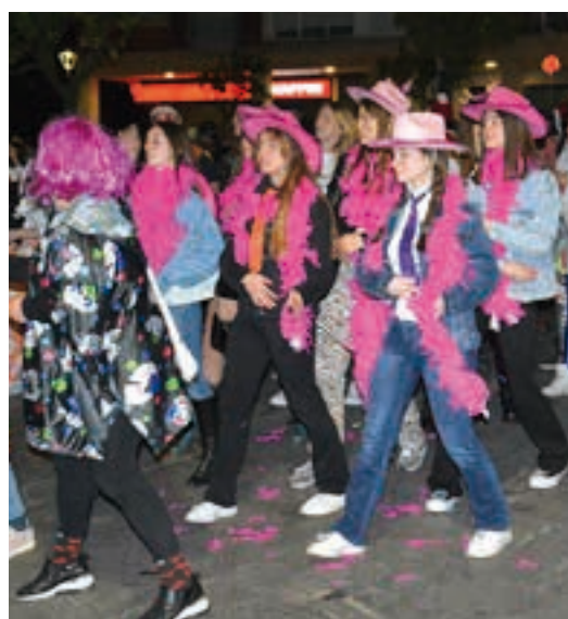
Koadrila ugari zebiltzan kalean, larunbatean. AIURRI