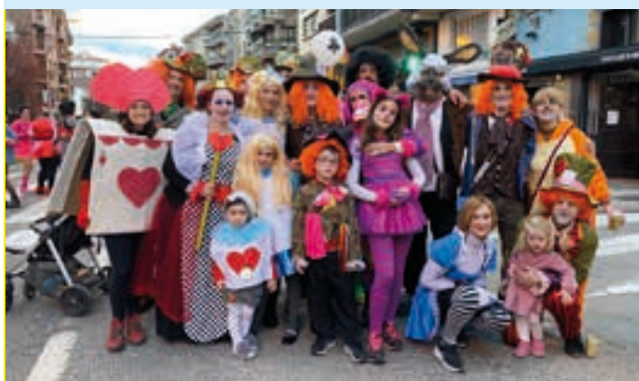
Idiazabal kalea, tarteka bada ere, oinezkoentzat bilakatzen da. AIURRI

Plazaz plaza Eguerdia partean, karroza musikatua izan zen San Juan plazan, eta dantza ikusgarriak egin zituzten egipziarrez mozorrotuta. Dantza saio gehiago eskaini zituzten herrian zehar. Eguraldia lagun izan zuten egun osoan.