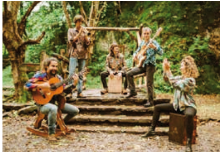
Kilimak taldea. KILIMAK

Pin lantegia eta liburu irakurketa. 17:00, Ludoteka.