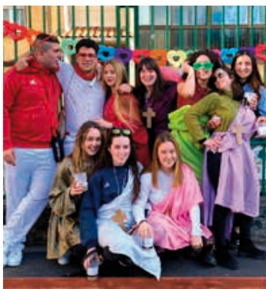
Inauteri festako argazki gehiago ikusgai daude aiurri.eus webgunean. AIURRI