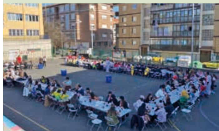
Aspaldiko partez herri bazkaria egin zen Egape ikastolan.

Paella-jatea I love paella cateringarekin antolatu zuen herri-bazkaria Poxta Zahar gazte koadrilen elkarteak. Barazkidun arrozaz gain, euskal pastela eta sorbetea dastatzeko aukera izan zuten.