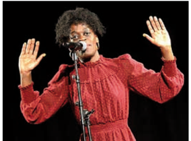
Afrika Bibang kantari euskalduna. CARLOS GARCÍA AZPIAZU

Kontzertua "Ispiluaren aurrean" disko berriena aurkeztera hurbilduko da Andoainera. Oraingoan soul eta rithm and blues doinuak uzartutz.