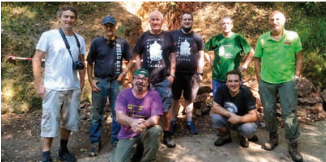
Burdina boluntarioak Ubaran bailaran, karobi bat berreskuratze-lanetan orain aurretik. BURDINA