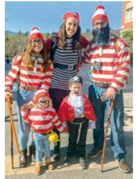
Familia ugari irten zen larunbatean. AIURRI