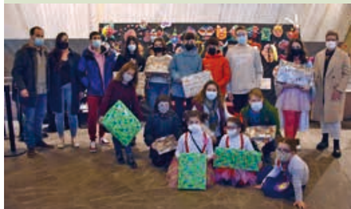
Sarituak, epaimahaikideak eta Udal ordezkariak.