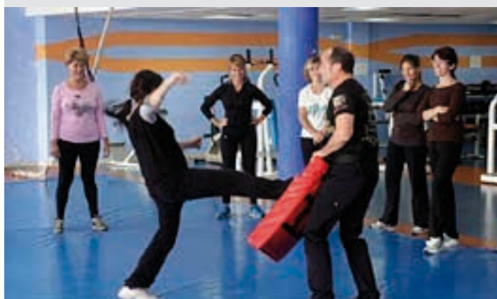
Autodefentsa ikastaroa ohikoa izan ohi da jabekuntza eskolatan. GOIENA

Ikus-entzunezkoa "Fabricando mujeres". Honela dio sinopsiak: Maitek bere lantegian espazio subertsibo bat sortu du emakume-ereduaren estereotipoei aurre egin ahal izateko". Martxoak 4, ostirala. 18:00, Sarobe. Gaztelania.