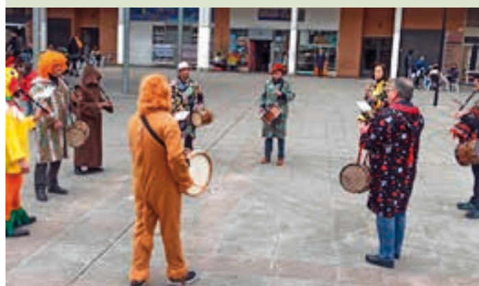
Txistulariak Zumea plazara hurbildu zirenekoa. AIURRI

Lebiton Goiz iragarri zuten, eta hala eta guztiz ere zaletu ugari hurbildu zen kalejirara. Andoaingo erraldoi eta buruhandien konpartsak giro ederra jarri zuen larunbat goizean. Talde handia bildu zuten, kalez kale Tolosako dultzaineroekin batera ibiltzeko.