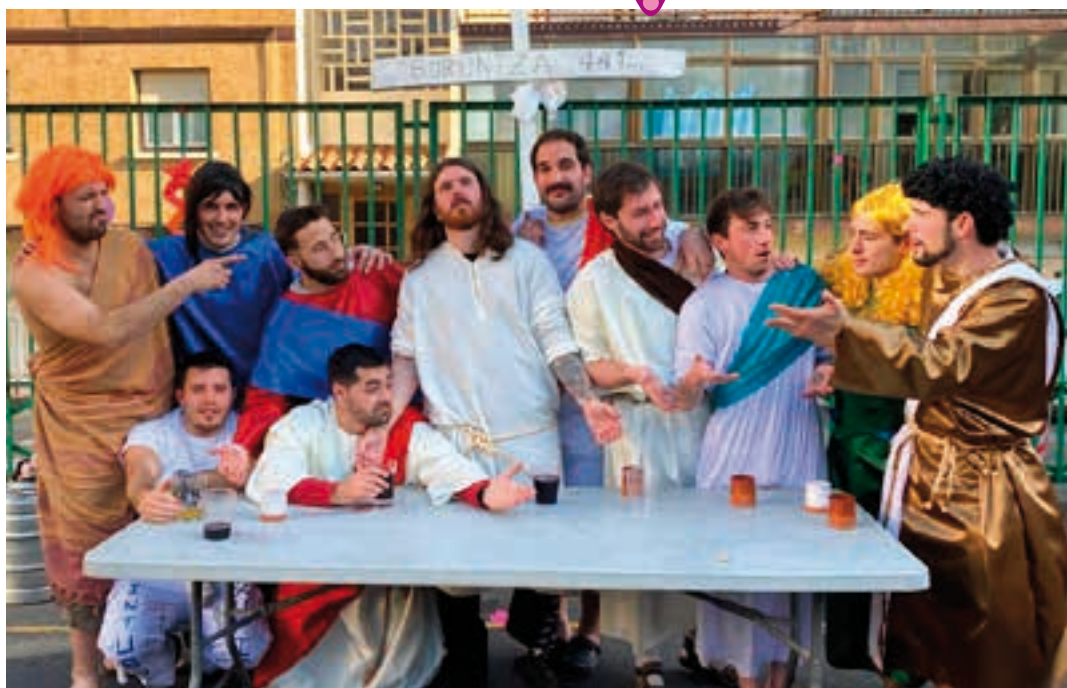
Azken afaria, Buruntza mendira begira. AIURRI

Ospakizunak plazaz plaza, kalez kale Herri bazkariaren ondoren, The Roristak taldea igo zen kamioi gainera. Hala, itzulia eman zion herriari, bertsiso ezagunak joz eta urnietarrak dantzan ipiniz.