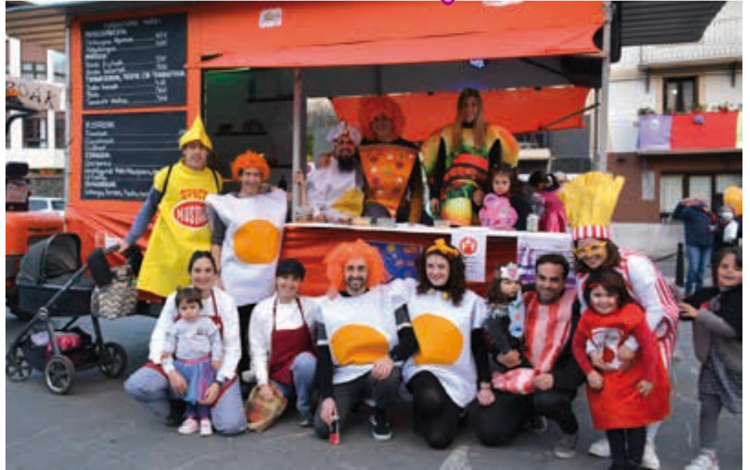
Poperoak taldea, familia giroan, karroza eta guzti irten zen kalera.

Kalea festazaleentzat Eguraldia ezinbesteko elementua izan zen inauteri festaren arrakastan. Eguraldi ona lagun izanda, ospakizunak kaleak egin ziren. Banaka, koadrillan edo talde handietan antolatuta, festazaleak ez ziren etxean geratu.