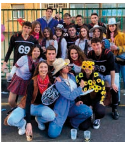
Adin ezberdinetako urnietarrak elkartu ziren herri bazkarian.