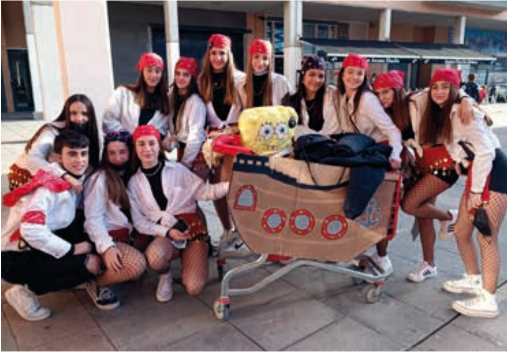
Gaztetxo taldea pirataz mozorrotuta irten zen. AIURRI