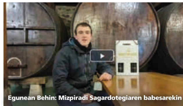
Egunean Behin: Mizpiradi Sagardotegiaren babesarekin