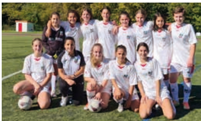
Infantil mailakoek berdinketa eskuratu zuten Luberriren aurkako partidari (2-2). AIURRI