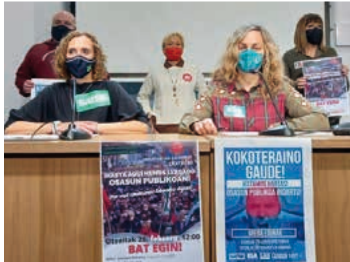
Sindikatuaren ordezkariak elkarrekin egin zuten agerraldia. ELA

Zailtasunak daude kategoria batzuetako langileak kontratatutako, baina Osasun Sailak azken urteetan hartutako erabaki politikoen ondorio dira: alde batetik, 50