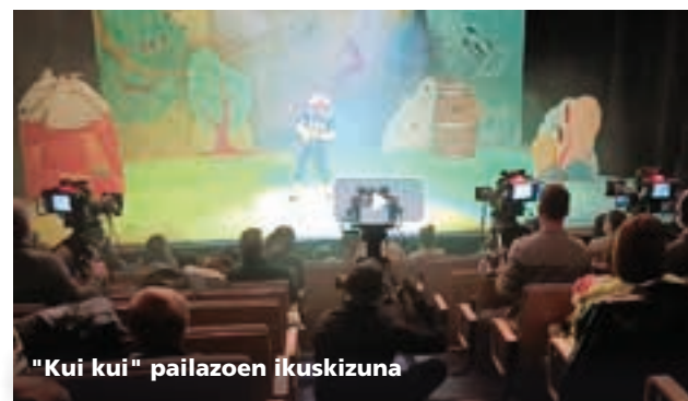
"Kui kui" pailazoen ikuskizuna