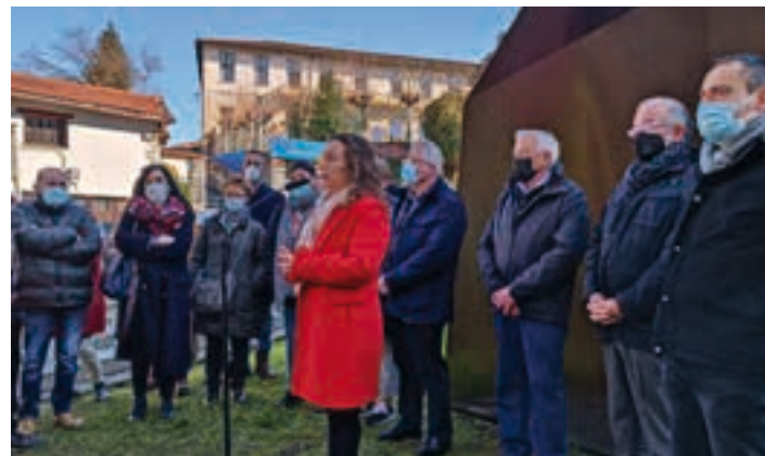
Astearteko omenaldia alderdi sozialistak antolatu zuen. AIURRI