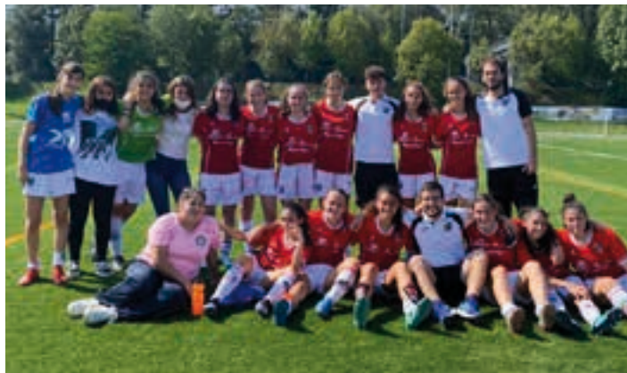
Kadete mailako neskek garaipena eskuratu zuten Intxaurdiren zelaian (0-4). UKE

Infantil mailako neskek ligaxkaren 11 jardunaldi jokatu dituzte, eta bigarren postuan sailkatuta daude. Aurreko asteburuan berdinketa lortu zuten, Antiguan (2-2). Igande honetan Goierri liderra jasoko dute etxean (11:30).