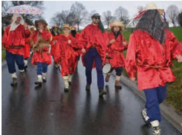
Puska biltzaileak artxiboko irudian.