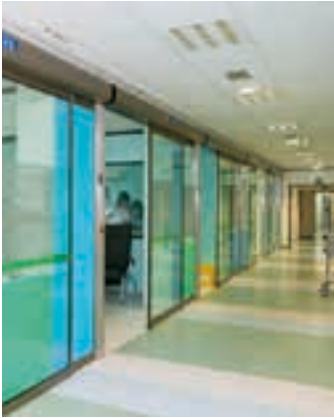
Osakidetzako instalakuntzak. IREKIA