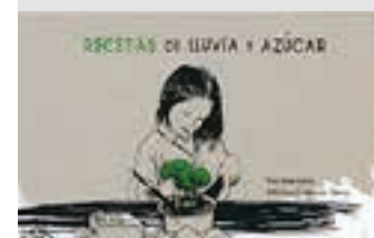
Liburua erdaraz dago, soilik.

"Esan zer sentitzen duzun" ibilbideko geltoki nagusia emozioen hiztegia da, Emoziotegia, zeinak berrogeita bi emozioen esanahia azaltzen baitu modu didaktiko, dibertigarri eta gozoan.