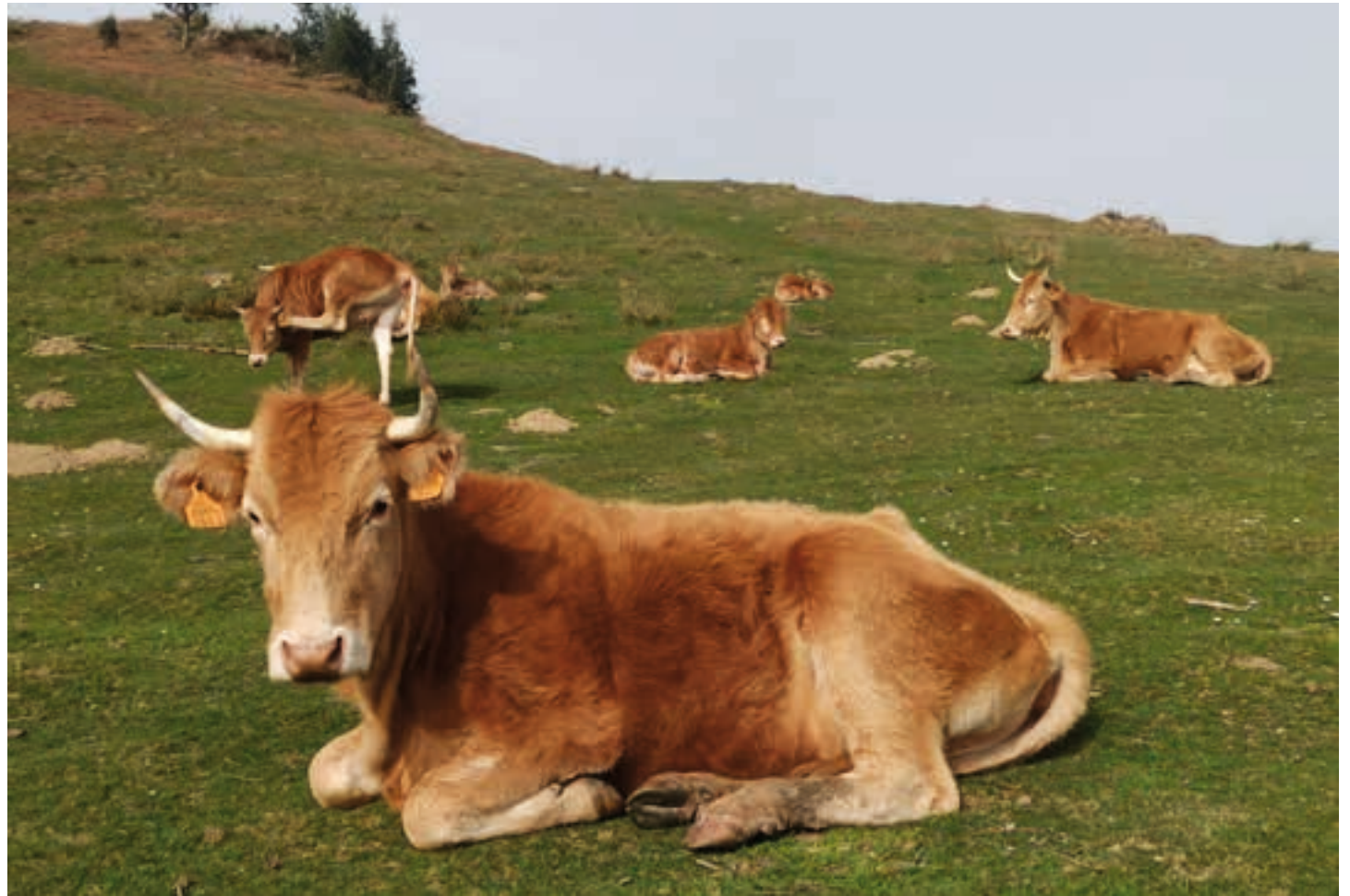
Betizuak larrean, Adarramendi eta Aballarri inguruan. AIURRI

Baina, ez orduan, ezta orain ere, politikatik ez dira gauzak ausardiaz aztertu eta informatu. Duela 21 urte ez zen argitu, adibidez, nahiz eta orduan ere legez kanpo egon animalien hondakinak abelgorrien gizenketan erabiltzea, pentsu etxeetan zergatik zen orokorra praktika hori. Ez zen azaldu gizenketa eredu horiek eta pentsu etxeek, kasu askotan, urte batzuk arinago Europako diru-laguntzen sostengua izan zutela. Ez zen azaldu horrelako "eskandalu" baten aurrean, ez politikak, ez justiziak, apenas ez zuela inor epaile baten aurrean jarri. Ez zen argitu -kuriostatez bada ere- Europako okelaren merkatuan, horrenbeste subentzionatutako abelgorri pila erretiratu ondoren, (milioika tona eta kanal erre ziren), merkatuan ez zela