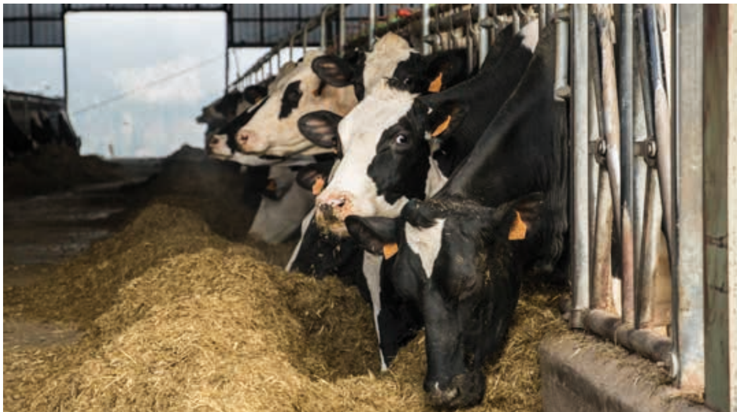
"Sei xentimo galtzen ari gara litroko gaur egun, eta eguneko 3.500 litro esne ekoizten ditugu, 34 bat litro behiko. Hori epe jakin batean jasan dezakezu, prezioak ere asko aldatzen direlako. Orain, ordea, erregaia, pentsua, argi indarra, dena garestitu da ikaragarri". AIURRI

eta esneak daude. Gu Kaiku kooperatibako kide gara, eta badakigu esne on bat ekoizten dela. Kanpotik ere esne asko ekartzen da, makro etxalde handietatik. Supermerkatura gure esnea iritsiko da, baina beste esne asko ere bai, eta denek izen bera dute: esnea. Supermerkaturaren prezio askoko esneak topatuko dituzu, baina zein erosi du jendeak? Merkeena. Guk merkeago ezin dugu ekoiztu. Sei xentimo galtzen ari gara litroko gaur egun, eta eguneko 3.500 litro esne ekoizten ditugu, 34 bat litro behiko. Hori epe jakin batean jasan dezakezu, prezioak ere asko aldatzen direlako. Orain, ordea, erregaia, pentsua, argi indarra, dena garestitu da ikaragarri.