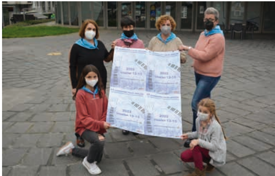
Aurkezpen ekitaldia egin zuten, aurreko ostiralean. AJURRI