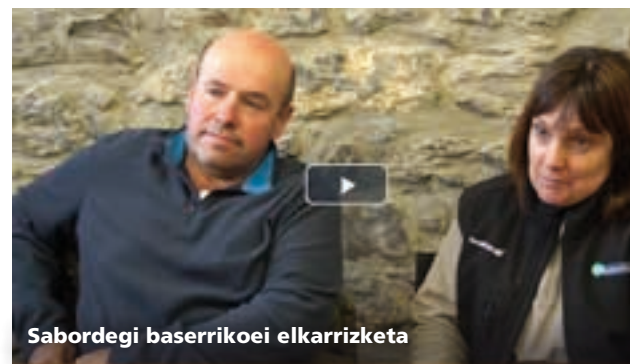
Sabordegi baserriko elkarriketa