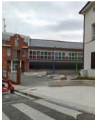
Espaloia zabaldu dute.

Babilonia eremua urbanizatzeko lanak medio, Garratzako errepidea eta Lizardi 1-3 aurreko aparkalekuak itxita egongo dira, datorren astelehenera bitarte. Bestalde, aste honetan, Arantzubiko biribilgunearen egoera hobetzeko asmoz asfaltatze lanak egiten aritu dira. Lanek iraun bitartean Erratzuko zubitik Arantzubiko biribilgunera doan errepidea moztuta egongo da. Azkenik, San Juan plazatik Lekaiaora doan espaloia zabaldu egin dute, eremu horretako irisgarritasuna hobetuz. Udalak adierazi duenez, "aurreko urteetako parte hartze prozesuetan herritarrek eskaturiko hobekuntzetako bat da".