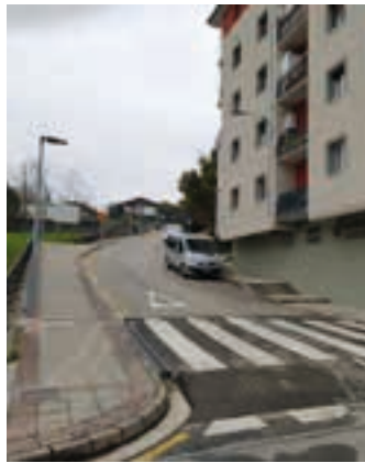
Asteburuan itxita izango da. UDALA

Idatzi honen bidez, auzoko bizilagunek, egoera jasangaitz honen aurreko kexa aurkezten dugu eta arazoari konponbide bat jartzea eskatzen dugu.