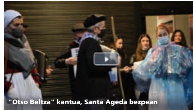
"Otso Beltza" kantua, Santa Ageda bezpean