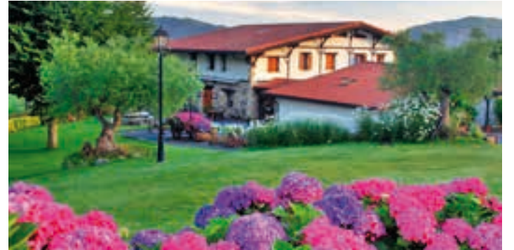
Txertota jatetxea Goiburun dago. TXERTOTA

Andoaingo Goiburu auzoan dagoen jatetxeak urteurrena gogoan hartu du, bezeroei esker-ona adieraztearekin batera