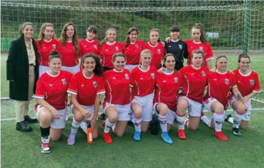
Senior mailakoek garaipena eskuratu zuten Mariñoren aurka (4-3).