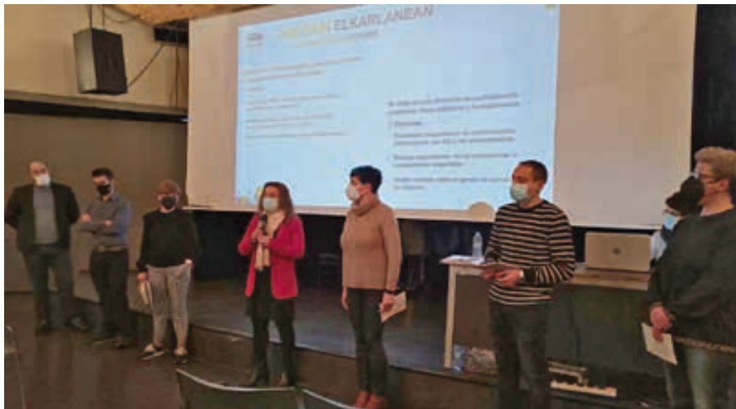
Gobernu taldeko kideak, bileraren hasieran.

"Andoain Elkarlanean" herritarren partaidetzarako dinamika asteartean abiatu zen, eta denera sei bilera antolatu ditu Andoaingo Udalak. Aste honetan hiru burutzekoak dira, eta datorren astean beste hiru gehiago