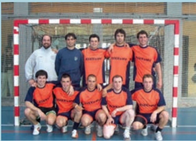
Xixkuin taldea finalera iritsi zen baina txapela jantzi gabe geratu zen. Sailkapen orokorra horrela geratu da, hurrenez hurren: 3. Xaguxarrak 4. Galpar-soro 5. Son moix 6. Kixka 7. Ixildutarrak 8. Ormendi 9. Txalaka 10. Isaran 11. Kattenazio 12. Aker.