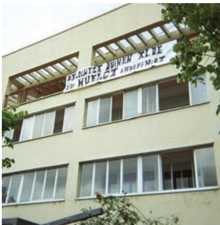
Alkatearekin tira-birak izan dituzte grebalariek pankartaren inguruan.