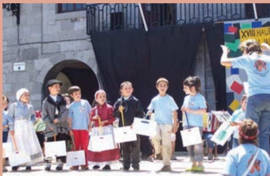
Soinuak Musika eskolako kideek kontzertu ikusgarria eskaini zuten.