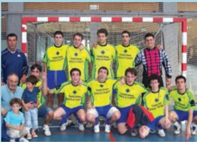
Ongi Etorri taldea, aurtengo txapelketa.