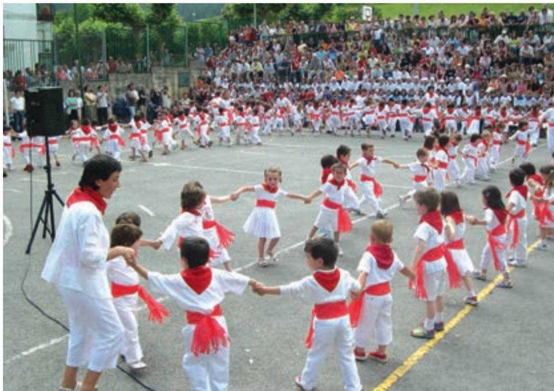
Urnietako ikasleak, ia ateratako argazkian.

Egapek Idiazabal kalean duen eraikinean ikasleen gurasoek eta ikasle ohiek indarrak