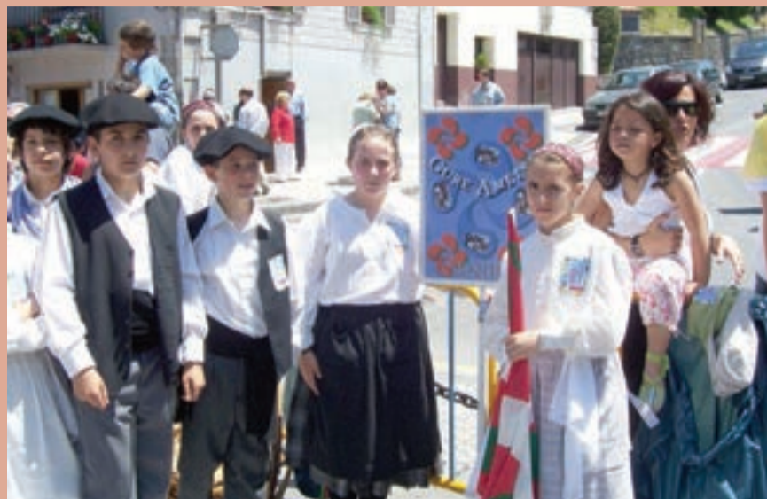
Urnietako Gure Ametsa dantza taldea, Goikoplazan ateratako