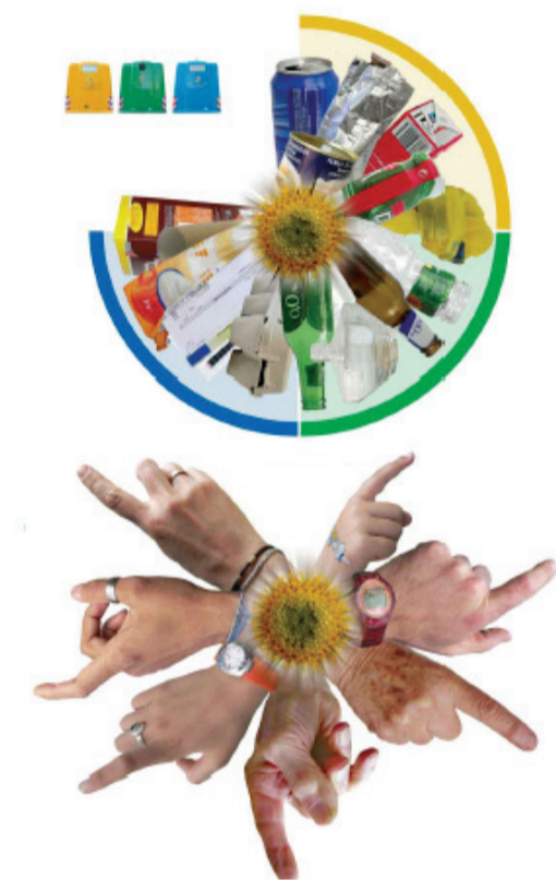
San Markoseko Mankomunitatearen kanpaina berria.

Herri edo eskualde mailako ikerketak ez dira oso ohikoak. Bada, bitxia bada ere, egun beretsuetan bigarren ikerketa soziologikoa abiaraziko da Urnietan. Aurreko ostegunean San Markoseko Mankomunitateak herritarrek birziklatzearekiko duten jarreraz galde egingo duela iragarri zuen, Donostian emandako prentsaurrekoan. Ekainaren 19an hasi eta 23ra bitarte, Gipuzkoako hamar herritan 3.437 inkesta egingo dituzte. Aukeratu dituzten herrien artean daude Hernani, Astigarraga, Lasarte-Oria, Usurbil, Donostia eta Urnietan. Besteak beste, edukiontzi bakoitzean utzi beharrekoaren ezagutzaz edota etxe bakoitzean nork banatzen duen zaborra