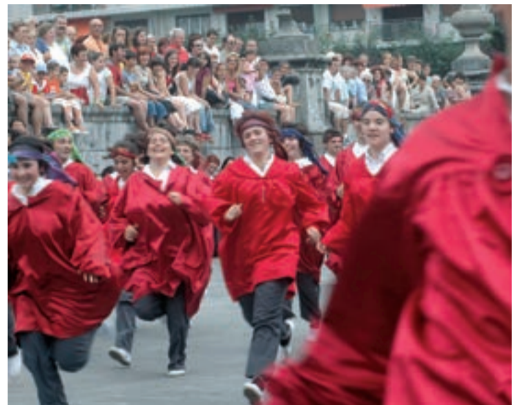
Axeri-dantza prestatzeko entseguak hasi dira.

Profesional mailako pilotariak ikusteko Arrate txiki geratuko da. Ekainaren 23an izango da 23:00etik aurrera. Biharamunean erremontea, zesta punta eta pala motza erakustaldia izango da, 16:30tan hasita. Ordubet beranduago Iñaki Perurena ha-