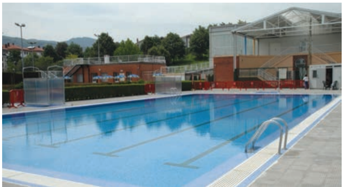
Datorren astetik aurrera zabalik izango da igerilekua.

Urnietako eta Andoaingo Udal kiroldegien ekimenez, hainbat ikastaro eskainiko da udan herri batean eta bestean. Dagoeneko informazio guztia kiroldegietan aurki daiteke. Aiurrik datorren astean argitaratuko ditu udako kirol eskaintzak.