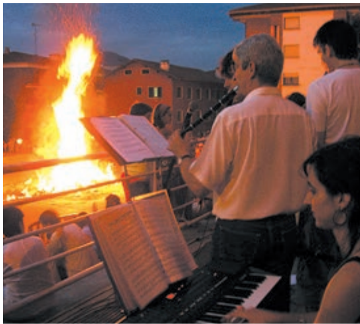
Gau magikoari euskal kantuekin ongi etorria emango diote parte hartzaileek.

Abestien inguruan, lehenik ere ekitaldiak antolatu izan dituzte antolatzaileek. Egapeko ikasleek duela bi urte kantu txapelketa batean esku hartu zuten. Handik gutxira jendea euskal girora hurbiltzeko kantu afaria antolatzea otu eta hortik, San Juan bezperako ekimena abian jartzeko ideia bururatu zitzairen. Hala, Udalarekin eta Presentacion de