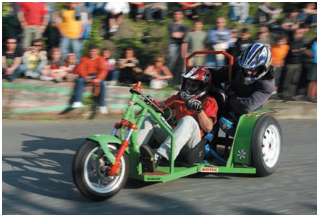
Andoaingo Santakruzetan egindako jaitsiera ikusgarria izan zen. Urnietakoa ez da gutxigorako izango.

Helburu horrekin edota ondo pasatzeko asmoz, gazte ugari emango dute izena larunbat honetan Urnietako Euskal Jaietan izango den goitibehera saioan. Bidegurutzeta eta Zabaleta auzoen artean jokatuko da. Kilometro bete pasatzeko ibilbidea zeharkatu beharko dute. Urnie-