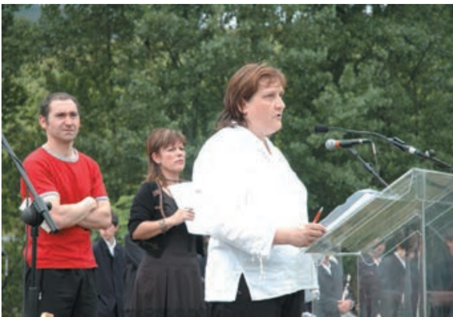
Oroituz taldeko bozeramaleak, oroimen historikoa berreskuratzeko eragileak.