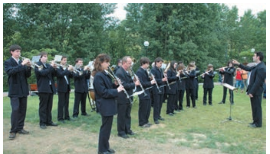
Txistulariek eta Musika Bandak emozio gehiago eman zioten ekitaldiari.