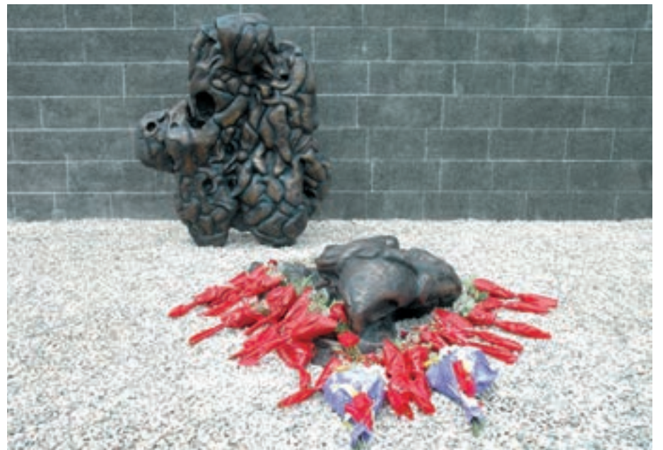
Eskultura fusilatuen senideek eskainitako lehen loreekin apaindua. Hunkigarria izan zen ekitaldia.