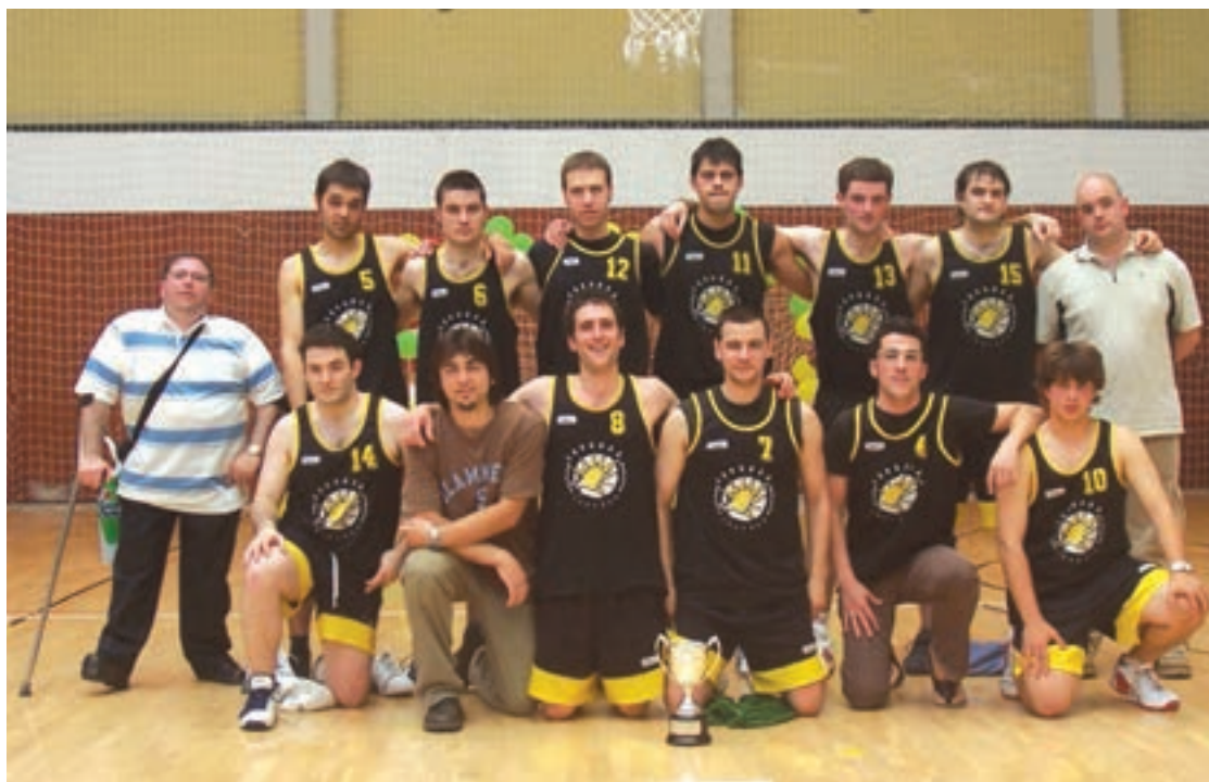
Kopuruz txikia izanik ere, bertute ugari dituela erakutsi zuen saskibaloitako taldeak. Bestela ezin ulertu lortu duten emaitza bikaina.

Marka da gero Andoangoek lortu dutena. Hamabi fitxara ez da iristen senior mailako taldea eta ligaskan hirugarren postuan sailkatu zen. Jokalari horiekin aurkeztu ziren aurreko asteburuan Intxaurren kiroldegian Final-four delakoa jokatzera. Lau hautagai eta saria bakarrarentzat. Eta ez nolana hikoia, estatuko erkidego ezberdinetan aritzea zegoen joan. Easo izan zen denboral-