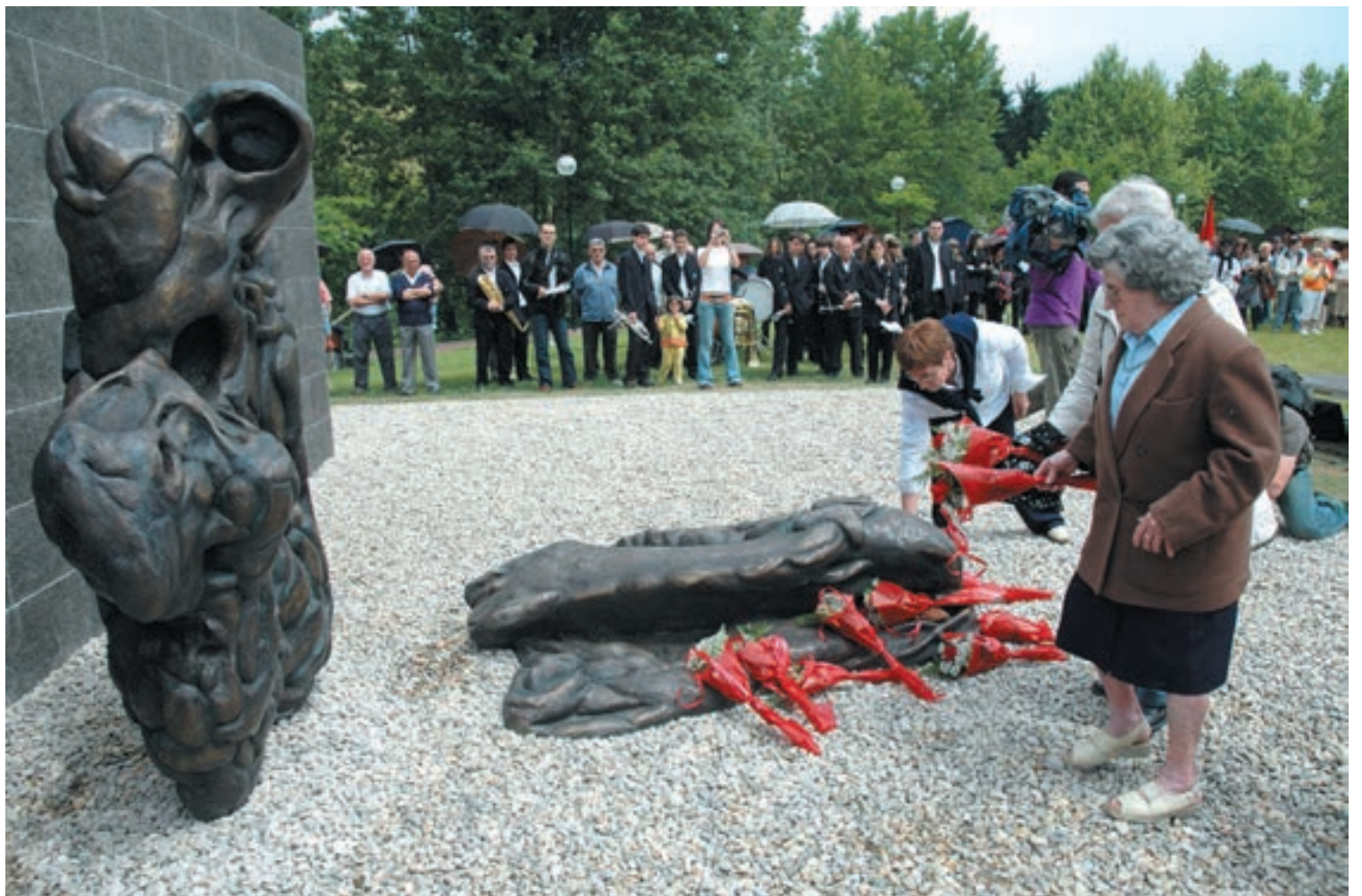
Aspaldi merezitako loreak errepublikazaleen omenez. Alfaro parkean, Etxeberrietako eremu berrian dago 36ko gerran fusilatu zituzten herritarren aldeko eskultura.

Fusilaketak, erbestea, frontea..., gure aurreko belaunaldiak gertutik bizi izan zuten gerra batek eragiten dituen ondorio latzak. Eta, hain zuzen, eraildako, erbesteratutako edota baztertutako horiek gure abizenak dituzte. 2002 urtean hausnarketa horri helduz, fusilatuen senitartekoeak eta oroi-men historikoa berreskuratzeko interesa zuten herritar taldeak Oroituz taldea sortu zuten. Lan isila, xumea egin dute. Eta eraginkorra. Haiek izan dira iraga-