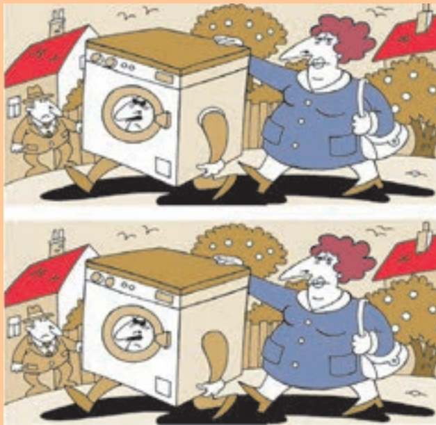
6 alde daude marrazki 2 hauen artean