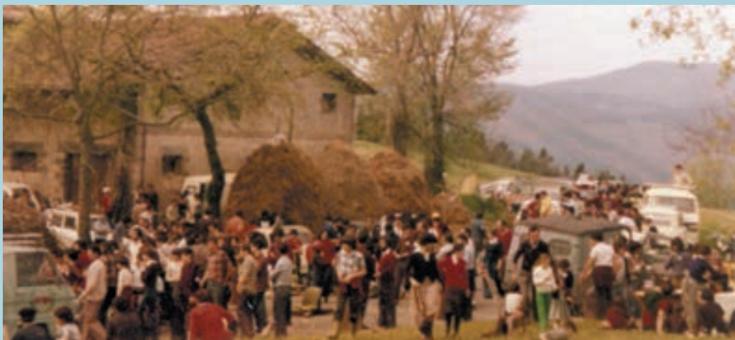
Ehunka ikusle hurbiltzen zen orain hamarkada batzuk Goitibehera proba ikustera.