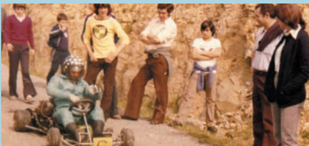
Ordutik hona goitibeherak egiteko teknika guztiz aldatu da.