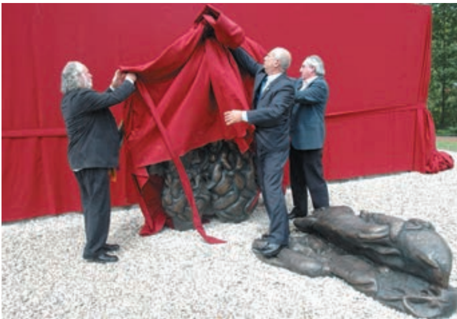
Etxeberria eskultura jendarteari erakusteko unean, Gabarain eta Arregi laguntzaile dituela.