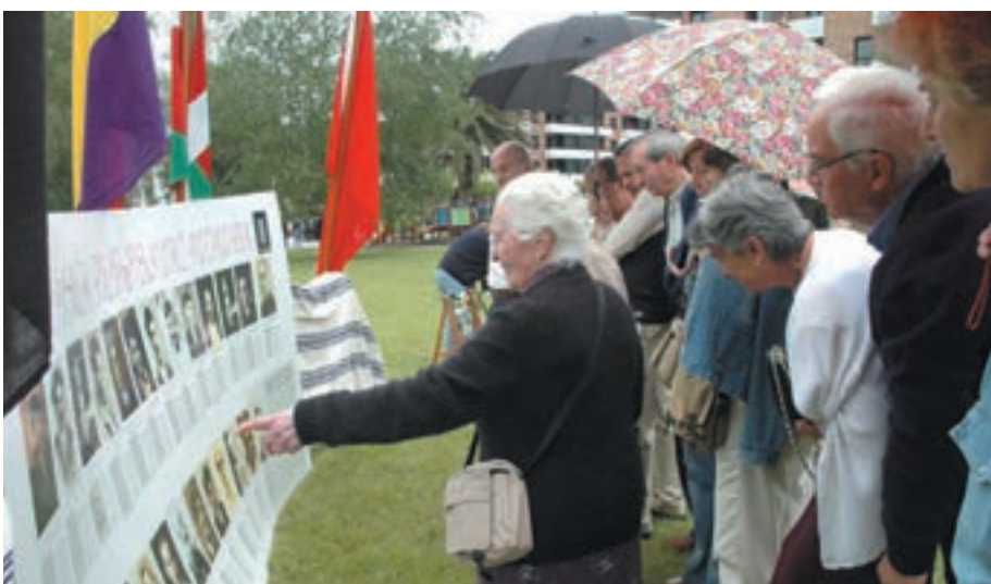
Omenaldira gerturatu ziren herritarrak eta senideak, fusilatu zituztenen argazkiei begira.