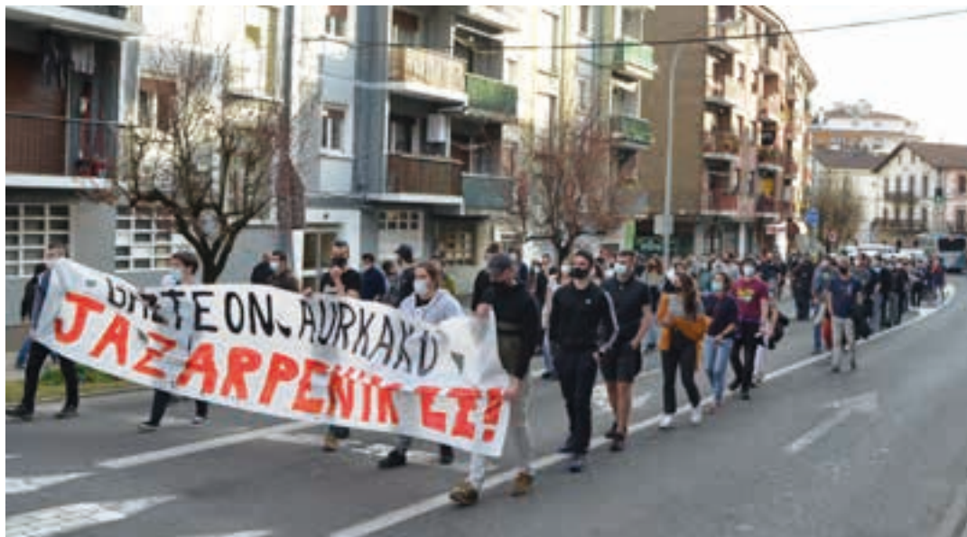
Idiazabal kalean geldialdia egin zuten, astebete lehenagoko gertaerak salatzeko. AIURRI