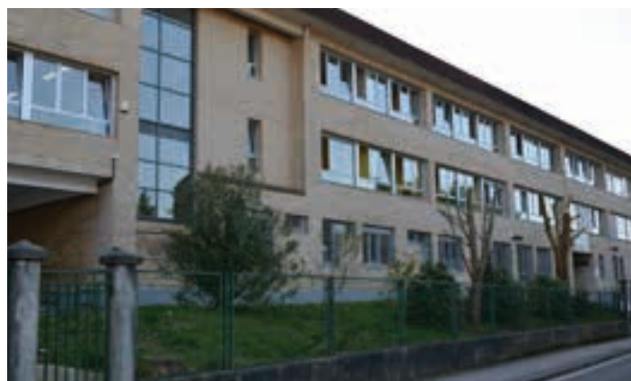
Leizaran institutua. AIURRI

doago jokatzeko hasi zen eta partida berdintzea lortu zuten. Norgehiagoka bananduta amaitu zen, eta talde bakoitzak puntu bana etxeratu zuen. Partida ikusita, emaitza gazi-gozoa andoaindarrentzat.