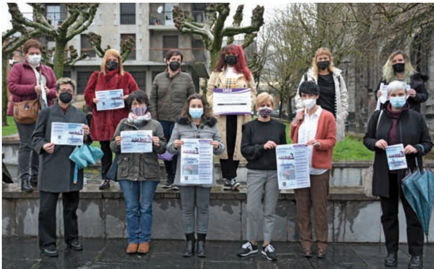
Udal ordezkariak, langileak eta emakumeen talde ezberdinetako ordezkariak elkartu ziren aurtengo egitarauaren aurkezpen ekitaldian. AIURRI