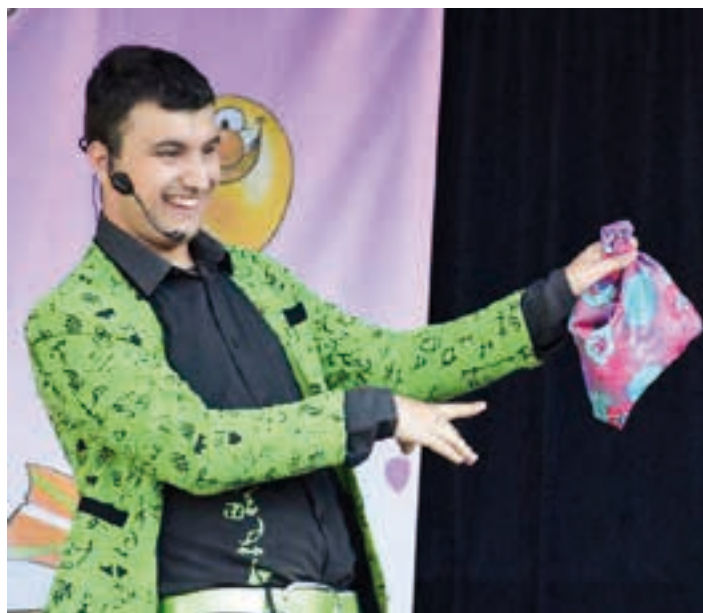
Hodei magoa.