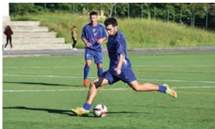
Euskaldunako partida, artxiboko irudian. AIURRI