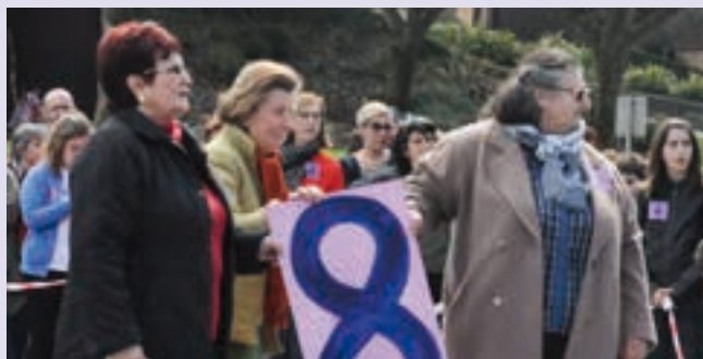
2012. urtean egin zen lehen edizioa. AIURRI

2012an abian jarri zen, zortzi edo larogei edo zortzirehun emakumeren lanari aitortza egiteko. Egunerokoan eredu diren herrikideak txalotzea izan zen hasierako asmoa, eta gerotik izpiritu horri eutsi diote. Ez ohikoa bada ere, aurtengoan ez dute hutsik egin nahi eta Bastero Kulturguneko auditorioan ekitaldia prestatzen ari dira. Hilaren 6an izango da.