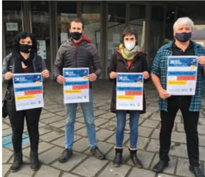
Babesa agertu duen herritar taldea, afitxa eskuetan.