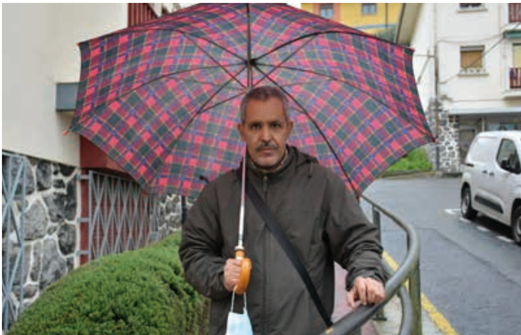
Sabaut 2015az geroztik familiarekin bizi da, Andoainen. AIURRI