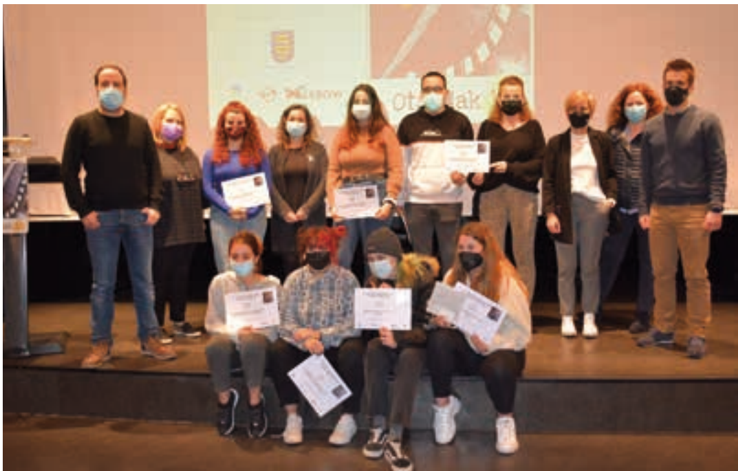
Saritutako hiru laburmetriak andoaindarrareuskaraz.eus webgunean ikusgai izango dira, laster. AIURRI