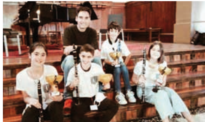
Saria jaso osteko poza antzematen zaie, aurpegietan. MIKEL EMEZABAL