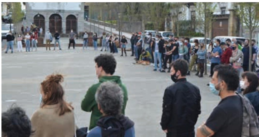
Deitzaileek prestatu zuten adierazpena irakurri zuten ekitaldiaren amaiera aldera. AIURRI

horretan bertan, tabernak itxi ostean, baina etxeratze-ordua baino lehen, Ertzaintza agertu zenean. Hasierako leku berean eman zioten amaiera mobilizazioari. Bukatzeko, irakurketa egin zuten, asteburuko istiluak argitu ez ezik, bai Urnietan, bai beste hainbat herritan, Ertzaintzak izandako jarrera oldarkorra ere salatzen asmoz.