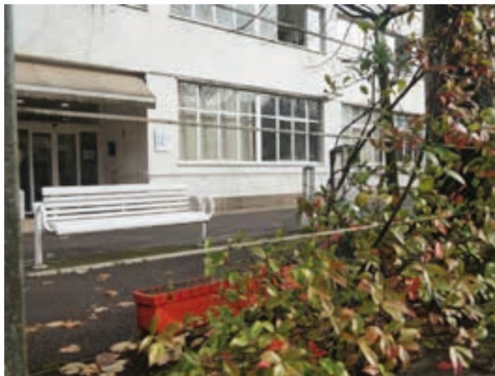
San Juan Bataiatzailea adinekoen egoitza, Ama Kandida etorbidean. AIURRI

Erabat aldatu da. Egoitza berantolatu behar izan dugu, goitik behera. Moduloka lana egin behar izan genuen, eta oraindik horrela jarraitzen dugu. Denontzat egoera berria izan denez, protokolo berri ugari aplikatu behar izan ditugu. Egoera hain aldakorra izanik, protokoloak ere aldatuz joan dira. Beraz, denbora honetan antola-