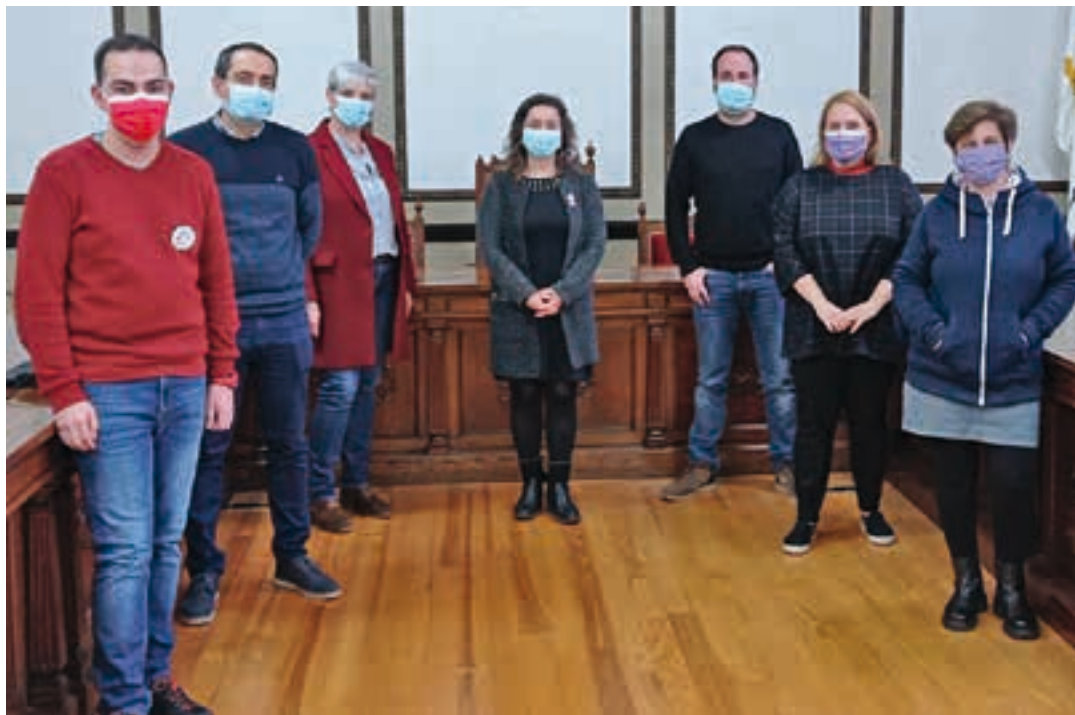
Ipar Haizeako kideak eta ordezkariak duten alderdi politikoetako bozeramaileak, sinadura ekitaldian.

"Andoingo Ituna" sinadura-ekitaldia egin zuten aurreko ostegunean, Ipar Haizea ekimenak eta ordezkariak duten alderdi politiko guztietako ordezkariak. Eskualdeko Mankomunitatearekin batera, helburu nagusia gaikako bilketan sakontzea da